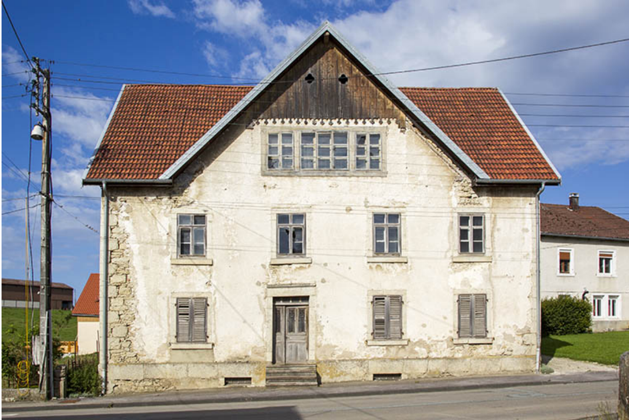
Une maison de la deuxième moitié du 19e siècle (1873) et son atelier d'horlogerie : maison Pillot puis Fierobe (48 Grande Rue). 25, Charquemont, 48 Grande Rue