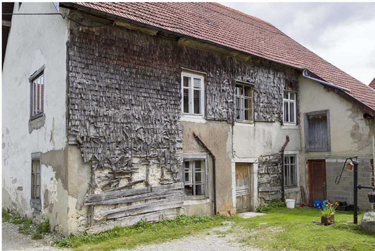
Façade postérieure, de trois quarts gauche.