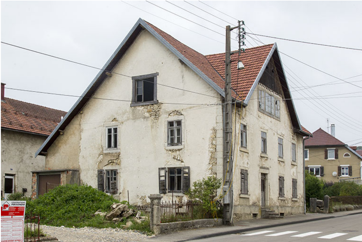
Vue d'ensemble, depuis le sud (façades antérieure et latérale gauche). 25, Charquemont, 48 Grande Rue