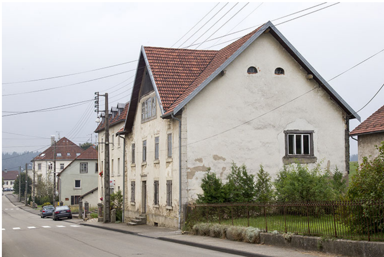
Vue d'ensemble, depuis le nord (façades antérieure et latérale droite). 25, Charquemont, 48 Grande Rue