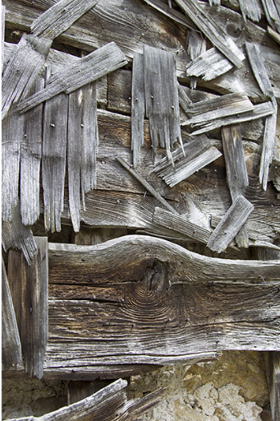
Façade postérieure : support de l'essentage de tavaillons, avec quelques tavaillons. 25, Charquemont, 48 Grande Rue