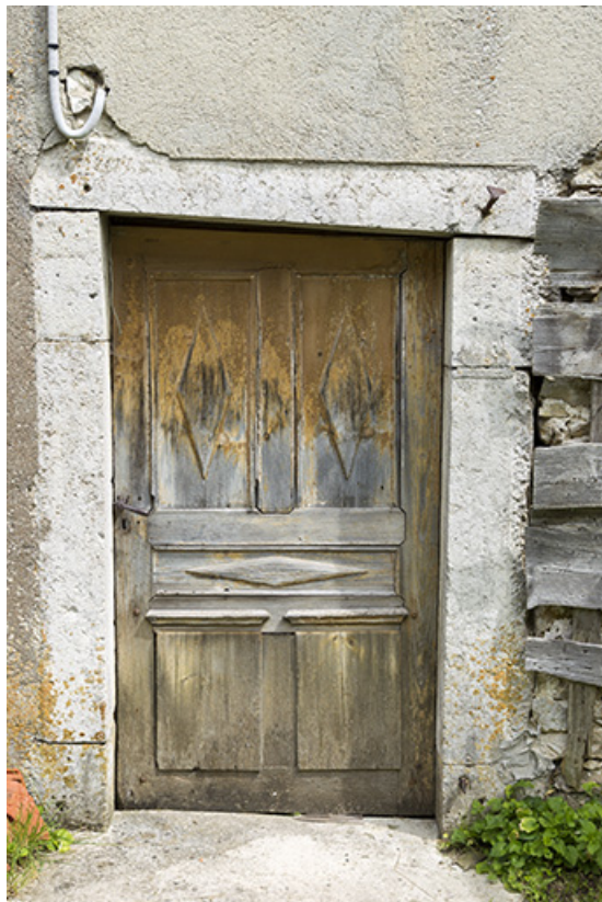
Façade postérieure : porte.