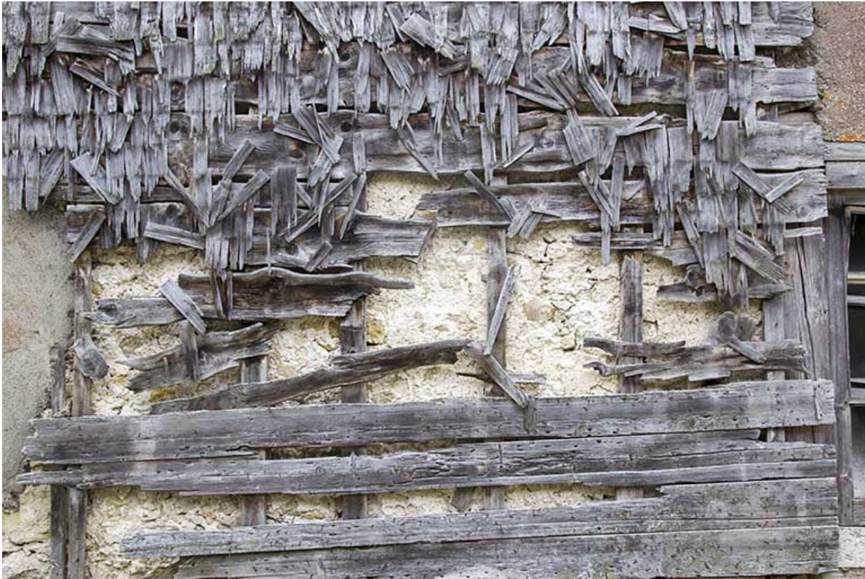
Façade postérieure : vestiges de l'essentage de tavaillons.