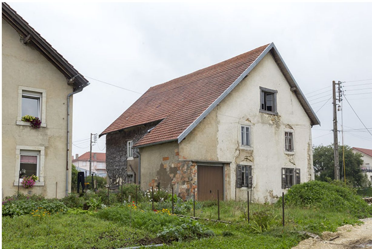
Façade latérale gauche.