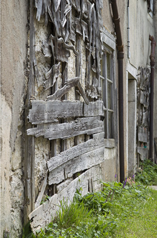
Façade postérieure : support de l'essentage de tavaillons, vu en enfilade. 25, Charquemont, 48 Grande Rue