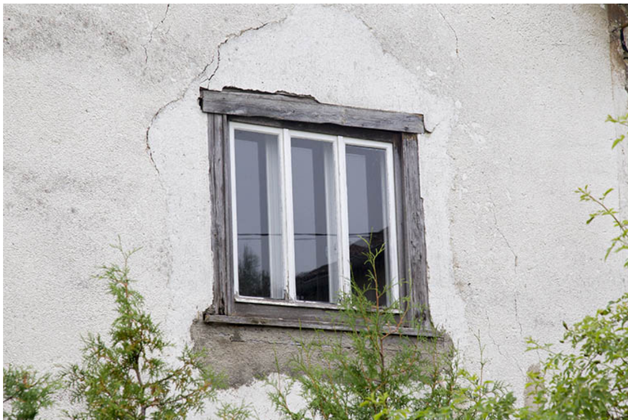
Façade latérale droite : fenêtre à encadrement en bois.