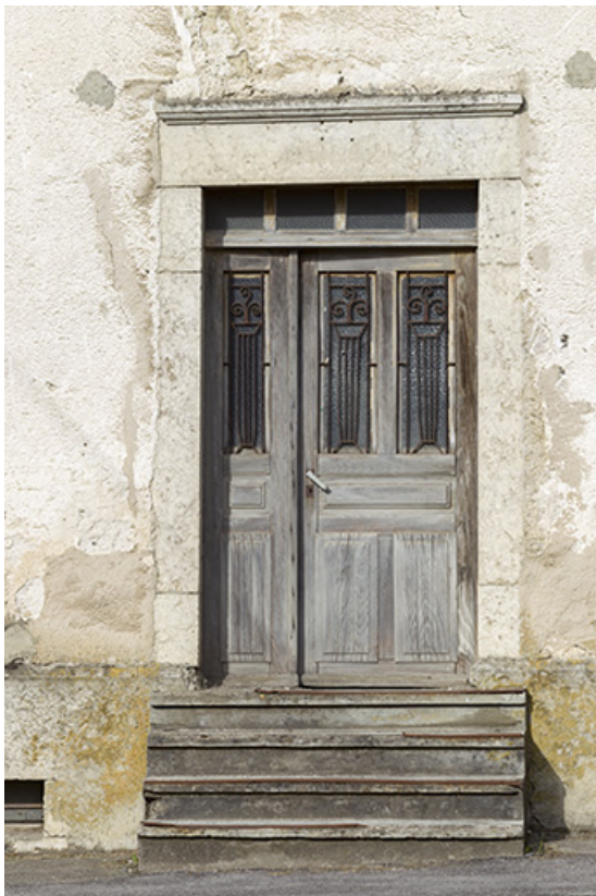
Façade antérieure : porte.