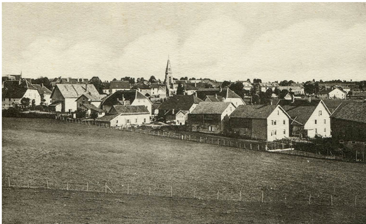
17 Charquemont - Vue générale [le quartier de l'église et le bas du village vus du sud], milieu 20e siècle. Arrière du bâtiment. 25, Charquemont, 48 Grande Rue

17 Charquemont - Vue générale [le quartier de l'église et le bas du village vus du sud], carte postale, s.n., s.d. [milieu 20e siècle], Cie des Arts photomécaniques (CAP) éd. à Strasbourg - Schiltigheim