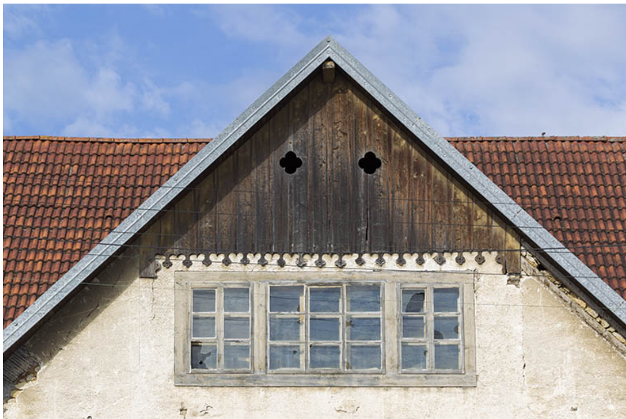
Façade antérieure : pignon.