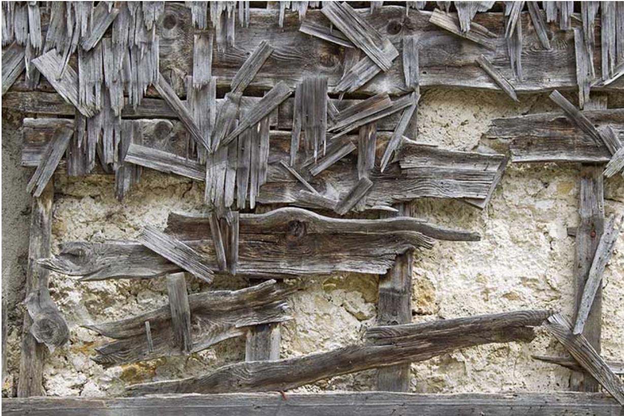
Façade postérieure : vestiges de l'essentage de tavillons.