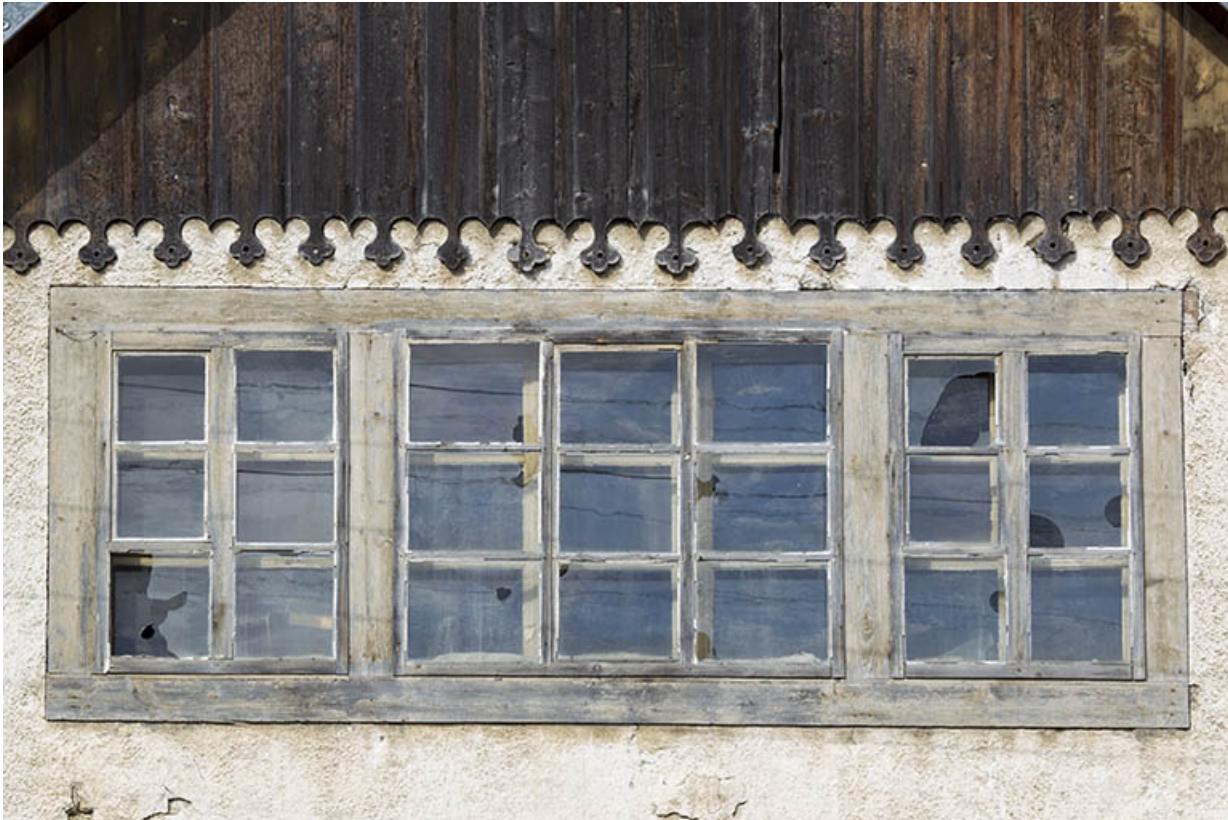
Façade antérieure : fenêtres multiples sur le pignon.