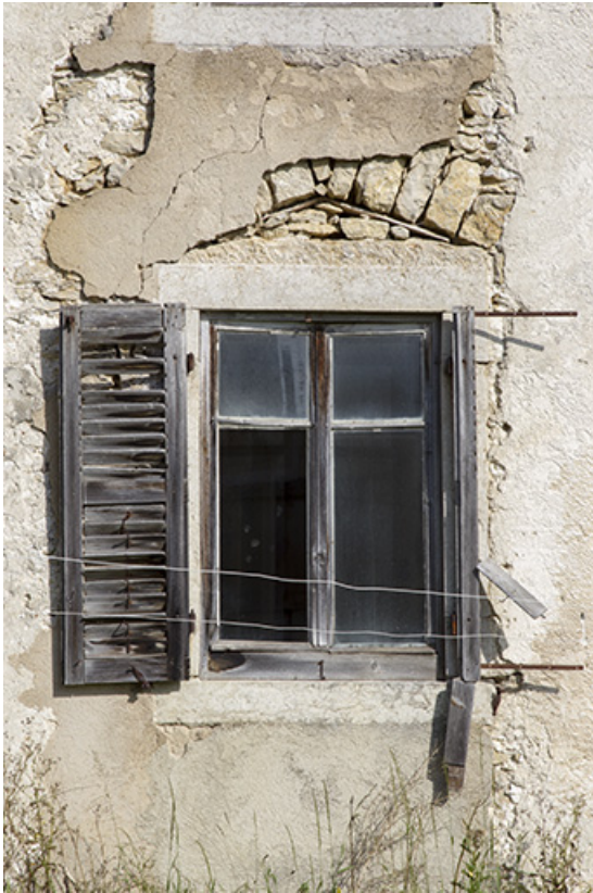
Façade latérale gauche : fenêtre surmontée d'un arc de décharge. 25, Charquemont, 48 Grande Rue