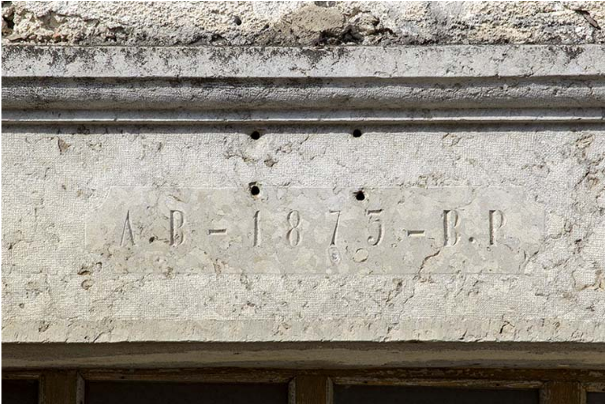
Façade antérieure : date et initiales sur le linteau de la porte.