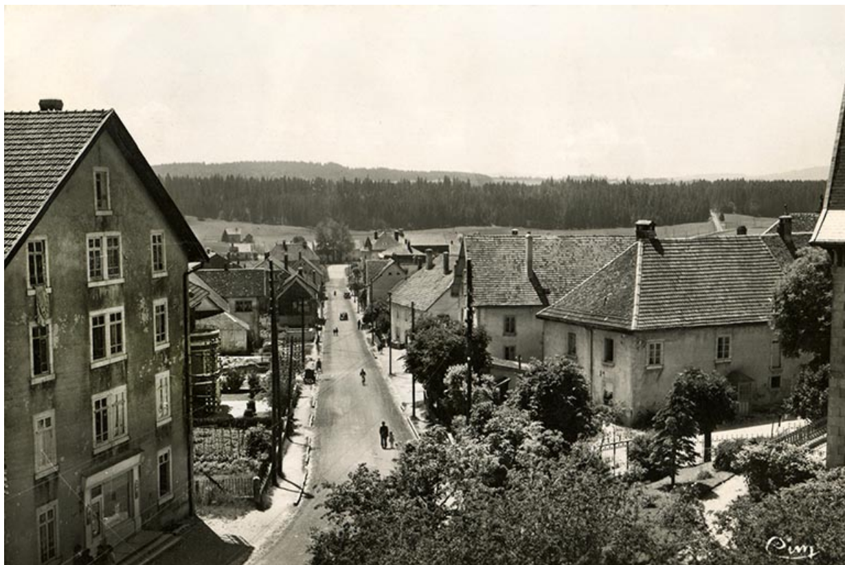
Charquemont (Doubs) - Grande Rue [le bas du village depuis la place de l'Hôtel de Ville], 2e quart 20e siècle (avant 1952). 25, Charquemont, 30 Grande Rue