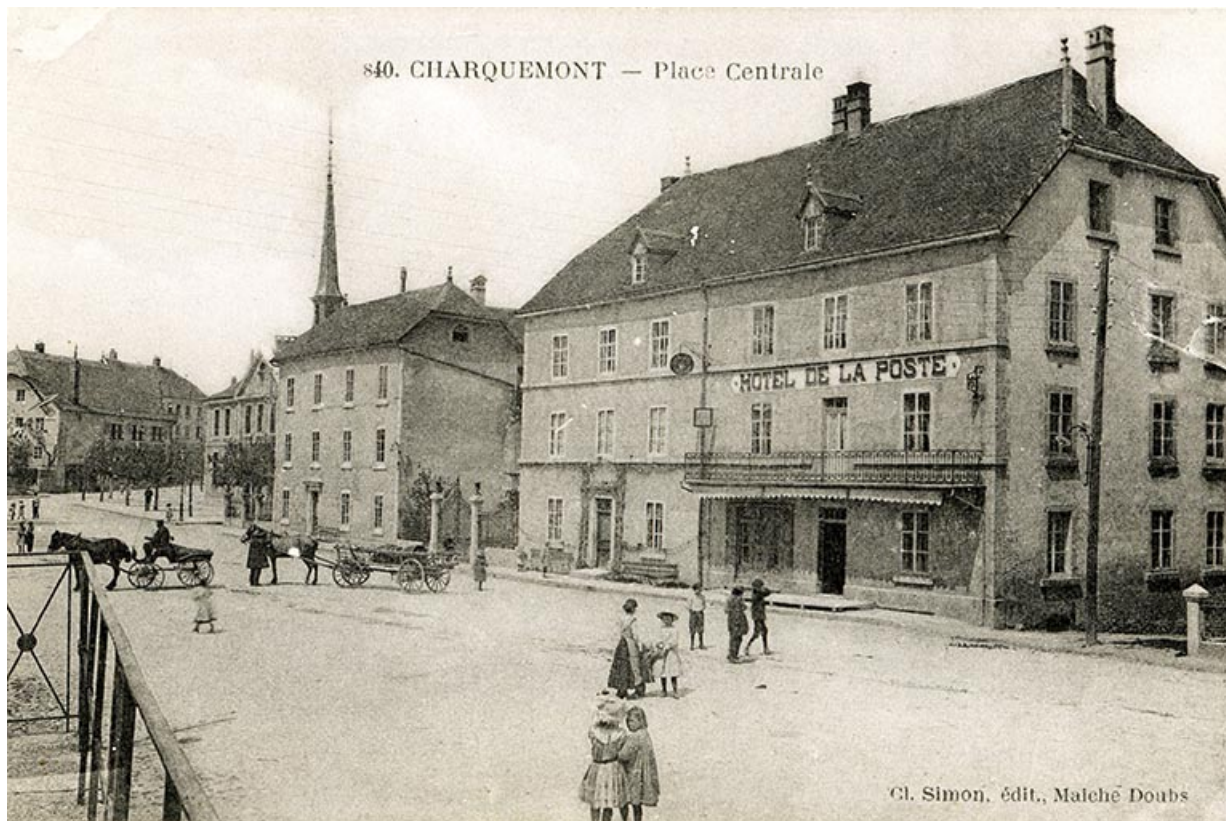
840. Charquemont - Place centrale [vue d'ensemble, de trois quarts droite], 1er quart 20e siècle. 25, Charquemont, 5 et 6 place de l' Hôtel de Ville