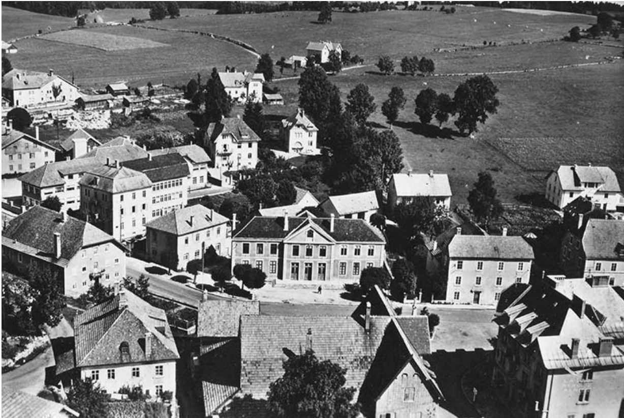
En avion au-dessus de... 2. Charquemont (Doubs) [le quartier de la mairie vu du sud], années 1960 ? 25, Charquemont, 6 rue Cuvier