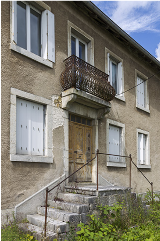
Façade antérieure : travées centrale et perron, vus en enfilade.