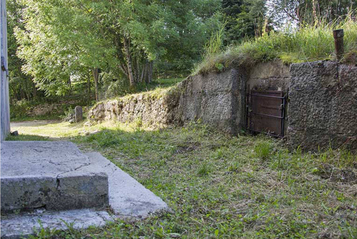
Citerne près de la façade postérieure.