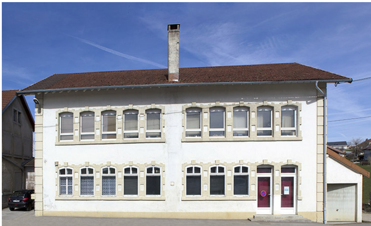
Une usine du début du 20e siècle (vers 1900-1902) : usine de montres et de roues de cylindre puis d'ancre Walcker (11 rue de l'Eglise).