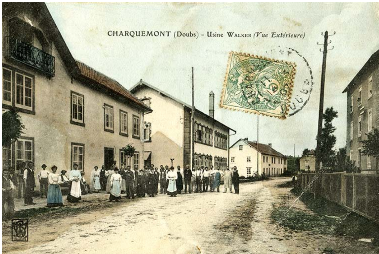
Charquemont (Doubs) - Usine Walker (vue extérieure), entre 1904 et 1907. La future usine Wasner occupe le premier plan à gauche. 25, Charquemont, 11 rue de l' Eglise