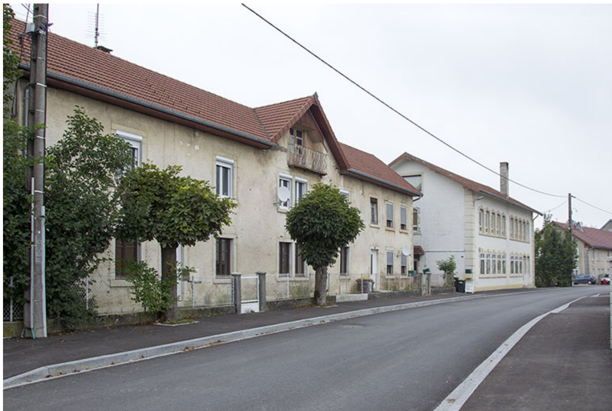
Vue d'ensemble, depuis le sud (façade antérieure).