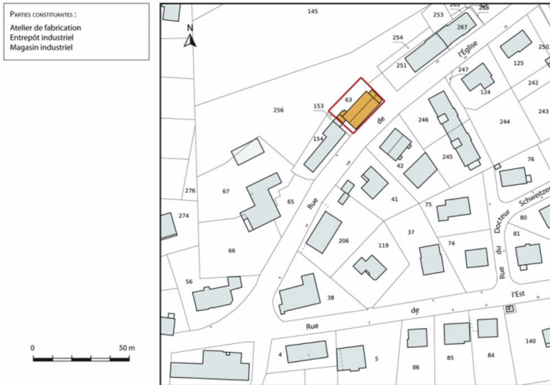
Plan-masse et de situation. Extrait du plan cadastral, 2015, section AD. 25, Charquemont, 11 rue de l' Eglise