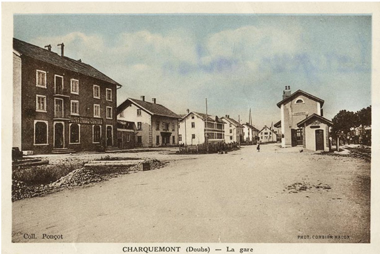
Charquemont (Doubs) - La Gare [vue d'ensemble de la rue de la Gare], 2e quart 20e siècle 25, Charquemont, 11 rue de la Gare