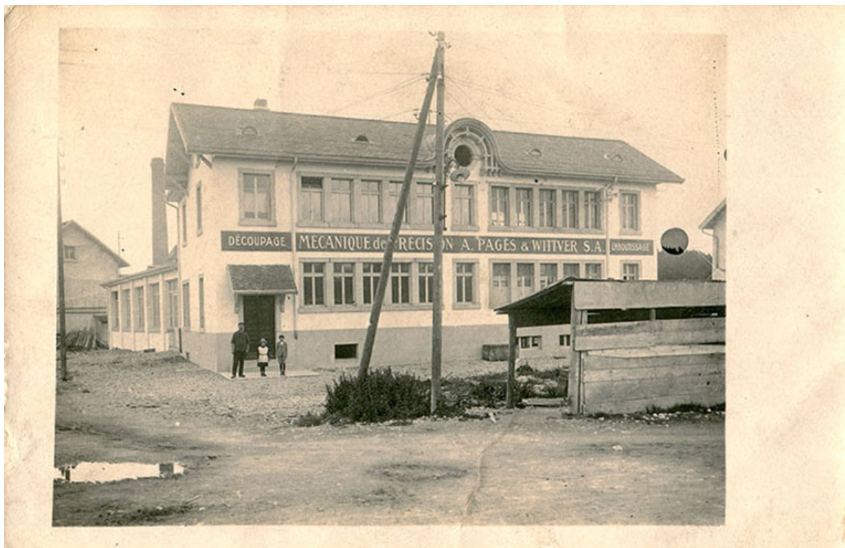
[Façade antérieure de l'usine], entre 1922 et 1935. 25, Charquemont, 13 rue de la Gare