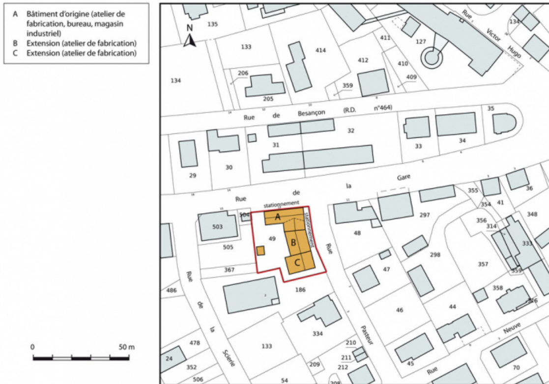
Plan-masse et de situation. Extrait du plan cadastral, 2015, section AI. 25, Charquemont, 13 rue de la Gare