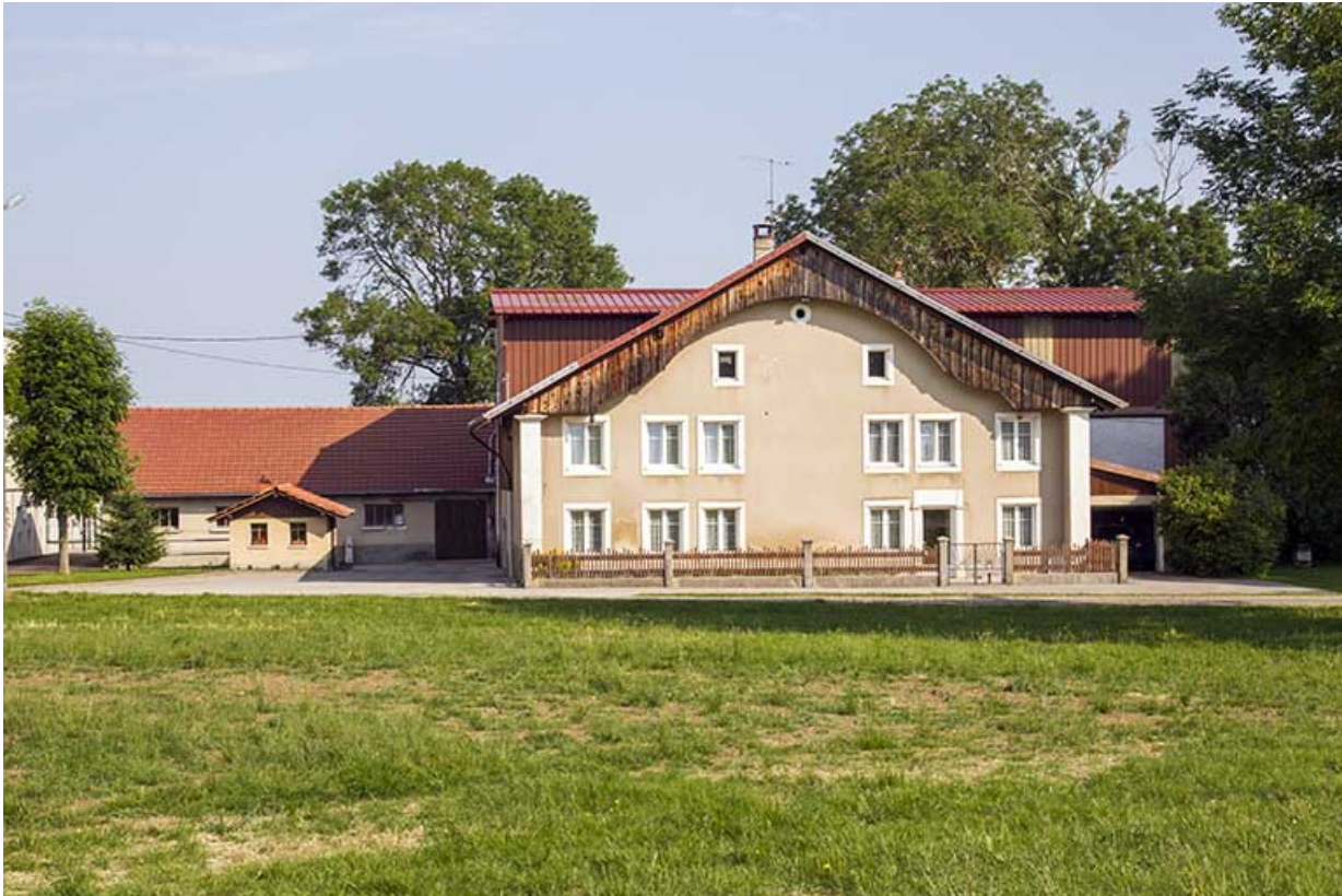
Bâtiment 19e siècle, étable et fenil des années 1960-1970.