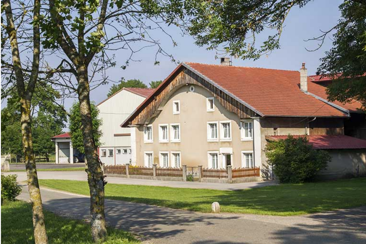
Etable des années 1990 et bâtiment 19e siècle, de trois quarts droite.