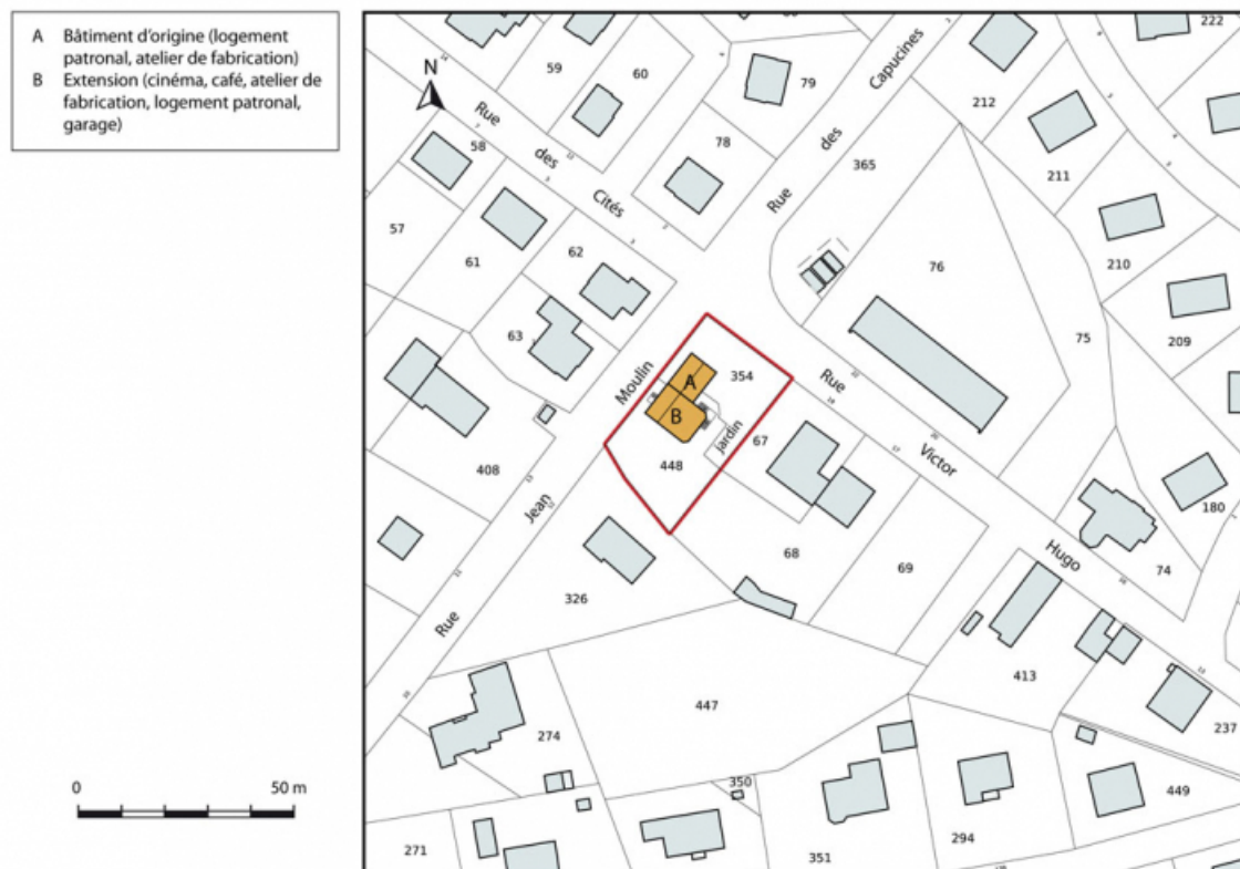
Plan-masse et de situation. Extrait du plan cadastral, 2015, section AB.