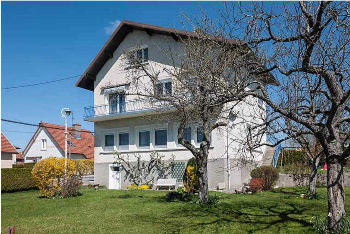
Face latérale gauche de l'extension (dont l'atelier se signale par ses fenêtres horlogères). 25, Charquemont, 21 rue Victor Hugo