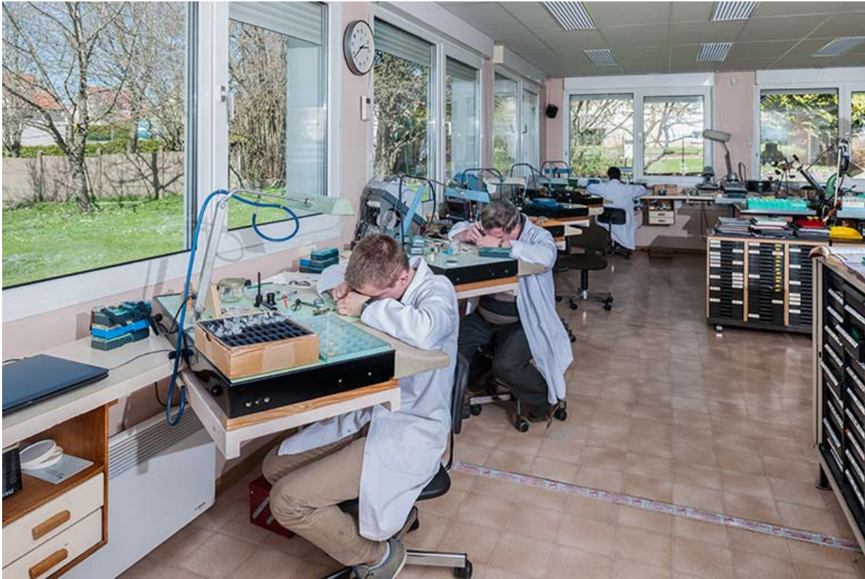
Intérieur de l'atelier.