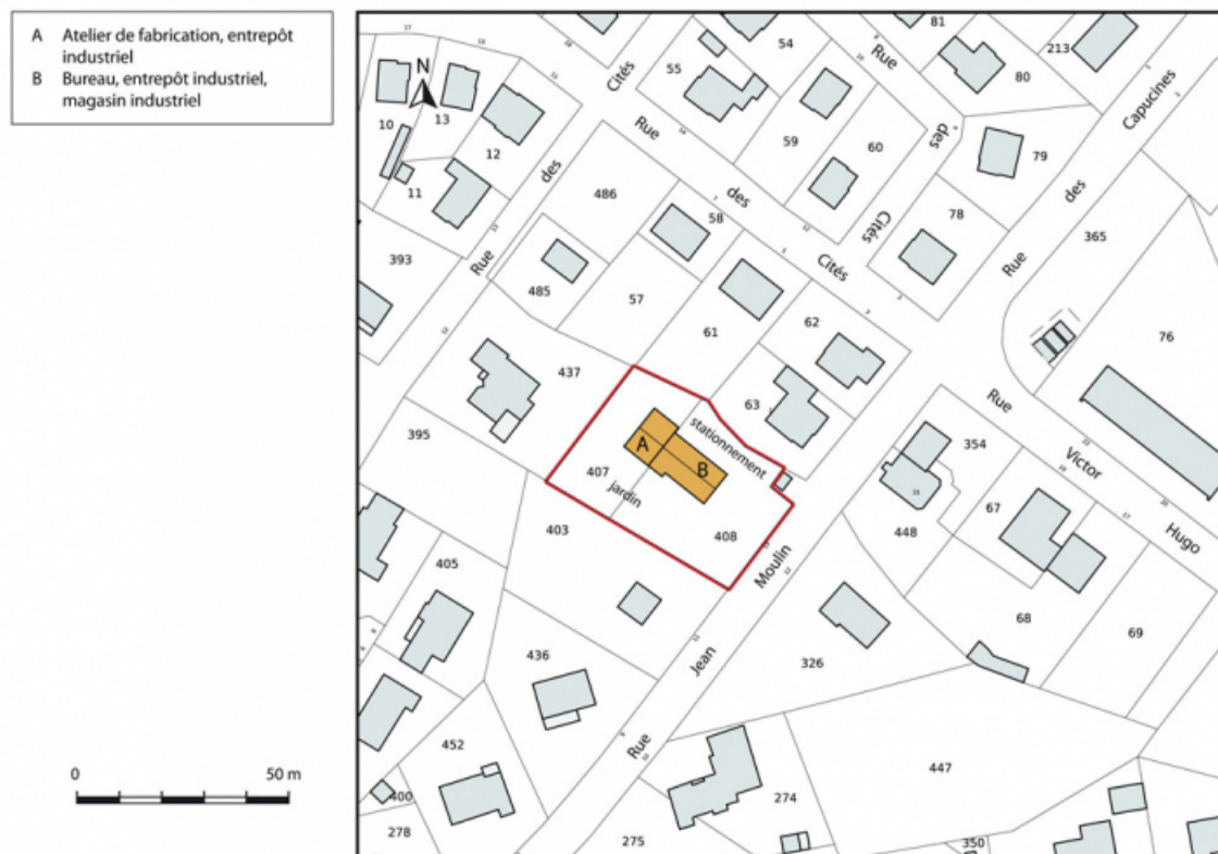
Plan-masse et de situation. Extrait du plan cadastral, 2015, section AB. 25, Charquemont, 13 rue Jean Moulin