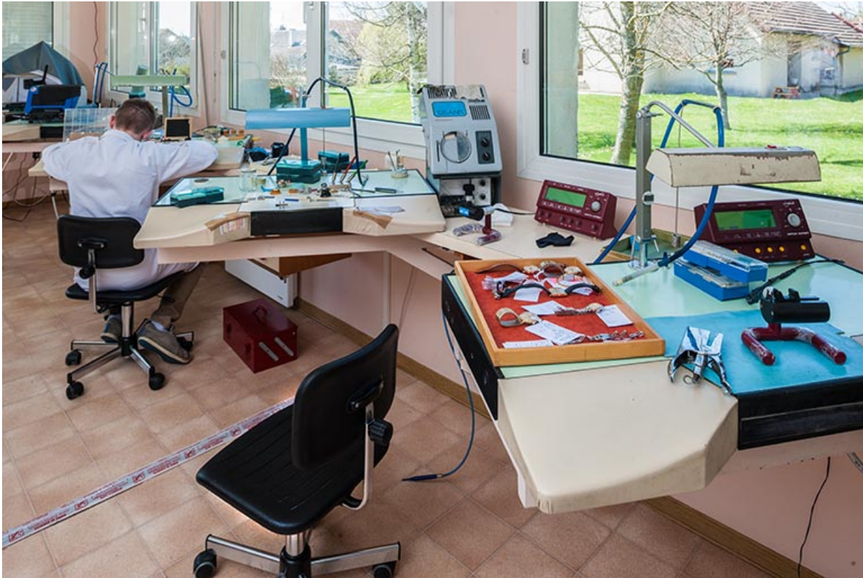
Postes de travail, derrière les fenêtres.