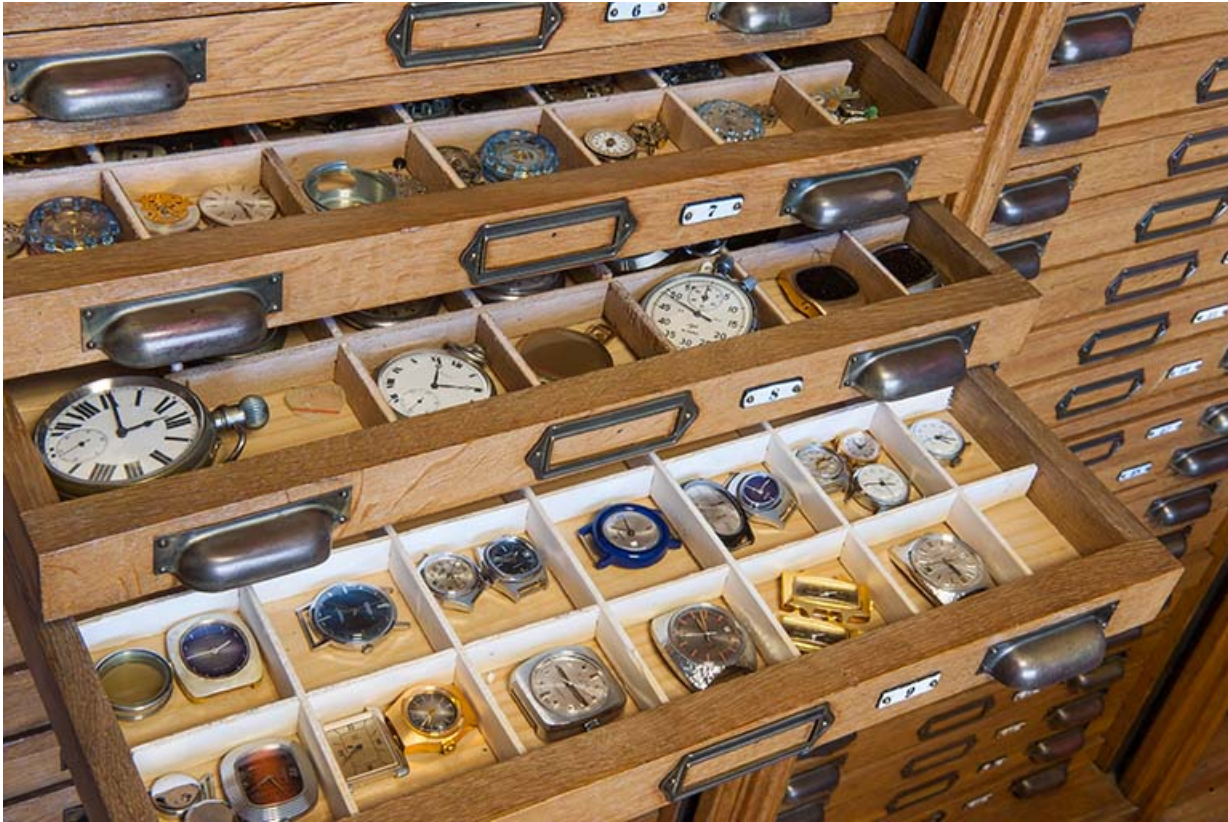
Layette d'horloger : tiroirs ouverts présentant montres et mouvements.