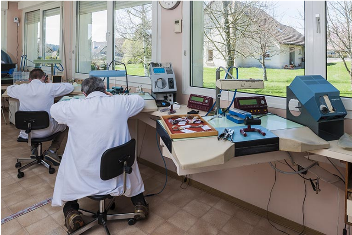
Postes de travail, derrière les fenêtres.