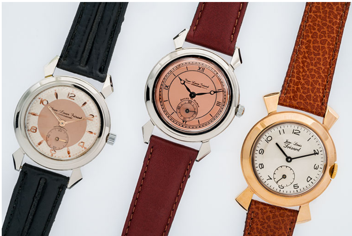
Montres-bracelets mécaniques de série : usine de montres Jean-Louis Frésard (13 rue Jean Moulin). 25, Charquemont, 13 rue Jean Moulin