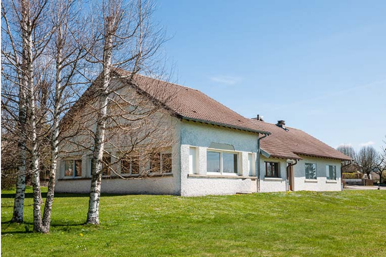
Vue d'ensemble, depuis l'ouest (façades postérieure et latérale gauche).