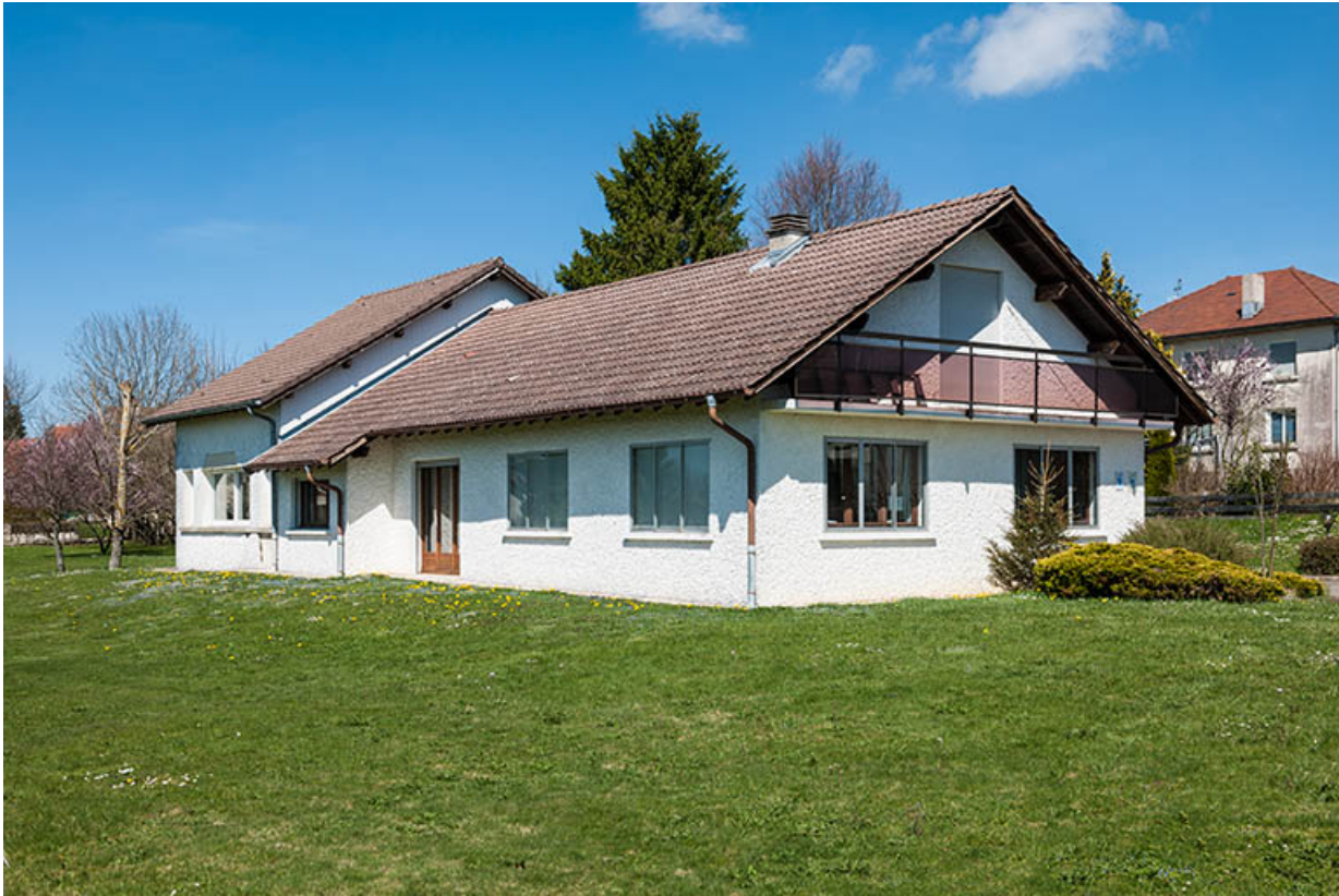
Une petite usine des années 1980 (1982-1990) : usine de montres Jean-Louis Frésard (13 rue Jean Moulin). 25, Charquemont, 13 rue Jean Moulin