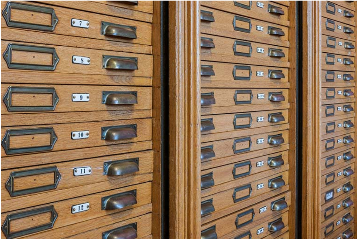
Layette d'horloger : détail des tiroirs.