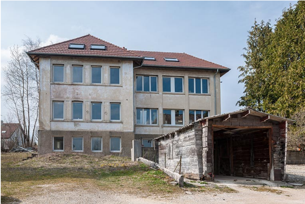
Usine : façade antérieure.