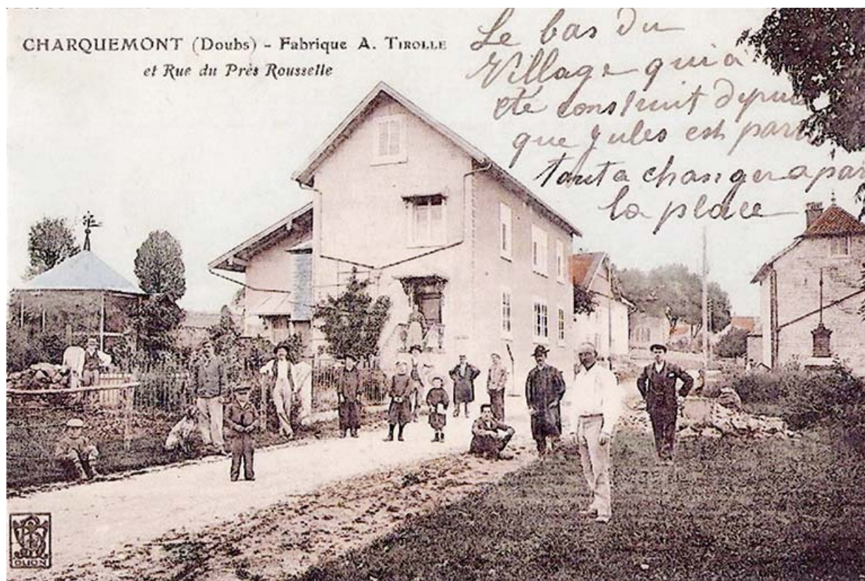
L'usine Amédée Tirolle puis Victorin Frésard (10-14 rue du Château) : Charquemont (Doubs) - Fabrique A. Tirolle et Rue du Près Rousselle, limite 19e siècle 20e siècle.