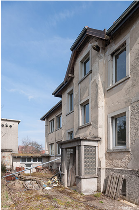
Usine : façade postérieure, de trois quarts droite.