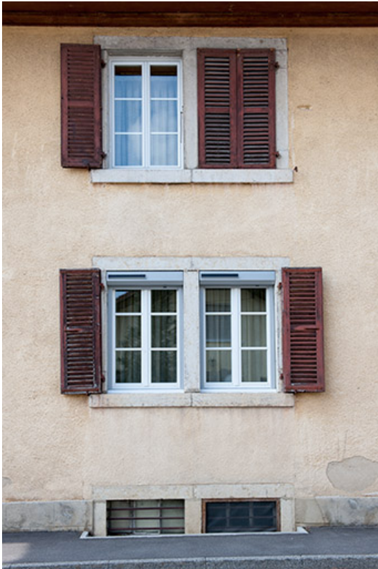
Logement patronal : fenêtres horlogères côté rue.