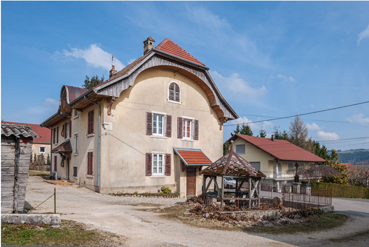
Logement patronal : façades postérieure et latérale gauche.