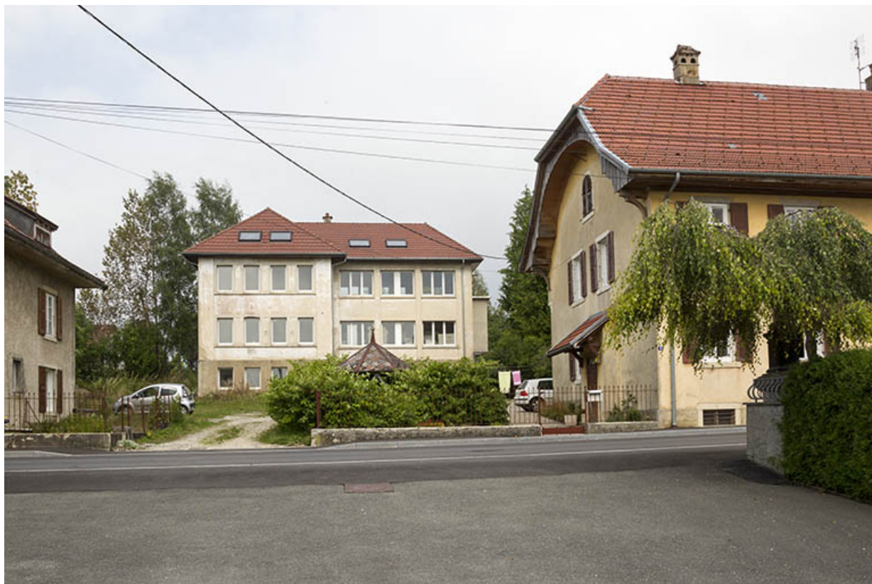
Vue d'ensemble, depuis l'est. De gauche à droite : ancien logement Erard-Jeannoutot (n° 14), usine et logement patronal (ancienne maison Tirolle, n° 10).