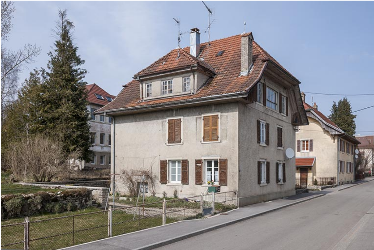
Vue d'ensemble, depuis le sud.