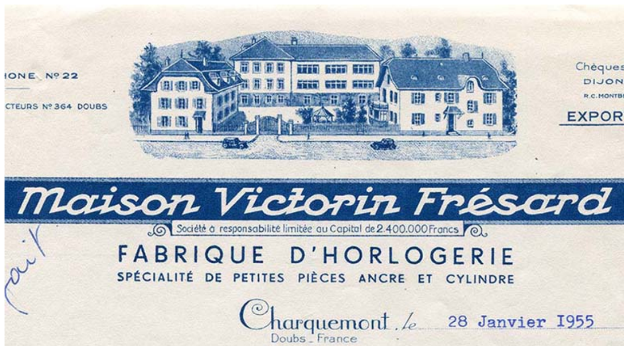
Papier à en-tête de la fabrique d'horlogerie Victorin Frésard : détail des bâtiments, 28 janvier 1955. 25, Charquemont, 10-14 rue du Château