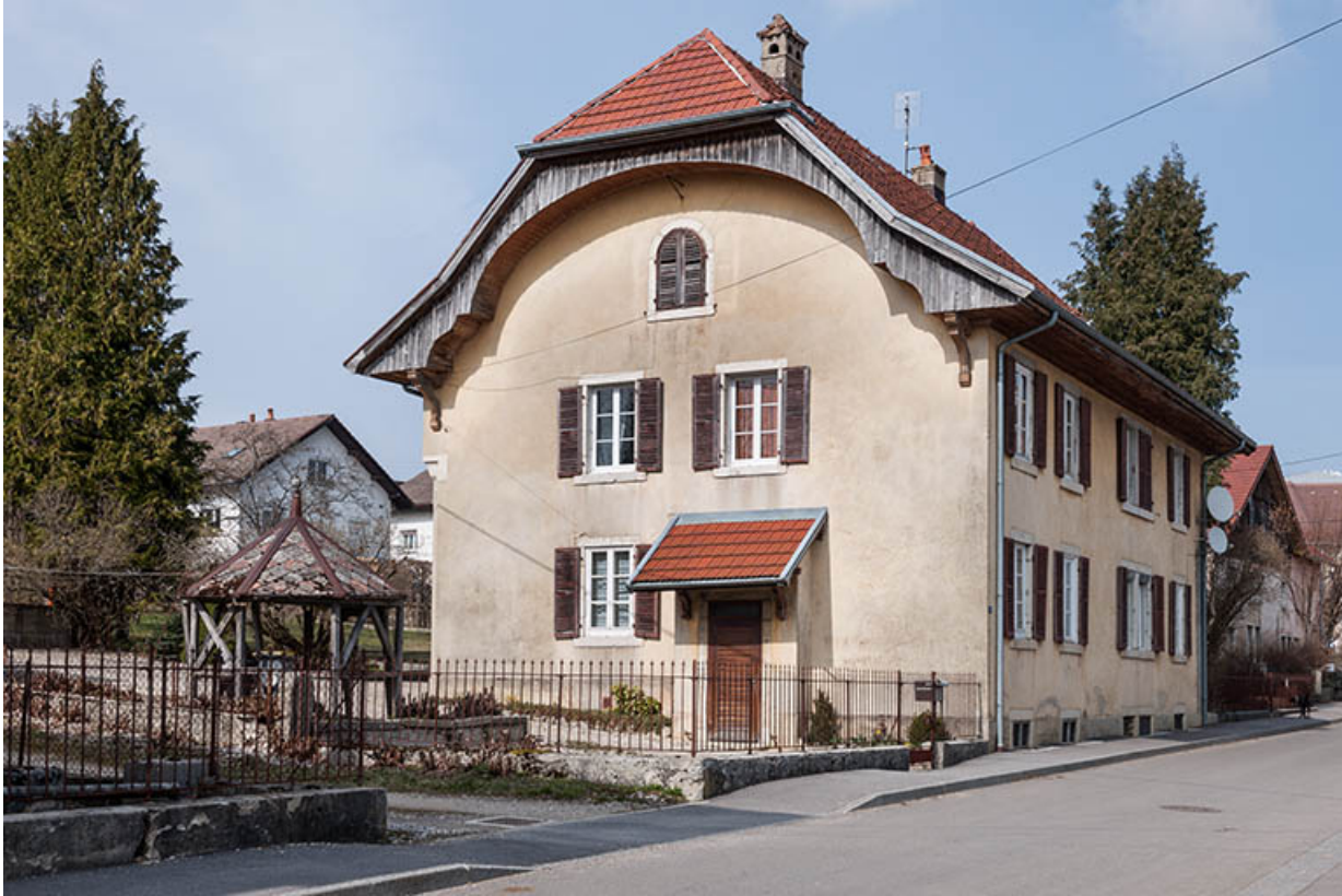
Logement patronal, de trois quarts gauche.