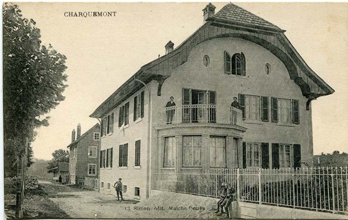
Charquemont [la maison de Victorin Frésard, rue du Château, vue de trois quarts droite], 1er quart 20e siècle 25, Charquemont, 10-14 rue du Château

Charquemont [la maison de Victorin Frésard, rue du Château, vue de trois quarts droite], carte postale, par Ch. Simon, s.d. [1er quart 20e siècle], Ch. Simon éd. à Maîche. Publiée dans : Vuillet, Bernard. Entre Doubs et Dessoubre. Tome III. Autour de Charquemont et Damprichard. - Les Gras : B. Vuillet, Villers-le-Lac : G. Caille, 1991, p. 131.