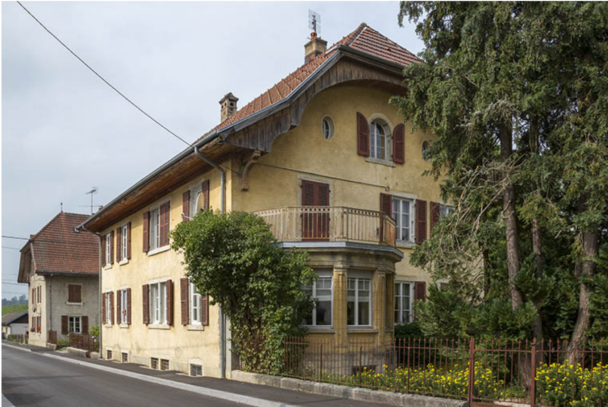
Logement patronal, de trois quarts droite.