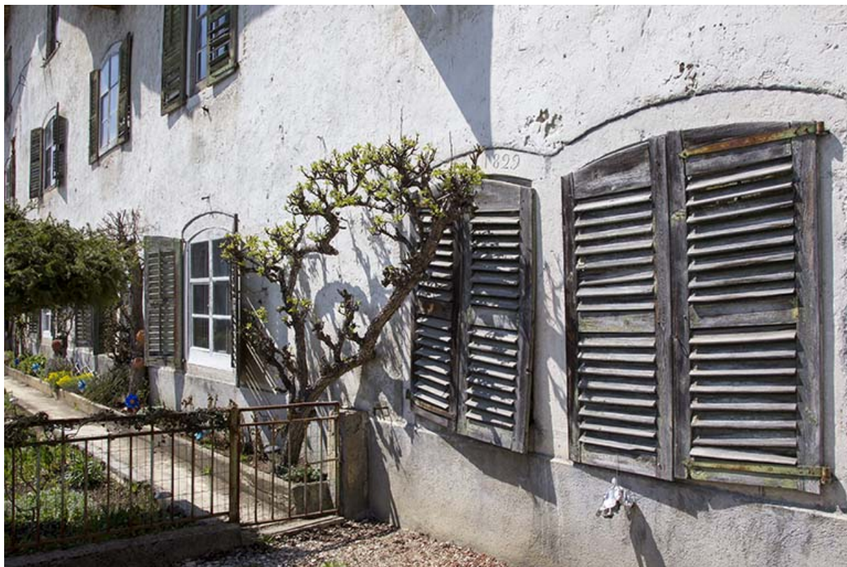
Façade antérieure : fenêtres horlogères à linteau délardé en arc segmentaire. 25, Charquemont, 9 Grande Rue