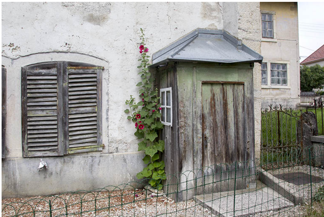
Façade antérieure : fenêtre du rez-de-chaussée et édicule.