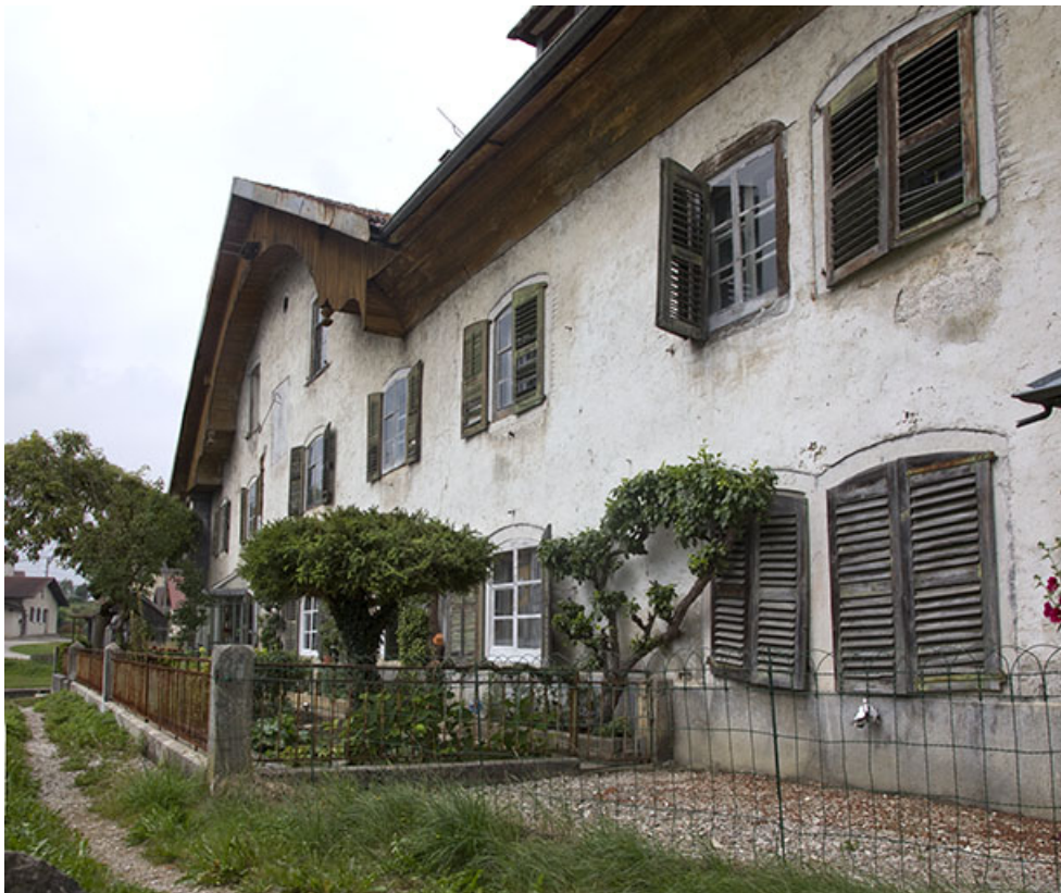
Façade antérieure, vue en enfilade depuis la droite.