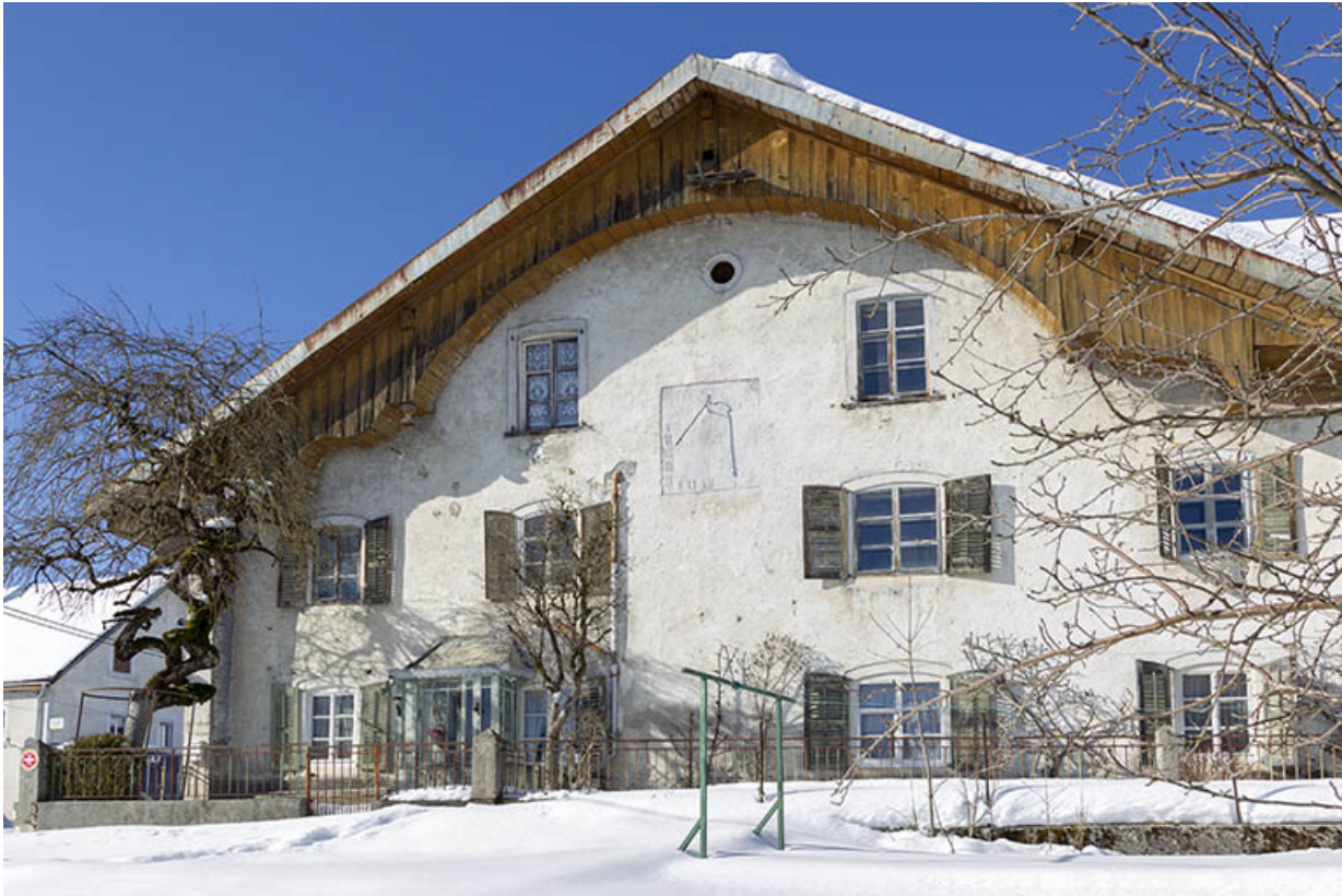
Façade antérieure, en hiver.