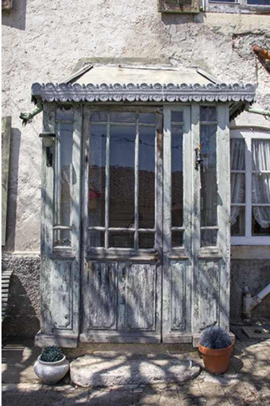
Façade antérieure : véranda.