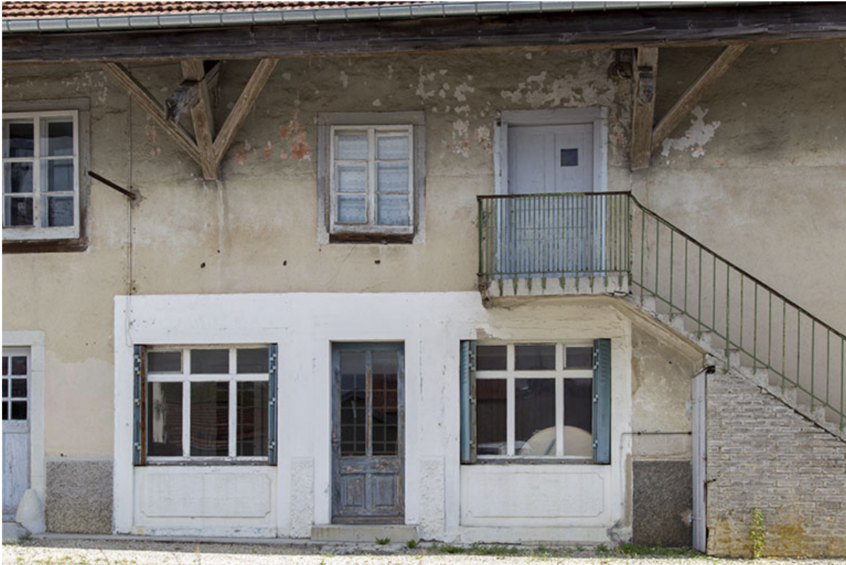
Façade latérale gauche : entrées au rez-de-chaussée et à l'étage.