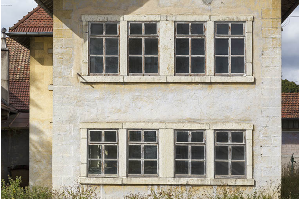
Usine, façade latérale gauche : fenêtres multiples des deux niveaux.