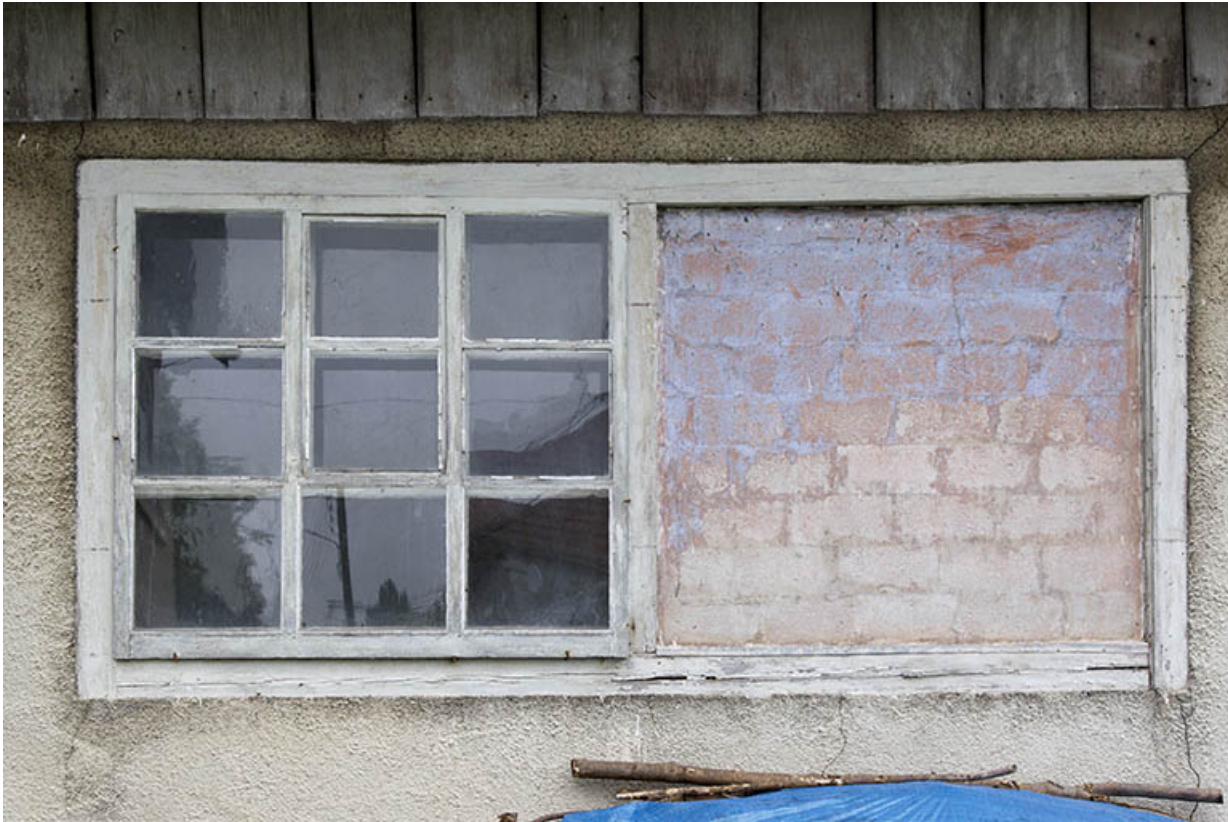
Façade latérale droite : fenêtres.