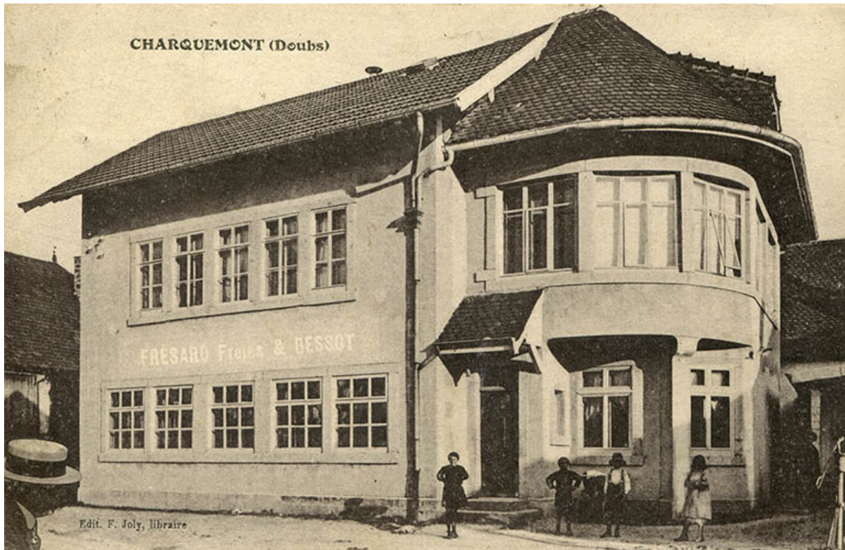
Charquemont (Doubs) [l'usine Frésard Frères et Bessot], entre 1911 et 1927.