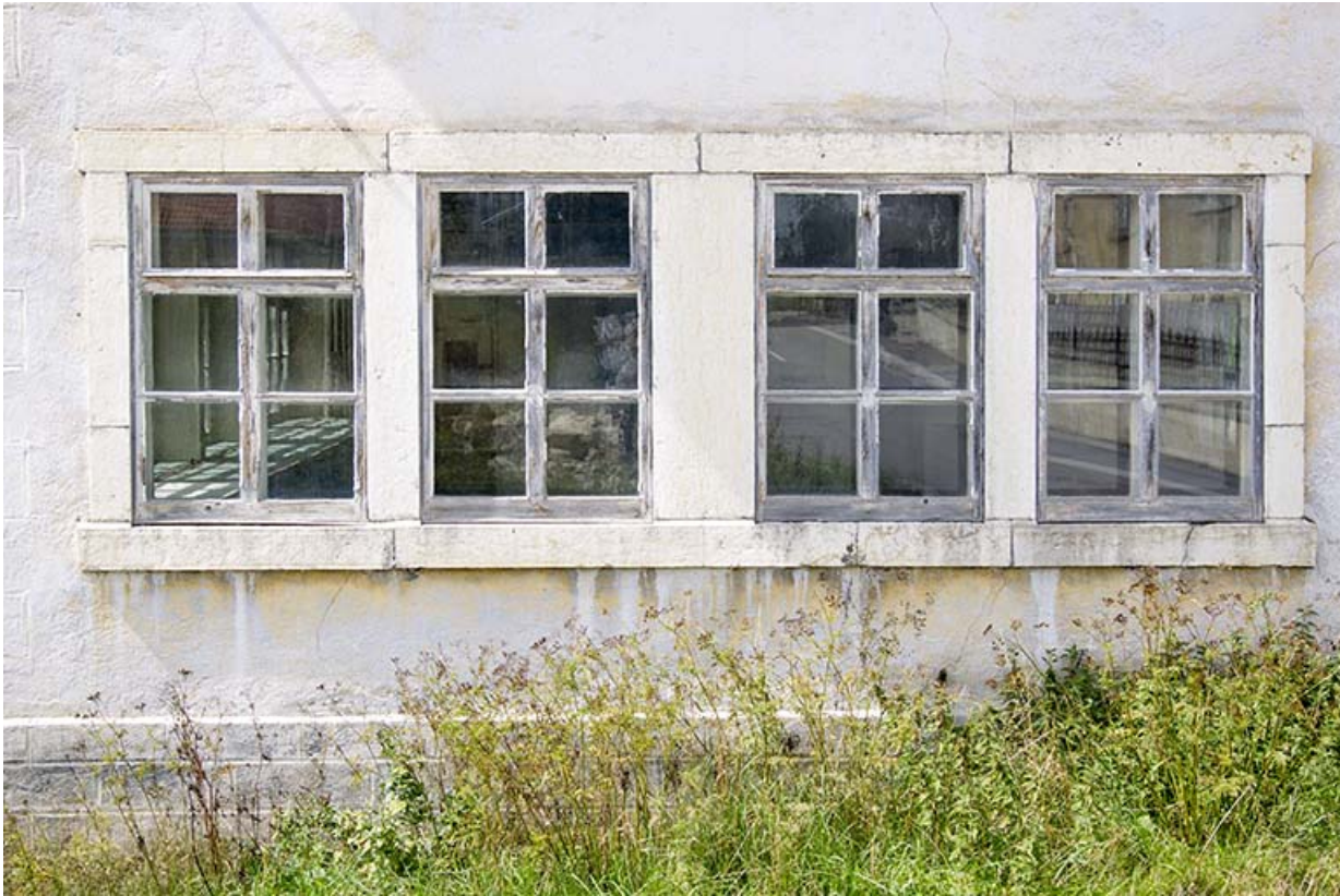
Usine, façade latérale gauche : fenêtres multiples du rez-de-chaussée. 25, Charquemont