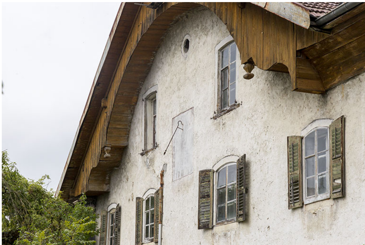
Façade antérieure : pignon et cadran solaire.