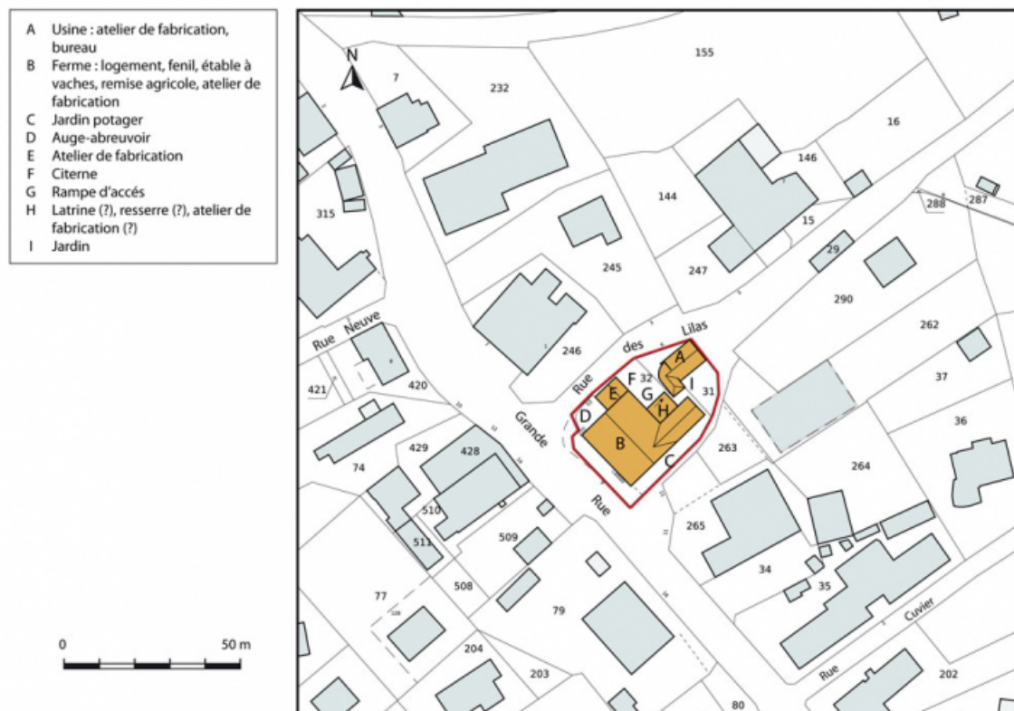
Plan-masse et de situation. Extrait du plan cadastral, 2015, section AC. 25, Charquemont, 9 Grande Rue