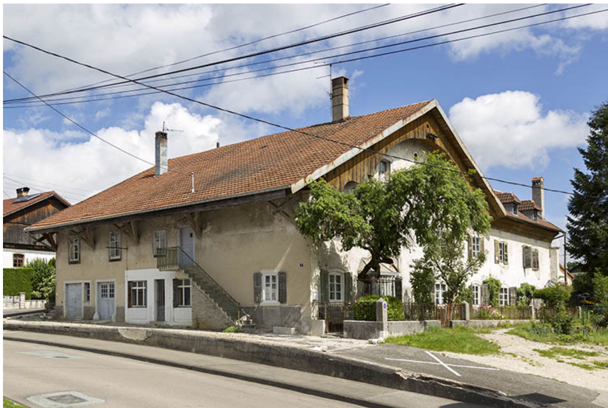
Vue d'ensemble, depuis le sud : façades antérieure et latérale gauche de la ferme. 25, Charquemont, 9 Grande Rue