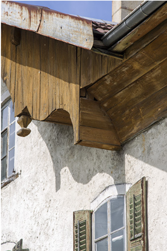
Façade antérieure : extrémité droite de la lambrichure et motif décoratif ornant l'extrémité pendante d'un poteau. 25, Charquemont, 9 Grande Rue