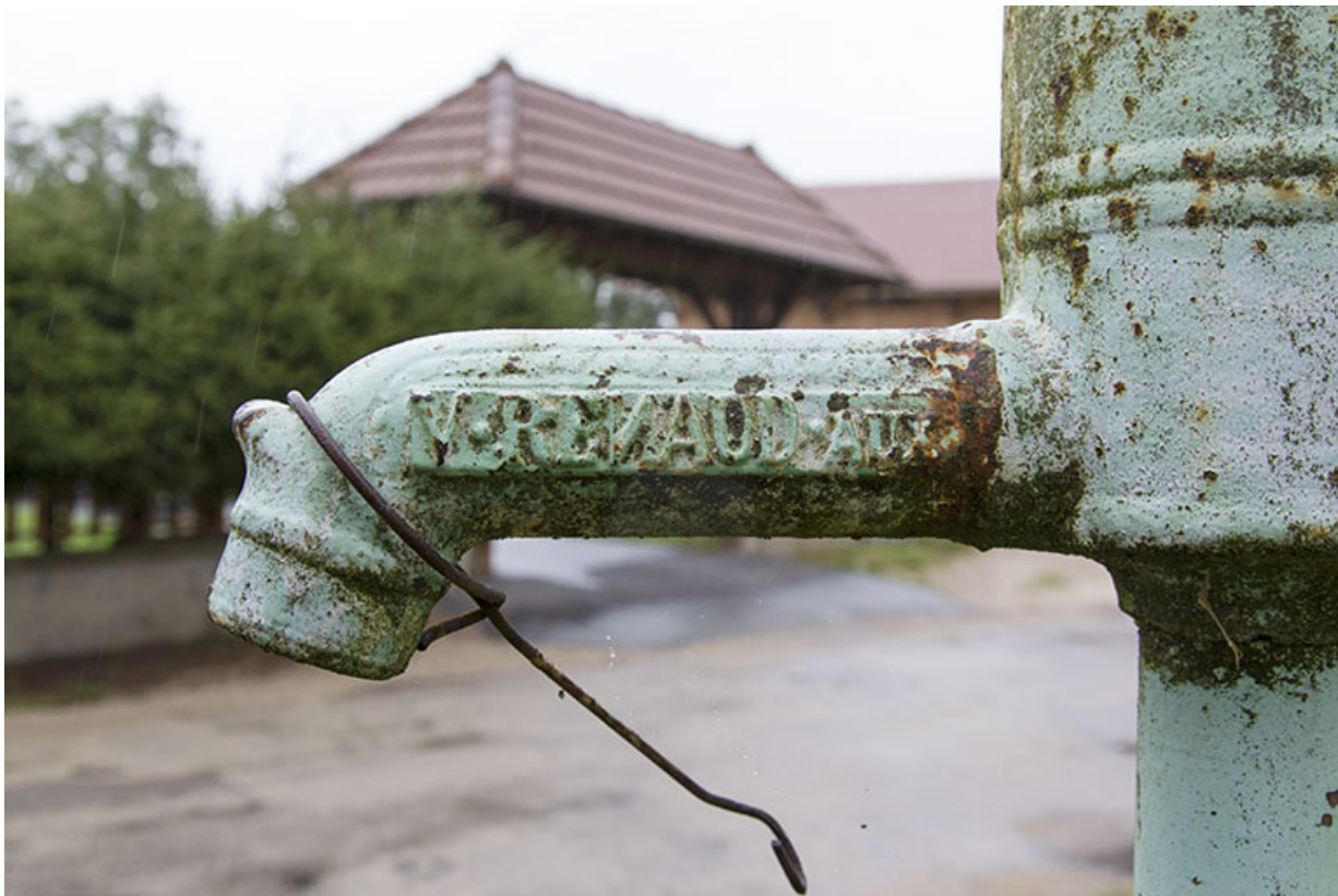
Pompe à eau : nom du fabricant (V. Renaud). 25, Charquemont, 9 Grande Rue