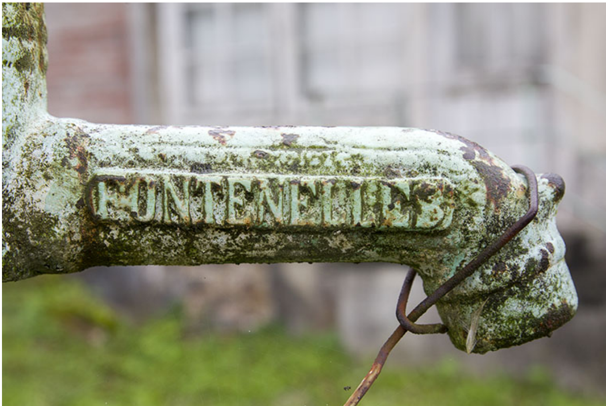
Pompe à eau : lieu de fabrication (Les Fontenelles).