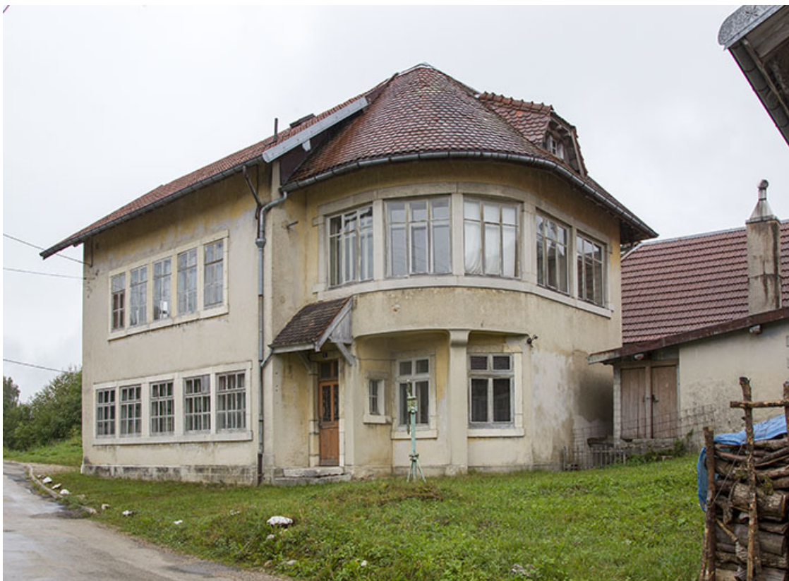
Usine : façades antérieure et latérale droite. 25, Charquemont