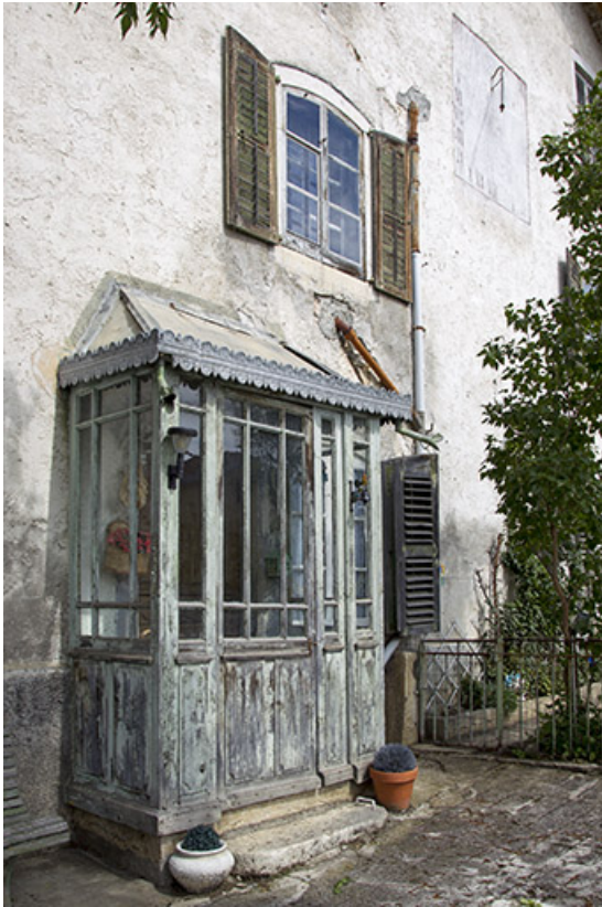
Façade antérieure : véranda, de trois quarts gauche. 25, Charquemont, 9 Grande Rue