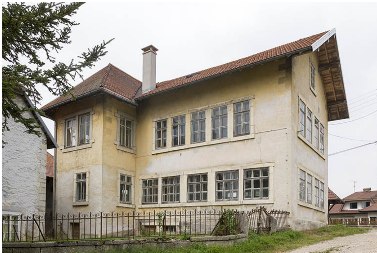
Usine : façades postérieure et latérale gauche.