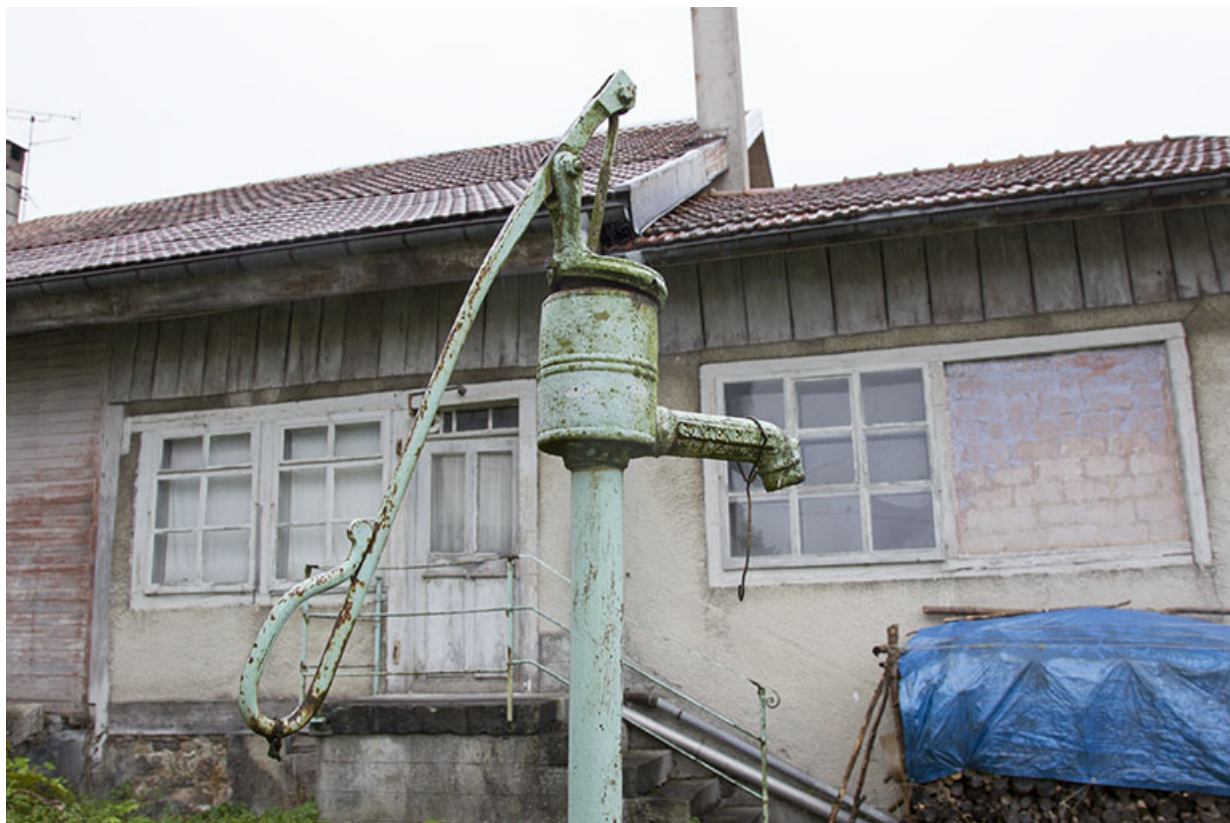
Pompe à eau Renaud.