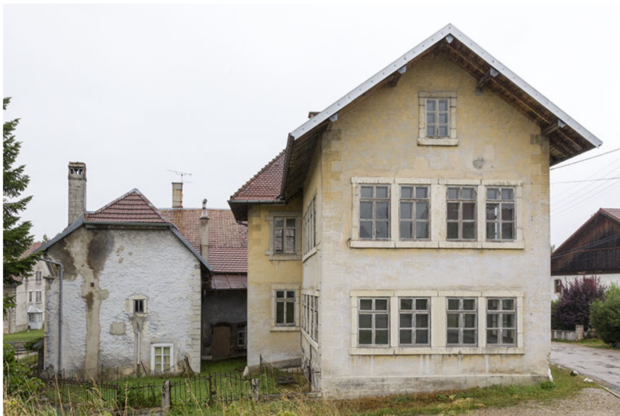
Usine : façade latérale gauche.