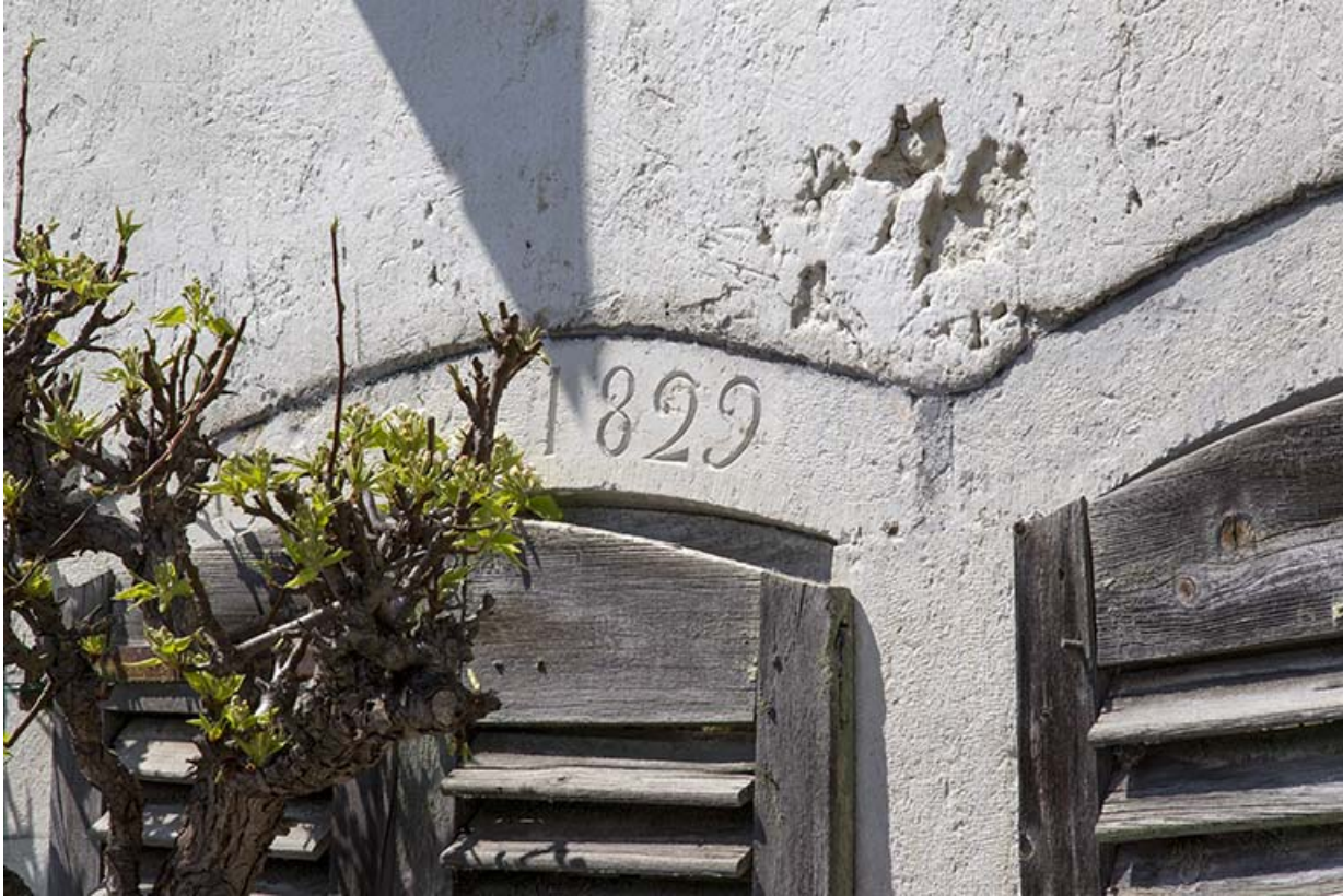
Façade antérieure : date inscrite sur le linteau d'une fenêtre du rez-de-chaussée.