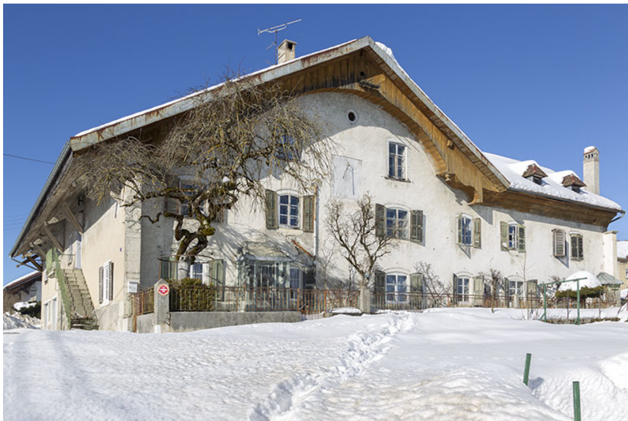
Façade antérieure de trois quarts gauche, en hiver. 25, Charquemont