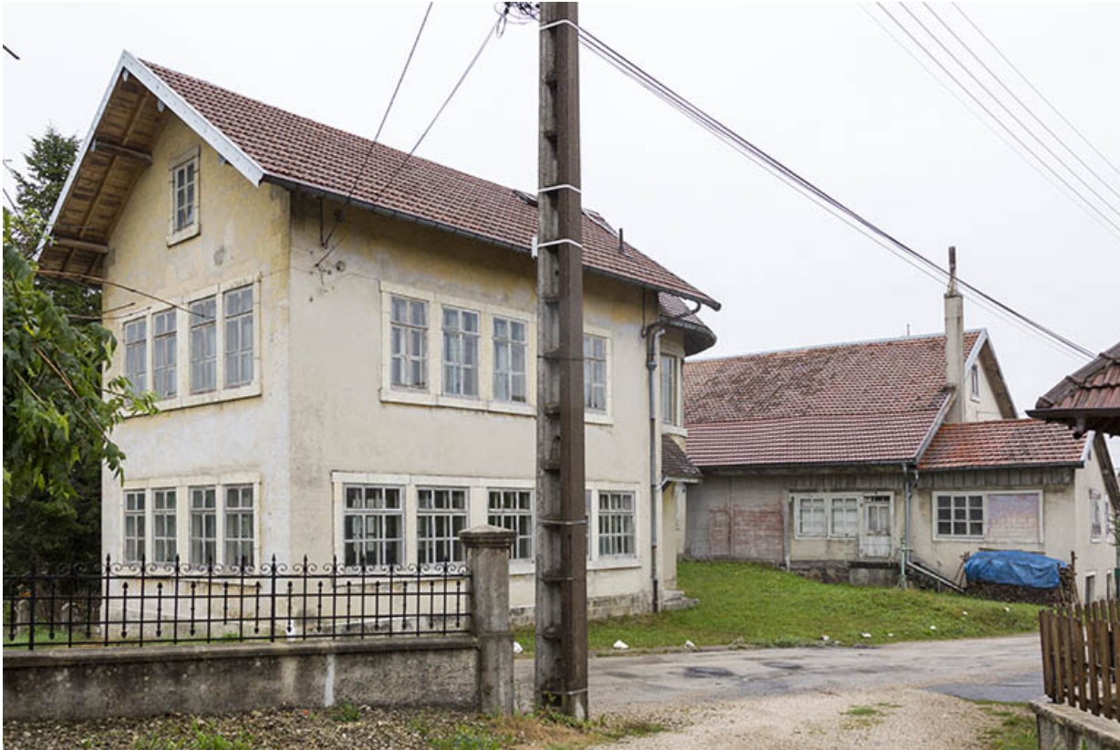
Vue d'ensemble, depuis le nord : façade latérale droite de la ferme et usine. 25, Charquemont, 9 Grande Rue