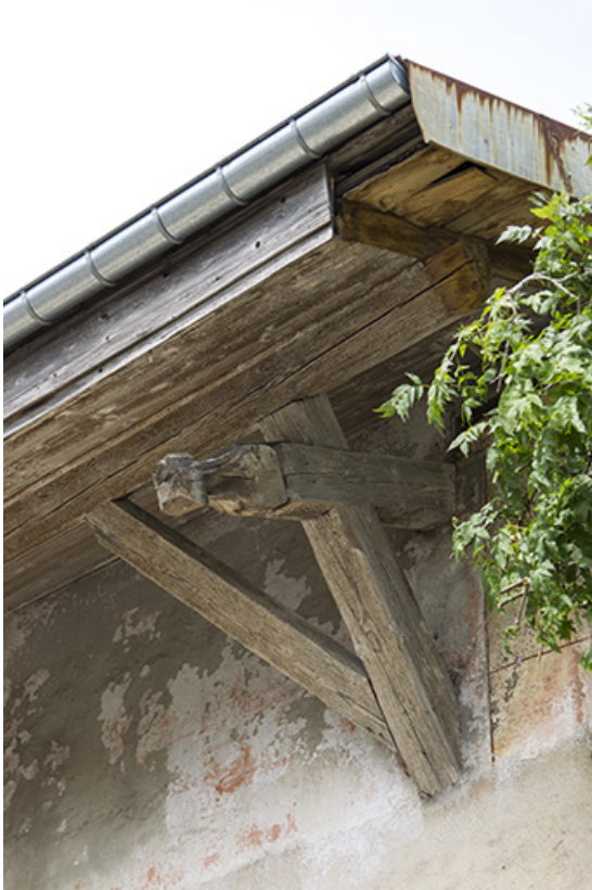
Façade latérale gauche : motif décoratif ornant l'extrémité d'un chevron.