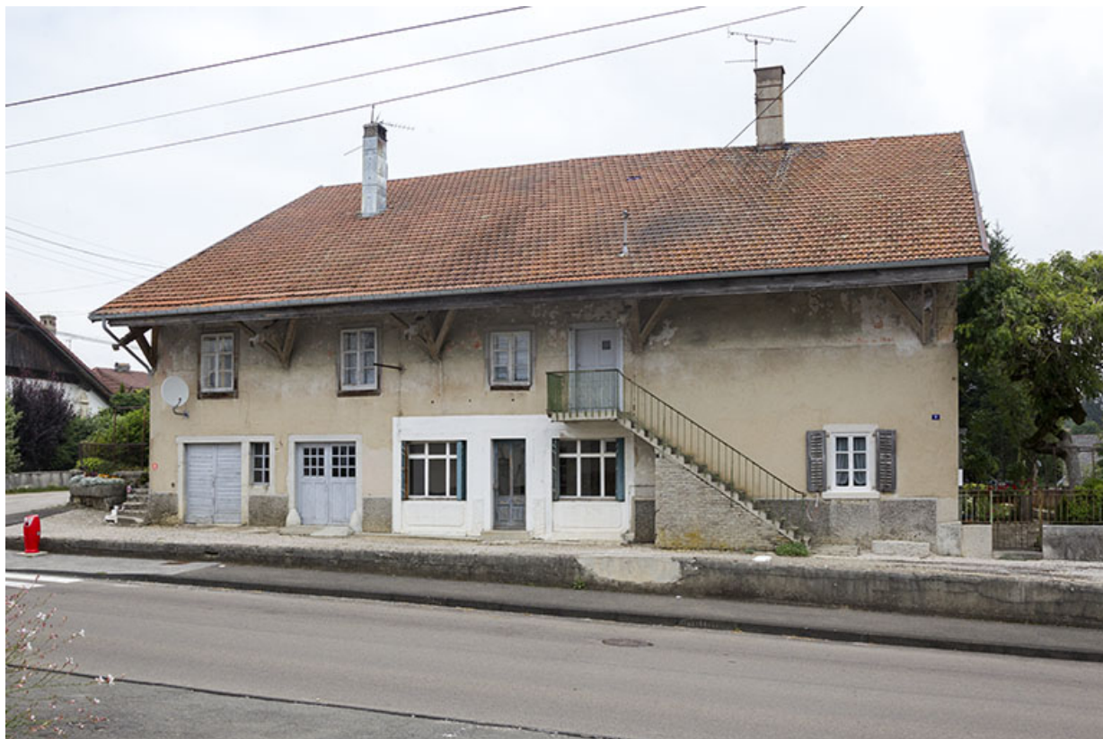
Façade latérale gauche.