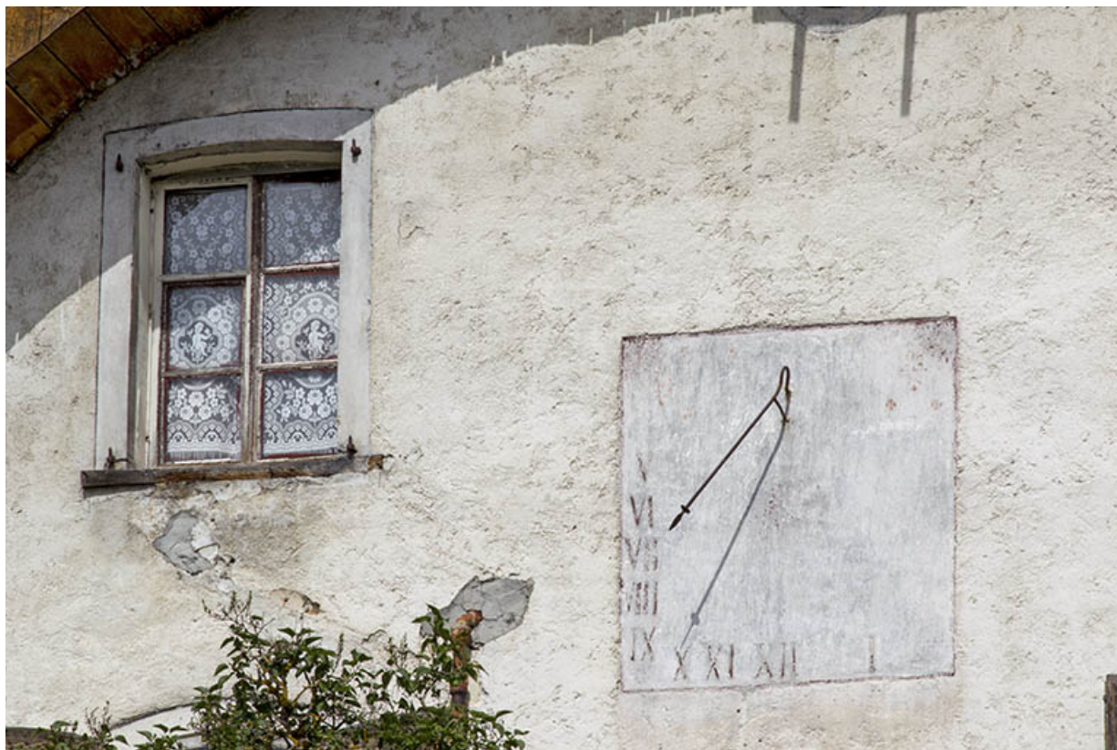
Façade antérieure : cadran solaire.