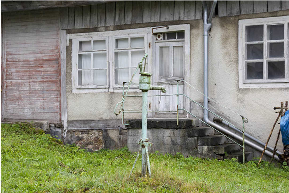
Façade latérale droite : entrée et pompe à eau. A gauche, la porte d'accès au fenil. 25, Charquemont, 9 Grande Rue