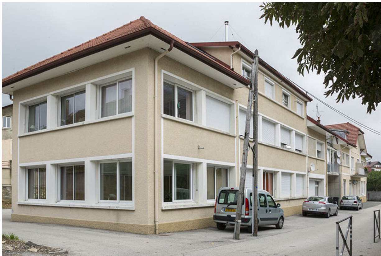
Une usine des années 1920 à 1950 : usine Frésard-Vadam puis Frésard-Panneton (2 rue Cuvier). 25, Charquemont, 2 rue Cuvier