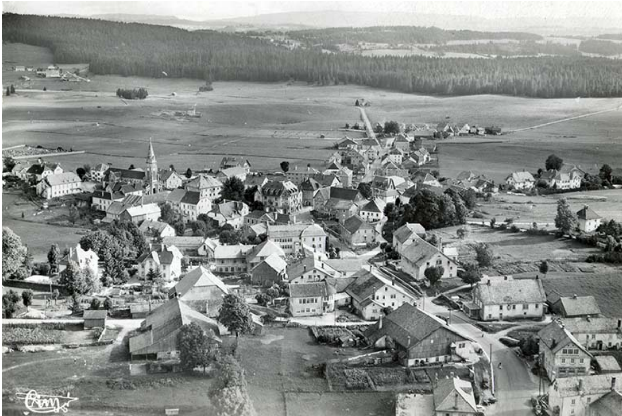
Charquemont (Doubs). 11059 - Vue aérienne [depuis l'ouest], entre 1950 et 1955. La levée de grange est encore visible. 25, Charquemont, 3 et 3 bis rue du Général Leclerc