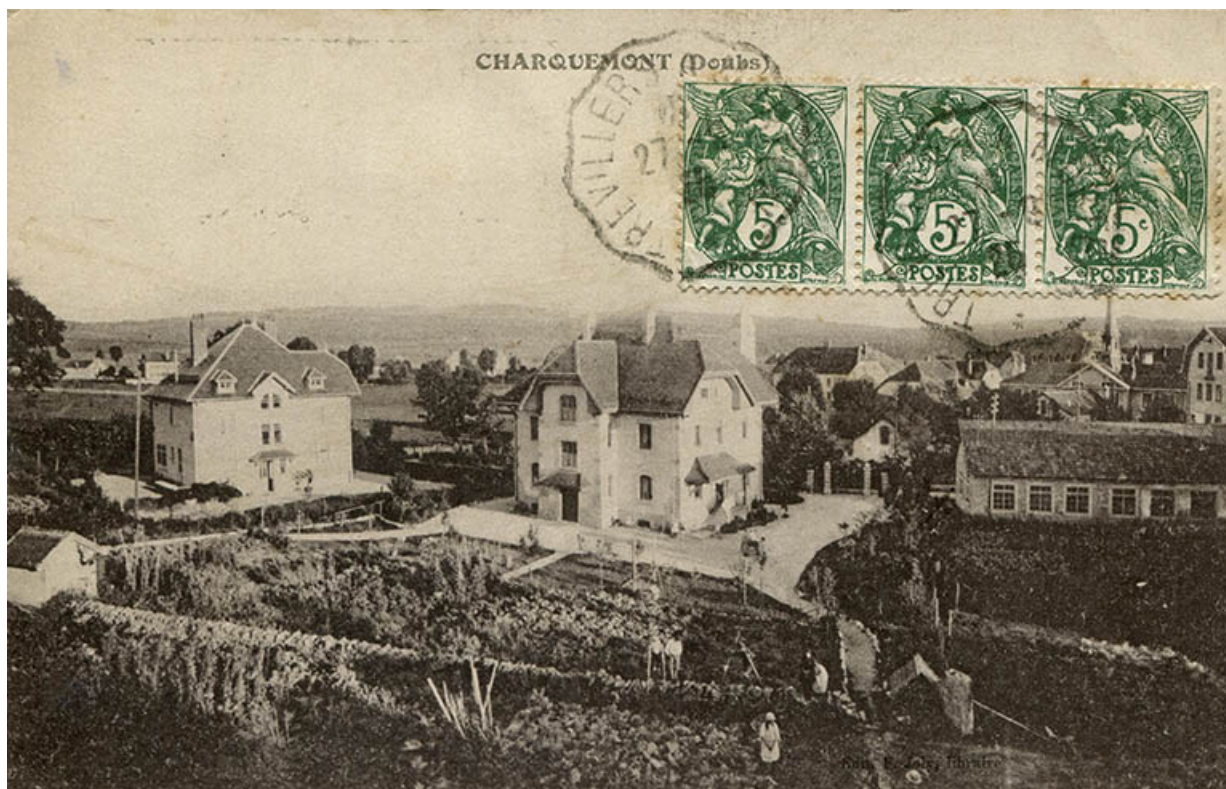
Charquemont (Doubs) [la rue Cuvier vue du nord], 1er quart 20e siècle (après 1918). 25, Charquemont, 6 rue Cuvier