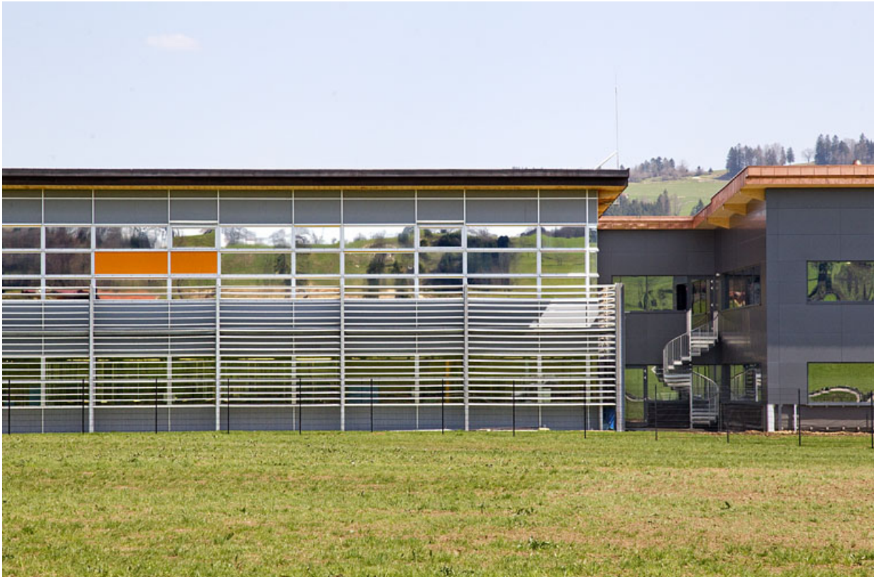
Une usine du 21 e siècle (2002, Sexer Loyrette Architecture) : usine de balanciers-spiraux Frésard Composants (4 rue Pierre Frésard).