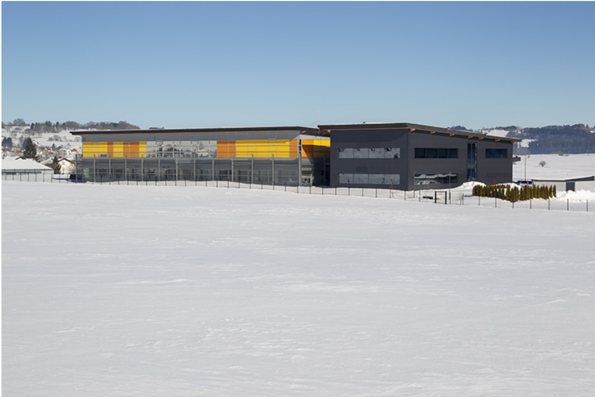
Une usine de 2002 (Sexer Loyrette Architecture) : usine de balanciers-spiraux Frésard Composants (4 rue Pierre Frésard). 25, Charquemont, 4 rue Pierre Frésard