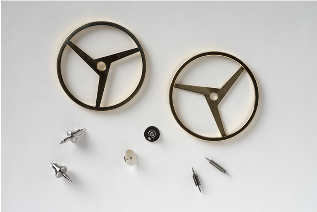
Exemples de composants fabriqués dans l'usine : serges et axes de balancier, plateaux et pignons d'échappement. 25, Charquemont, 4 rue Pierre Frésard