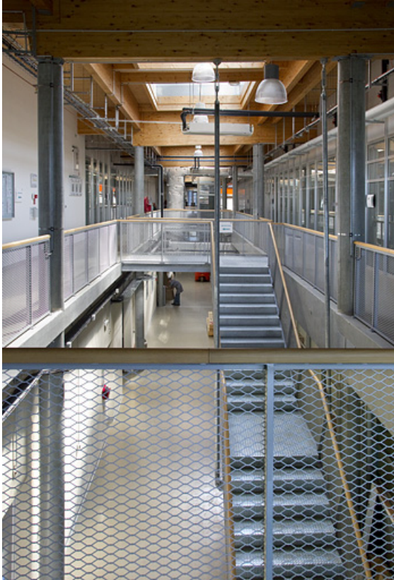
Vaisseau central, à l'étage.