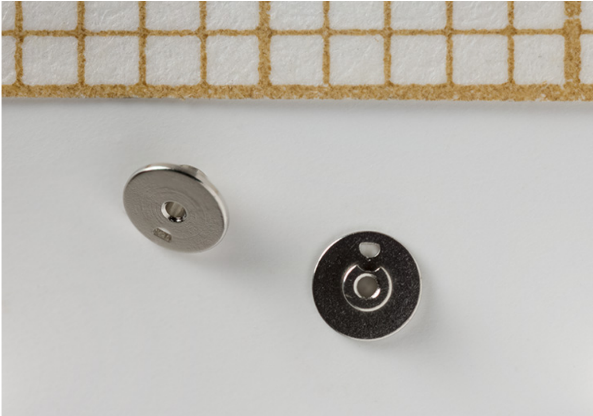
Exemples de composants fabriqués dans l'usine : plateaux.