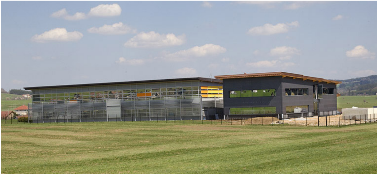
Façades postérieure et latérale gauche.