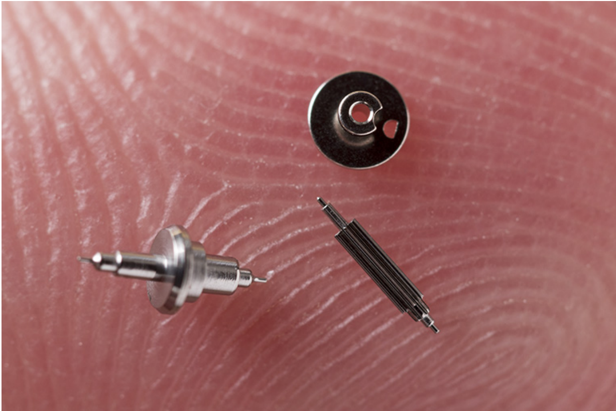
Exemples de composants fabriqués dans l'usine : axes de balancier, plateaux et pignons d'échappement.