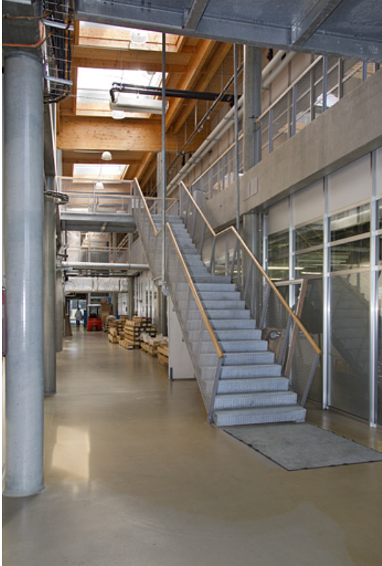
Vaisseau central, au rez-de-chaussée.