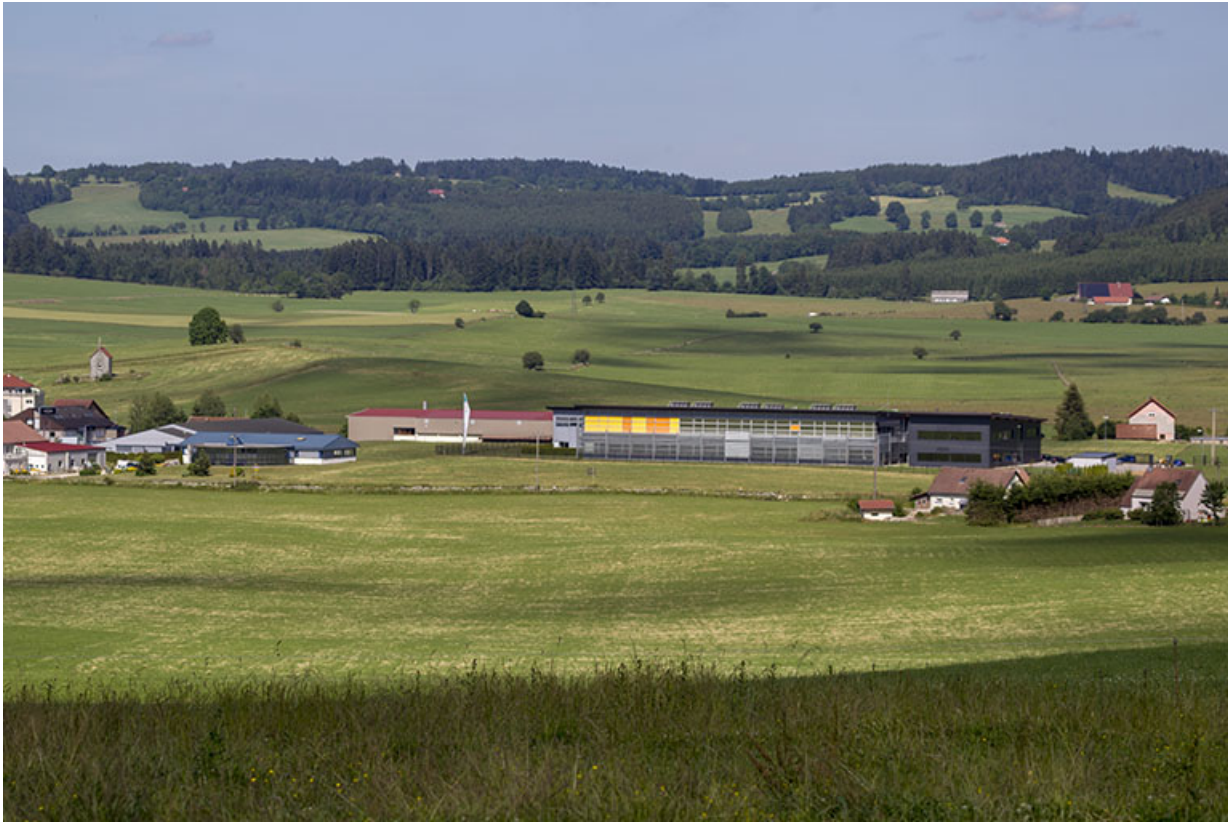
Vue d'ensemble du plateau et de la zone industrielle. Entreprises Perrenoud et Saint-Honoré Paris à gauche, Frésard Composants à droite.