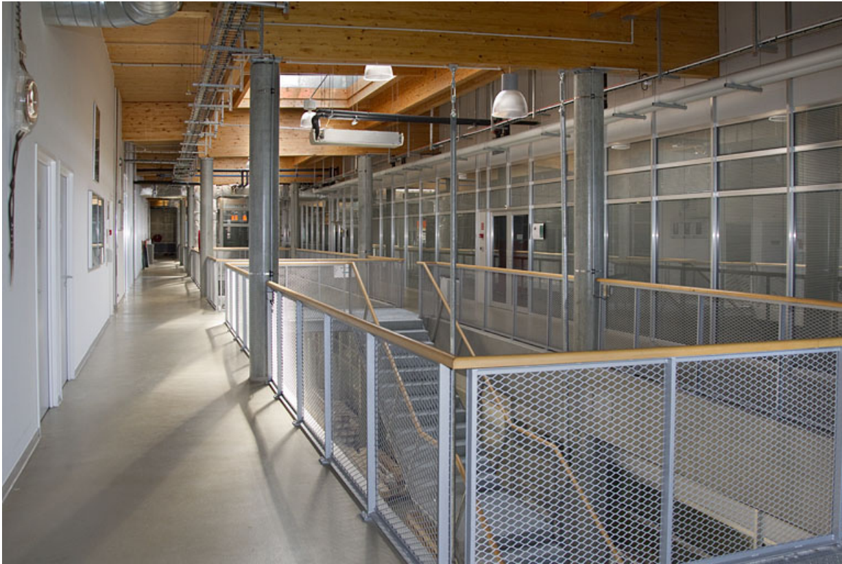
Galerie à l'étage, vue de trois quarts.