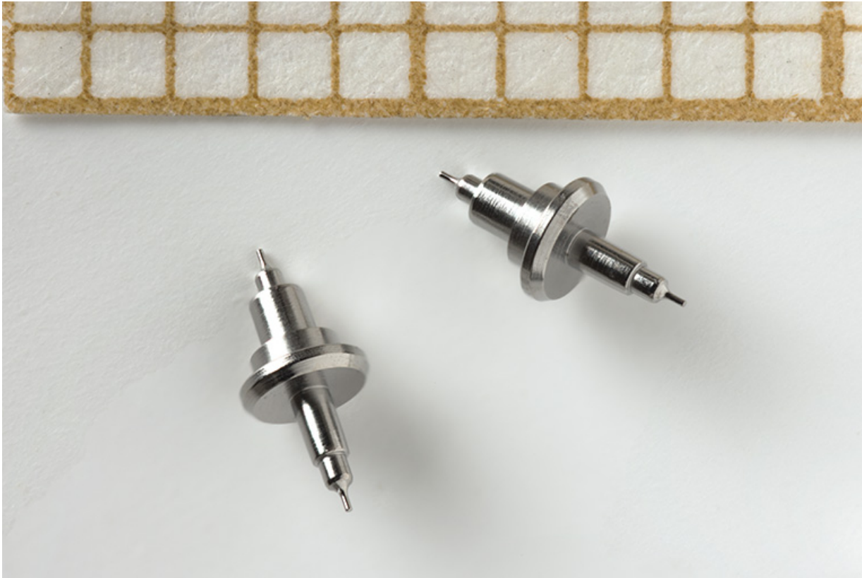
Exemples de composants fabriqués dans l'usine : axes de balancier.