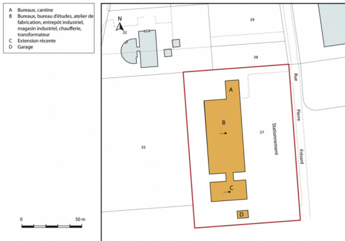
Plan-masse et de situation. Extrait du plan cadastral, 2015, section AN.