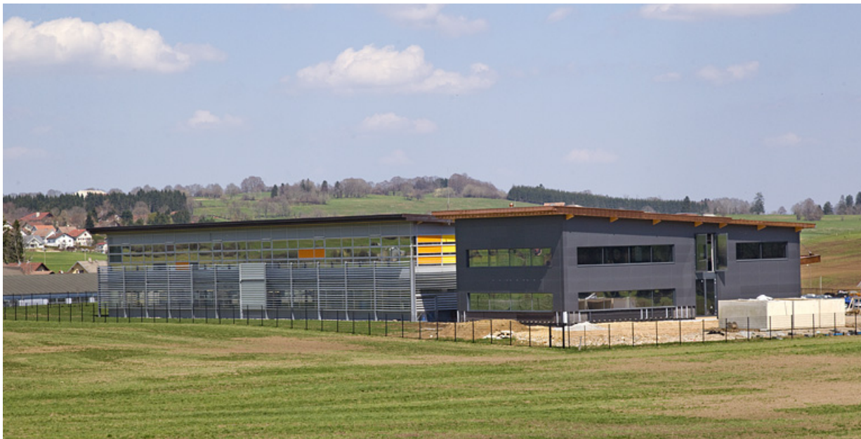
Usine de balanciers Frésard Composants, à Charquemont.