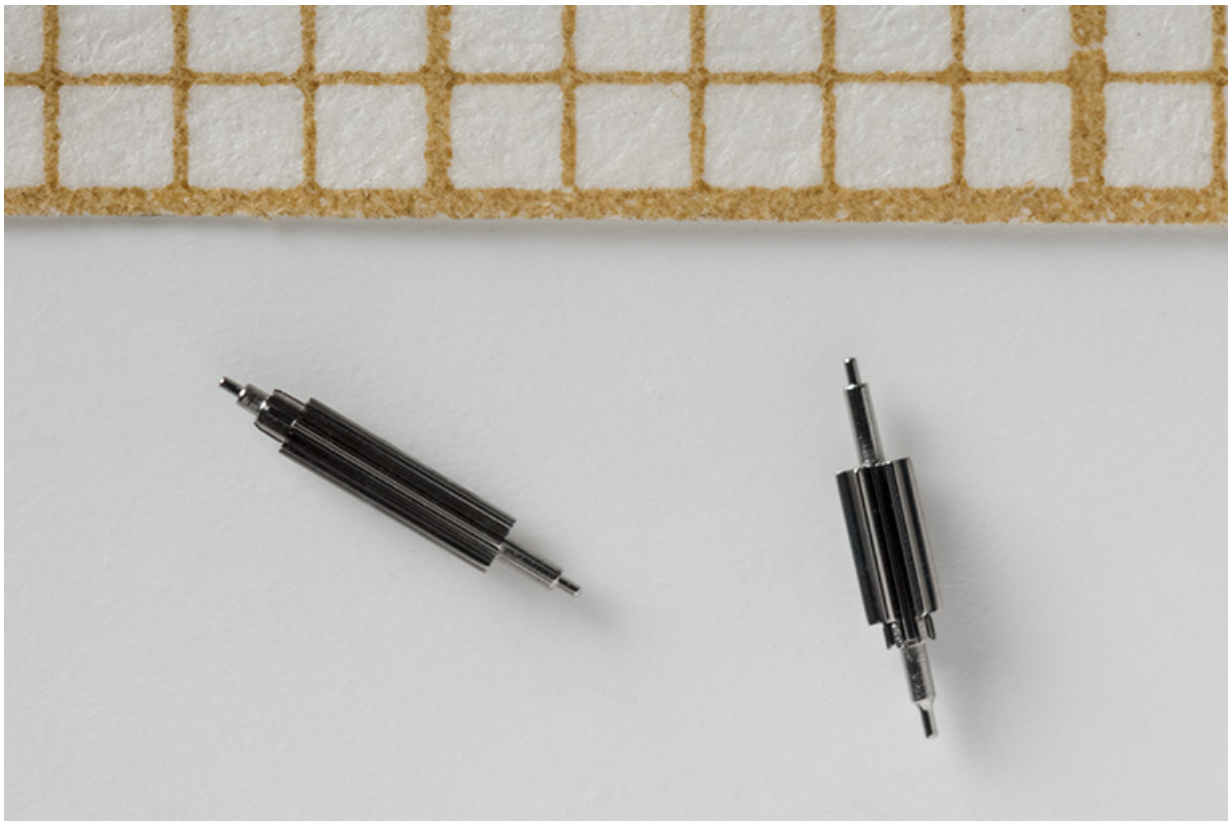
Exemples de composants fabriqués dans l'usine : pignons d'échappement.