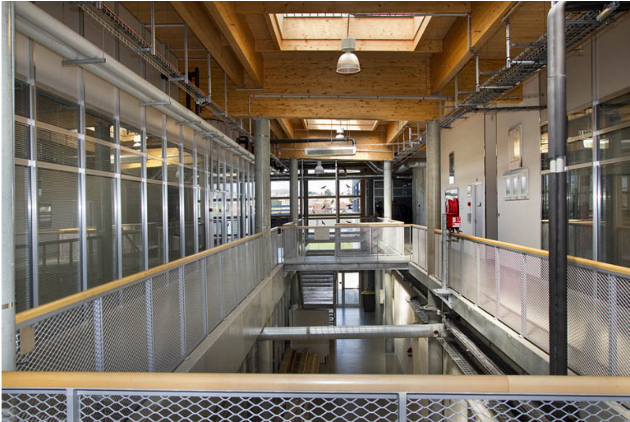
Vaisseau central et galerie, à l'étage.