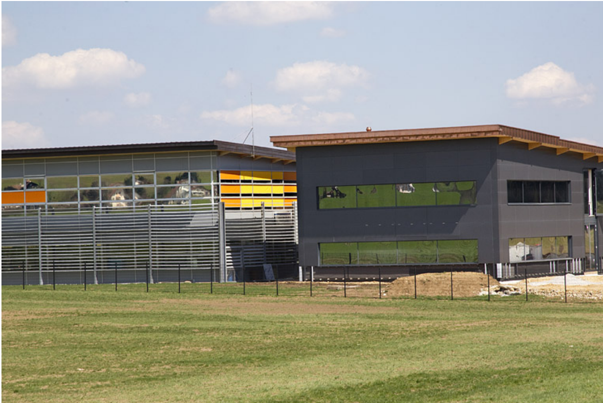
Atelier de 2013 et extrémité de celui de 2002.