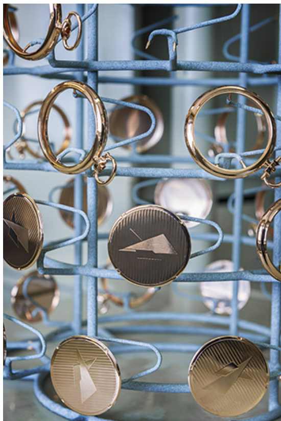
Usine : atelier de galvanoplastie (carrures et fonds de boîtes de montre de gousset). 25, Frambouhans, 4 rue de la Velle