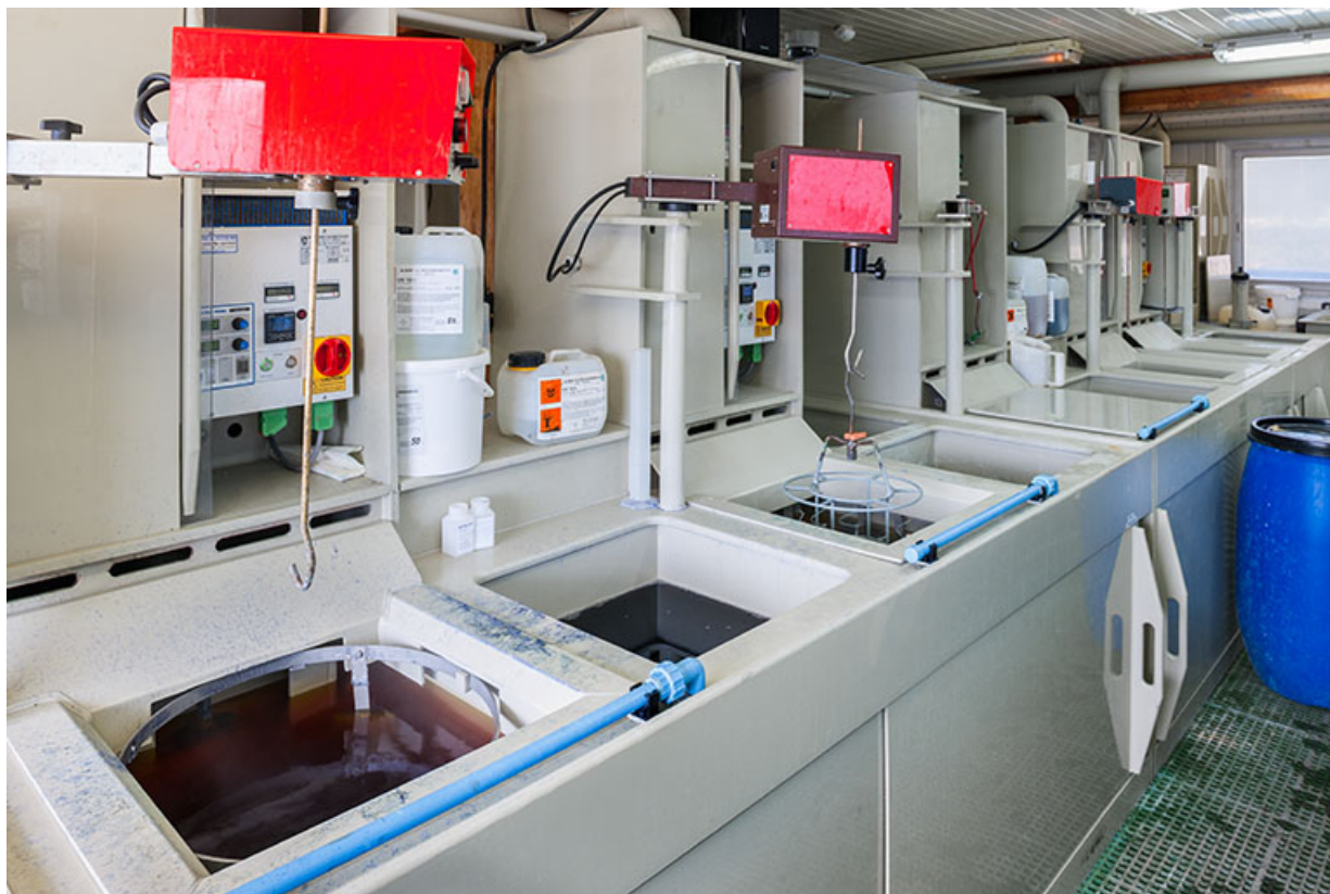
Usine : atelier de galvanoplastie (installations de l'îlot central depuis l'angle est). 25, Frambouhans, 4 rue de la Velle