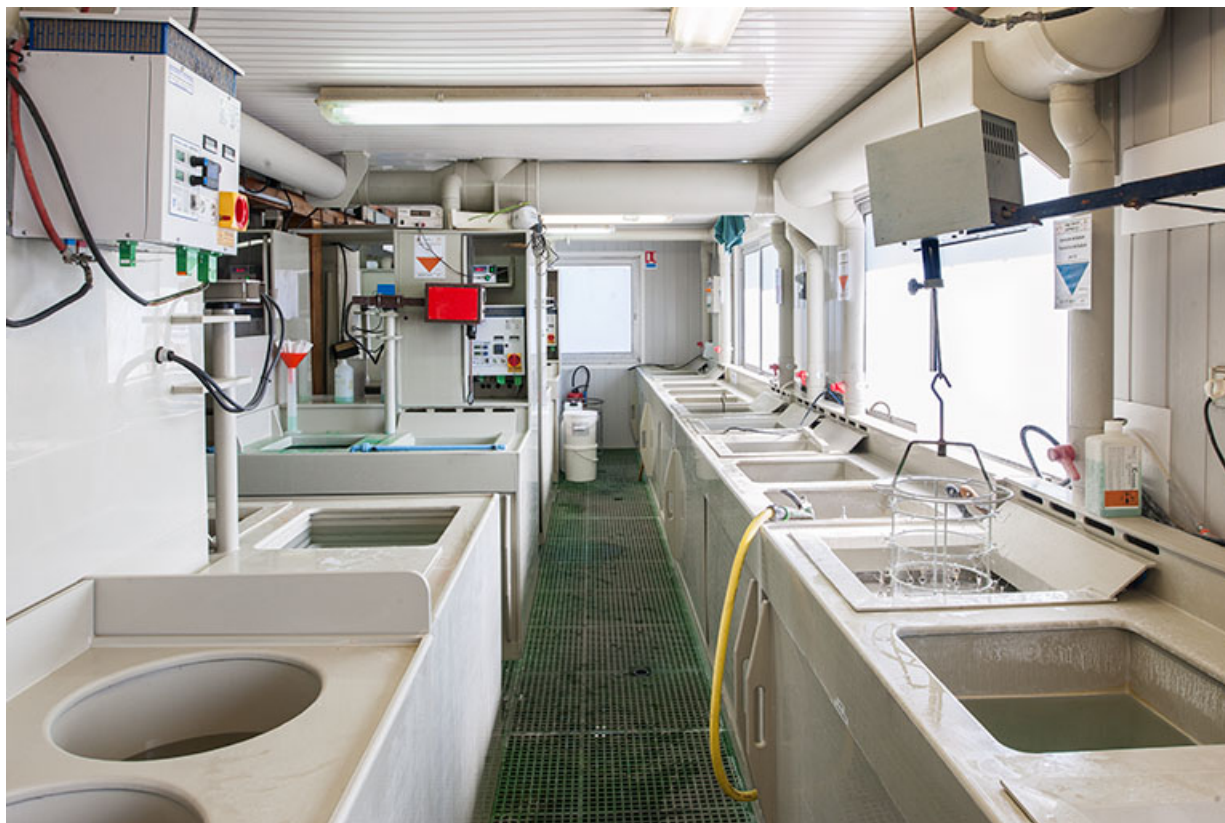
Usine : atelier de galvanoplastie (installations à l'arrière de la façade postérieure). 25, Frambouhans, 4 rue de la Velle