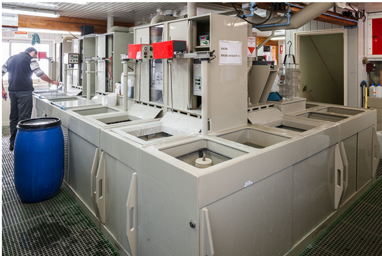
Usine : atelier de galvanoplastie (installations de l'îlot central depuis l'angle nord). 25, Frambouhans, 4 rue de la Velle