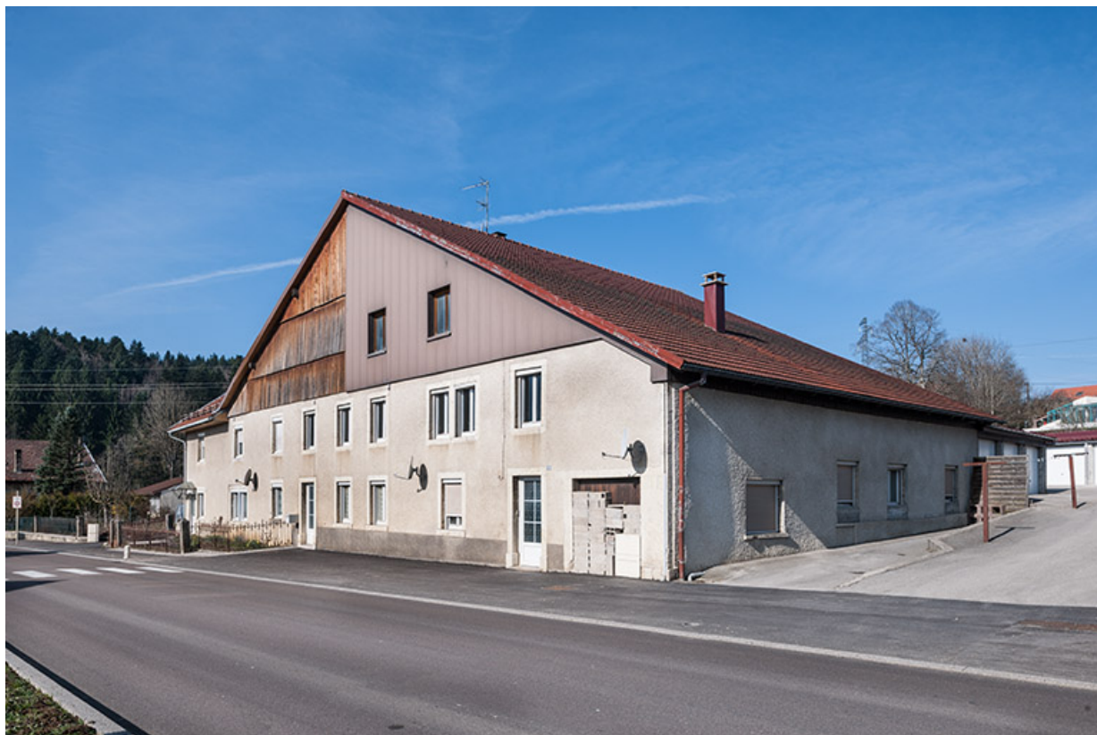
Ferme : façade antérieure, de trois quarts droite.