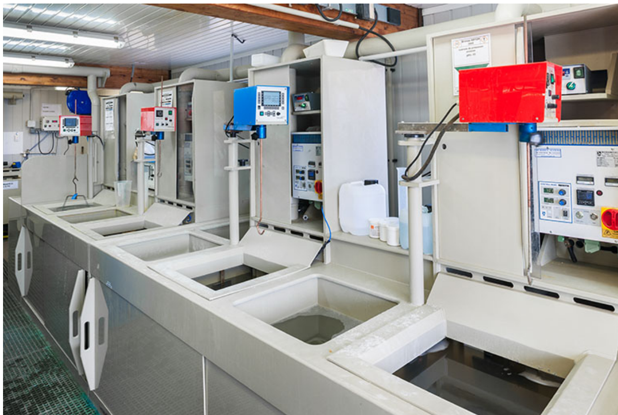
Usine : atelier de galvanoplastie (installations à l'arrière de la façade latérale gauche). 25, Frambouhans, 4 rue de la Velle