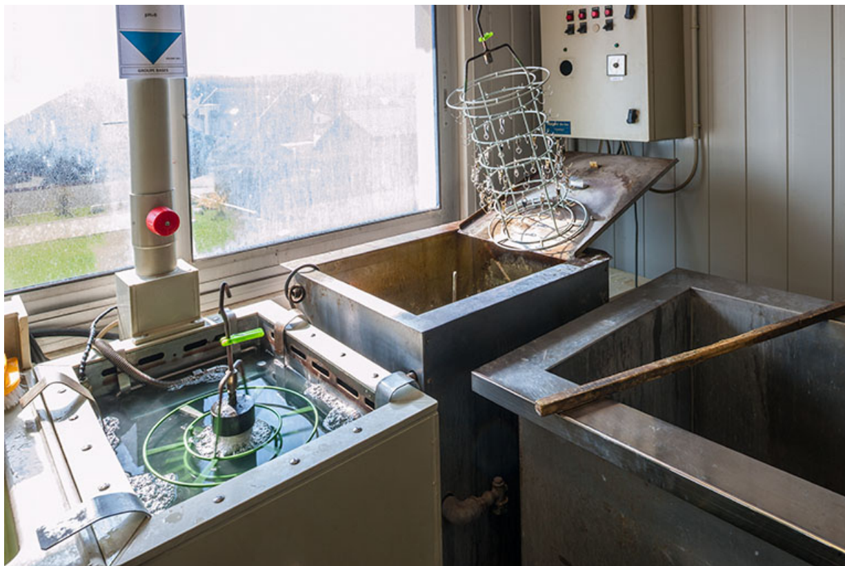
Usine : atelier de galvanoplastie (installations de nettoyage et égouttage). 25, Frambouhans, 4 rue de la Velle