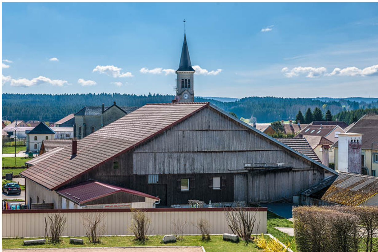
Ferme : façade postérieure.