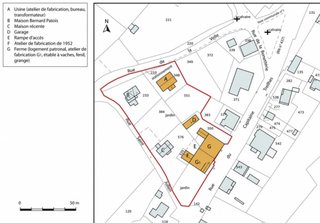
Plan-masse et de situation. Extrait du plan cadastral, 2013, section AC. 25, Frambouhans, 4 rue de la Velle