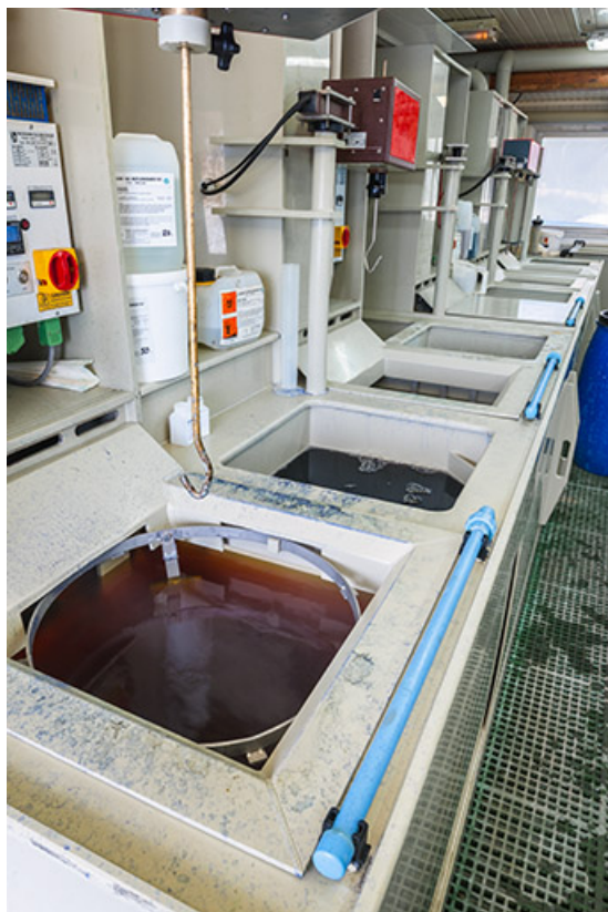
Usine : atelier de galvanoplastie (installations de l'îlot central depuis l'angle est). 25, Frambouhans, 4 rue de la Velle