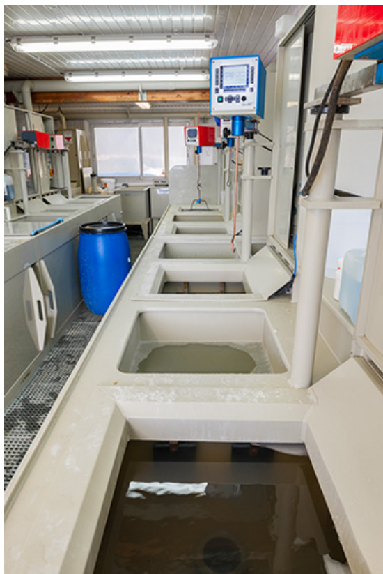
Usine : atelier de galvanoplastie (installations à l'arrière de la façade latérale gauche). 25, Frambouhans, 4 rue de la Velle