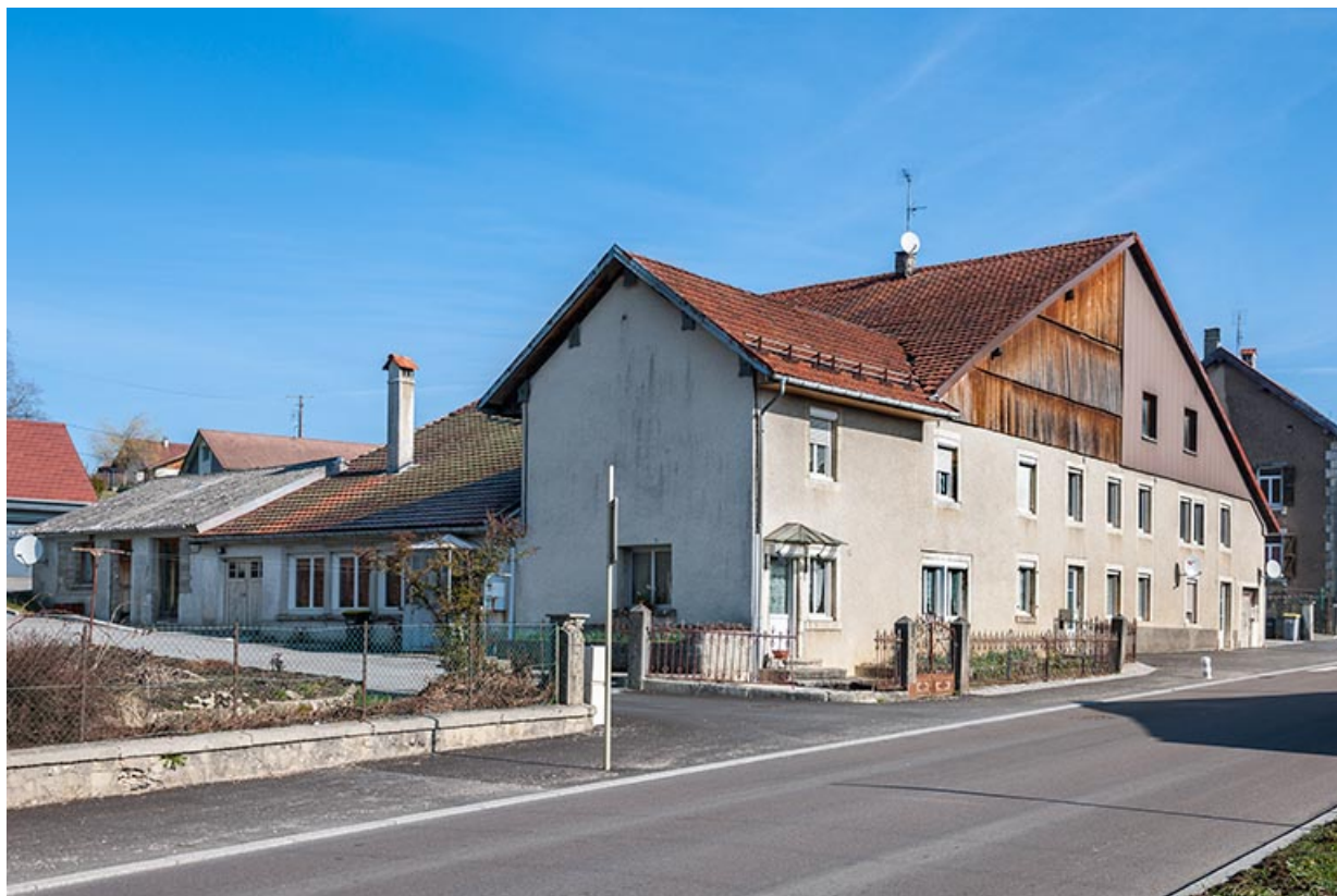
Ferme : vue d'ensemble, depuis le sud. L'atelier de galvanoplastie occupait la partie gauche des bâtiments. 25, Frambouhans, 4 rue de la Velle