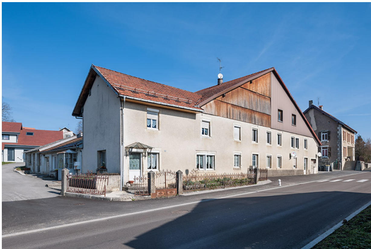
Ferme : façade antérieure, de trois quarts gauche.