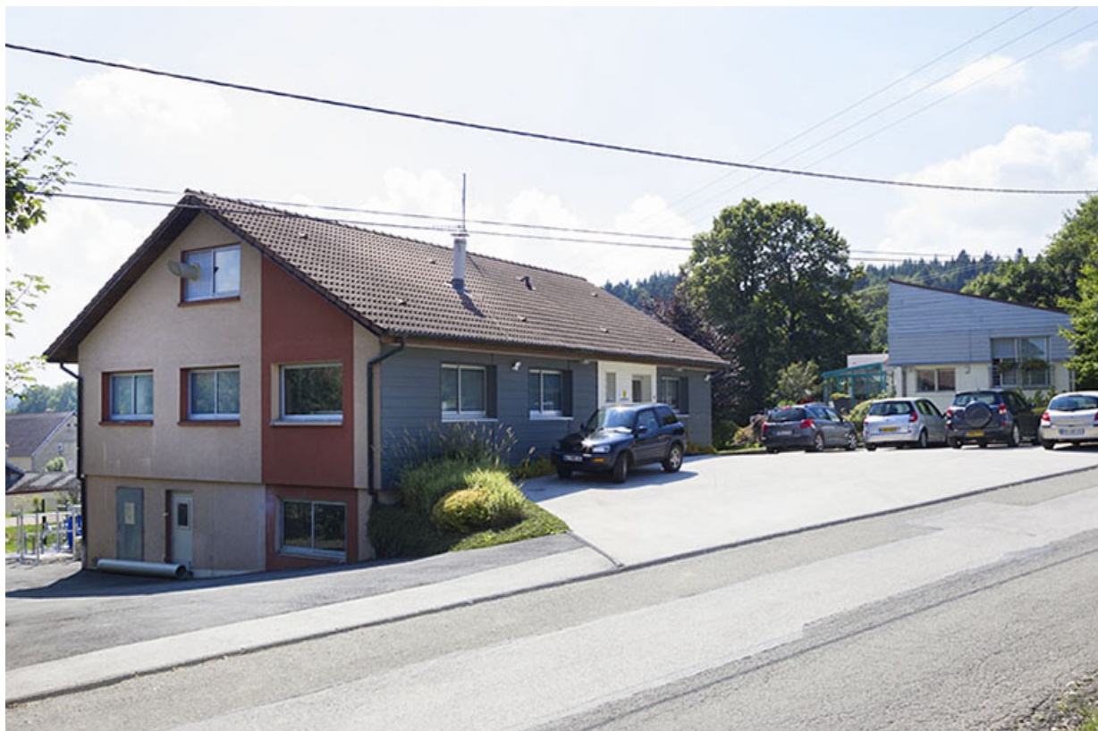
Usine : façade antérieure.