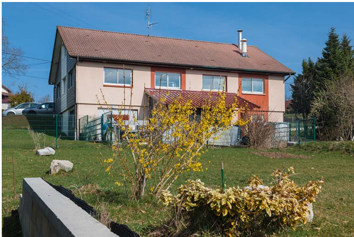
Usine : façade postérieure.