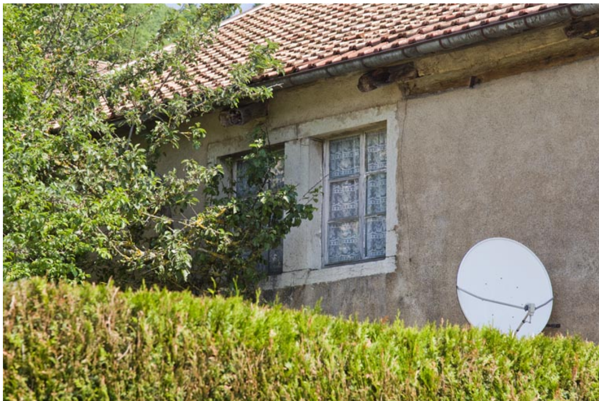
Fenêtre double sur la façade latérale gauche.