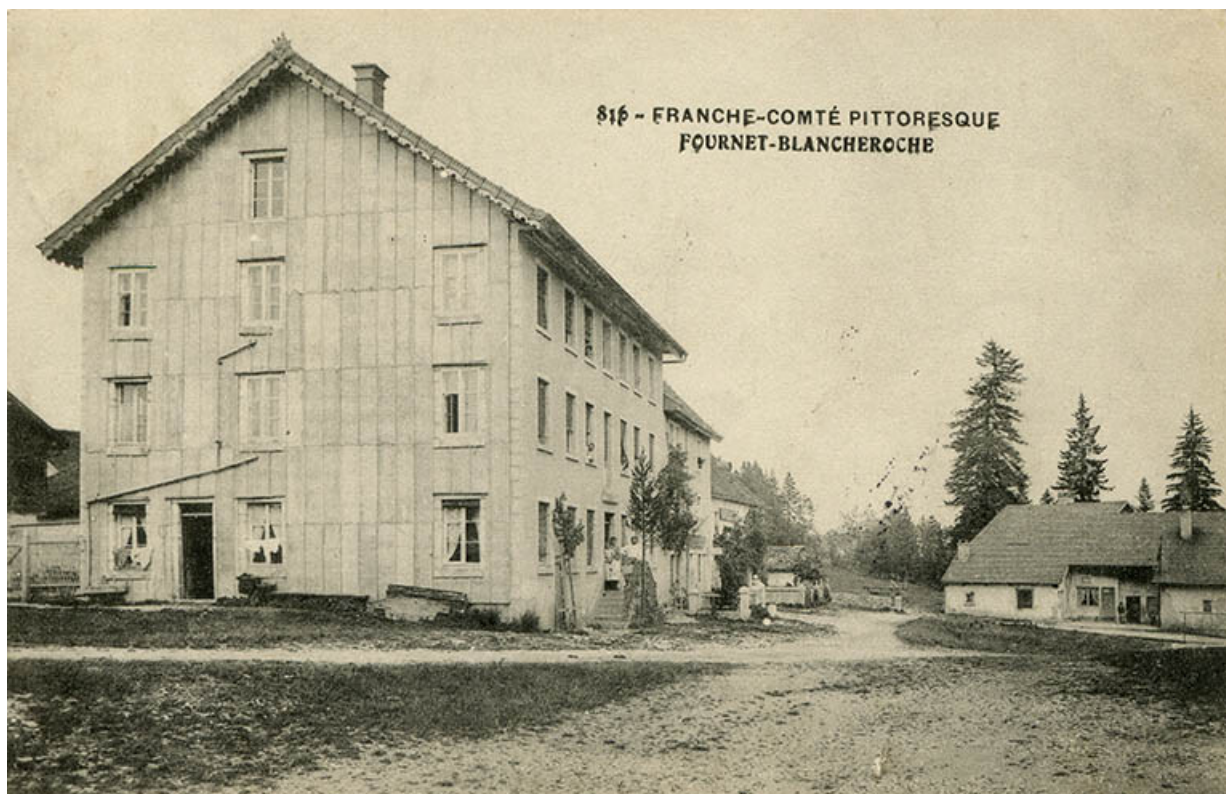
816 - Franche-Comté pittoresque. Fournet-Blancheroche, limite 19e siècle 20e siècle (avant 1908).

25, Fournet-Blancheroche, 6 place François Joubert