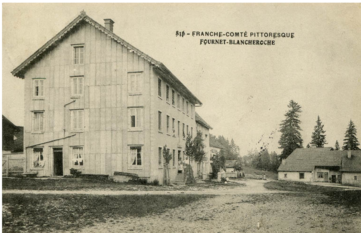
816 - Franche-Comté pittoresque. Fournet-Blancheroche, limite 19e siècle 20e siècle (avant 1908). 25, Fournet-Blancheroche, 6 place François Joubert