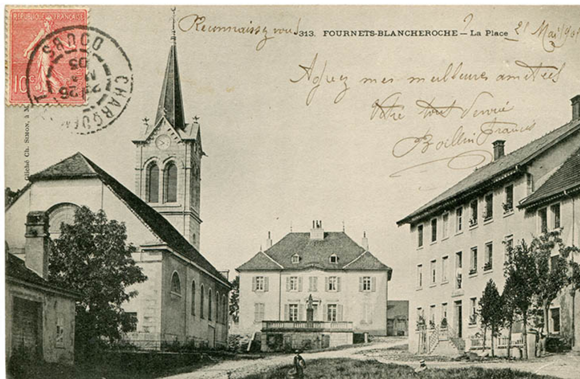
313. Fournets-Blancheroche - La Place [vue d'ensemble rapprochée de trois quarts droite], limite 19e siècle 20e siècle [avant 1905]. 25, Fournet-Blancheroche, 6 place François Joubert