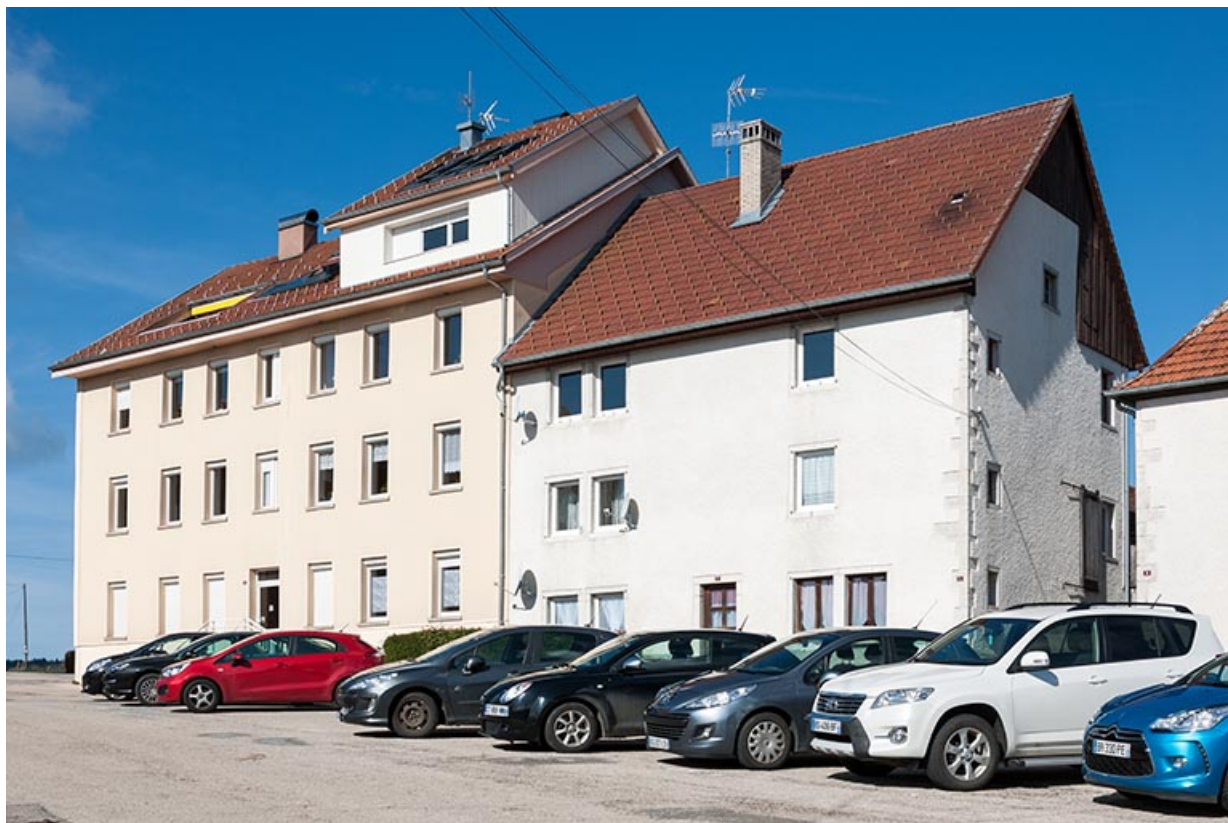
Vue d'ensemble, de trois quarts droite (la "Grande Maison" est à gauche).

25, Fournet-Blancheroche, 6 place François Joubert