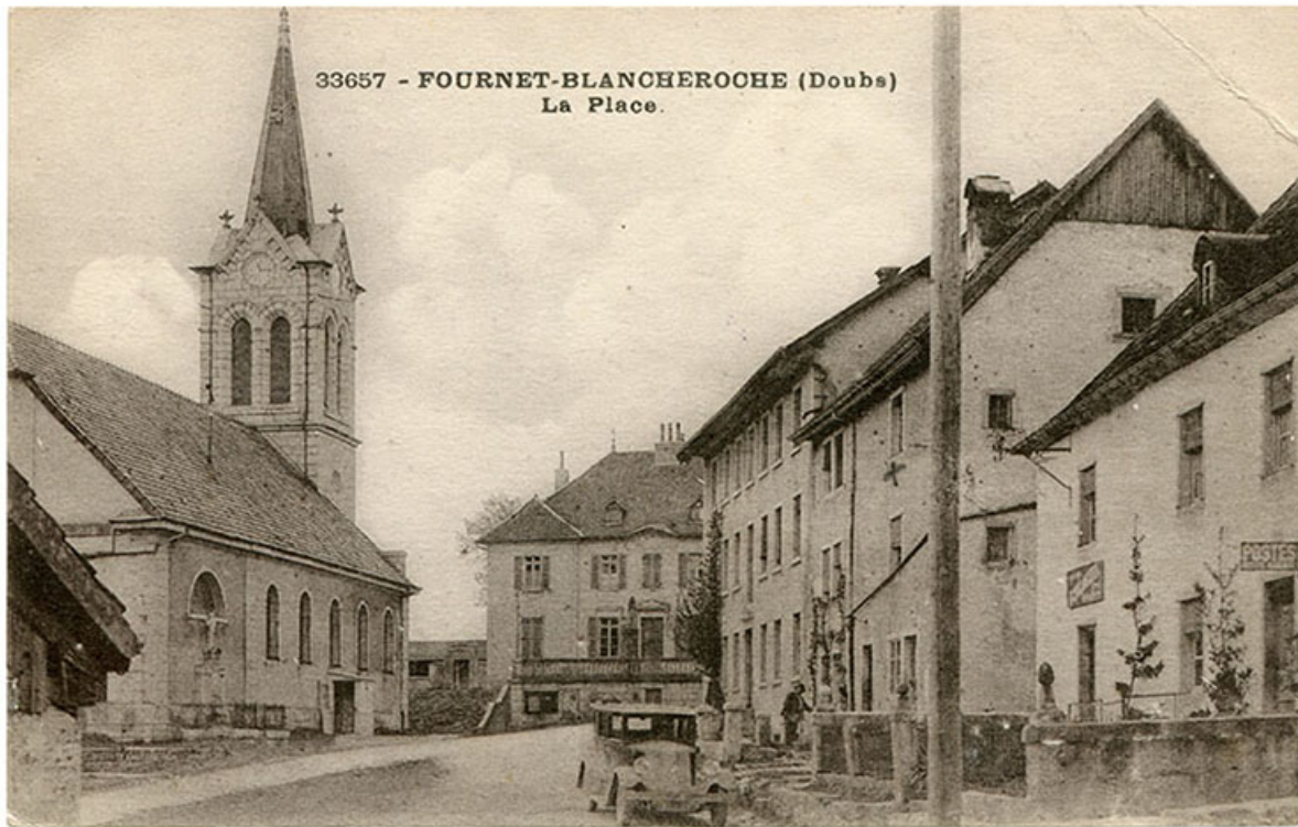
33657 - Fournet-Blancheroche (Doubs). La Place [vue d'ensemble de trois quarts droite], 1ère moitié 20e siècle [avant 1938]. 25, Fournet-Blancheroche, 6 place François Joubert

33657 - Fournet-Blancheroche (Doubs). La Place, carte postale, s.n., [1ère moitié 20e siècle, avant 1938], C. Lardier éd. à Besançon. Porte la date 12 juillet 1938 au verso.