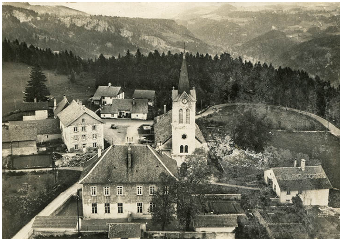
En avion au-dessus de... 1. Fournet-Blancheroche (Doubs). L'église, années 1950 (avant 1961). 25, Fournet-Blancheroche, 6 place François Joubert

En avion au-dessus de... 1. Fournet-Blancheroche (Doubs). L'église, carte postale, s.n., [années 1950, avant 1961], Lapie éd. à Saint-Maur. Porte la date 20 février 1961 au verso.