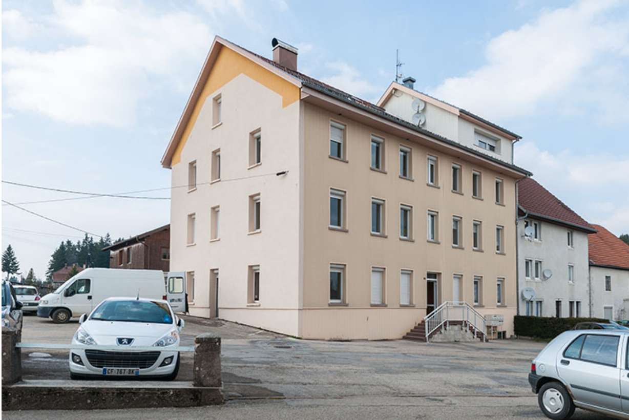
Vue d'ensemble, de trois quarts gauche.

25, Fournet-Blancheroche, 6 place François Joubert