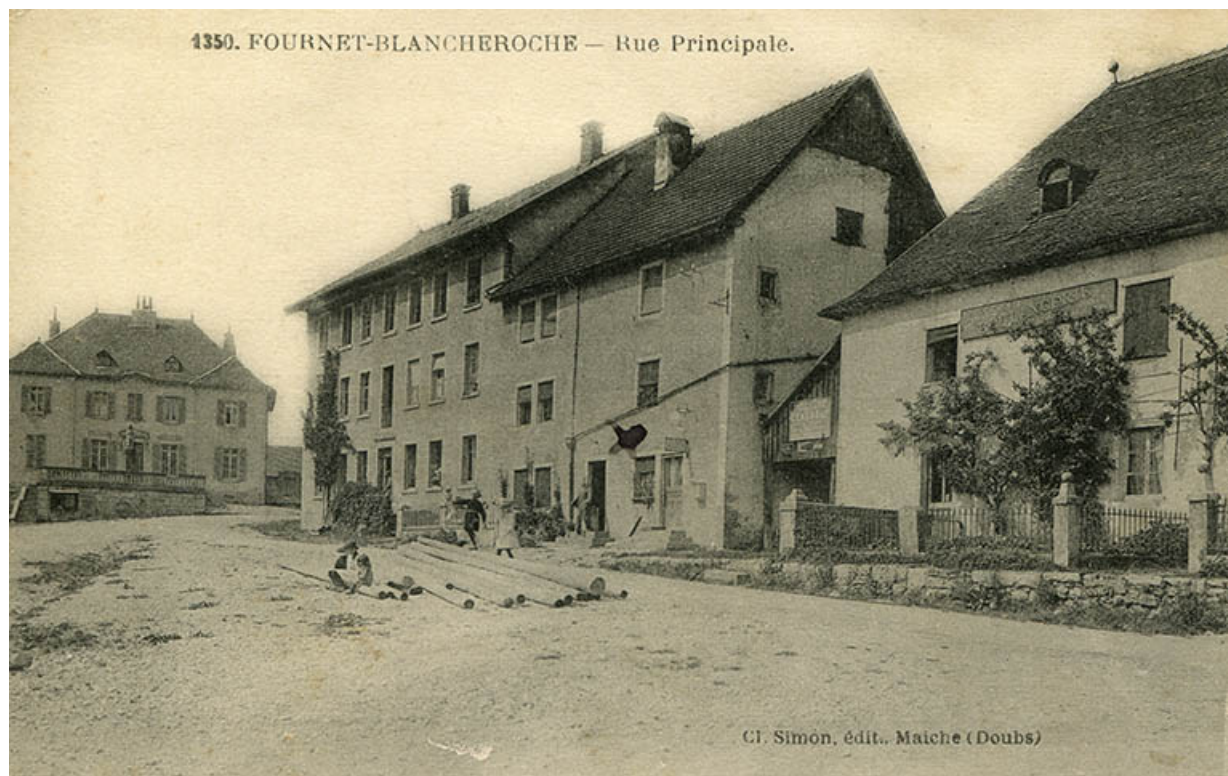
1350. Fournet-Blancheroche - Rue Principale, limite 19e siècle 20e siècle.

25, Fournet-Blancheroche, 6 place François Joubert