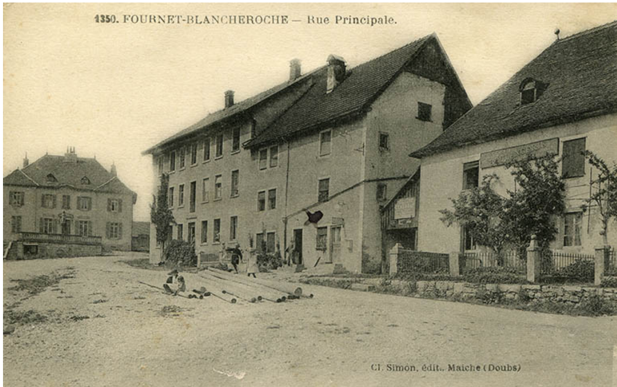
1350. Fournet-Blancheroche - Rue Principale, limite 19e siècle 20e siècle.

25, Fournet-Blancheroche, 6 place François Joubert