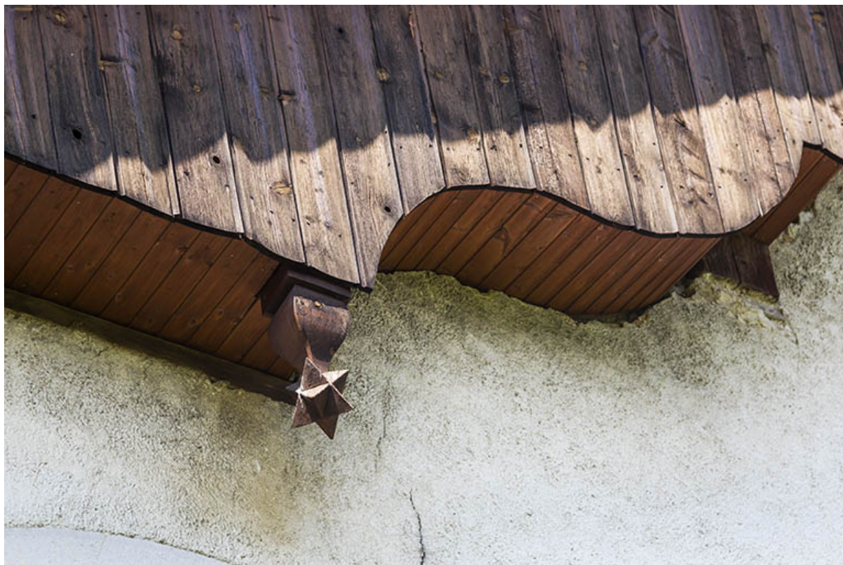
Façade est : motif décoratif ornant l'extrémité pendante d'un poteau de la lambrichure. 25, Les Écorces, 17 et 17 bis Grande Rue