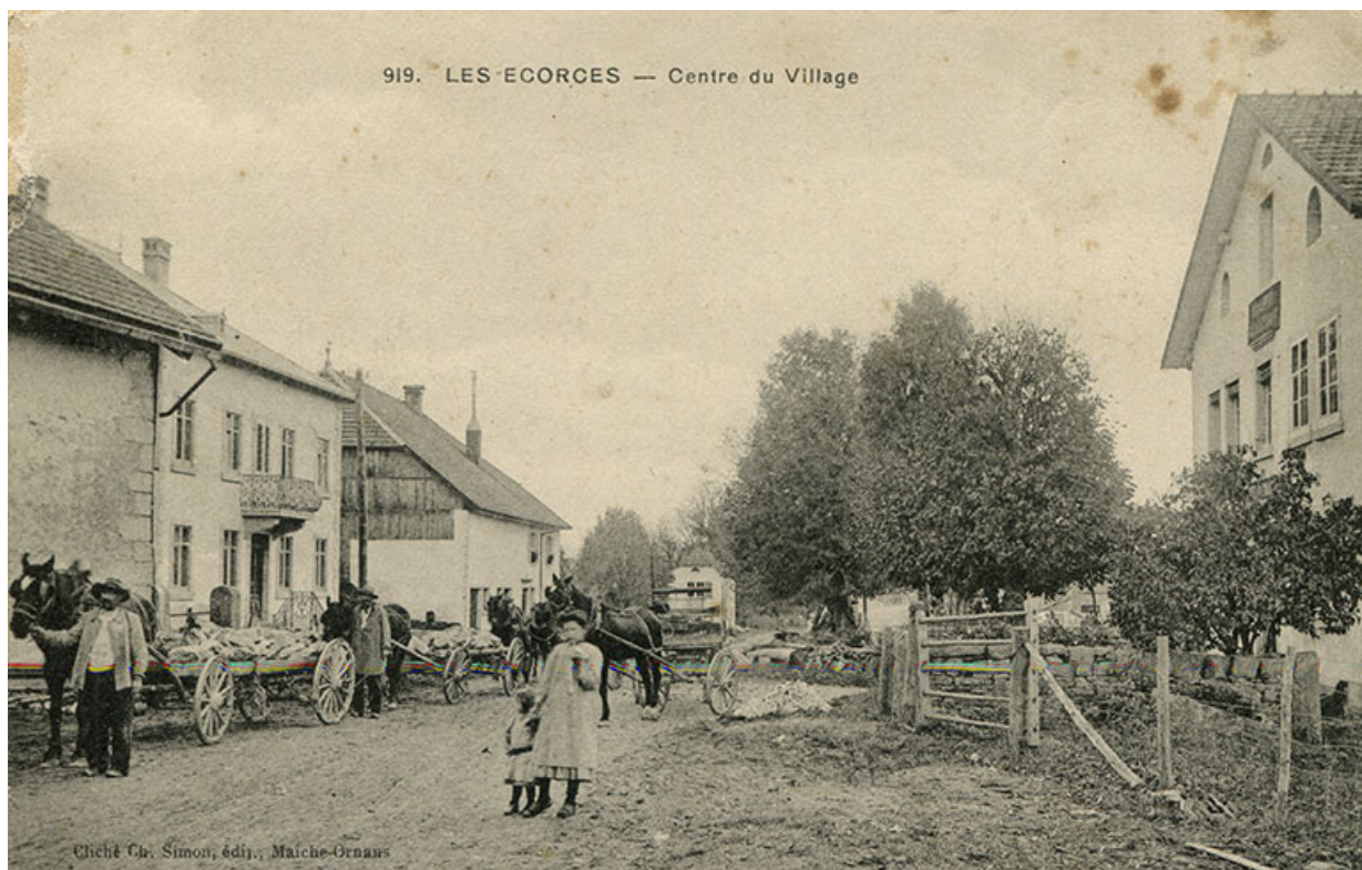
919. Les Ecorces - Centre du Village [façade antérieure, de trois quarts droite], 1er quart 20e siècle. 25, Les Écorces, 8 Grande Rue