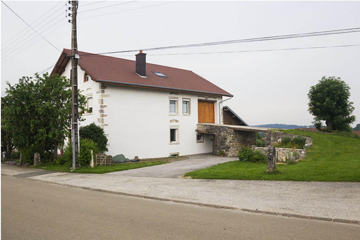
Façade latérale droite et pont de grange.