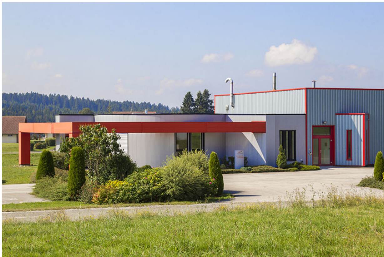
Façade antérieure : bureaux et entrée.