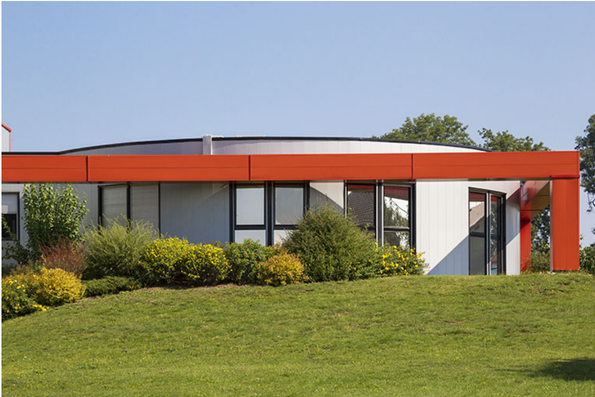
Façade postérieure : bureaux.