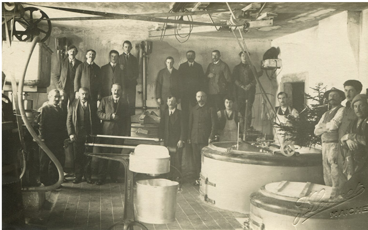
Les Écorces : inauguration de la fromagerie en 1929 [vue intérieure]. 25, Les Écorces, 2 rue des Vies