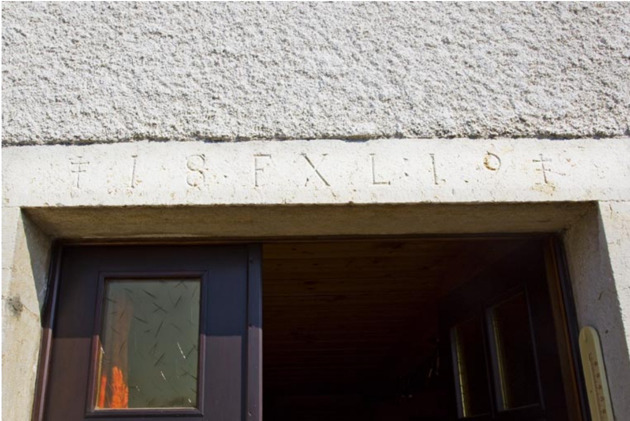
Linteau de la porte principale de l'habitation, portant la date 1819.