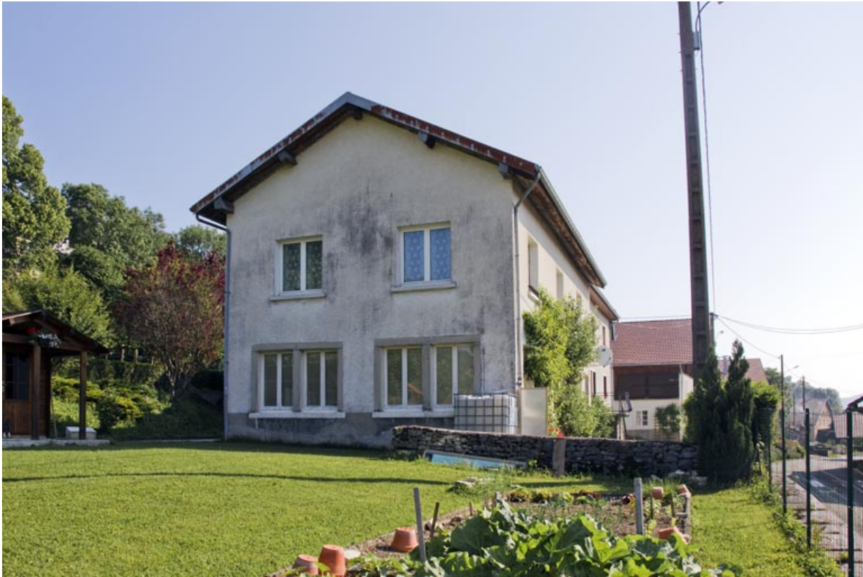
Façade latérale gauche de l'atelier.