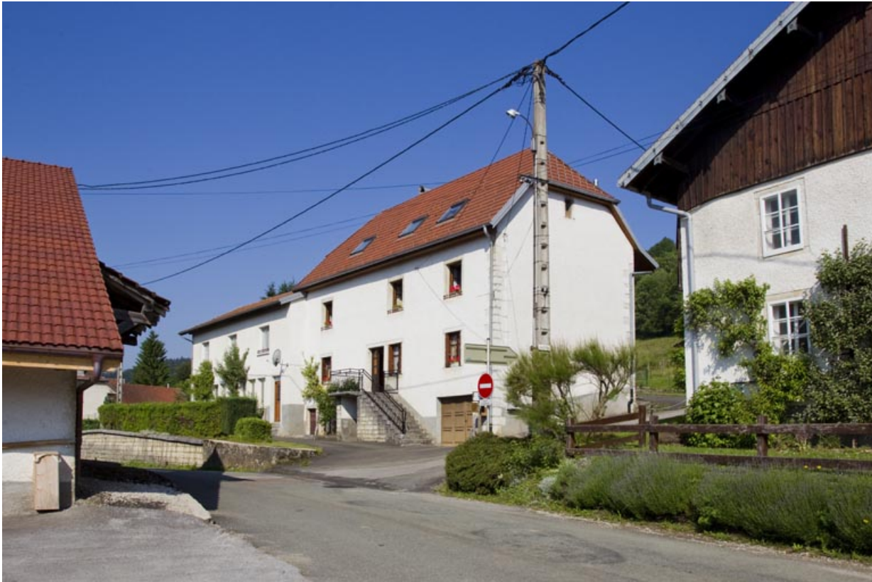
Vue d'ensemble depuis l'est.