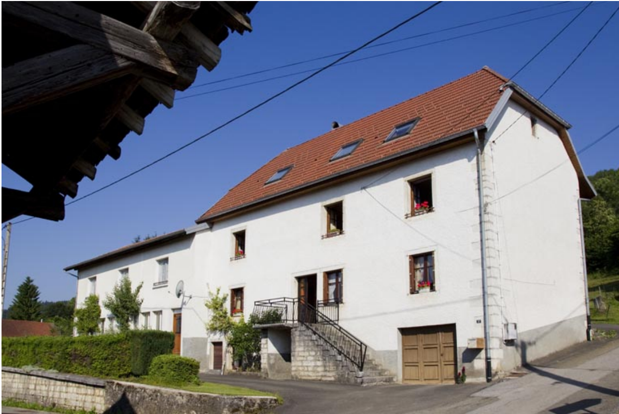
Façade antérieure de trois quarts droite.