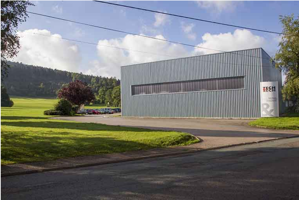
Entrée du site, au nord.