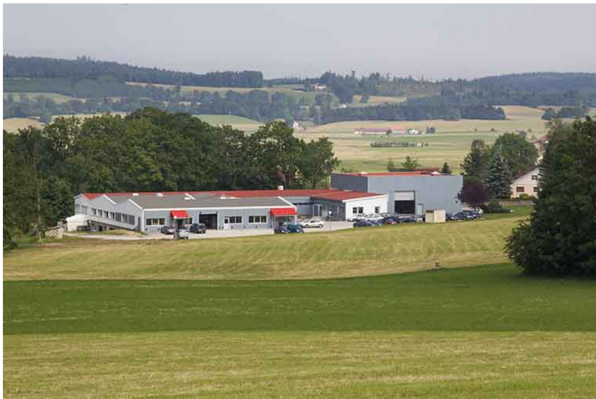
Vue d'ensemble depuis le sud. 25, Damprichard, 13 rue du Prélôt