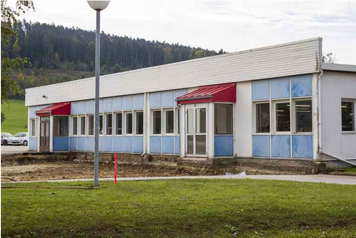
L'entrée, avant l'extension de 2013.