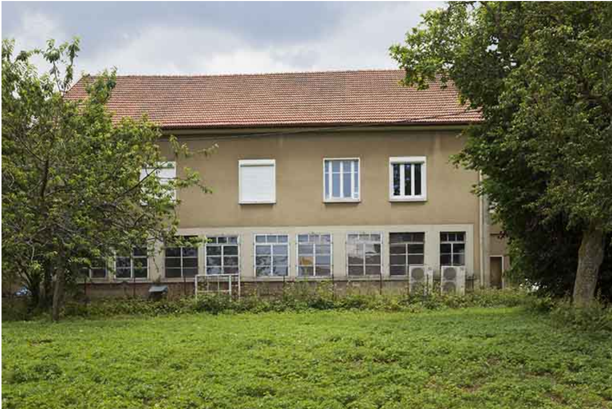
Façade postérieure, depuis l'usine Henri Bourgeois au nord-ouest.