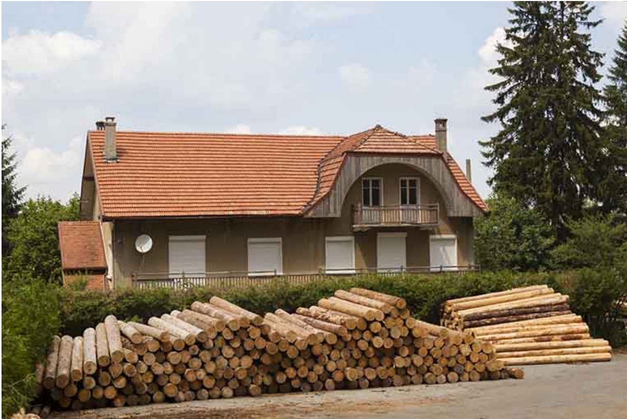
Façade antérieure, depuis la scierie Buliard au sud-est.