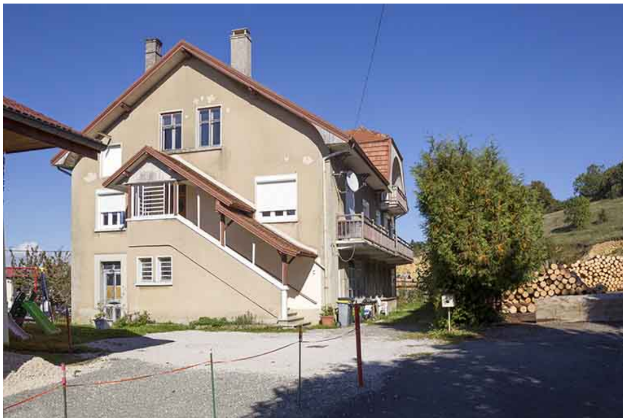
Vue d'ensemble depuis la rue de l'Industrie.