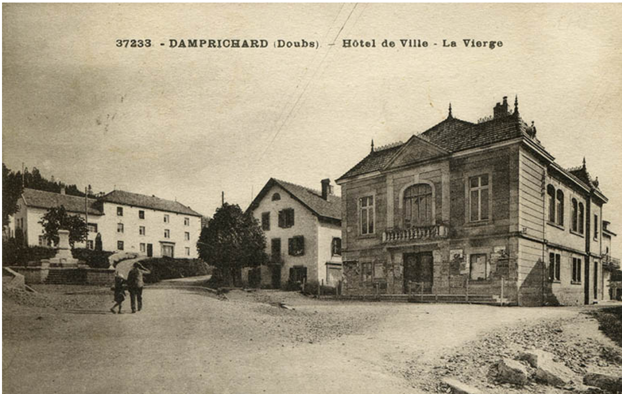
37233 - Damprichard (Doubs) - Hôtel de Ville - La Vierge [et l'usine Burdet], 1ère moitié 20e siècle (entre 1912 et 1935). 25, Damprichard, 1 rue du Maréchal Leclerc