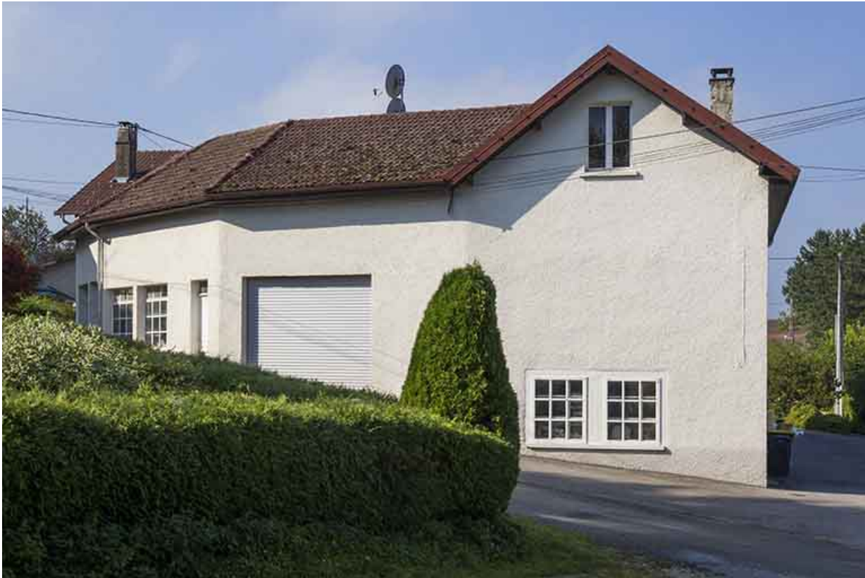
Façade latérale gauche.

25, Damprichard, 1 rue du Maréchal Leclerc