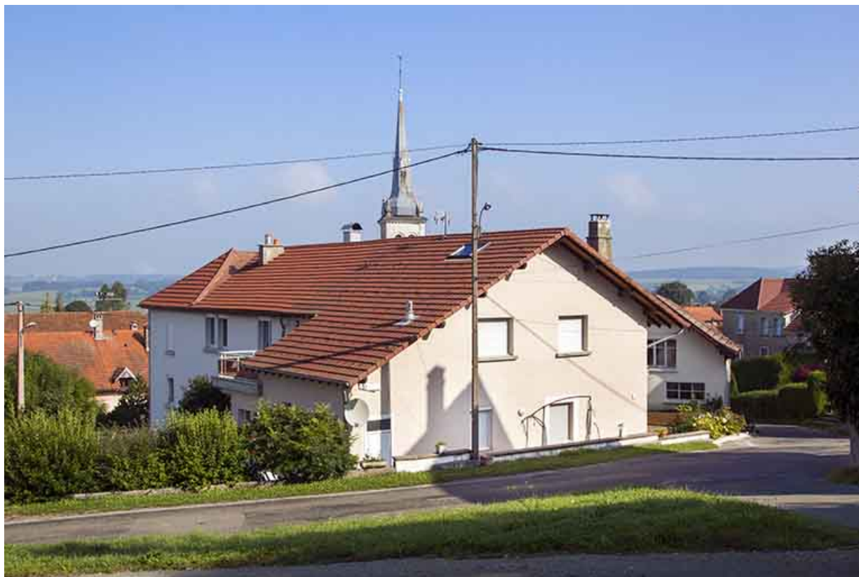
Façades postérieure et latérale droite.

25, Damprichard, 1 rue du Maréchal Leclerc