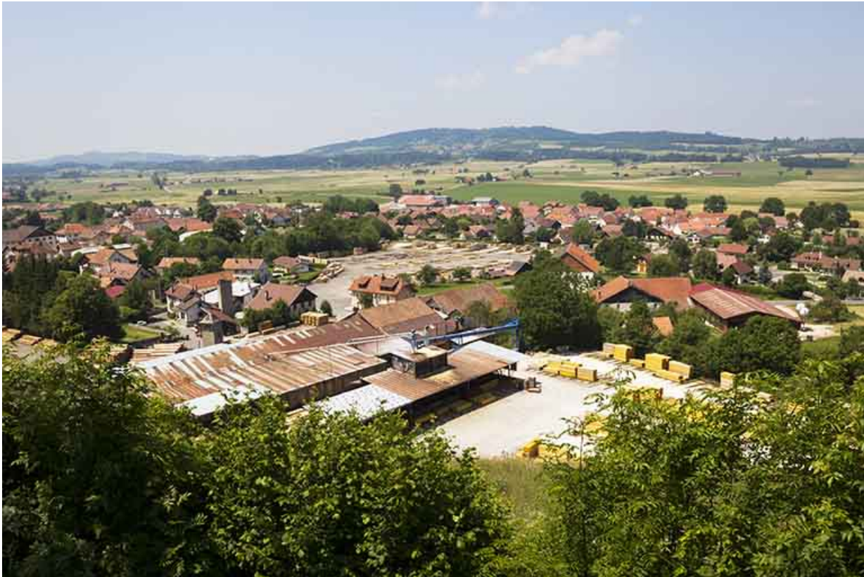
Vue d'ensemble plongeante, depuis l'est (ateliers de fabrication et bureau). 25, Damprichard, 14 rue du Professeur Grammont