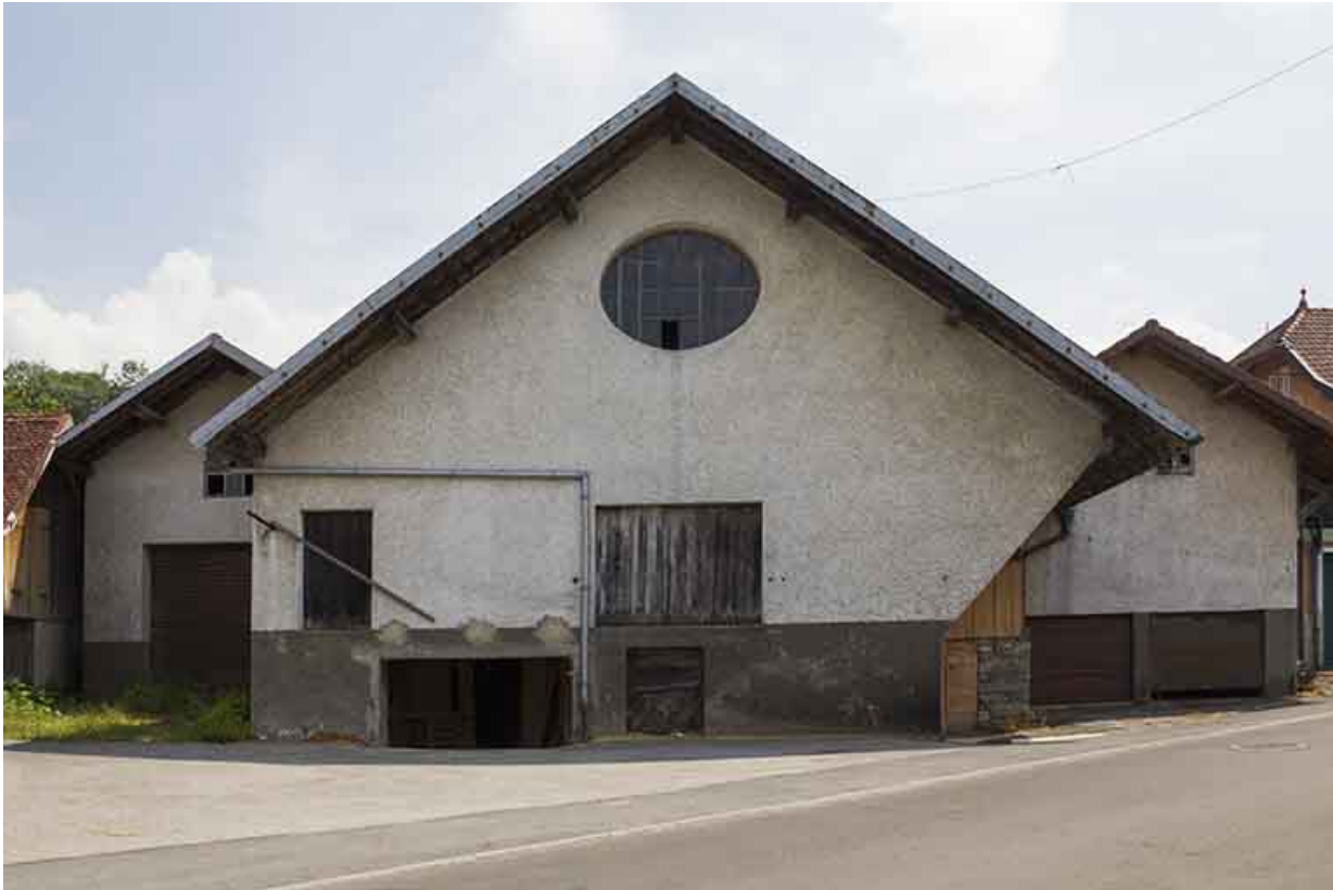
Atelier de fabrication et stockage de sicure. 25, Damprichard, 14 rue du Professeur Grammont