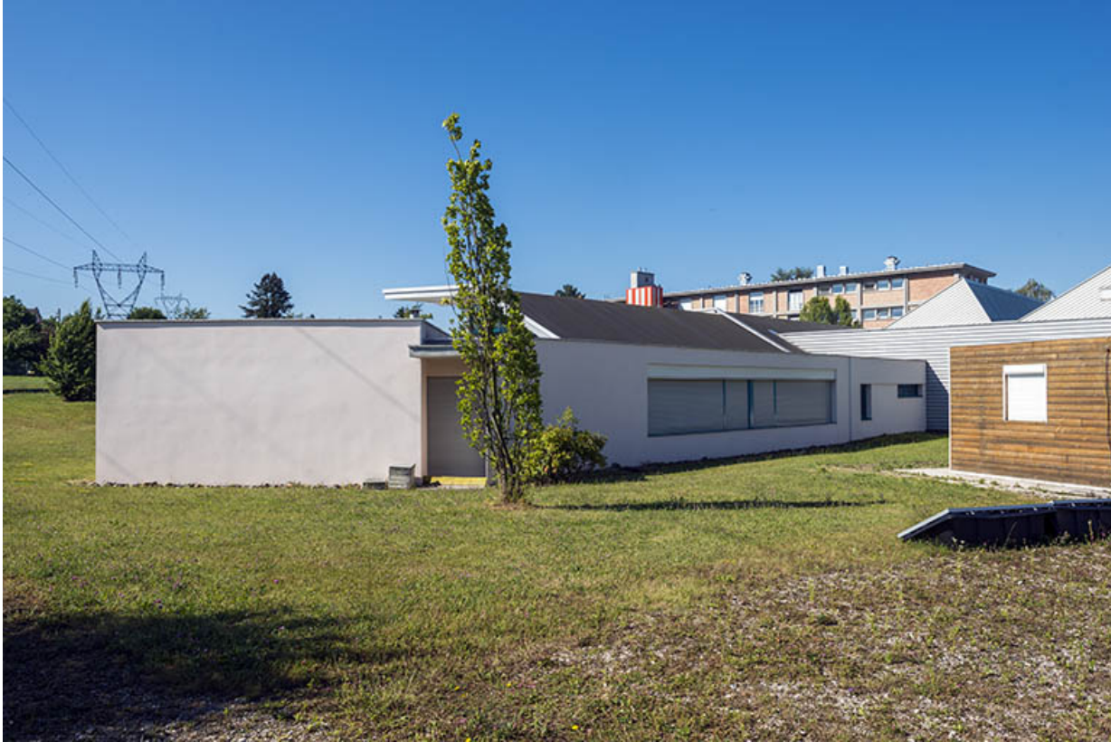
Façade postérieure nord de la plasturgie. (ex-Léger)