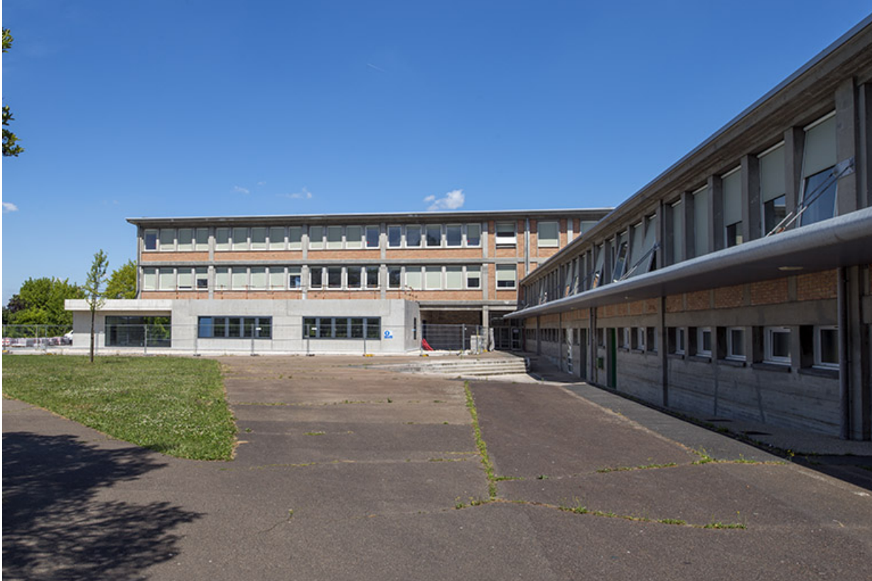
Façades antérieures des bâtiments d'externat, des ateliers et de l'administration. (ex.Léger)