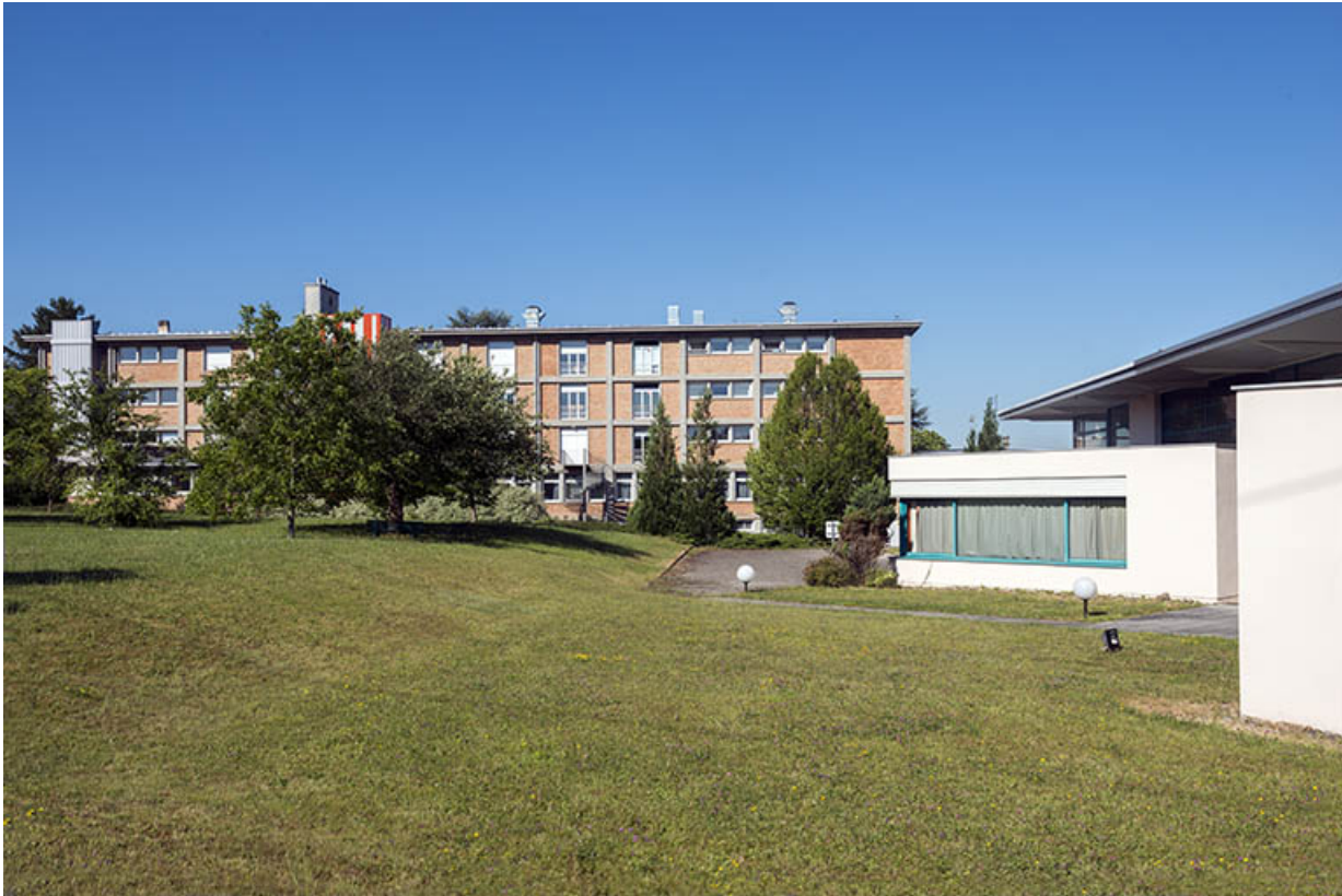
Façade postérieure de l'aile nord du bâtiment d'internat, logement, restauration et détail façades sud des bâtiments de plasturgie. (ex-Léger)