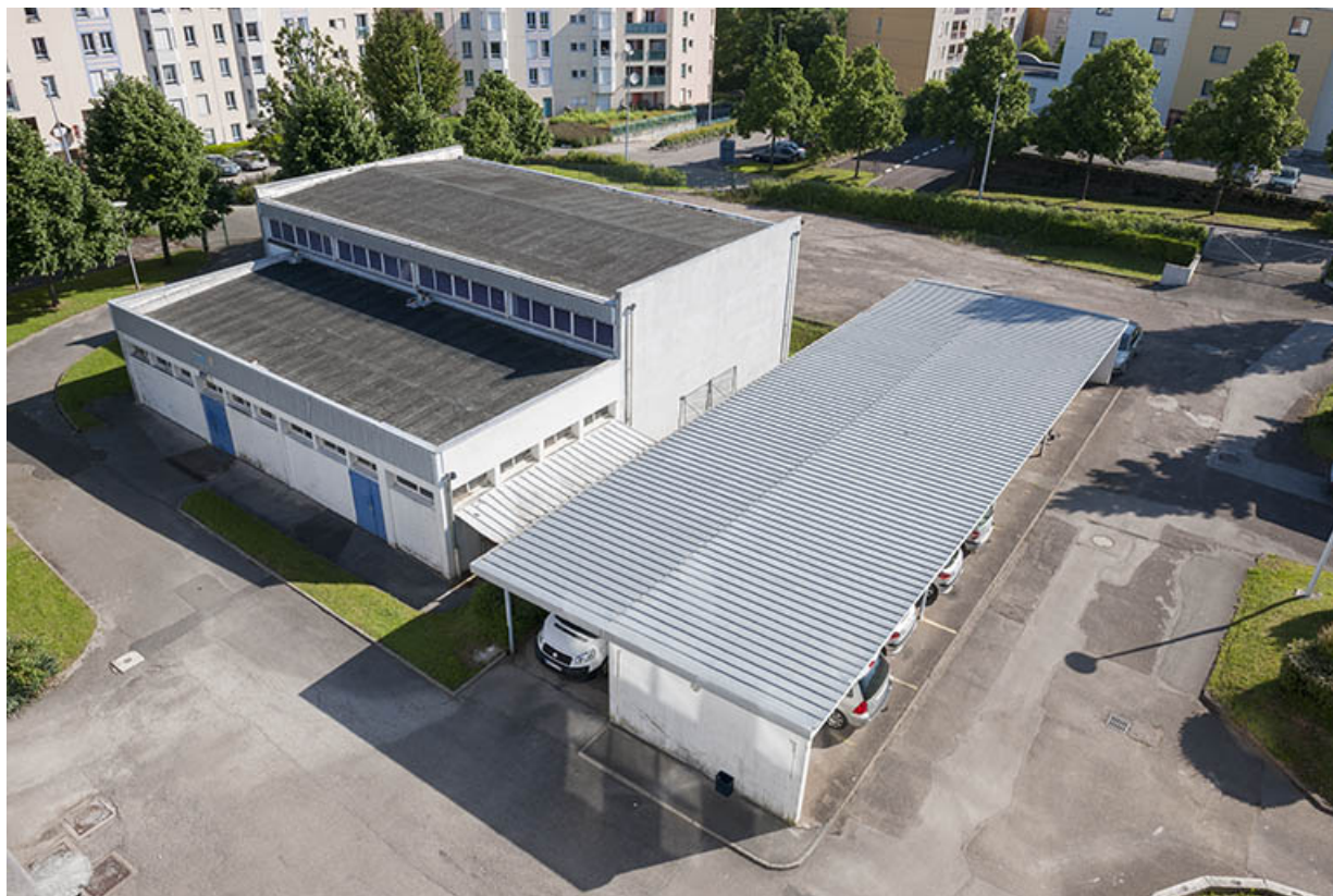
Angle sud des gymnase et garage 25, Besançon, 13 rue Goya