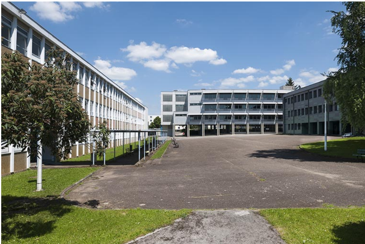
La cour depuis l'ouest, face au bâtiment d'enseignement professionnel. 25, Besançon, 13 rue Goya