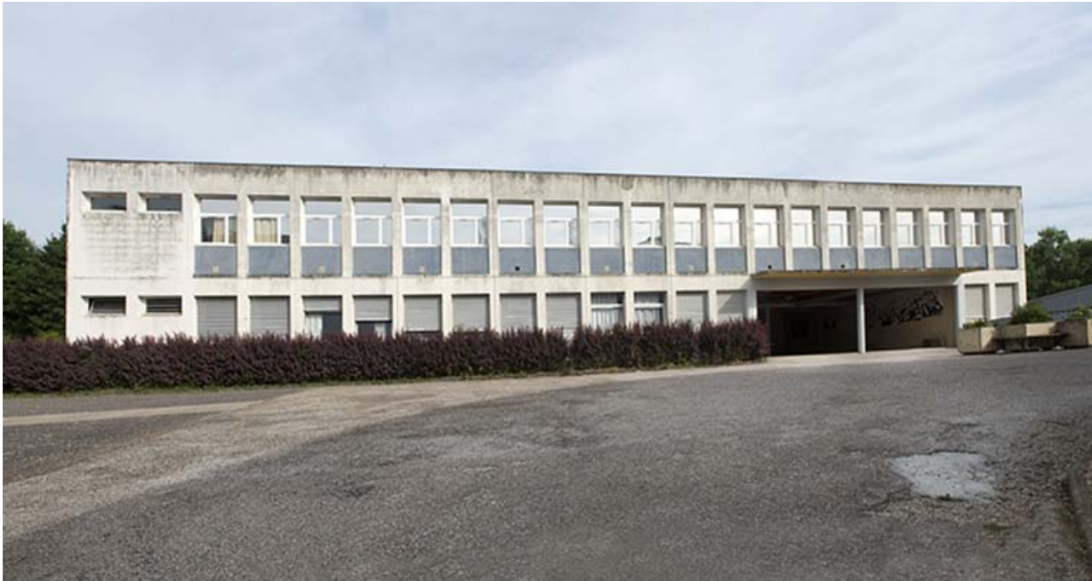
Façade sud-est de l'externat et préau.