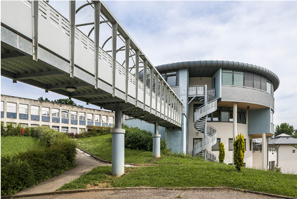
Vue d'ensemble de l'externat, la passerelle, l'escalier et la tour, les ateliers.