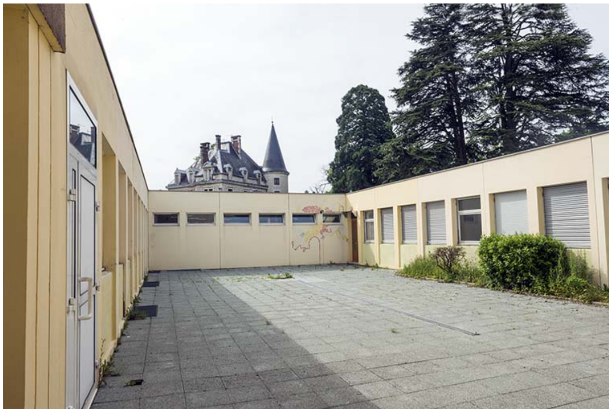
Cour de l'internat et cantine.