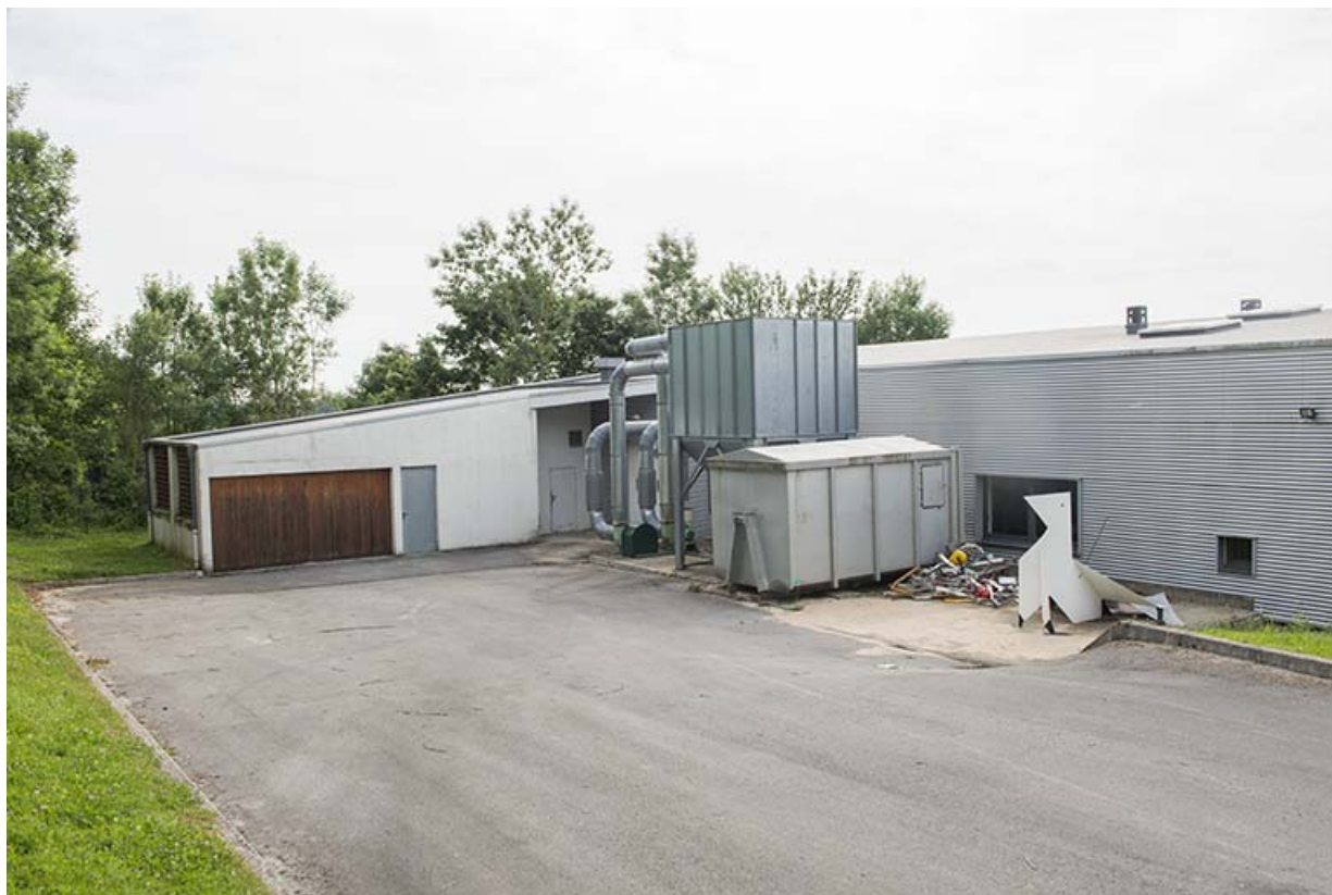
Angle nord de la parcelle, façade postérieure des ateliers.