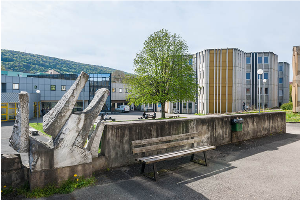
Face postérieure de l'oeuvre de Jean Gilles.