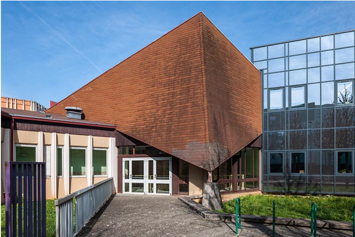
Détail de toiture du bâtiment de l'administration et centre de documentation et d'information (cdi). 25, Besançon, 1 rue Rembrandt