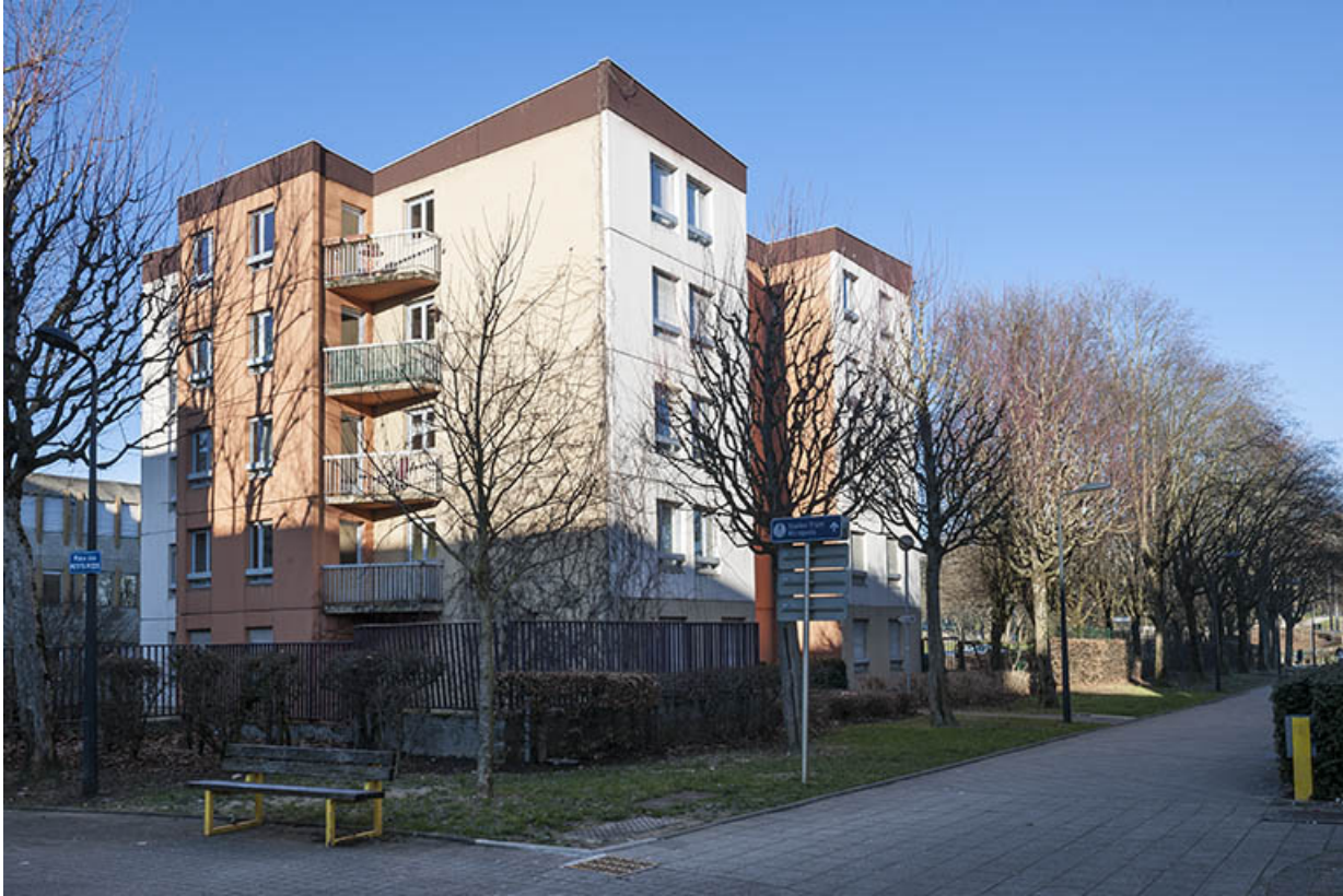
Angle est des logements depuis la rue Renoir et la place des petits pieds, à l'est. 25, Besançon, 1 rue Rembrandt