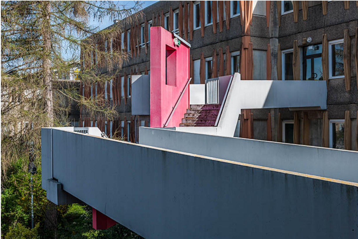
Détail de la passerelle et escalier devant l'externat d'enseignement scientifique et tertiaire. 25, Besançon, 1 rue Rembrandt