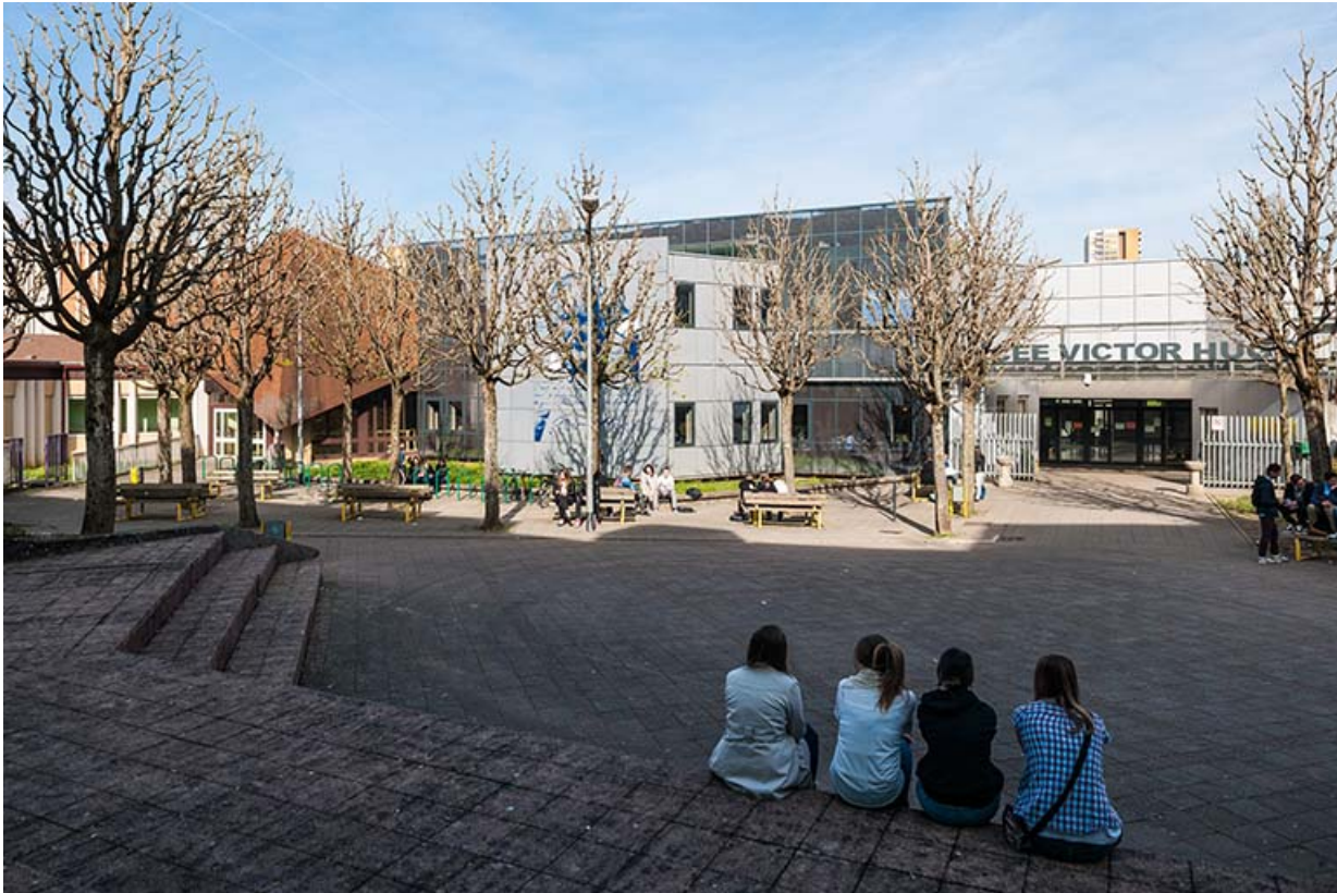
L'entrée, vue de la place devant le lycée.