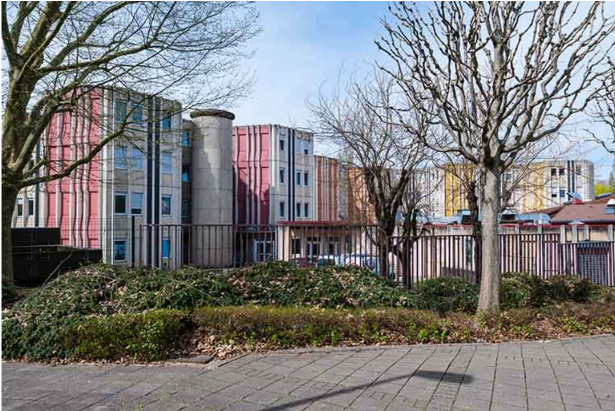
Les internats et la cantine, vus de l'extérieur, au sud.