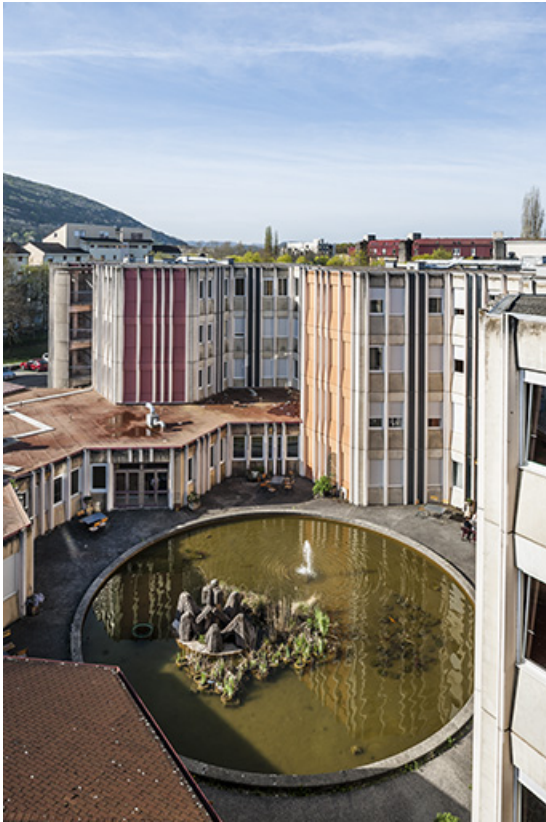
bassin : vue d'ensemble de l'œuvre d'Annie Bleu.