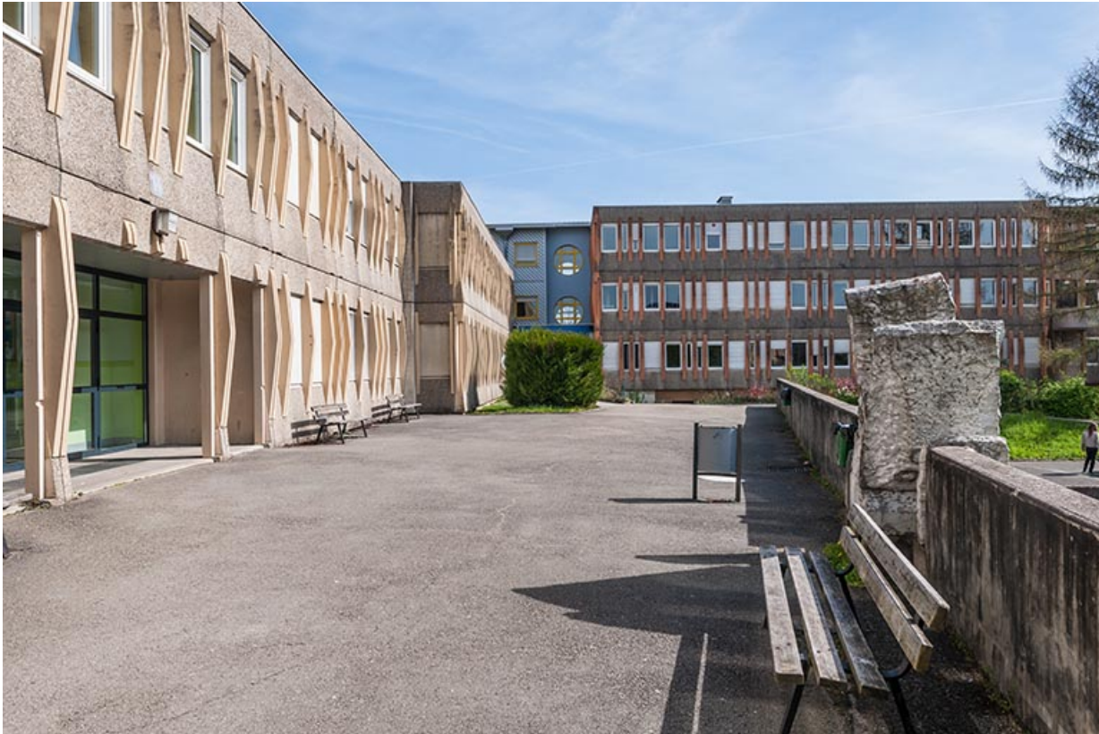
Au nord-est de la cour, le long des ateliers - externats.