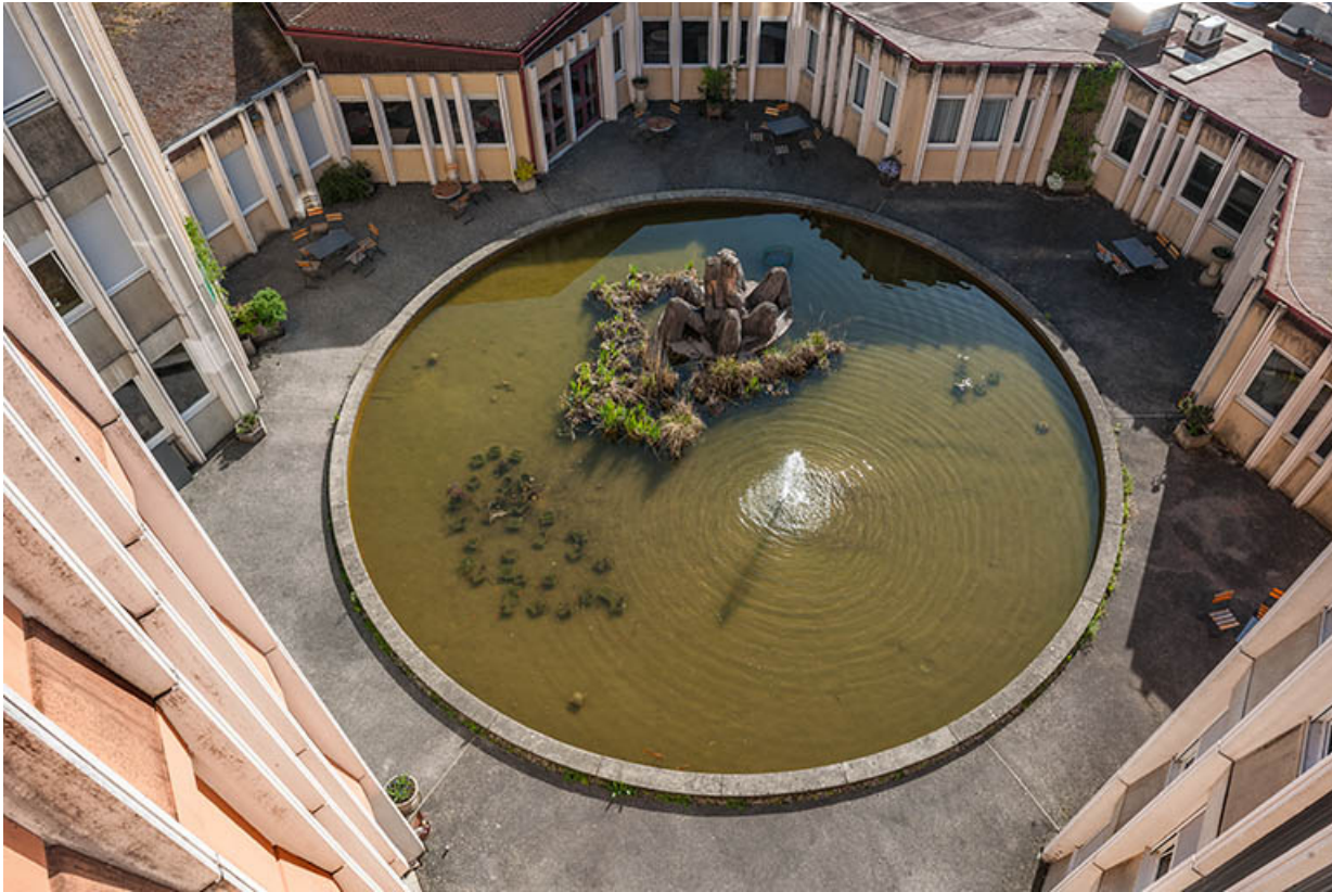
Vue plongeante sur le bassin et la sculpture d'Annie Bleu.