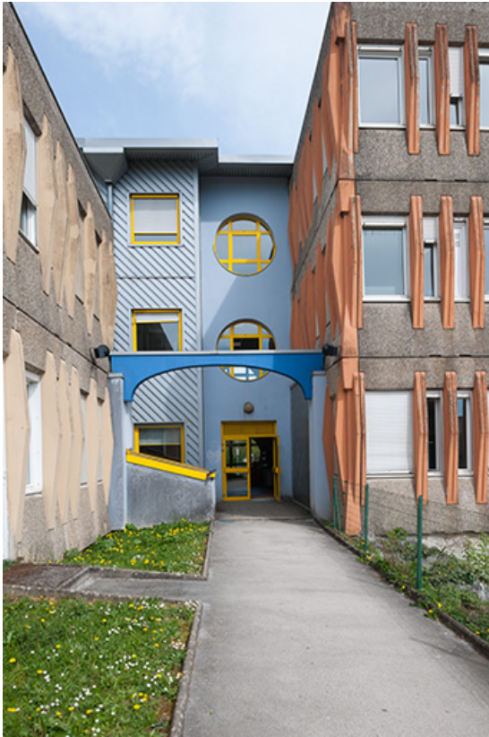
Au nord-est de la cour, l'entrée du bâtiment des classes préparatoires aux grandes écoles. 25, Besançon, 1 rue Rembrandt