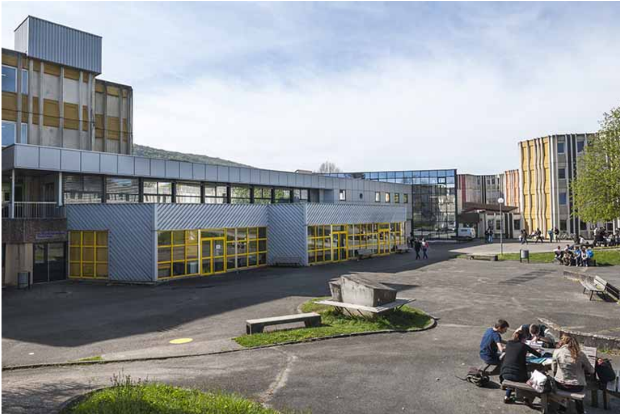
La cour, devant la façade de l'externat avec sa machinerie d'ascenseur.