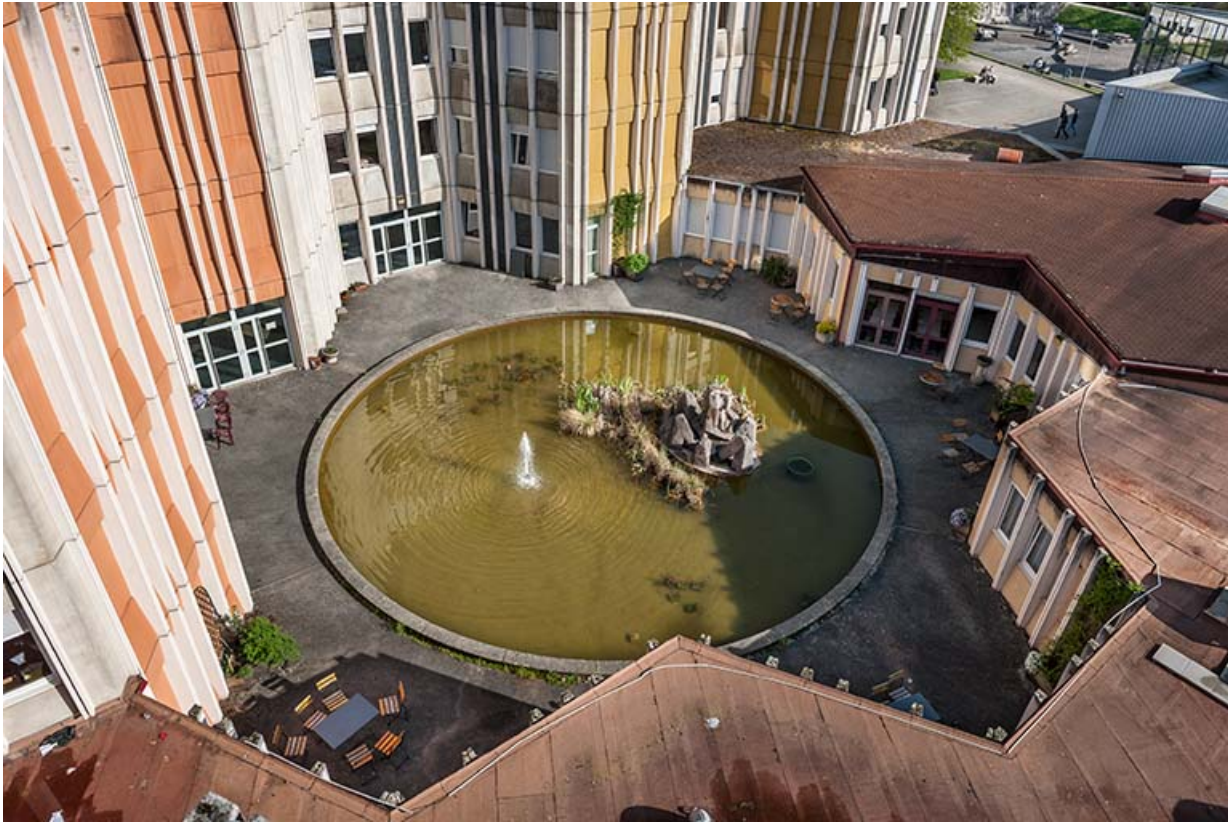
Vue plongeante sur le bassin et la sculpture d'Annie Bleu.