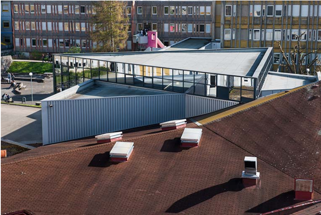
Vue sur la toiture du bâtiment d'entrée depuis l'ouest.