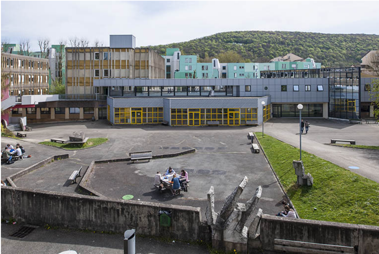
Face postérieure de l'oeuvre de Jean Gilles, la cour et les façades nord-ouest de l'administration. 25, Besançon, 1 rue Rembrandt