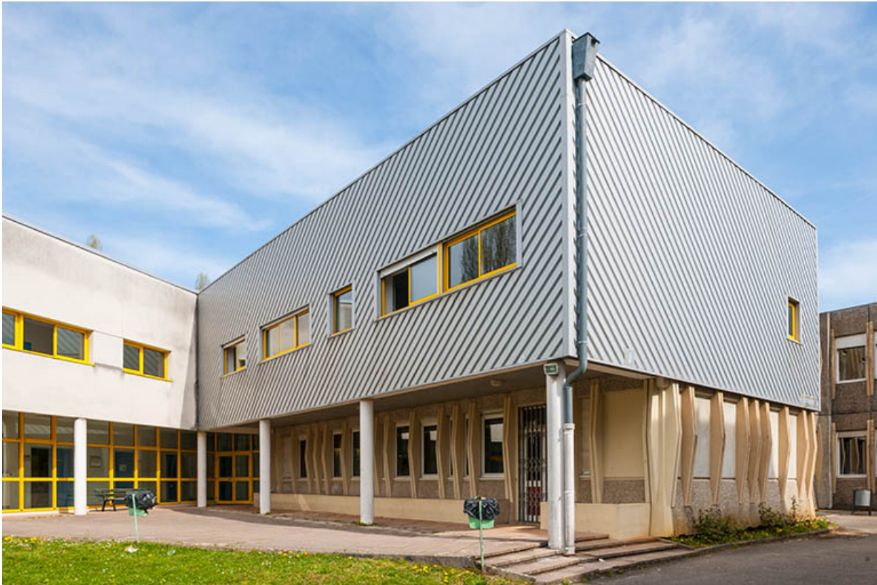
Détail de la façade antérieure de l'externat ouest.