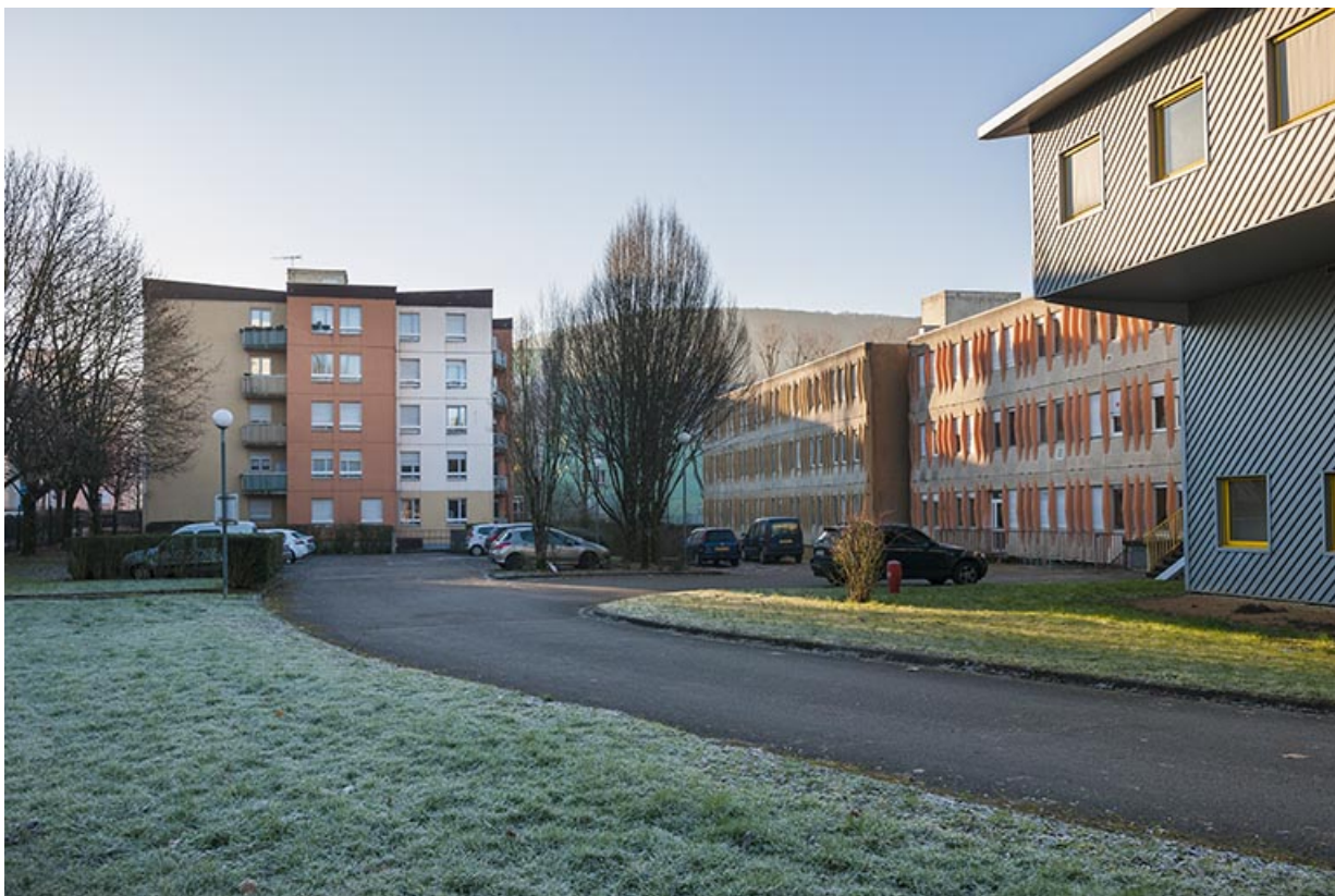
Façades nord-est de l'externat et façade nord-ouest des logements.