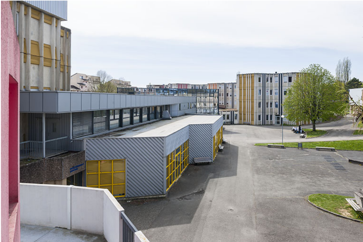
Depuis le nord-est, vue de profil des bâtiments bordant la cour au sud-est. 25, Besançon, 1 rue Rembrandt