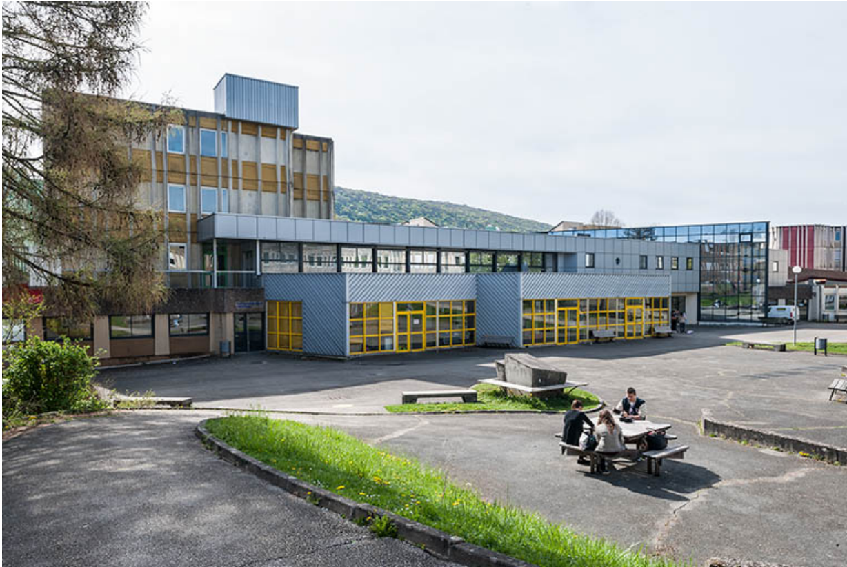
Face nord-est du bâtiment d'externat avec sa machinerie d'ascenseur.