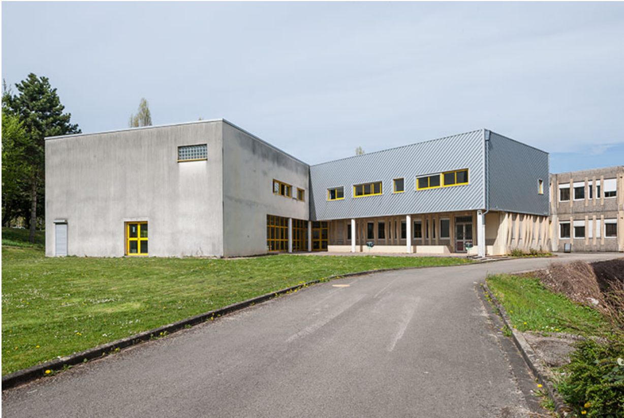
Pignon ouest et façade antérieure sur cours de l'externat ouest.