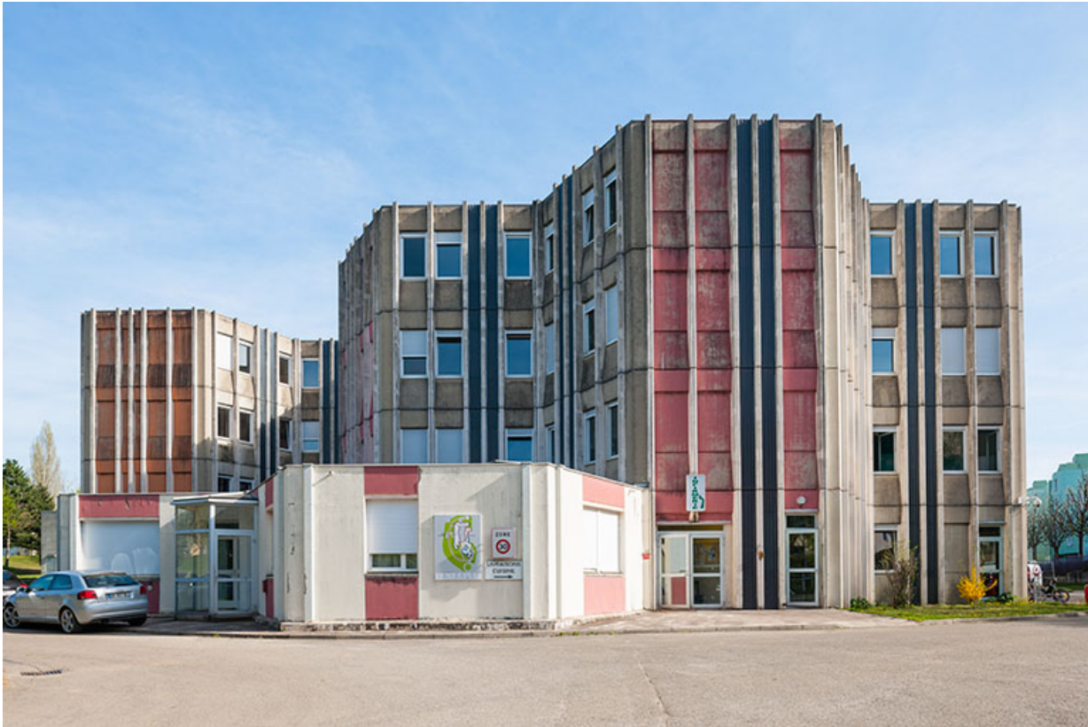
Bâtiment de restauration et d'internat, infirmerie.