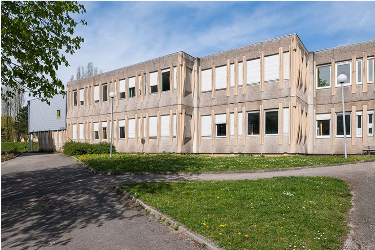
Aile nord-ouest des façades sud des externats - ateliers.