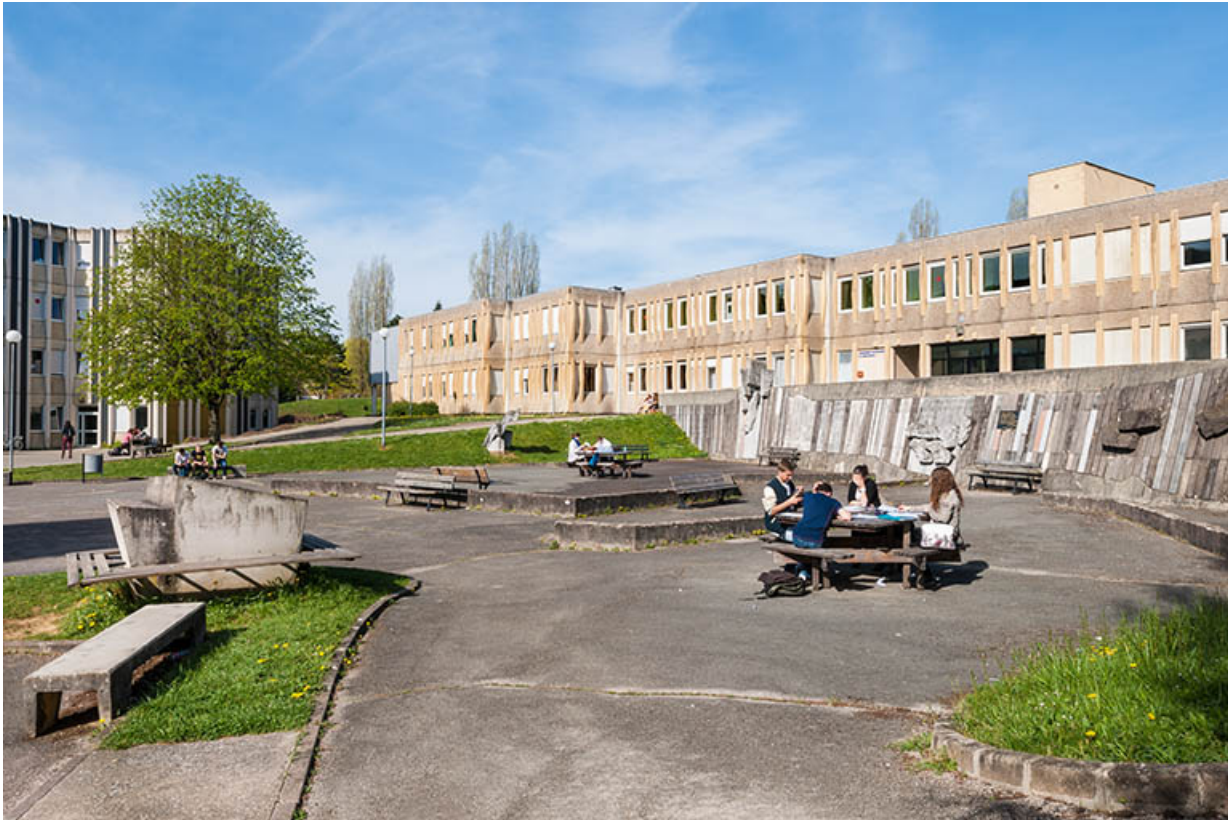
Cour, sculpture, ateliers vus de l'est.