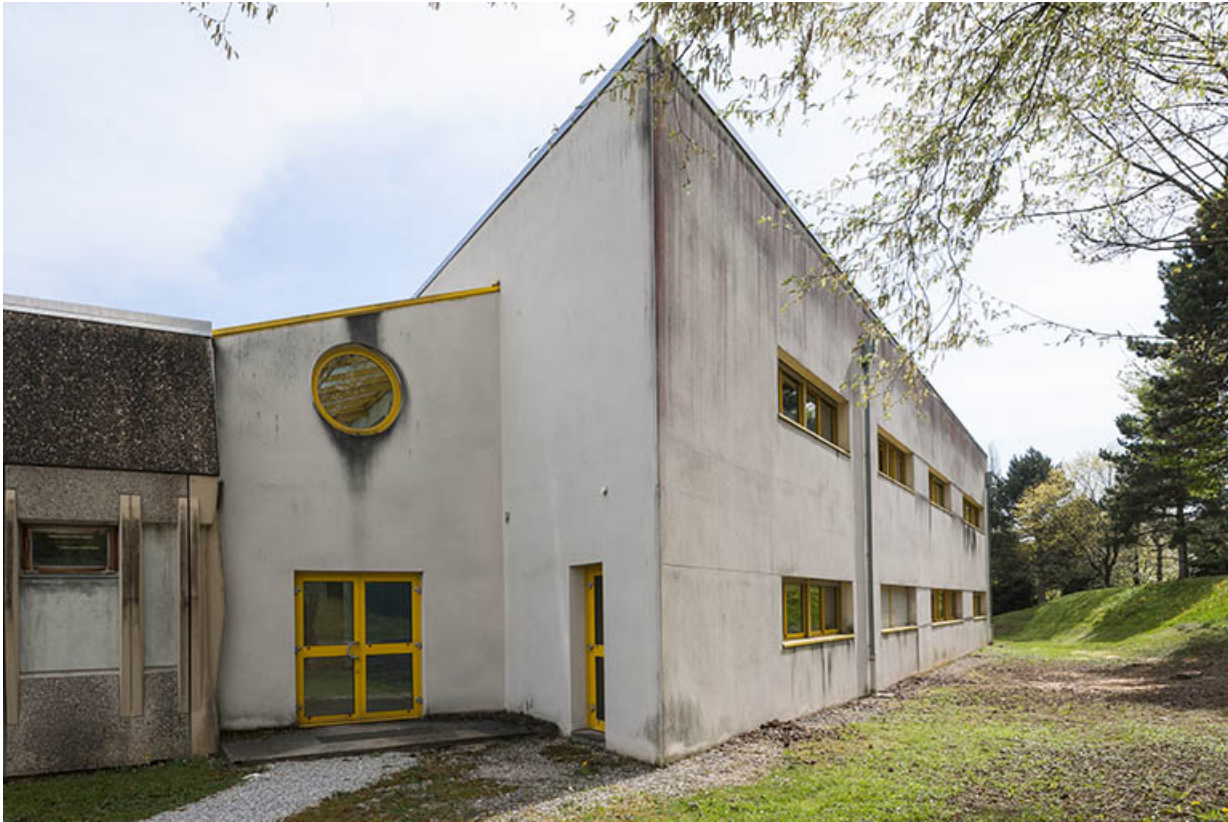
Façade postérieure nord-ouest et angle nord de l'externat ouest jouxtant les ateliers.