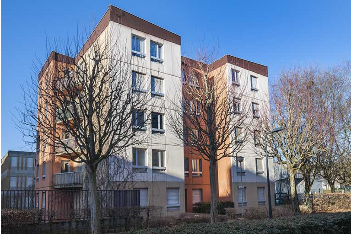
Angle est des logements et façades nord-est sur la rue Auguste Renoir.