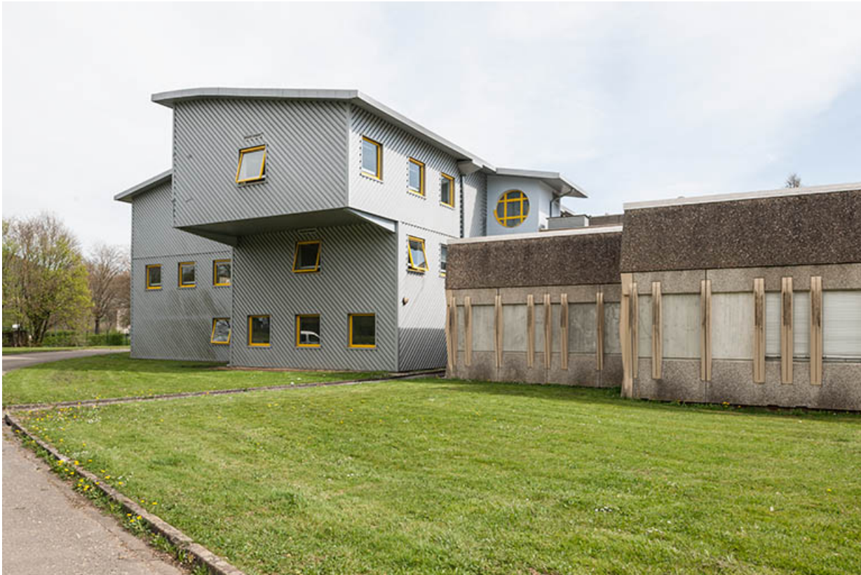
Extrémité postérieure nord-est des ateliers et classes préparatoires.