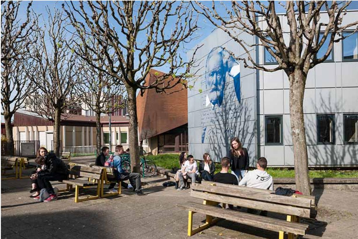
Vue de la place devant le lycée, la façade sud-est décorée à l'effigie de Victor Hugo. 25, Besançon, 1 rue Rembrandt