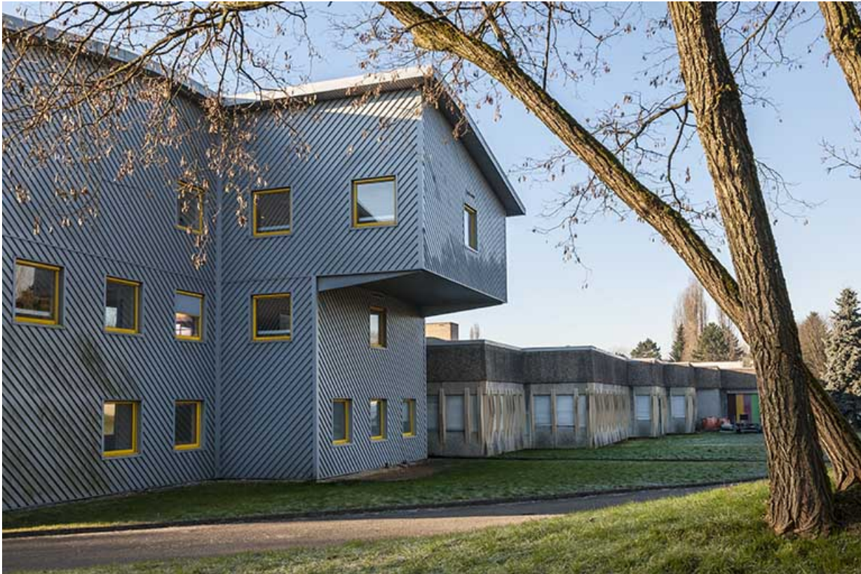
Façades postérieures nord-ouest des ateliers et des classes préparatoires aux grandes écoles. 25, Besançon, 1 rue Rembrandt