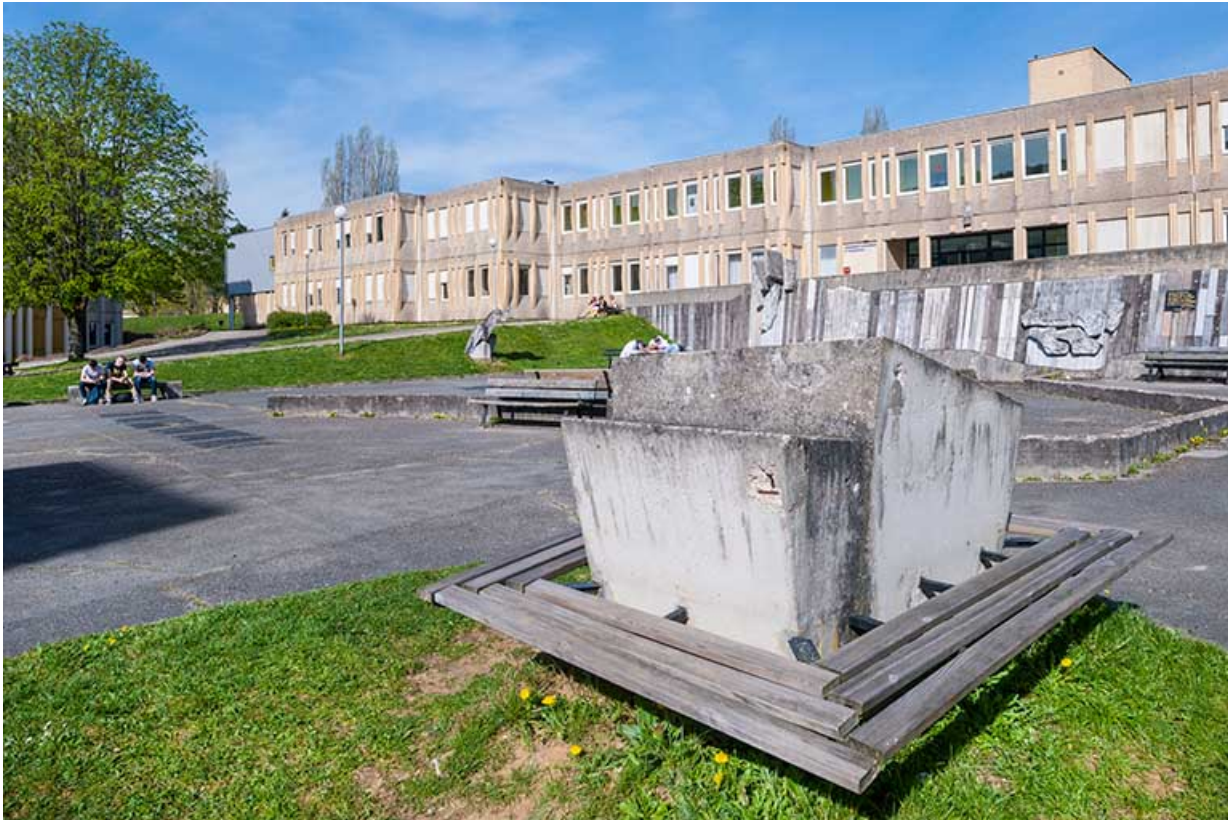
Cour, sculpture, ateliers, vus du sud-est.