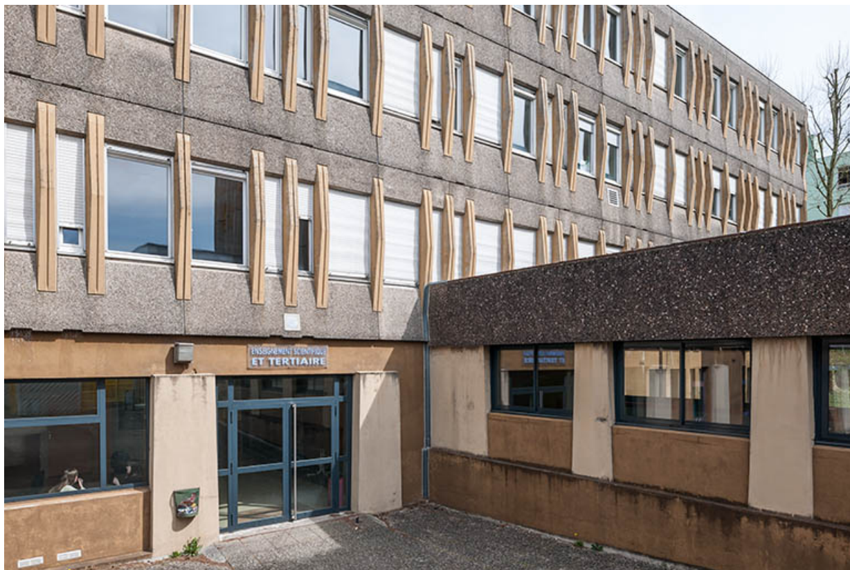
Façade sud-ouest et entrée sur cour de l'externat nord-est.