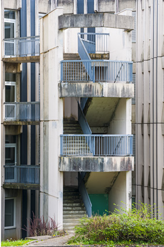
Détail de l'escalier extérieur de l'internat.