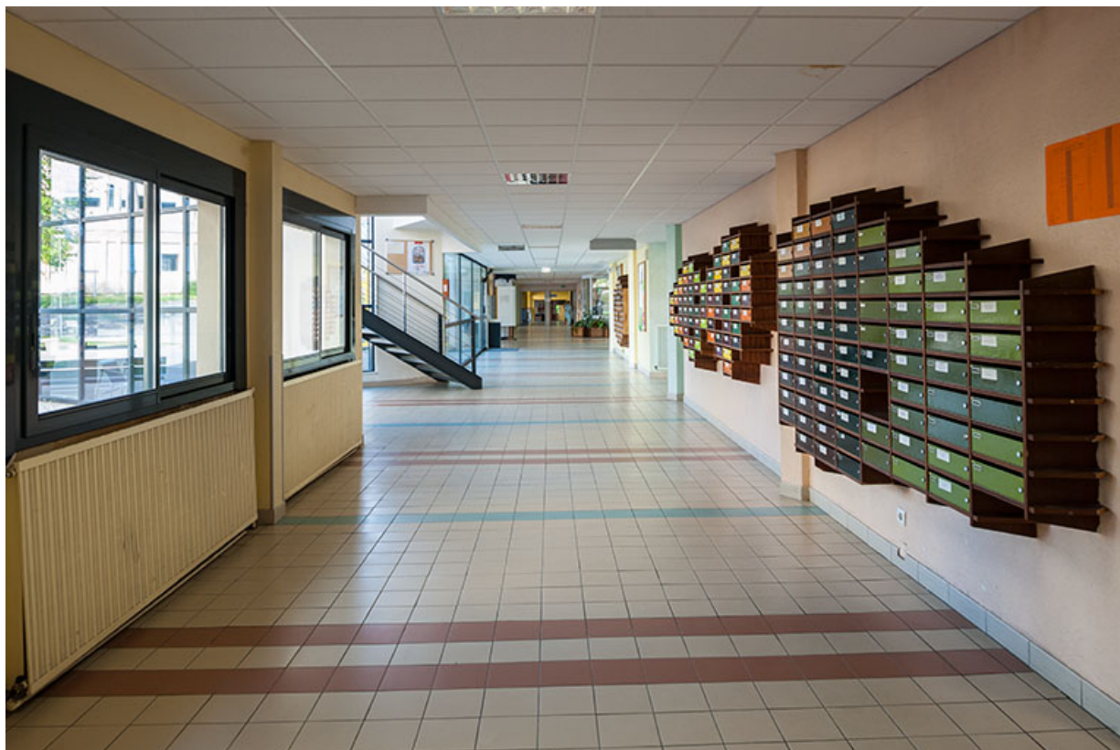
Vue des circulations intérieures dans le bâtiment d'entrée.