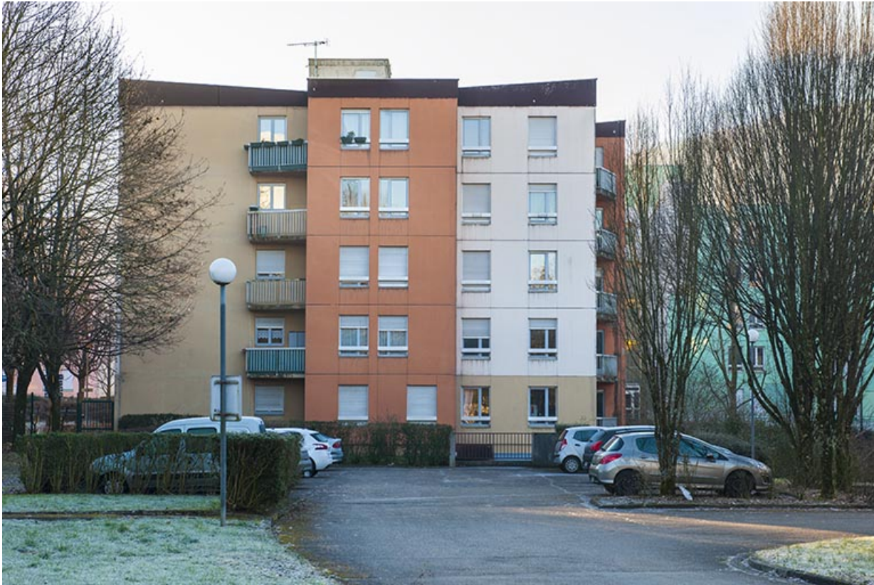
Les logements : façade nord-ouest.