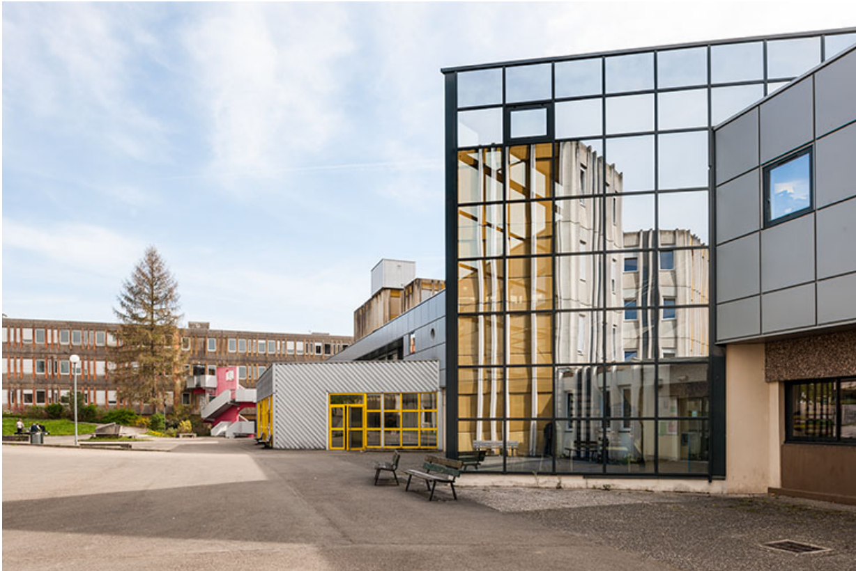
Depuis le sud-ouest, vue de profil des bâtiments bordant la cour au sud-est. 25, Besançon, 1 rue Rembrandt