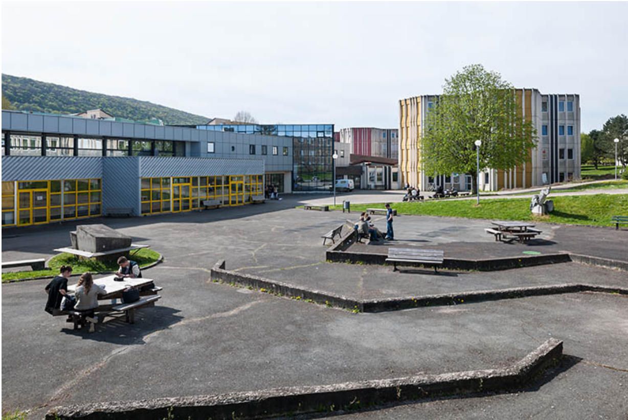
La cour vue du nord-est, éléments de la sculpture de Jean Gilles.