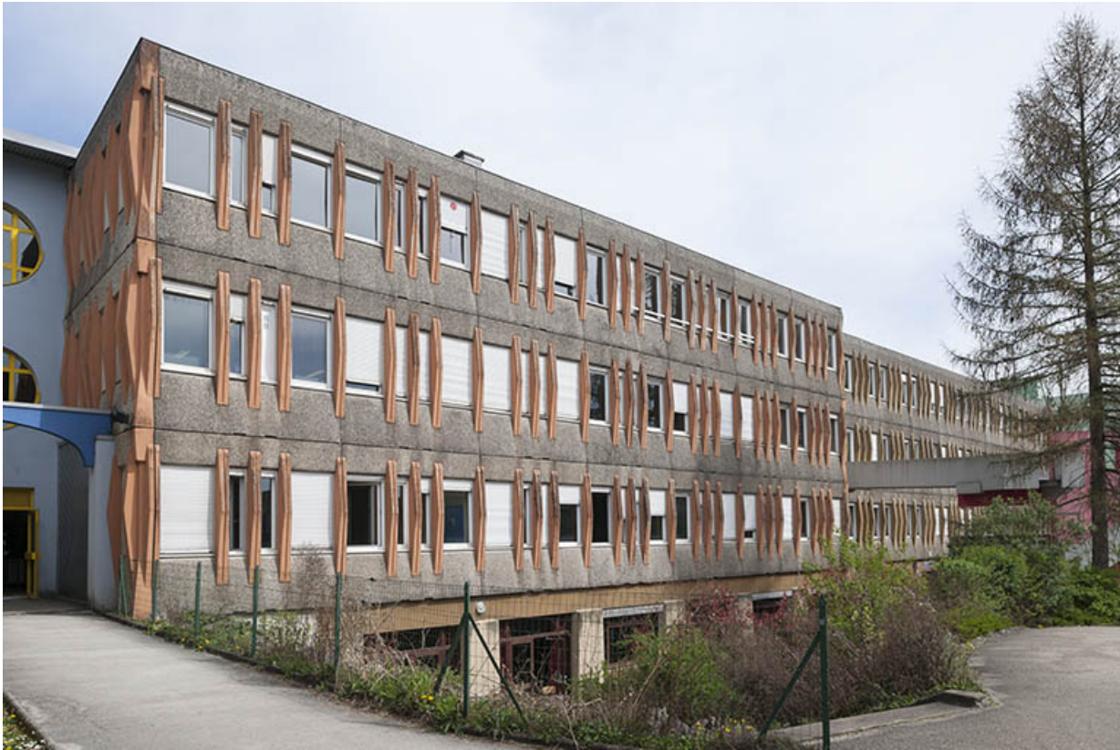
Angle nord-ouest de la façade antérieure sud-ouest sur cours de l'externat nord-est.