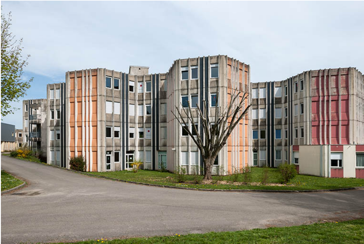
Les façades ouest de l'internat.