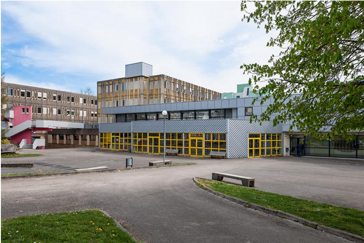
Au sud-est de la cour, l'escalier desservant les externats.