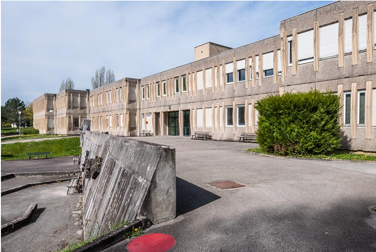
Depuis l'est, vue de profil de l'oeuvre de Jean Gilles et des façades sud des ateliers-externats. 25, Besançon, 1 rue Rembrandt