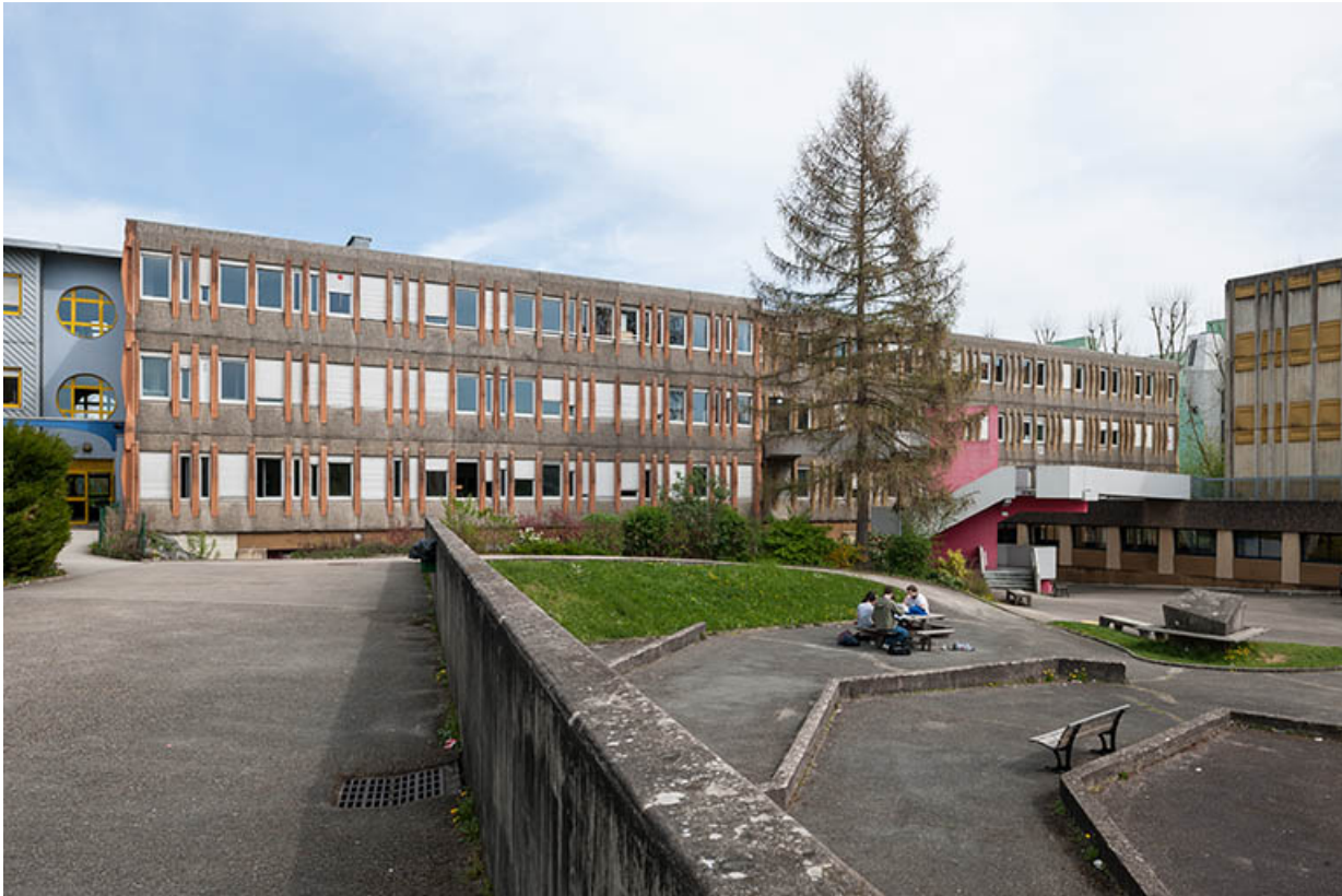
Depuis l'ouest, vue des bâtiments bordant la cour au nord-est.