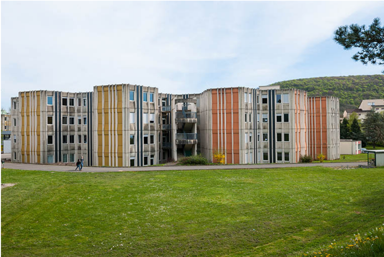
Vue d'ensemble des façades postérieures de l'internat.