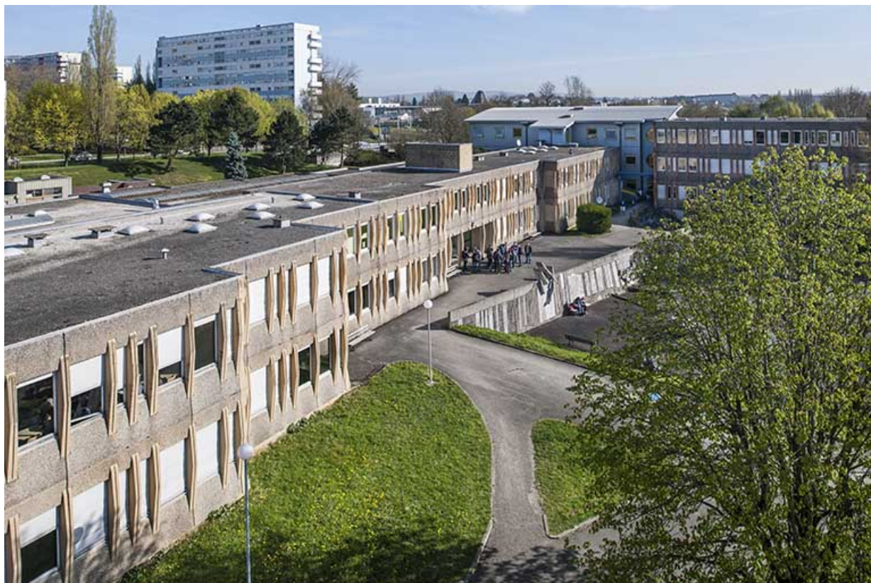
Façade antérieure sud-est des ateliers industriels, cour, bâtiment d'externat. 25, Besançon, 1 rue Rembrandt