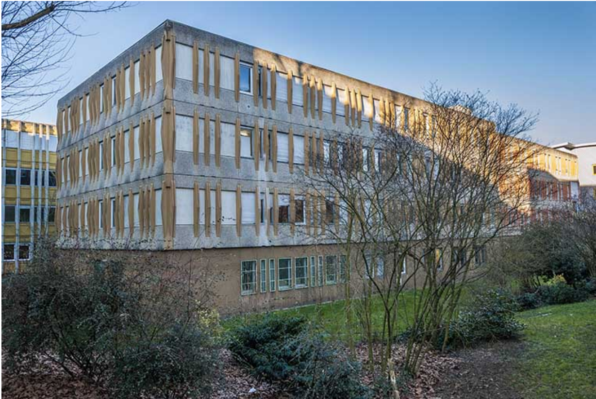
Angle sud-est de l'externat.