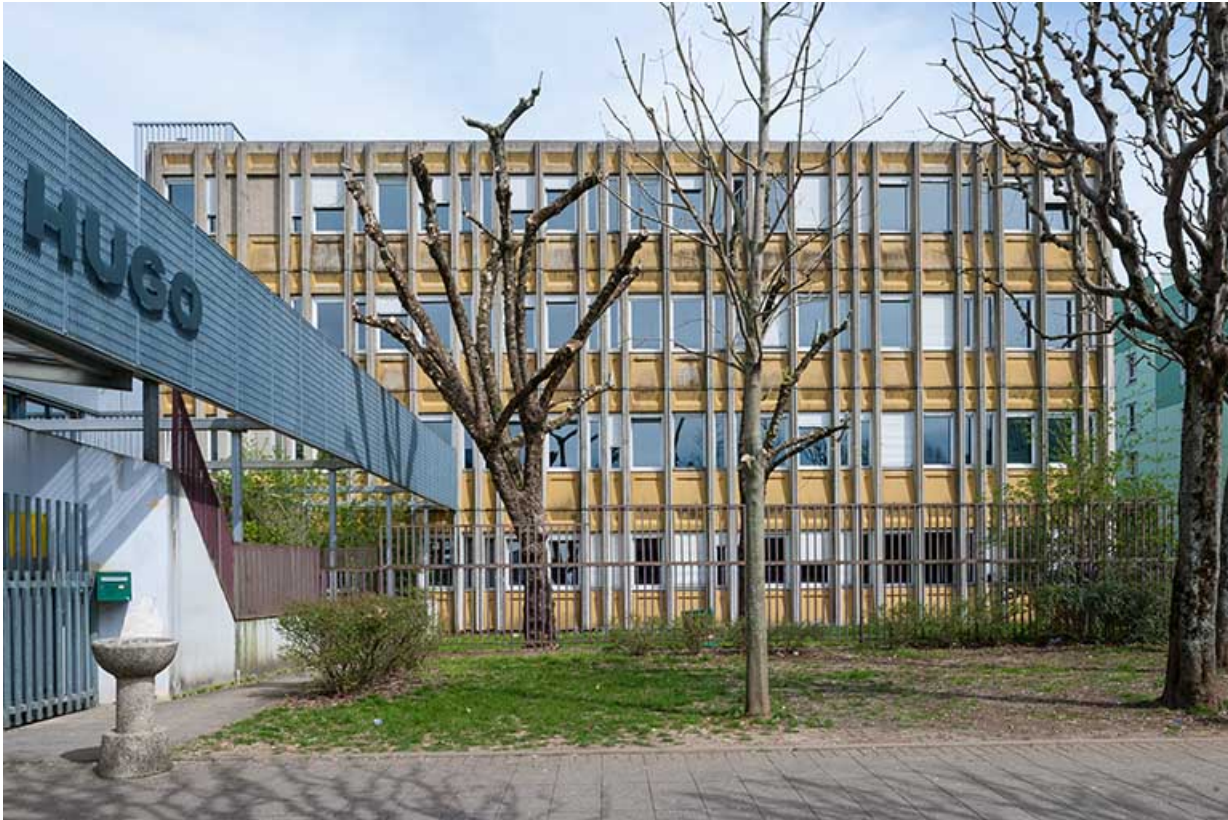
Devant l'entrée principale, face à l'est : le petit externat.