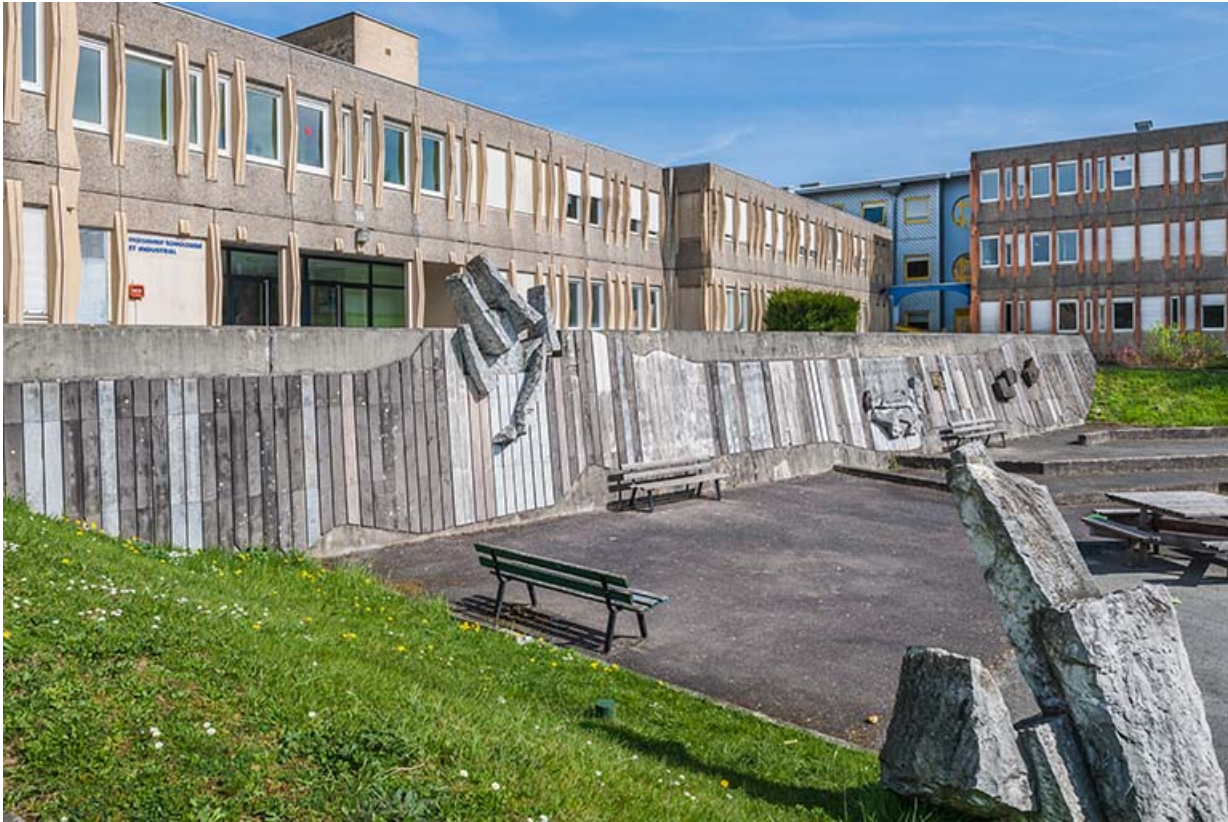
Vue sur l'oeuvre de Jean Gilles et le nord-est de la cour.