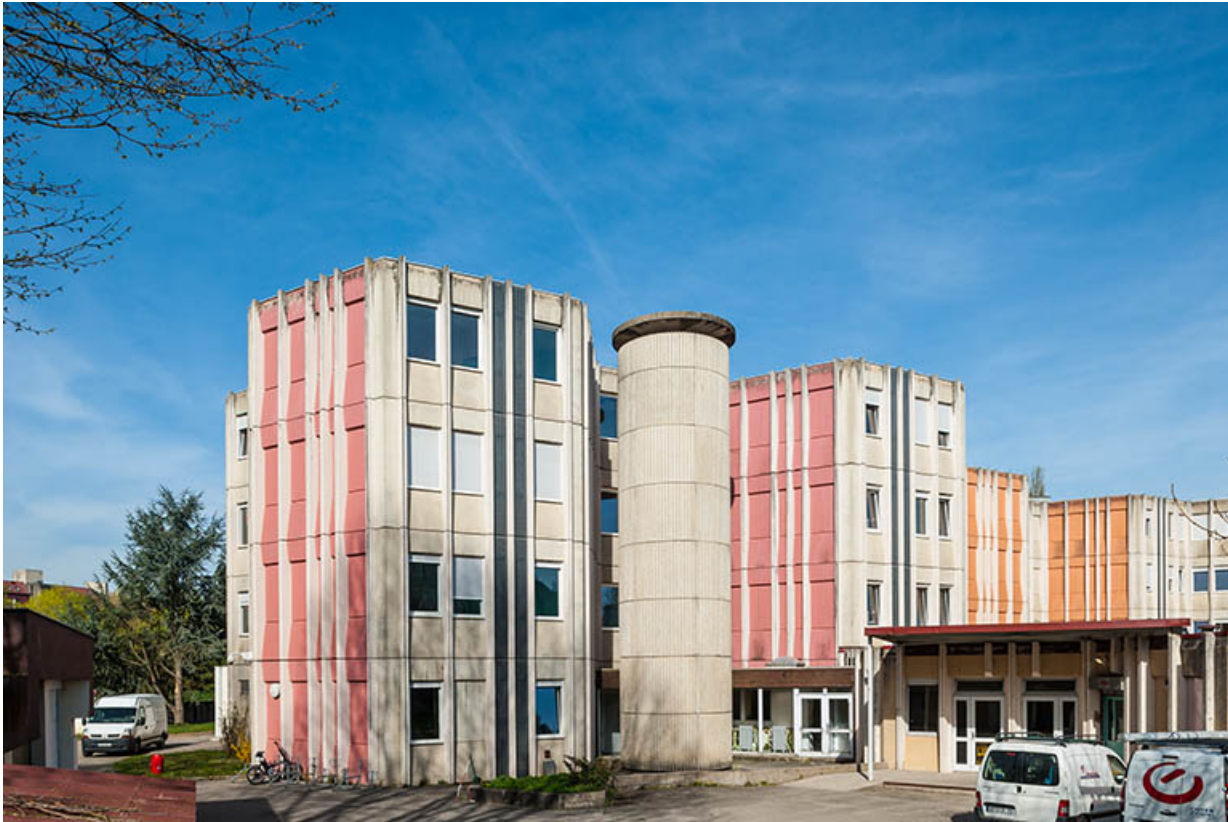
Les façades est du bâtiment de restauration et d'internat.