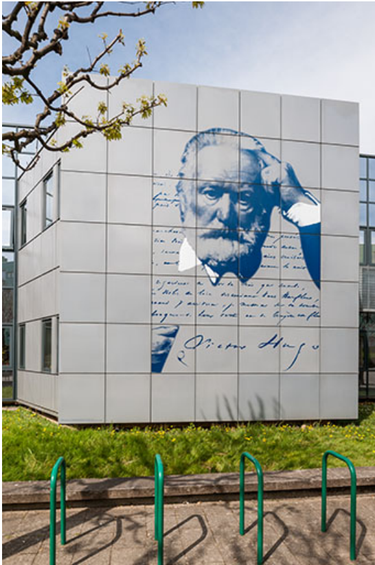
Donnant sur la place devant le lycée, la façade sud-est décorée à l'effigie de Victor Hugo. 25, Besançon, 1 rue Rembrandt