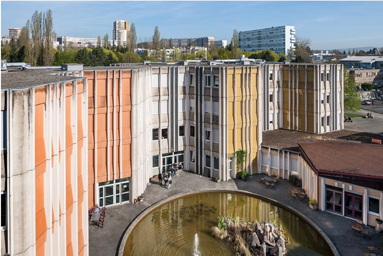
Bassin, façades sud et ouest des externats qui le bordent.