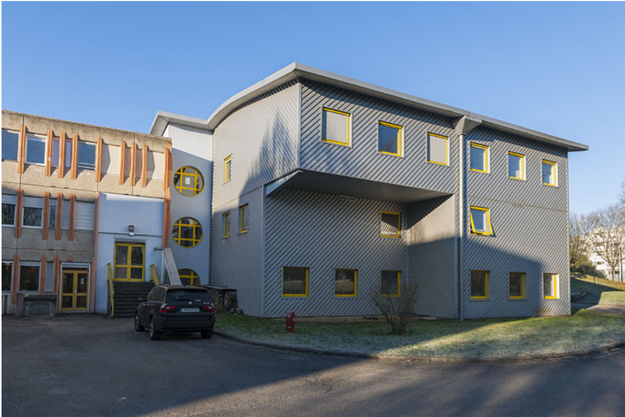
Façades postérieures nord-est des classes préparatoires aux grandes écoles. (CPGE)