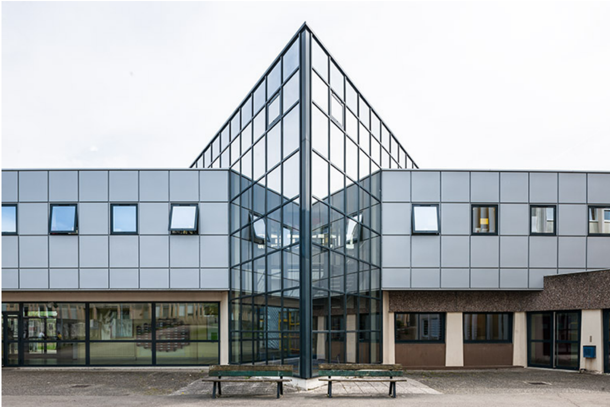
Bâtiment de l'administration et centre de documentation et d'information (cdi) à l'étage : détail. 25, Besançon, 1 rue Rembrandt