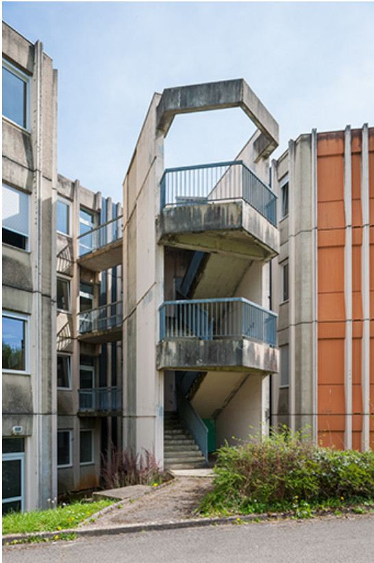
Détail de l'escalier extérieur de l'internat.