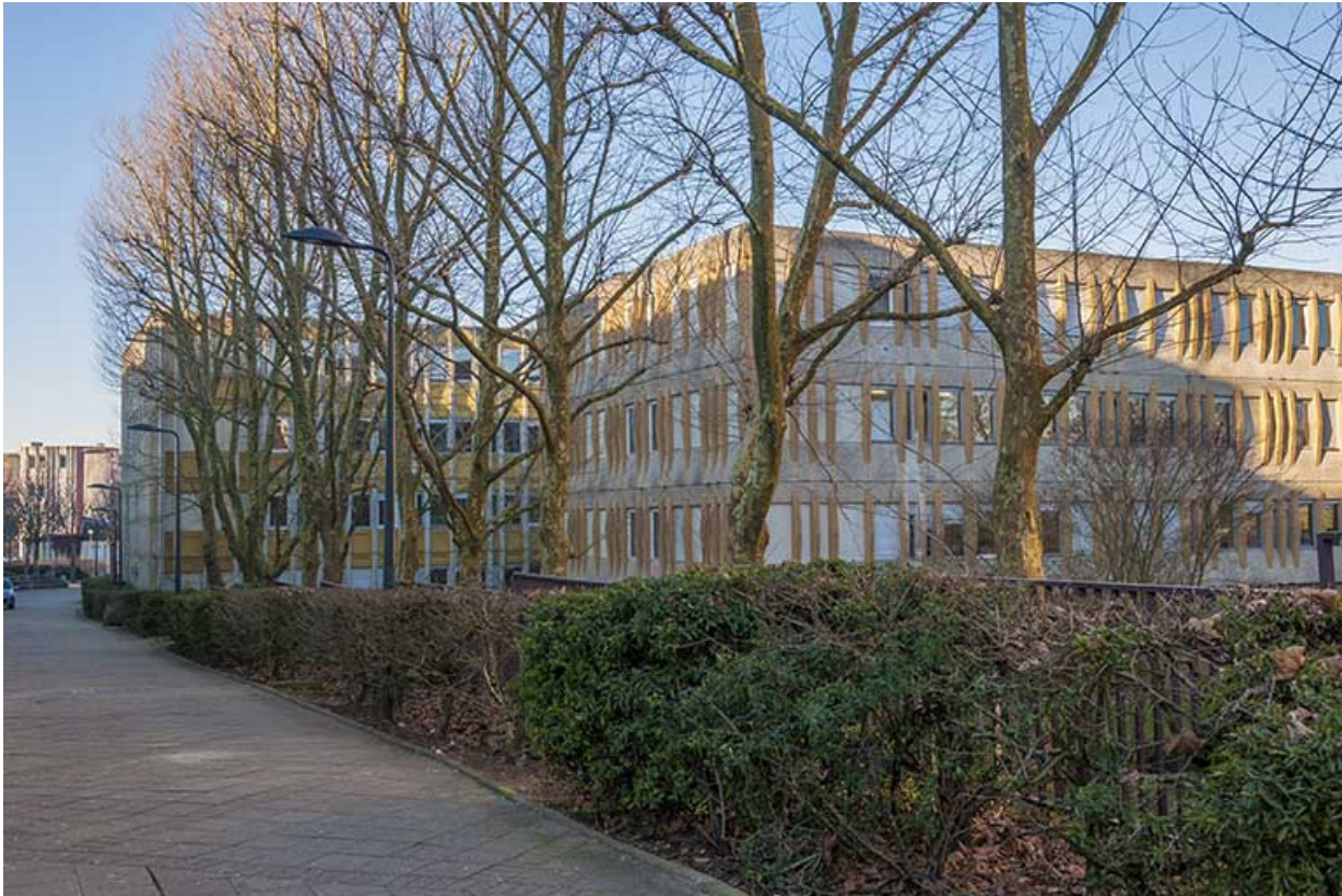
Le long de la rue Rembrandt, les pignons sud-est des externats.