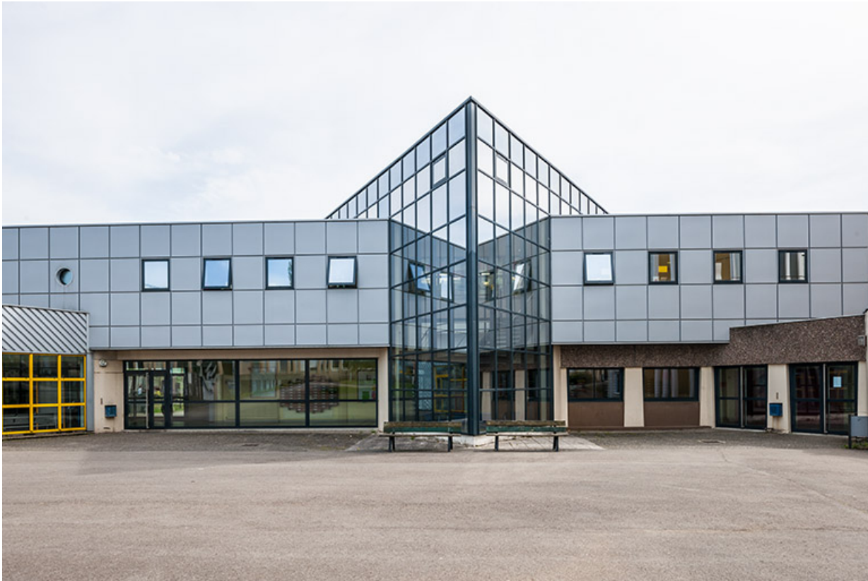
Face au bâtiment de l'administration et centre de documentation et d'information (cdi) à l'étage.