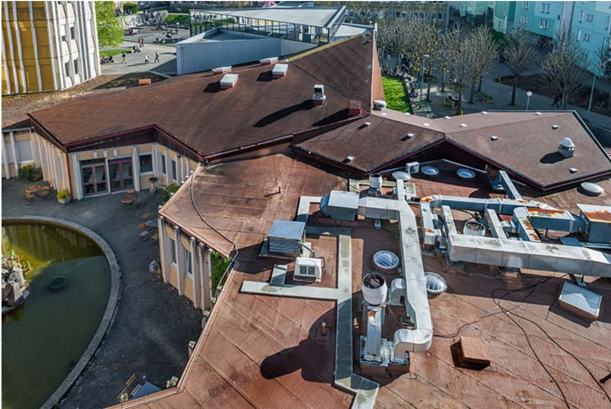
Bassin, toitures de l'entrée, de l'administration et du centre de documentation et d'information. 25, Besançon, 1 rue Rembrandt