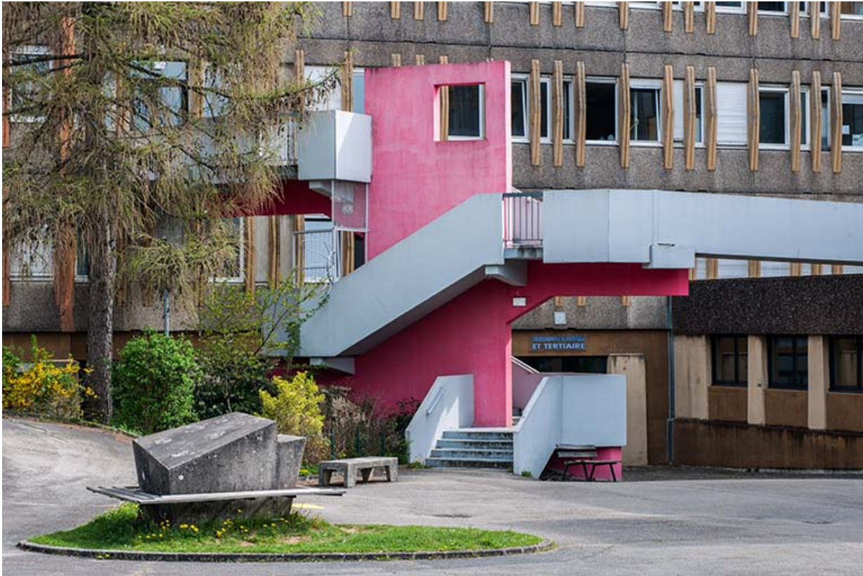
Vus de la cour, la passerelle et l'escalier devant l'externat d'enseignement scientifique et tertiaire. 25, Besançon, 1 rue Rembrandt