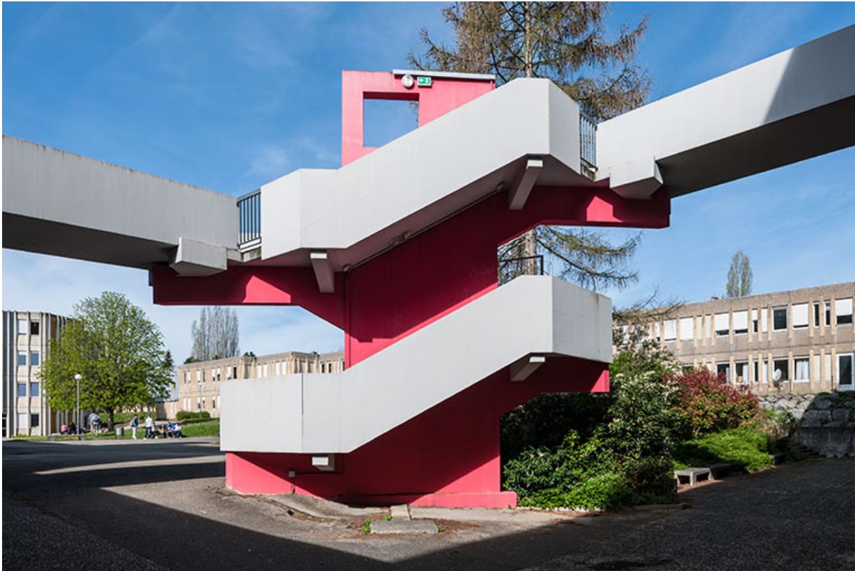
Détail de la passerelle et escalier devant l'externat d'enseignement scientifique et tertiaire. 25, Besançon, 1 rue Rembrandt