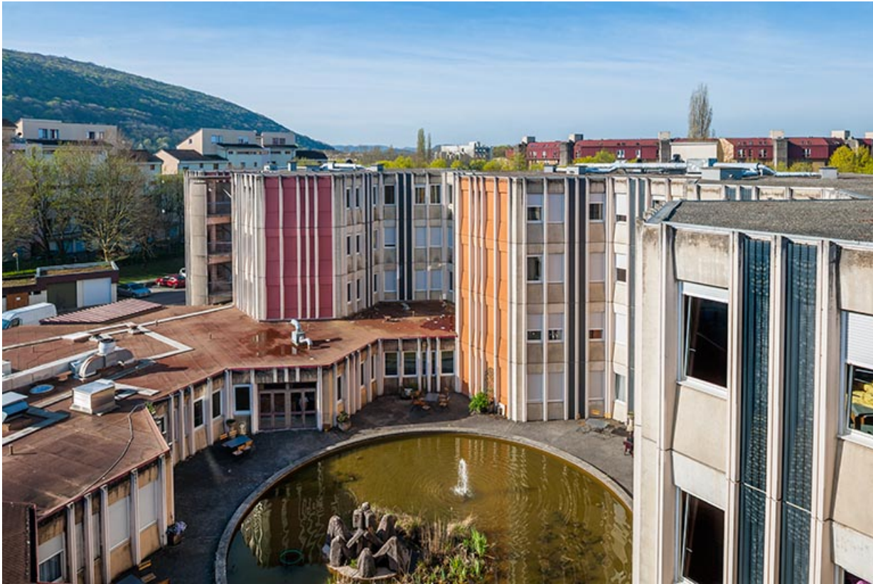
bassin : vue d'ensemble de l'œuvre d'Annie Bleu.