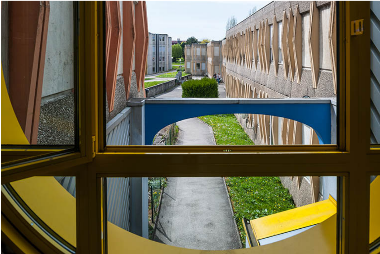
Vue depuis les bâtiments des classes préparatoires, à l'angle nord-est de la cour, le long de la façade sud de l'atelier industriel. 25, Besançon, 1 rue Rembrandt