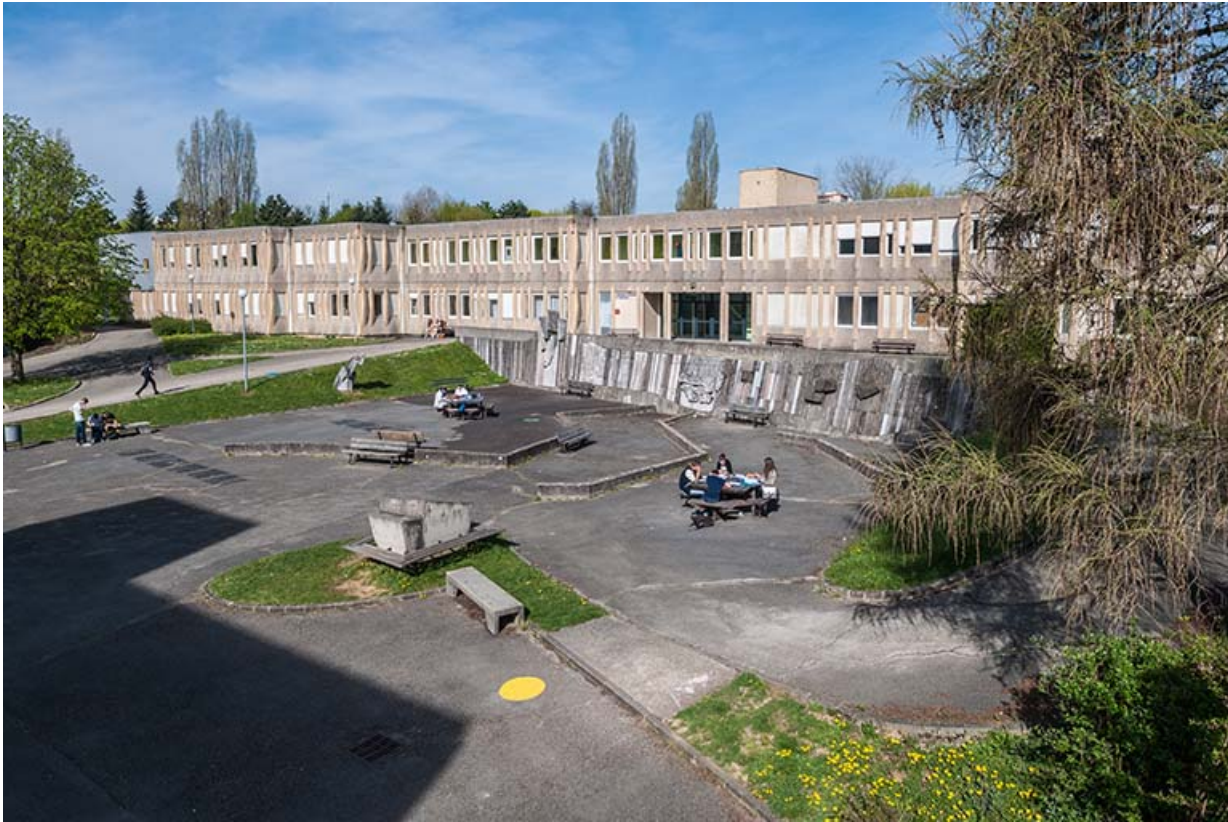
Cour, sculpture, ateliers vus du sud-est.