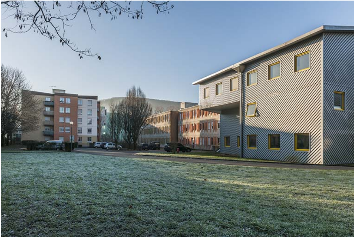
Vue d'ensemble des façades postérieures nord-est depuis le nord du terrain. 25, Besançon, 1 rue Rembrandt