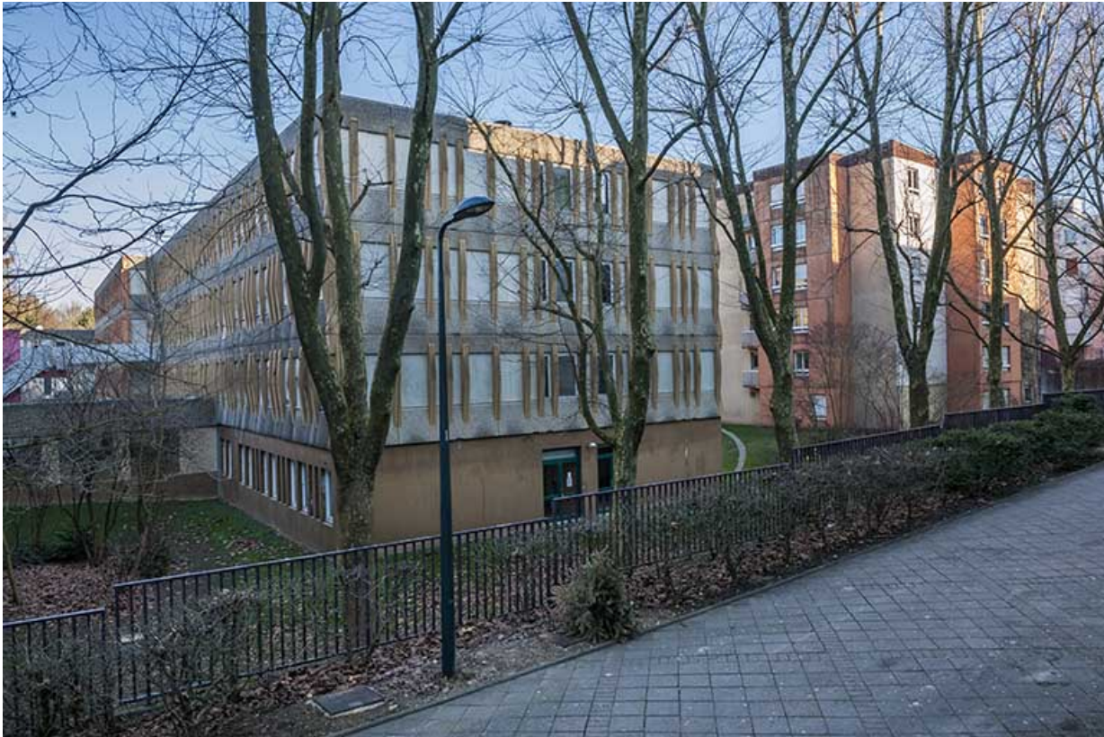
Vues sur le pignon sud-est de l'externat depuis la rue Rembrandt 25, Besançon, 1 rue Rembrandt