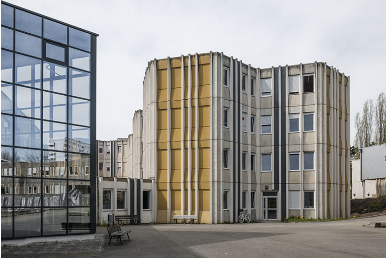
Détail de façade nord et est, sur cour, de l'internat.