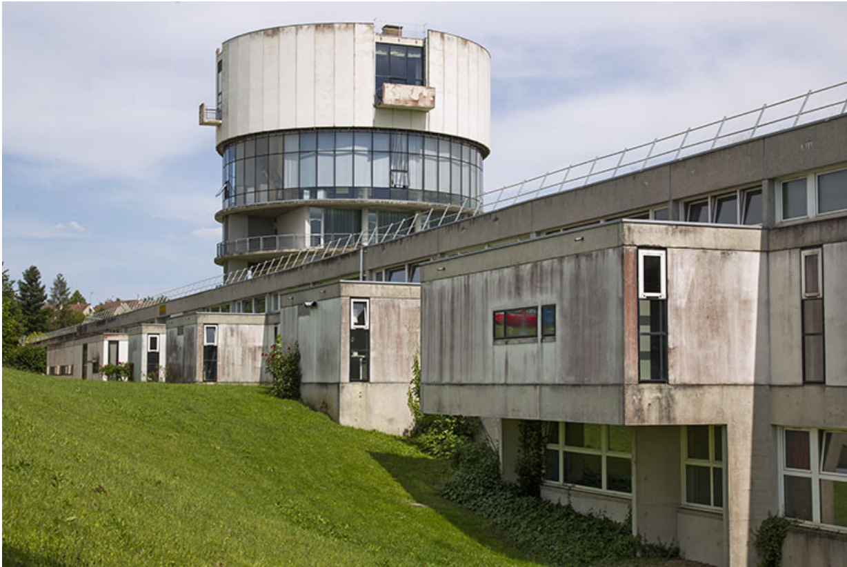
Les façades postérieures de l'externat, vues de l'ouest.

25, Besançon, 14 rue Alain Savary, lieudit : Temis