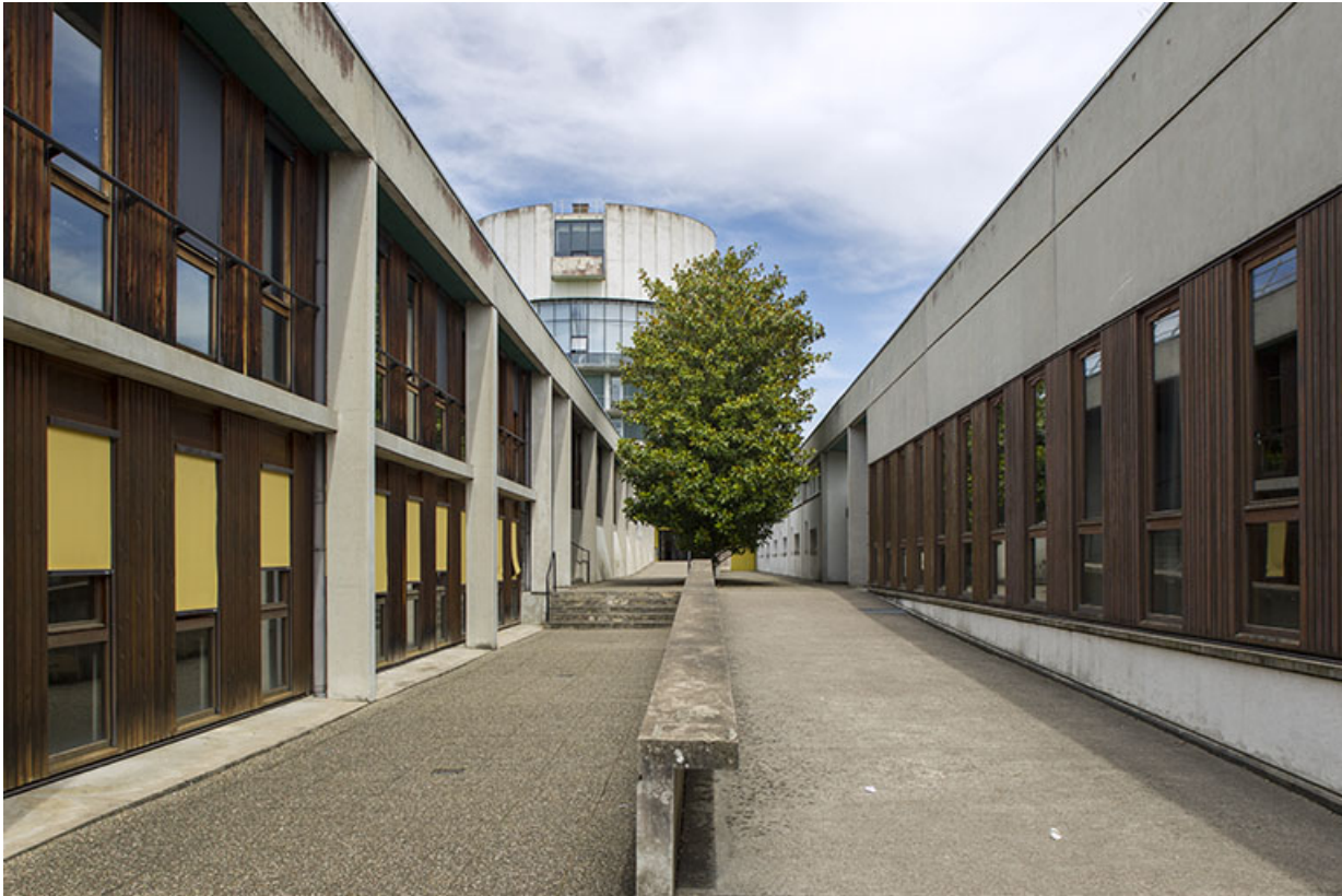
Vue vers l'est de l'allée entre les bâtiments d'externat.

25, Besançon, 14 rue Alain Savary, lieudit : Temis