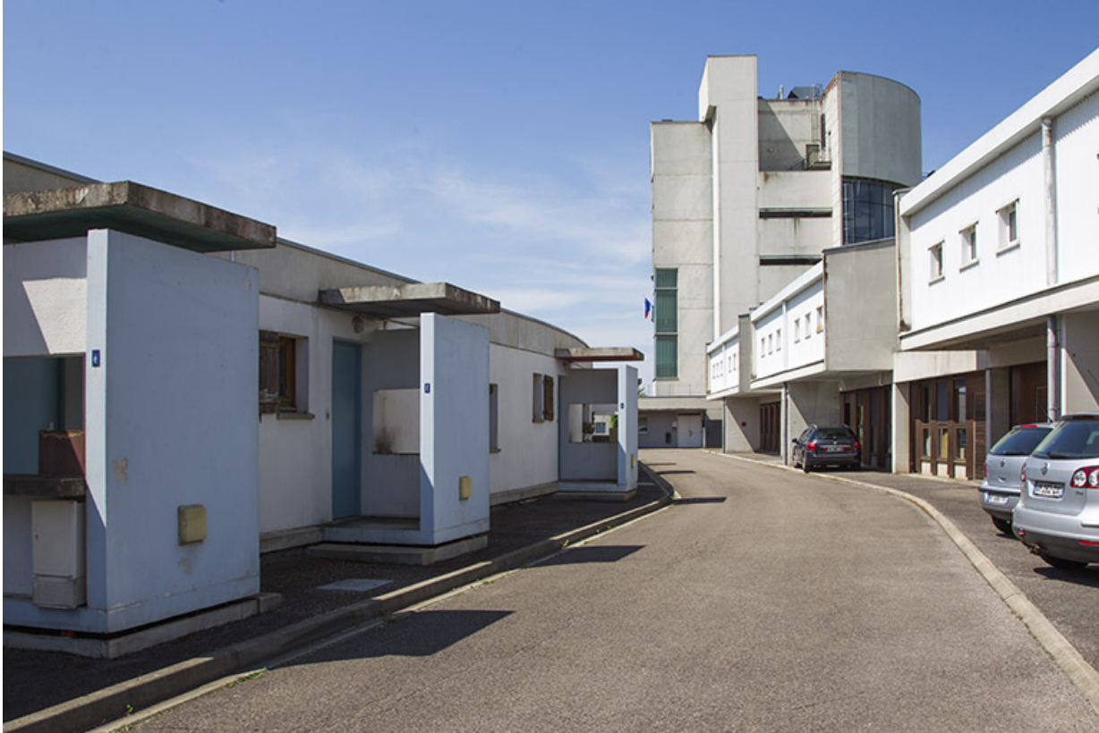
Entre les façades antérieures des logements et le bâtiment "agencement".

25, Besançon, 14 rue Alain Savary, lieudit : Temis