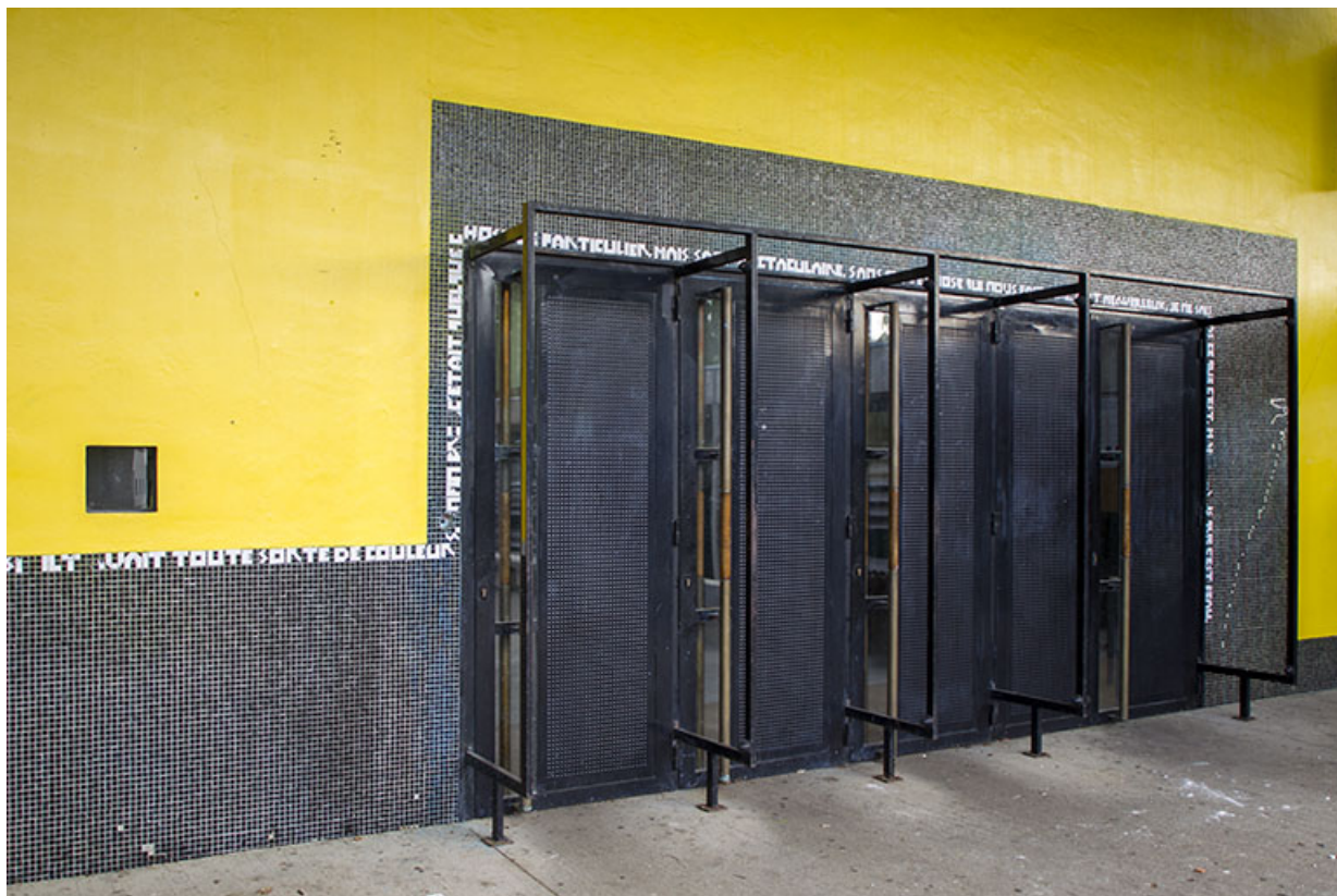
Détail de l'entrée vue de trois-quart ouest .

25, Besançon, 14 rue Alain Savary, lieudit : Temis