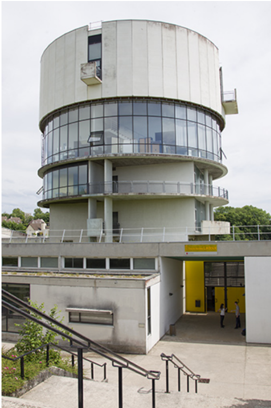
Vue postérieure (nord) de la tour et de l'escalier. 25, Besançon, 14 rue Alain Savary, lieudit : Temis