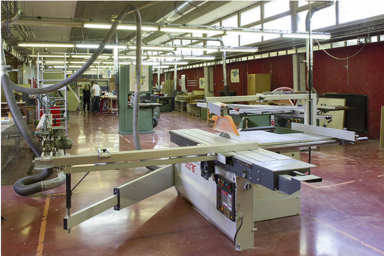
Dans l'atelier du bâtiment "agencement".

25, Besançon, 14 rue Alain Savary, lieudit : Temis