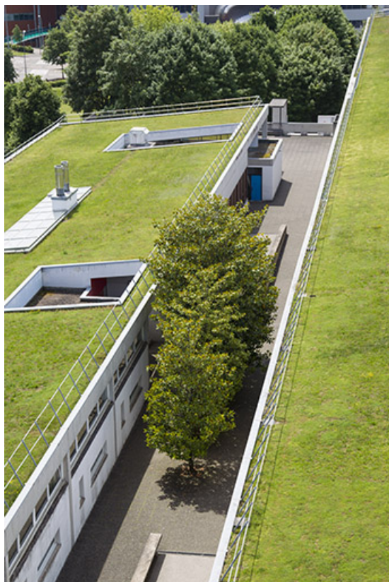
Depuis la tour, vue sur la partie sud-ouest.

25, Besançon, 14 rue Alain Savary, lieudit : Temis