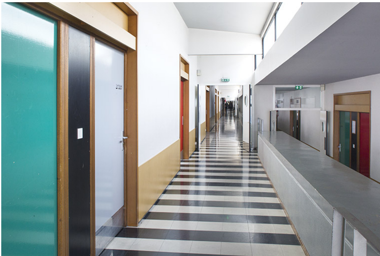
Couloir du bâtiment d'externat.

25, Besançon, 14 rue Alain Savary, lieudit : Temis