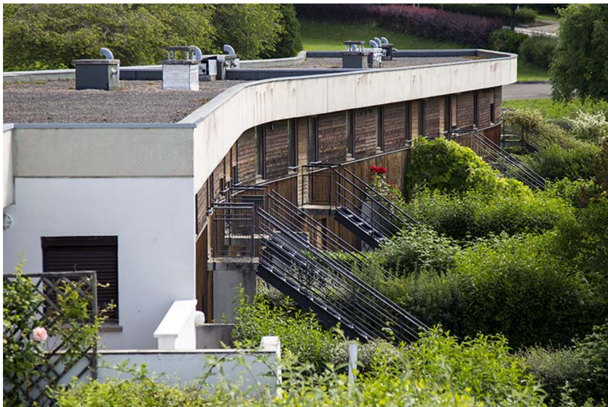
Les façades postérieures - sud - des logements vues de trois-quart ouest.

25, Besançon, 14 rue Alain Savary, lieudit : Temis