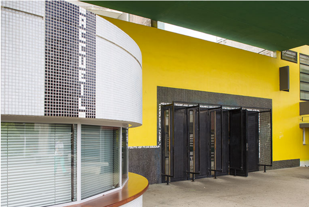
Détail de l'entrée vue de trois-quart sud.

25, Besançon, 14 rue Alain Savary, lieudit : Temis