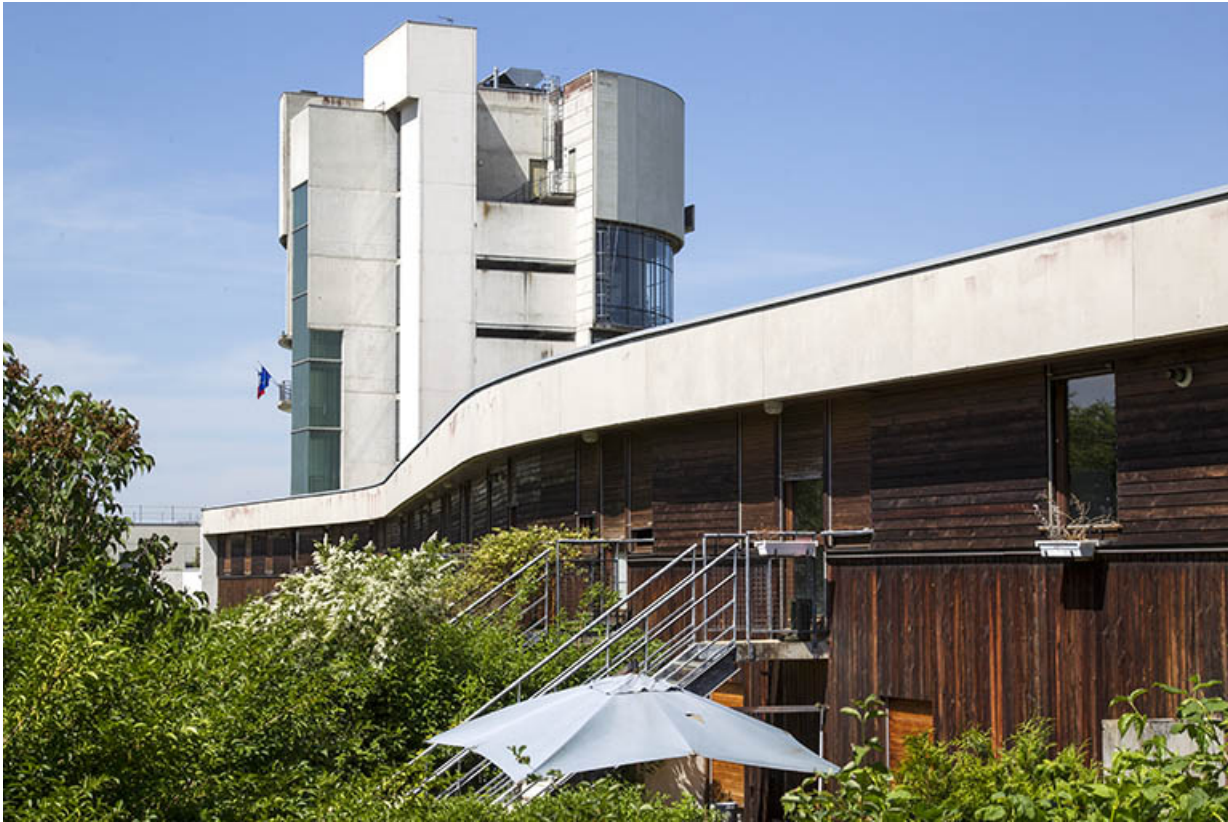
Les façades postérieures - sud - des logements vues de trois-quart est.

25, Besançon, 14 rue Alain Savary, lieudit : Temis