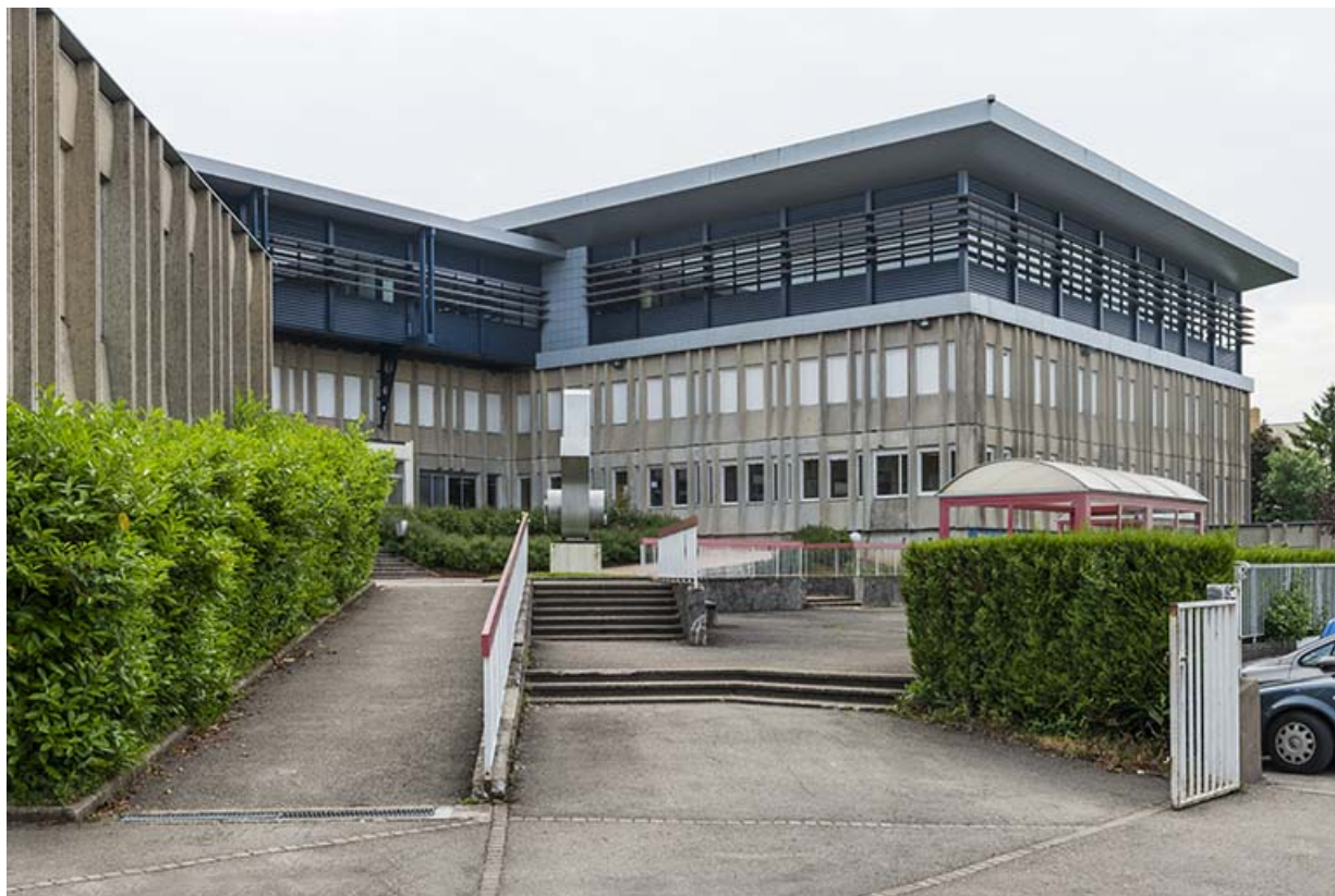
Vue d'ensemble : entrée, cour, externat surélevé, sculpture.