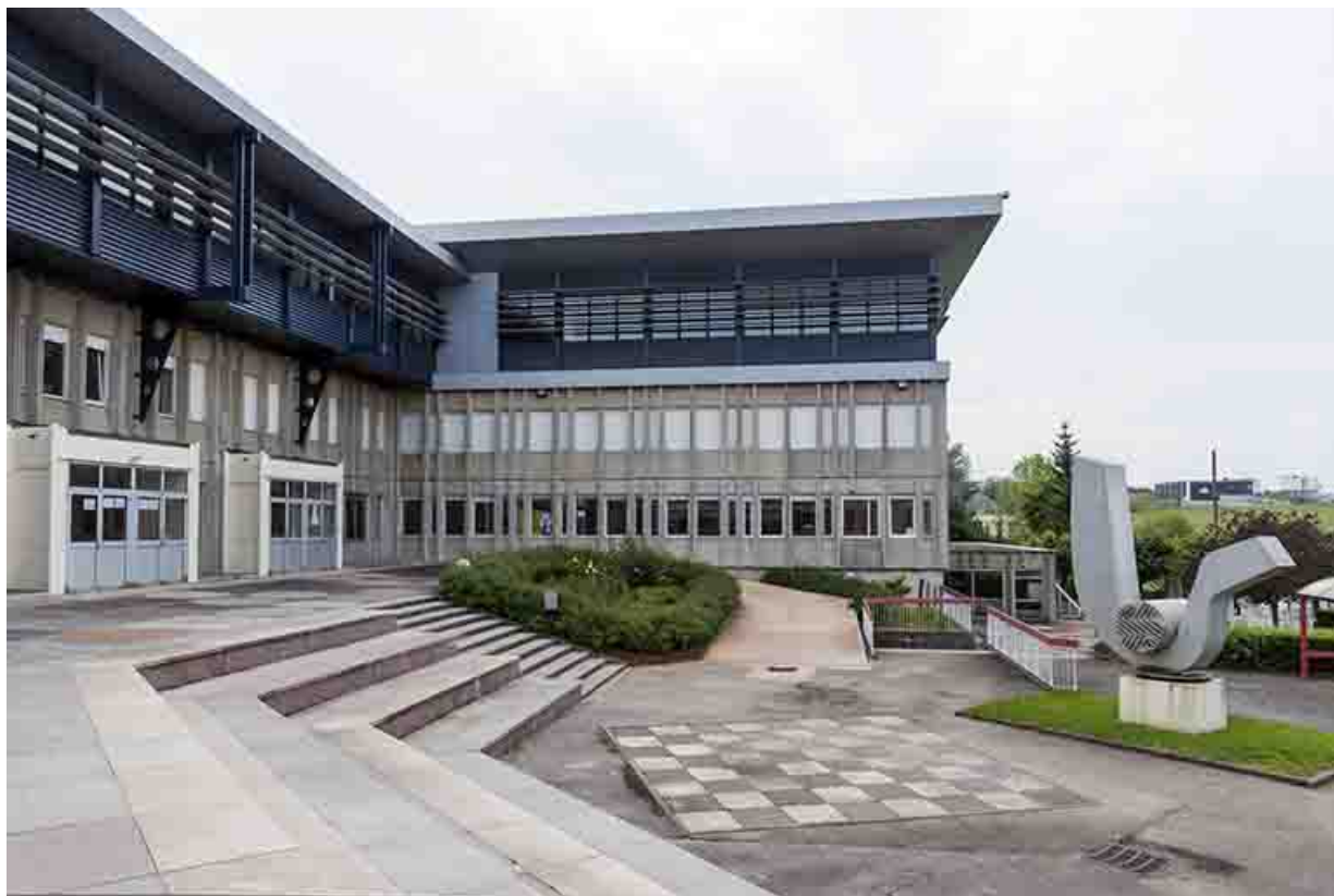
Vue d'ensemble : entrée, cour, externat surélevé, sculpture.