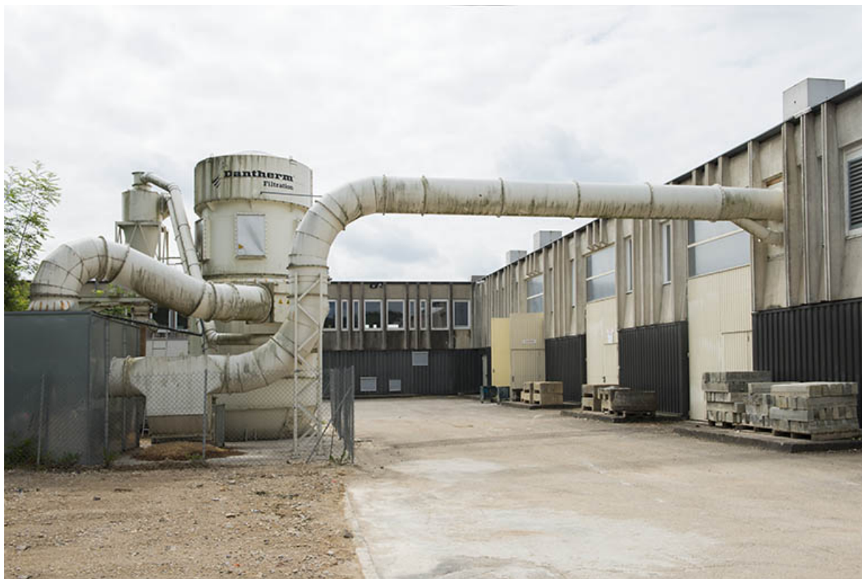
Angle de la façade postérieure nord-est de l'externat avec son aile nord-est. 25, Besançon, 8 rue Mercator