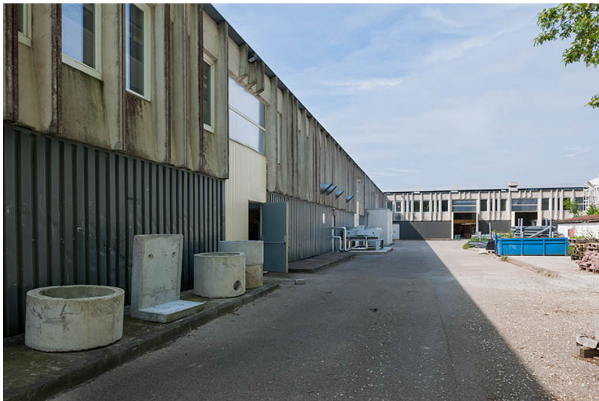
Façade postérieure nord-ouest de l'aile nord-est de l'externat depuis le nord-est. 25, Besançon, 8 rue Mercator