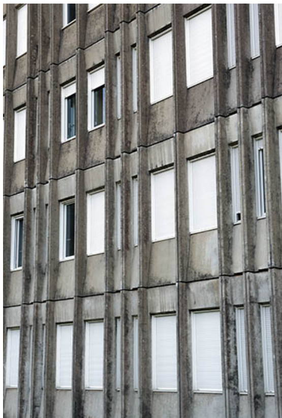
Détail de la façade de l'internat.