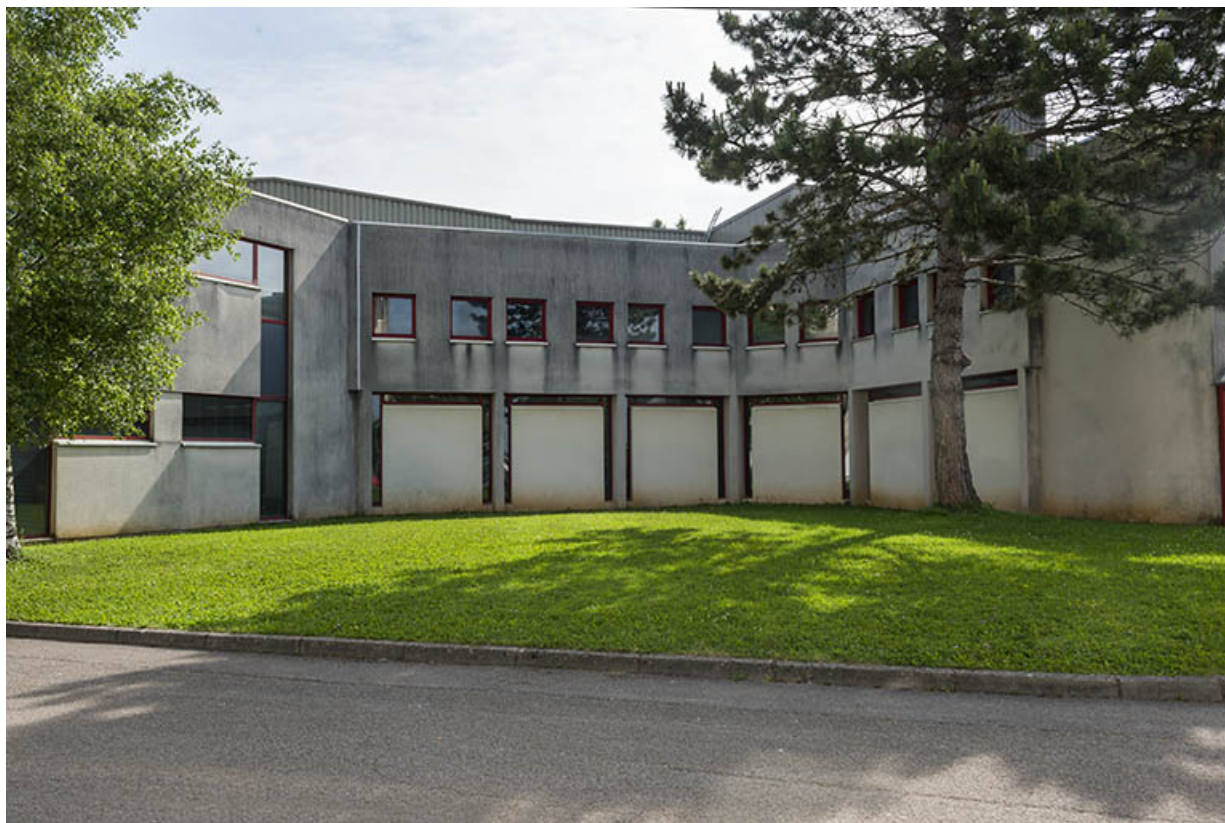
Face sud de l'aile occidentale de l'externat.