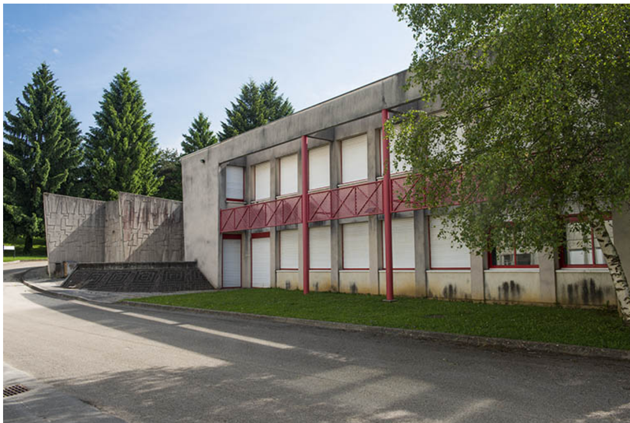
Façade ouest de l'aile occidentale de l'externat.