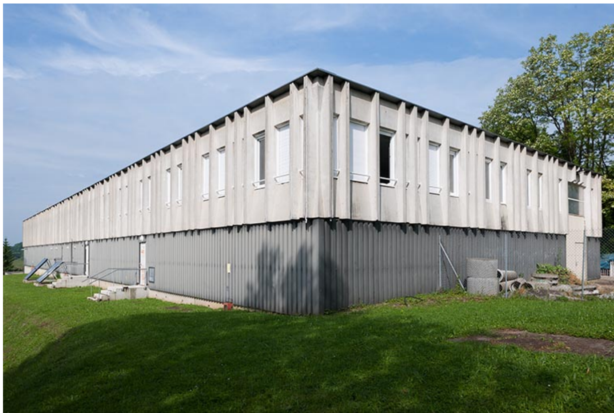
Angle nord-est, petit côté nord-est et longue façade sud-est de l'aile nord-est de l'externat. 25, Besançon, 8 rue Mercator