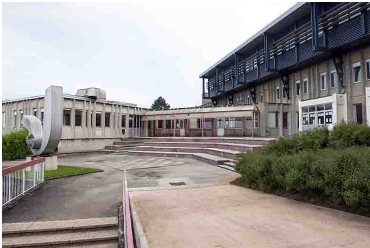
Vue d'ensemble : entrée, cour, externat surélevé, cuisines, sculpture.