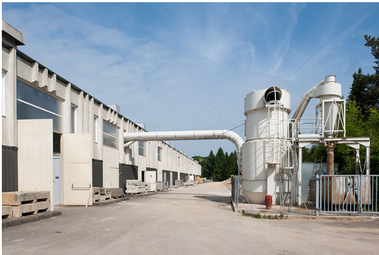
Façade postérieure nord-est de l'externat depuis l'est. 25, Besançon, 8 rue Mercator