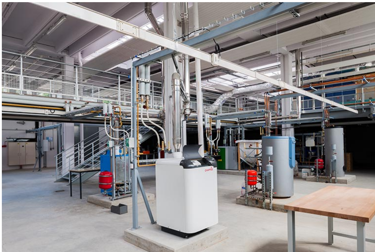
Espaces de formation de maintenance des systèmes énergétiques et climatiques. 25, Besançon, 8 rue Mercator