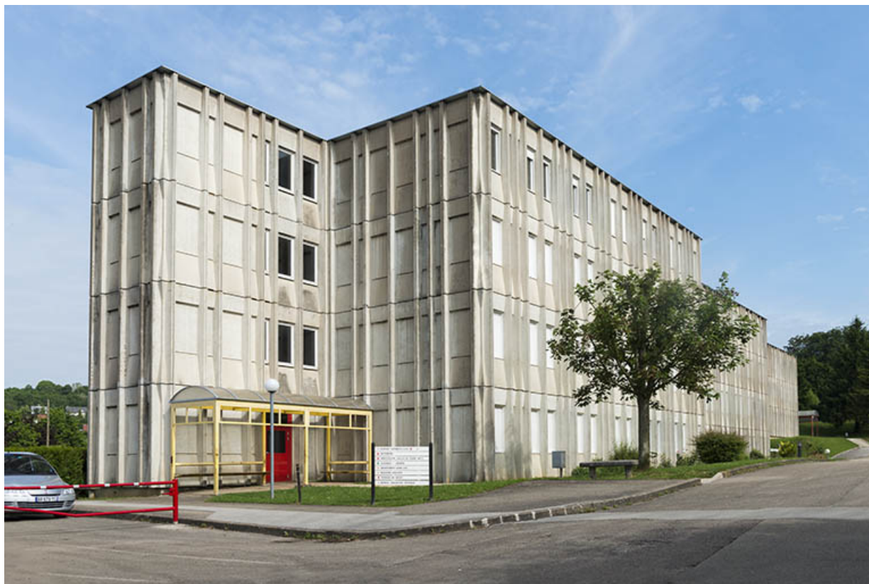
Pignon sud et façade est antérieure de l'internat.