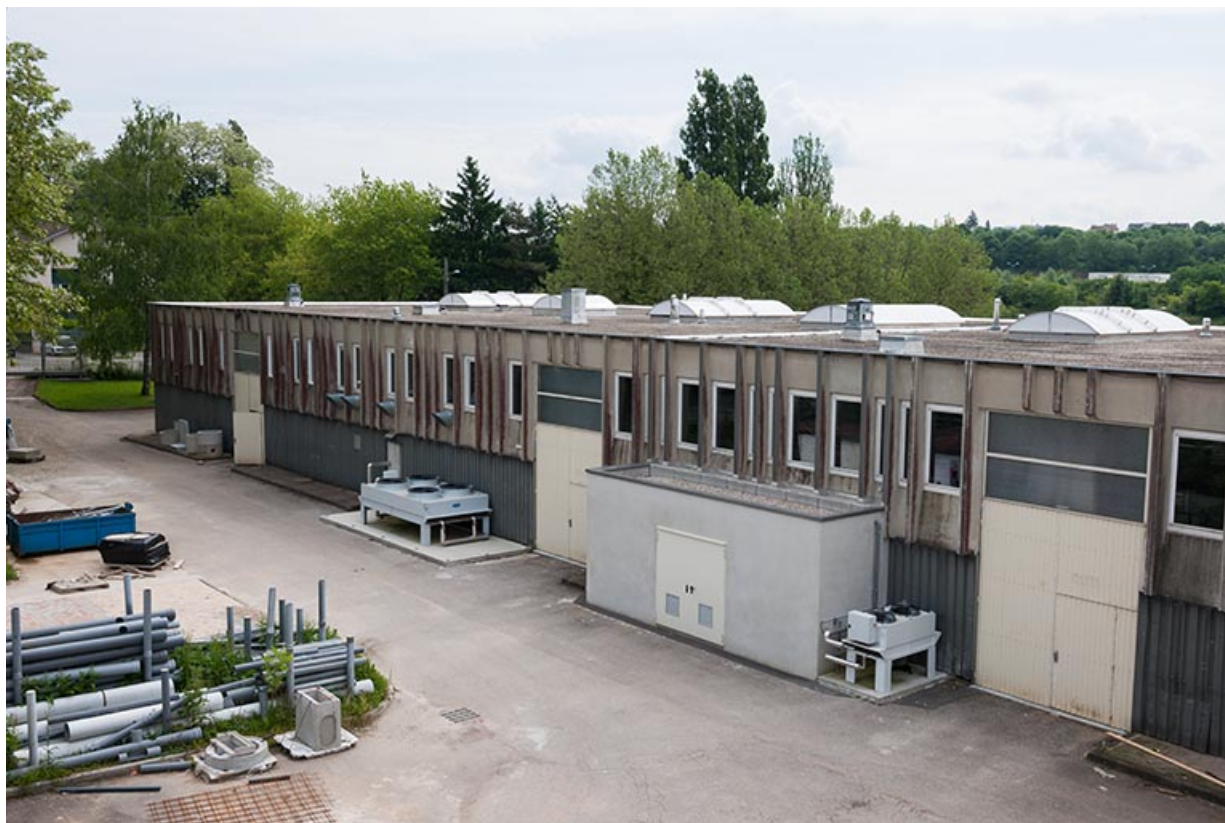
Face postérieure nord-ouest de l'aile nord-est de l'externat depuis le sud. 25, Besançon, 8 rue Mercator