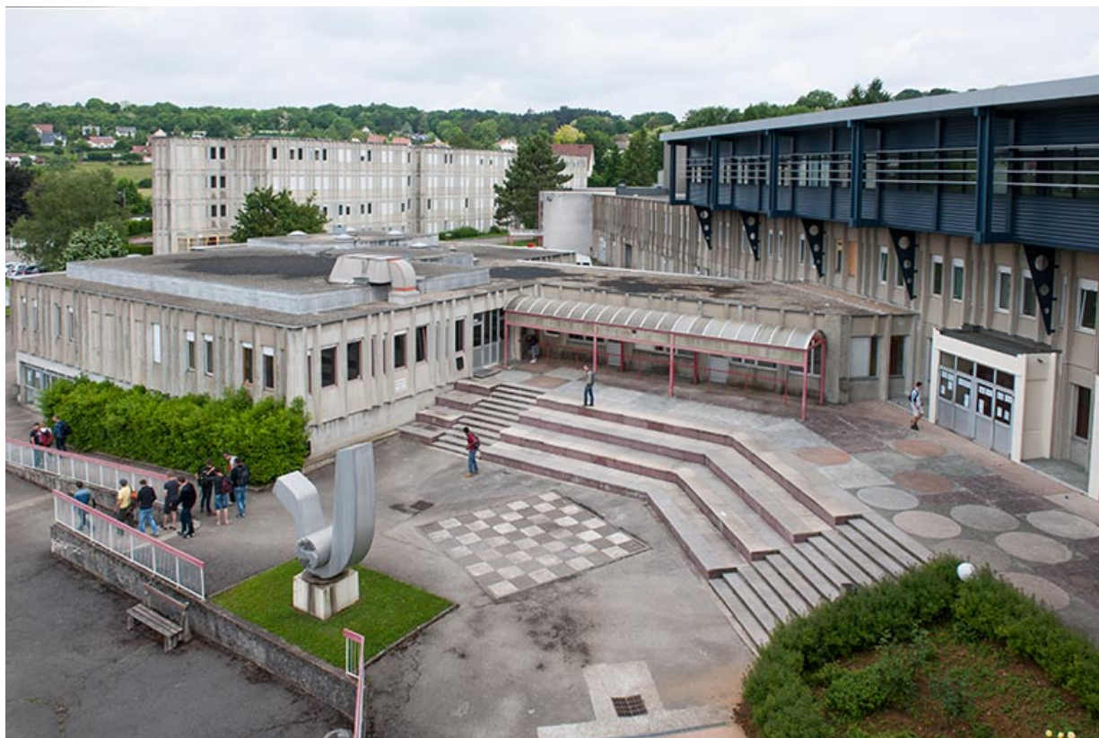
Vue d'ensemble : entrée, cour, externat surélevé, cuisines, sculpture. 25, Besançon, 8 rue Mercator