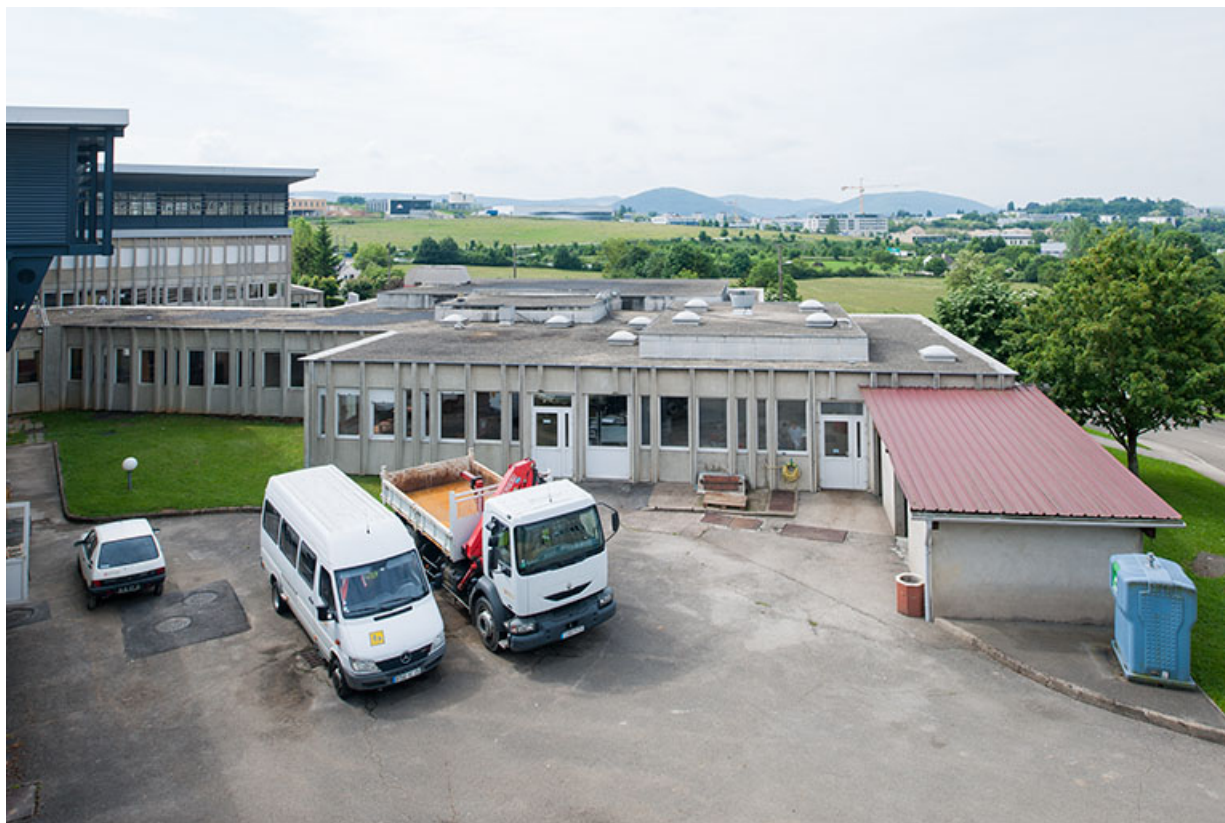
Façade postérieure nord de la cantine et vue sur l'externat surélevé. 25, Besançon, 8 rue Mercator