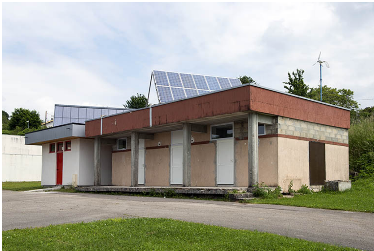
Face antérieure ouest du vestiaire.