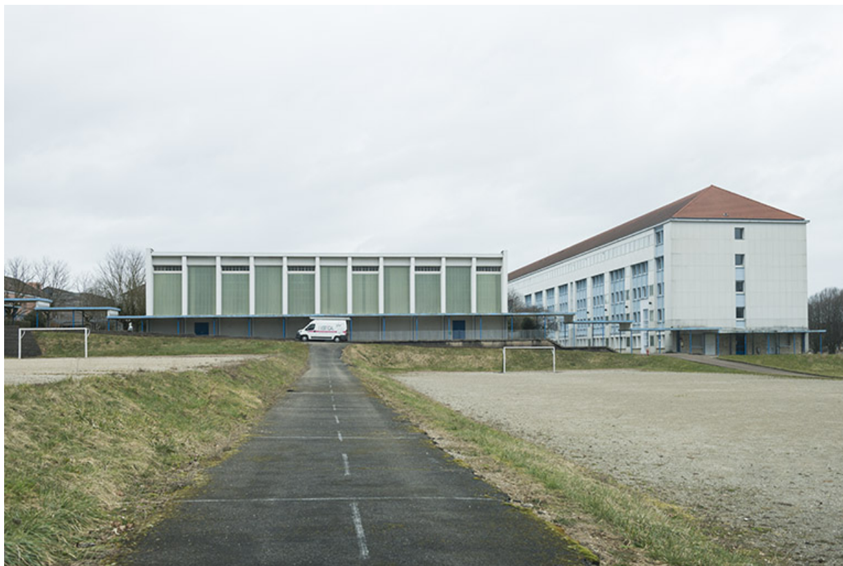
Vue sur la façade sud-ouest du gymnase des garçons, terrain de sport, pignon sud-ouest de l'externat.

25, Besançon, 91, 93 boulevard Léon Blum, lieudit : Palente