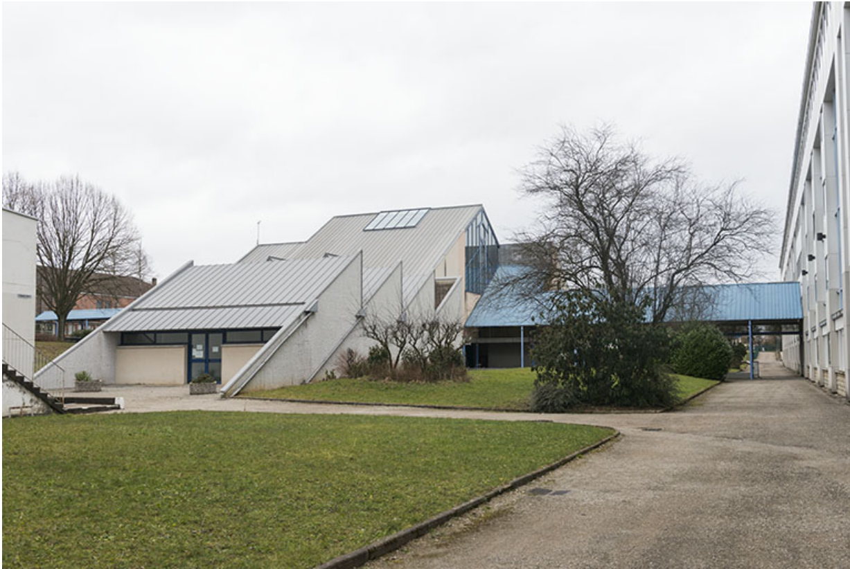
Vue du centre de documentation et d'information depuis le sud-ouest le long de la façade postérieure de l'externat. 25, Besançon, 91, 93 boulevard Léon Blum, lieudit : Palente