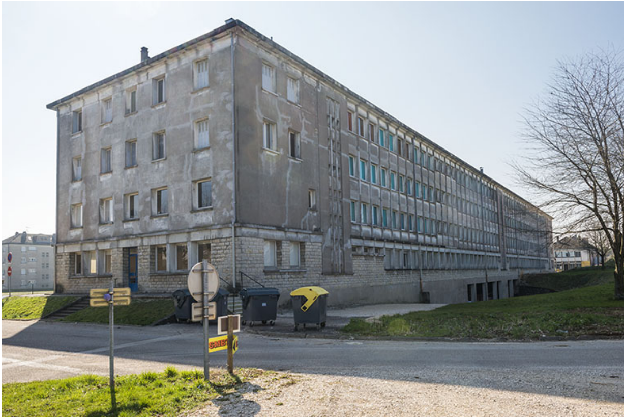
Façade postérieure de l'internat de filles.

25, Besançon, 91, 93 boulevard Léon Blum, lieudit : Palente