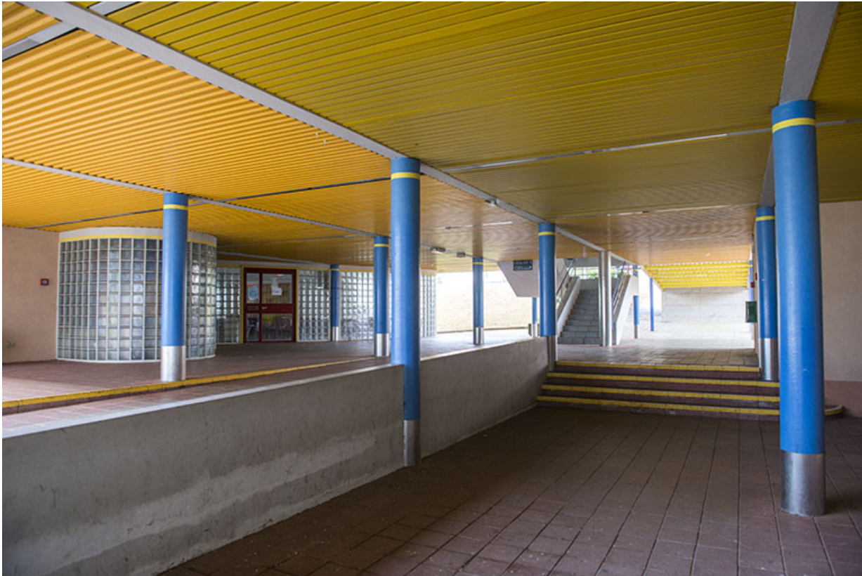
Vue intérieure de circulation abritée.

25, Besançon, 91, 93 boulevard Léon Blum, lieudit : Palente