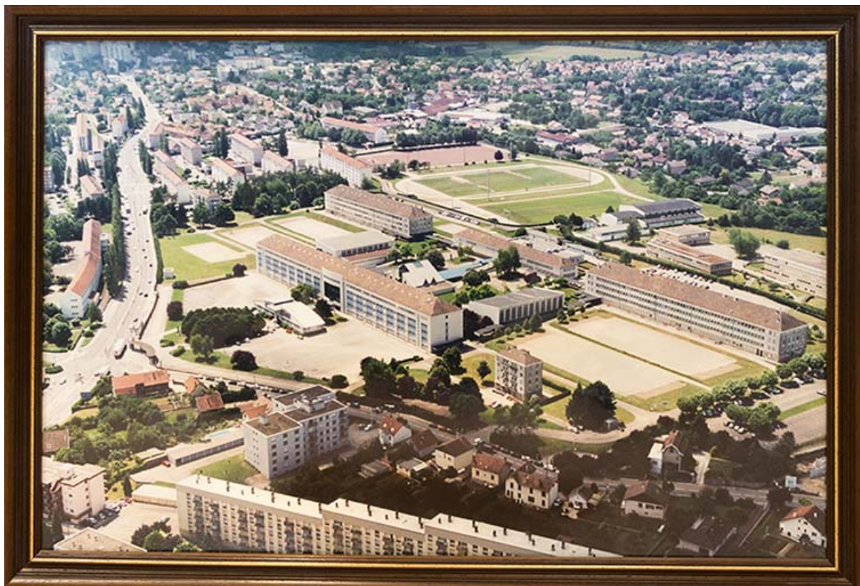
Vue aérienne du lycée (sans date).

25, Besançon, 91, 93 boulevard Léon Blum, lieudit : Palente