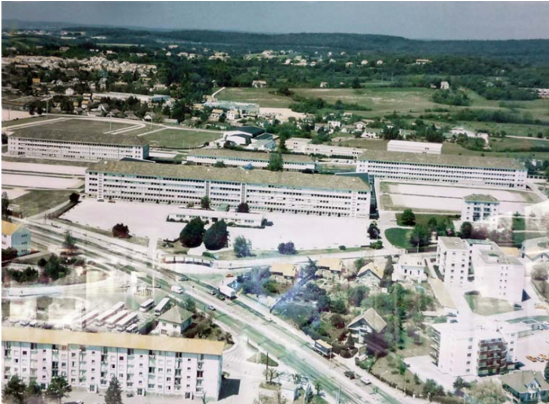
Vue aérienne du lycée (sans date).

25, Besançon, 91, 93 boulevard Léon Blum, lieudit : Palente