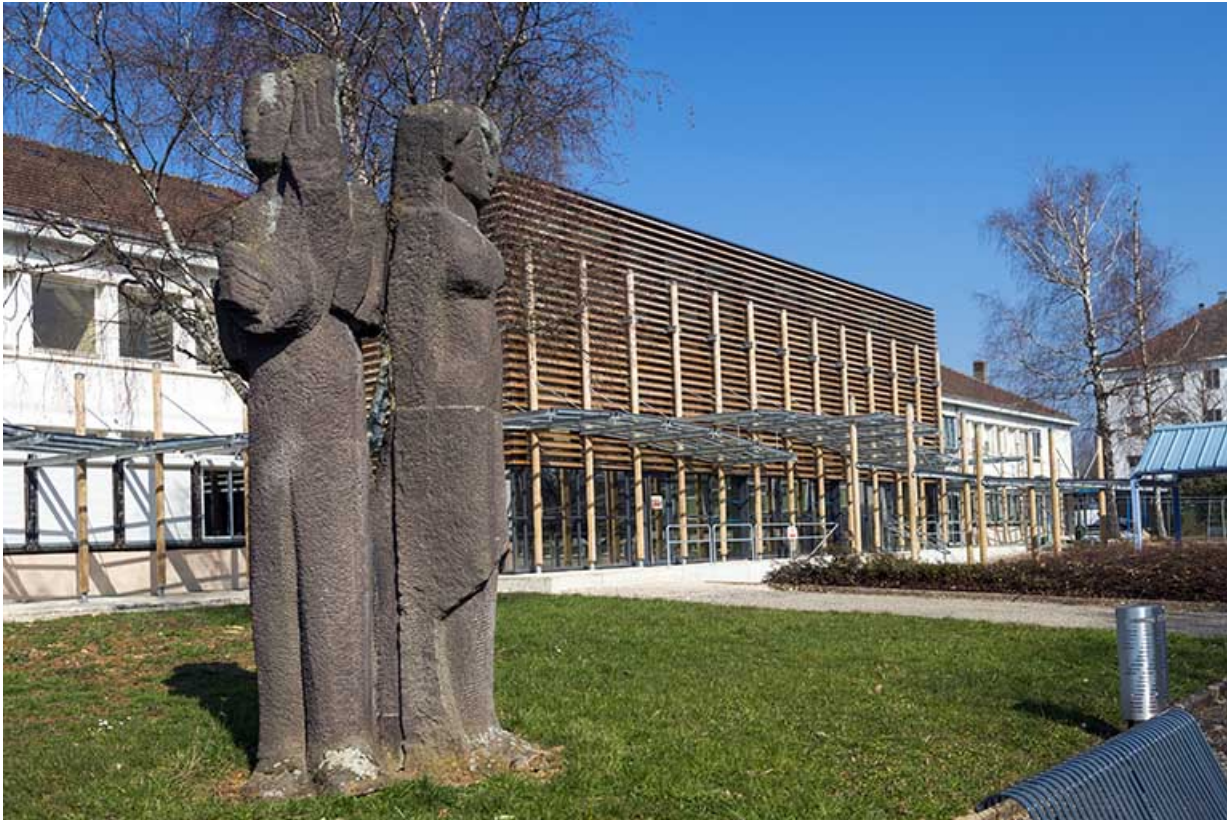
Le groupe sculpté de Salomé Venard dans son contexte.