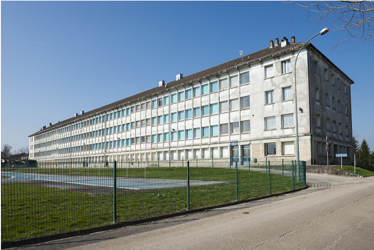
Vue de trois-quart sud-est de l'internat de filles.

25, Besançon, 91, 93 boulevard Léon Blum, lieudit : Palente