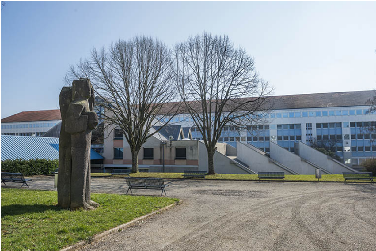
Le groupe sculpté devant les façades postérieures du centre de documentation et d'information et de l'externat. 91, 93 boulevard Léon Blum