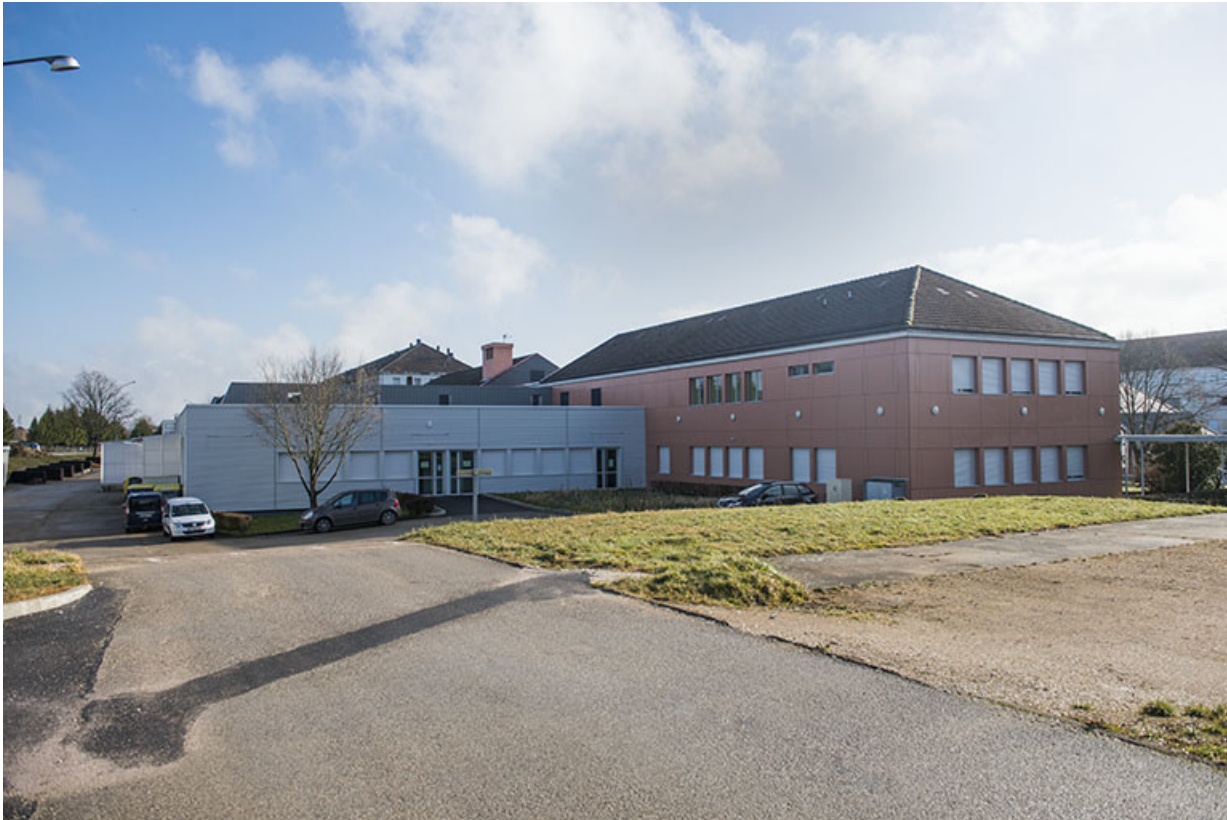
Vue de trois quart arrière ouest des services communs.

25, Besançon, 91, 93 boulevard Léon Blum, lieudit : Palente