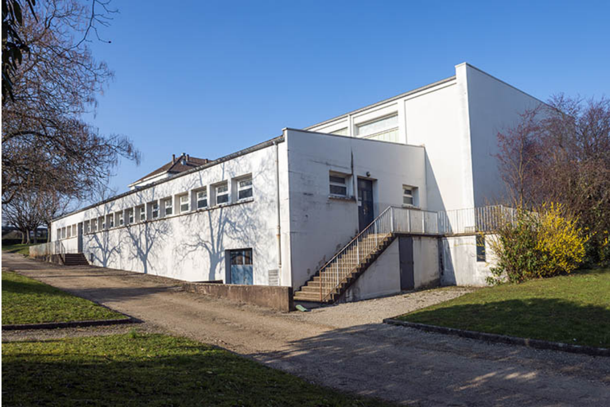
Façade nord-est du gymnase de garçons.

25, Besançon, 91, 93 boulevard Léon Blum, lieudit : Palente