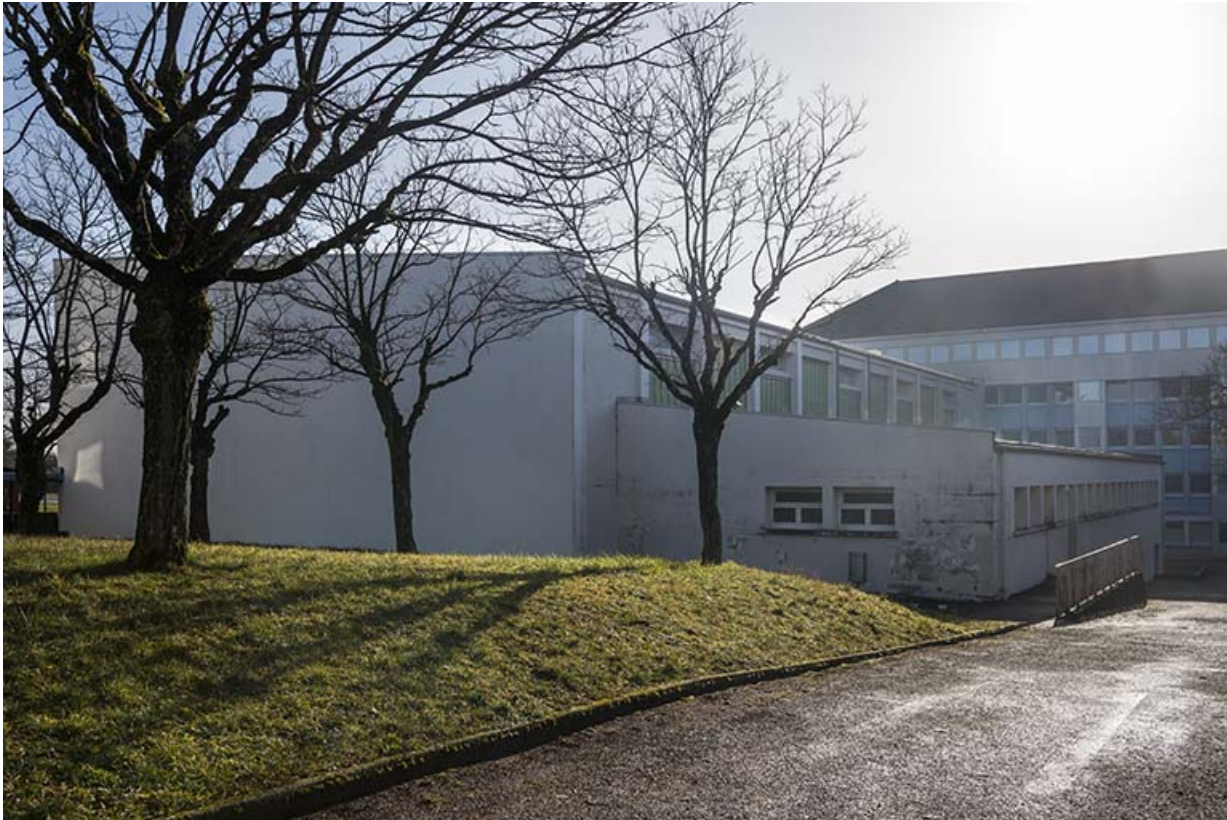
Vue de trois-quart nord-ouest du gymnase de filles.

25, Besançon, 91, 93 boulevard Léon Blum, lieudit : Palente