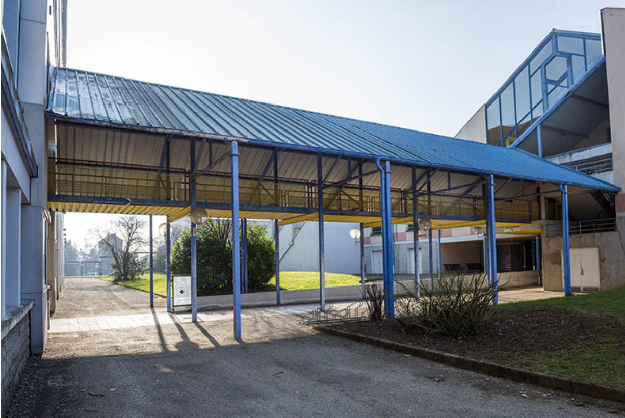
Passage couvert reliant l'externat au centre de documentation et d'information.

25, Besançon, 91, 93 boulevard Léon Blum, lieudit : Palente