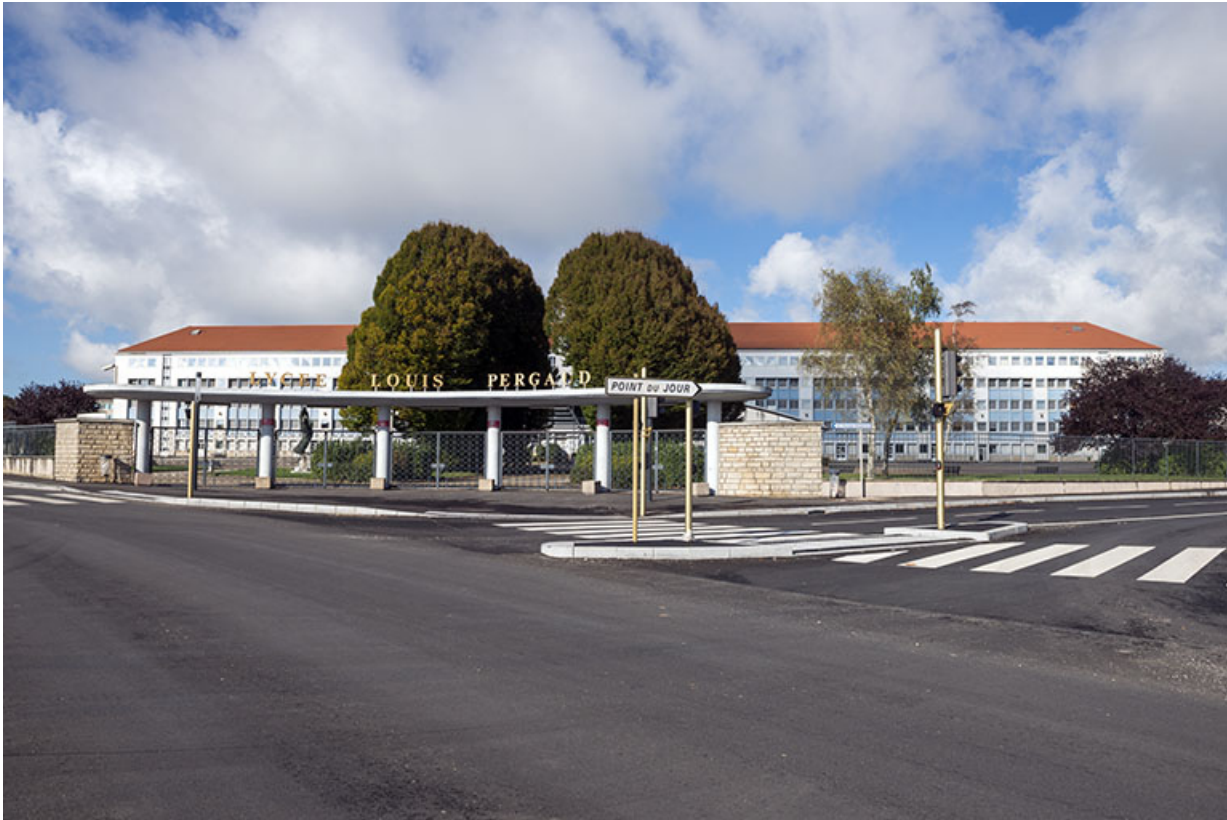
L'entrée principale le long du boulevard.

25, Besançon, 91, 93 boulevard Léon Blum, lieudit : Palente