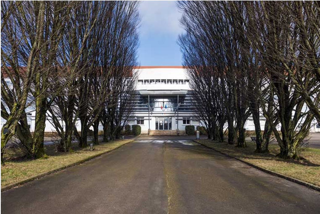
L'allée de l'entrée principale vers la façade sud-est de l'administration.

25, Besançon, 91, 93 boulevard Léon Blum, lieudit : Palente