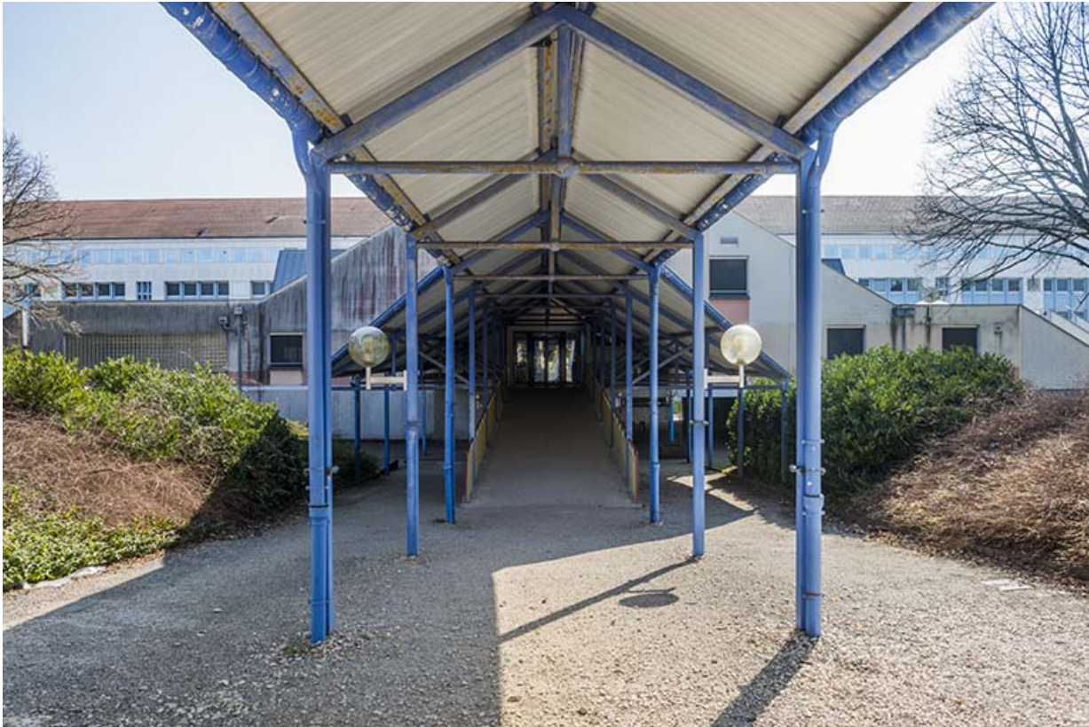
Passage couvert menant au centre de documentation et d'information.

25, Besançon, 91, 93 boulevard Léon Blum, lieudit : Palente