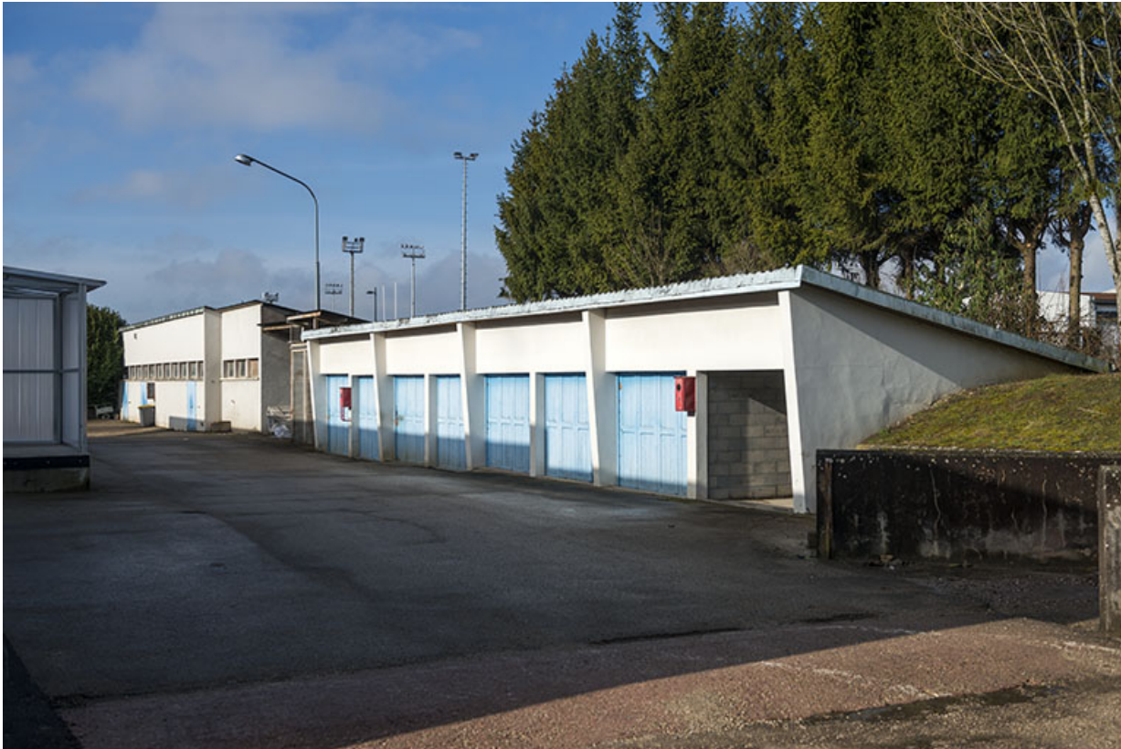
Façades sud-est des ateliers au nord-ouest de la parcelle, derrière les services communs, vus de l'est. 25, Besançon, 91, 93 boulevard Léon Blum, lieudit : Palente