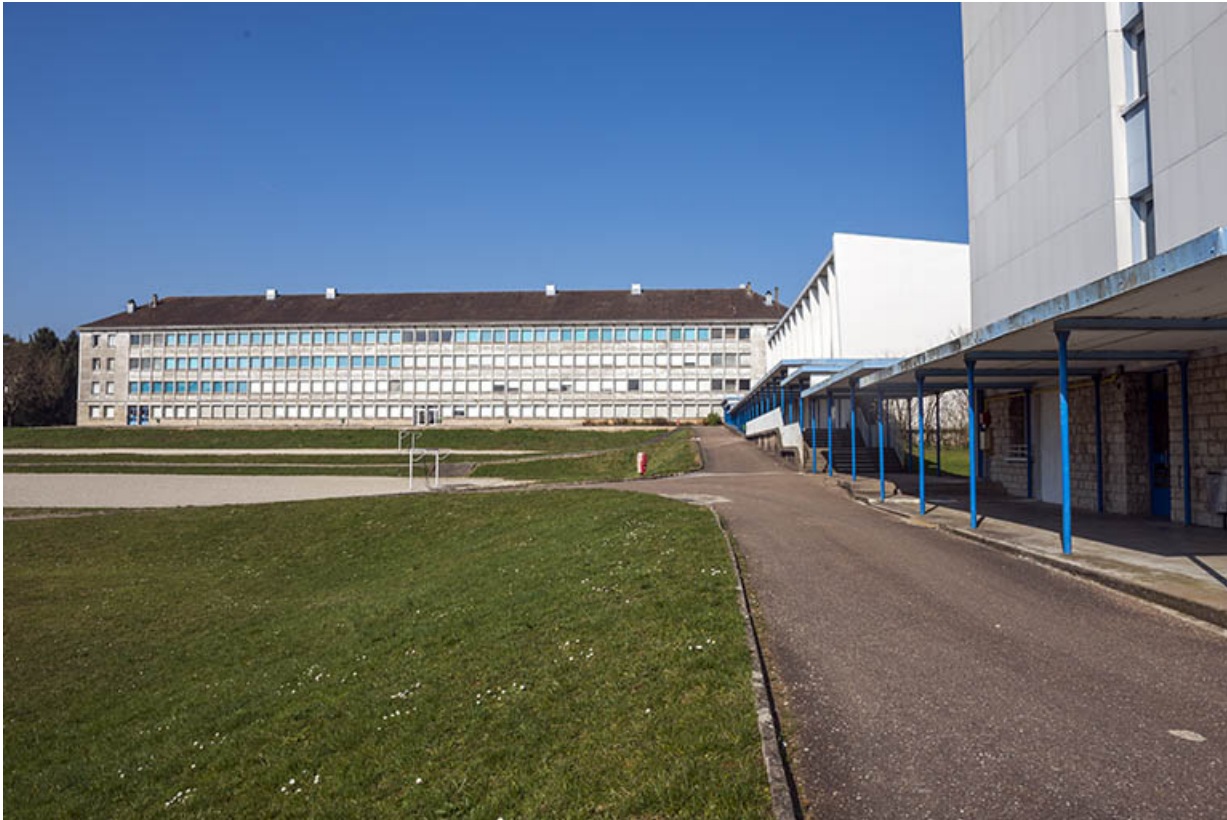
Vue de la façade sud de l'internat de garçons.

25, Besançon, 91, 93 boulevard Léon Blum, lieudit : Palente