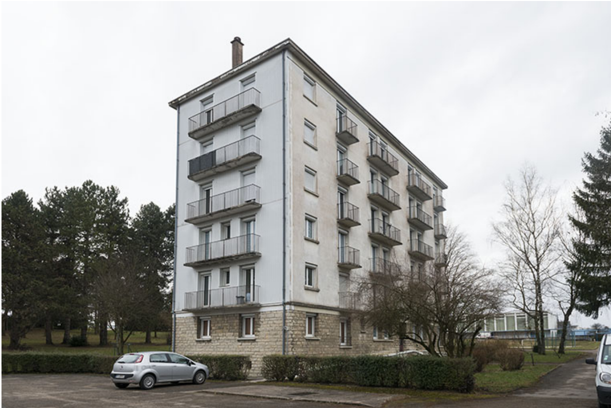
Vue de trois-quart sud des logements ouest de fonction.

25, Besançon, 91, 93 boulevard Léon Blum, lieudit : Palente