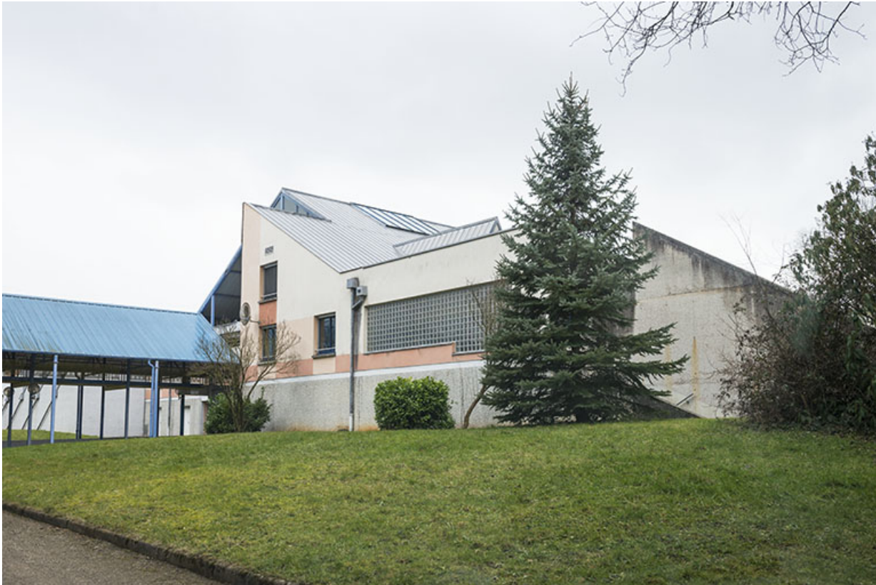
Vue de trois-quart est de la façade postérieure sud-est du cdi et circulation abritée vers l'externat.

25, Besançon, 91, 93 boulevard Léon Blum, lieudit : Palente