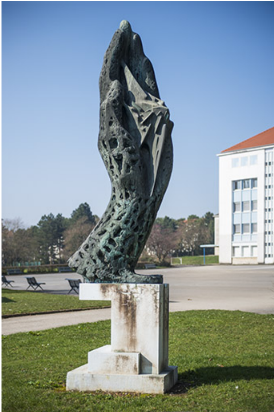
L'oeuvre d'Oudot dans son contexte.