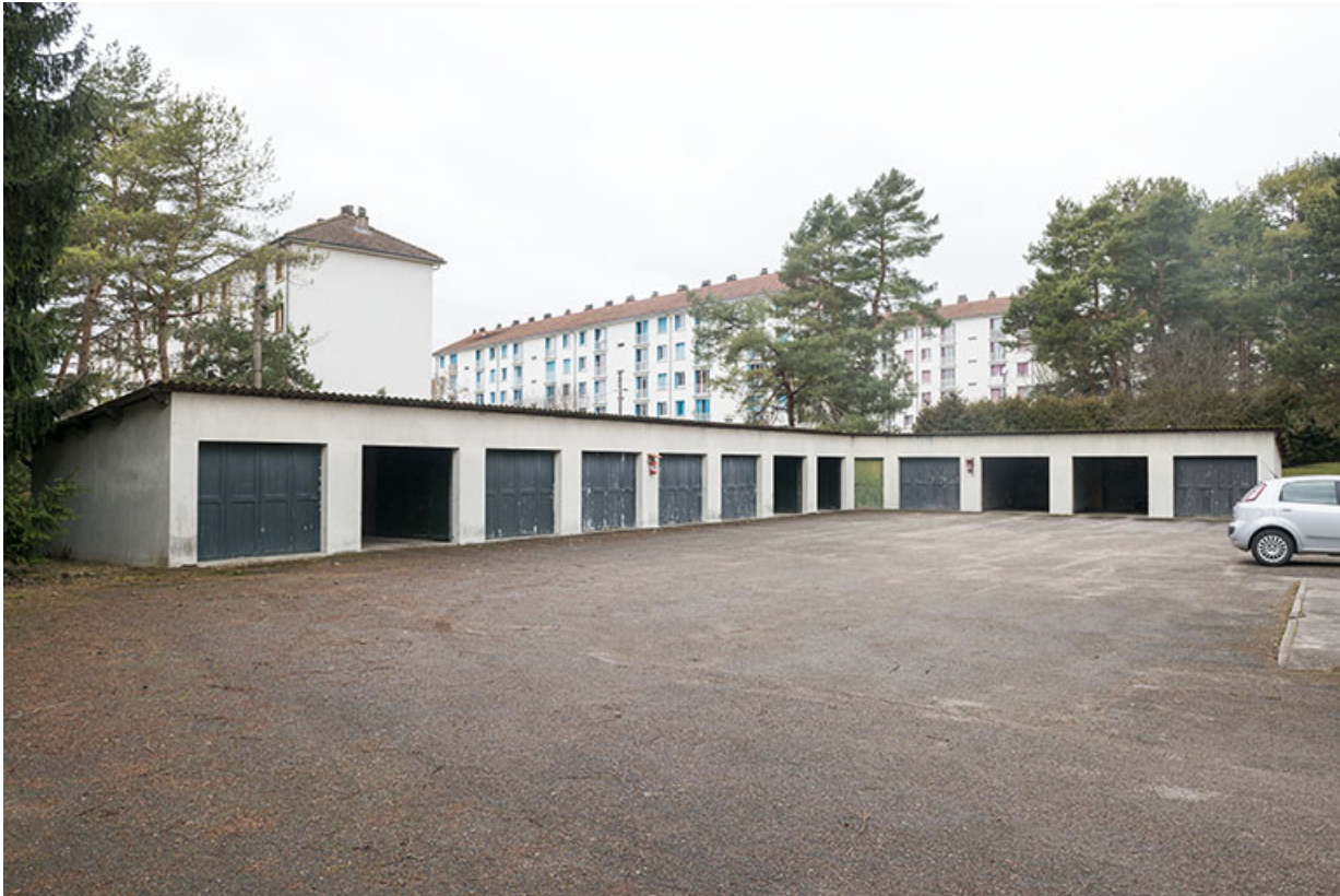
Vue sur les garages et l'environnement bâti, au sud-ouest de la parcelle.

25, Besançon, 91, 93 boulevard Léon Blum, lieudit : Palente