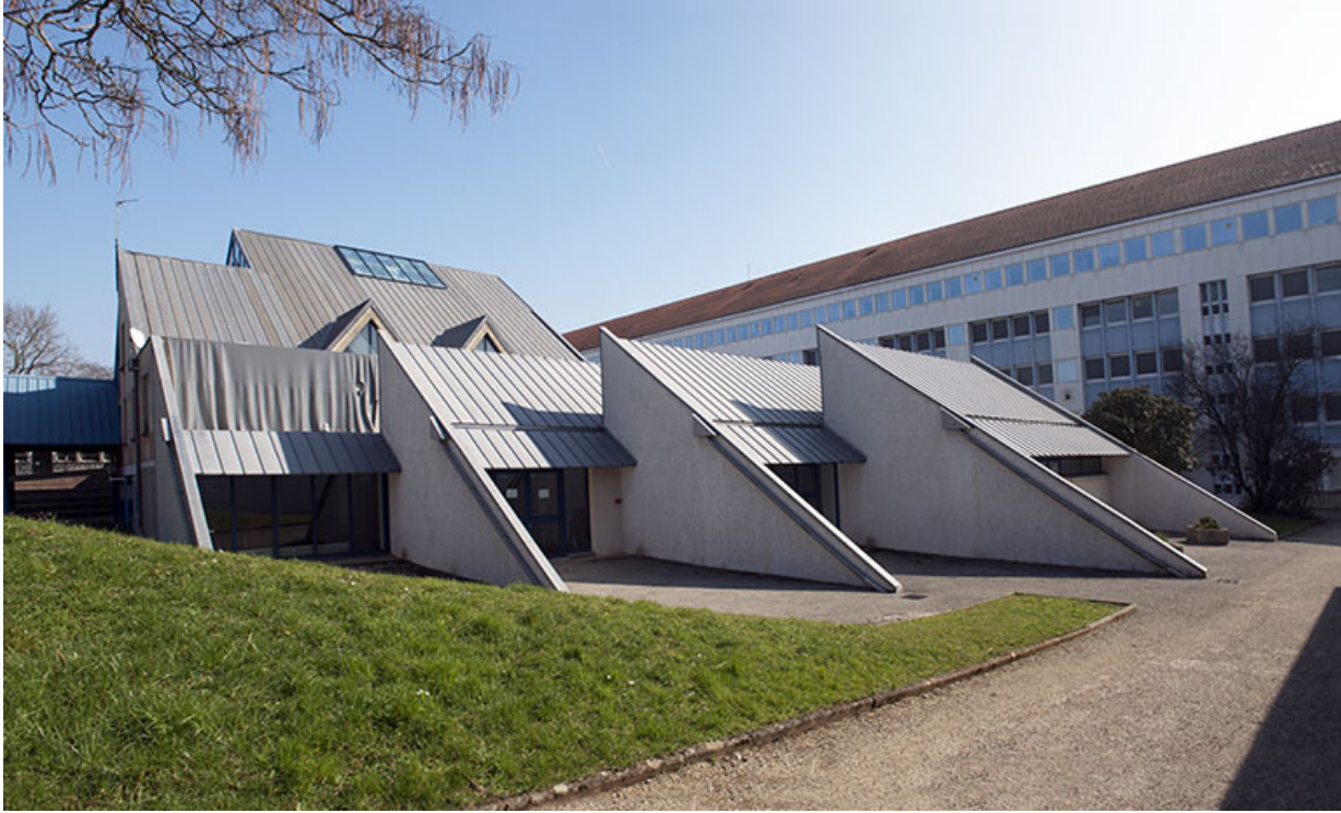
Vue du centre de documentation et d'information depuis le nord-ouest et façade postérieure de l'externat.

25, Besançon, 91, 93 boulevard Léon Blum, lieudit : Palente