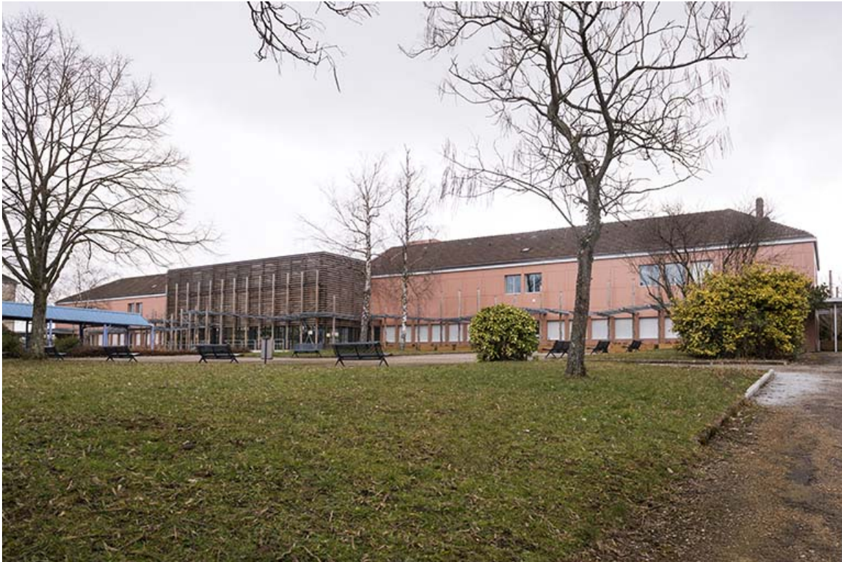
Vue de trois-quart de la façade antérieure sud-est des services communs.

25, Besançon, 91, 93 boulevard Léon Blum, lieudit : Palente