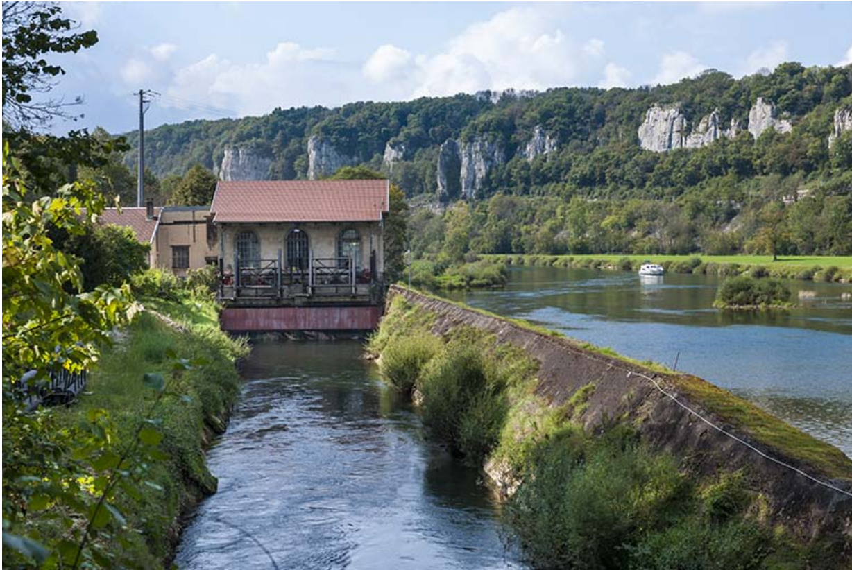
Vue depuis le canal d'amenée.