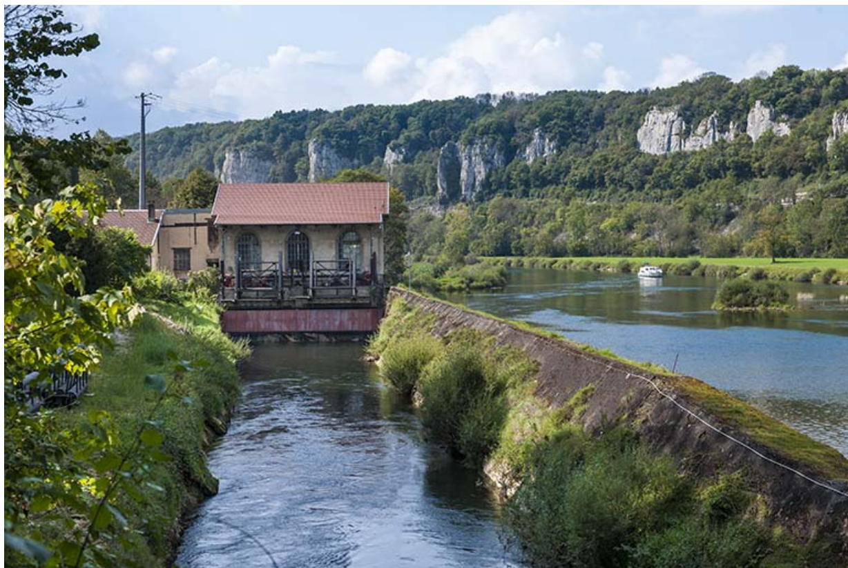
Vue depuis le canal d'aménée.