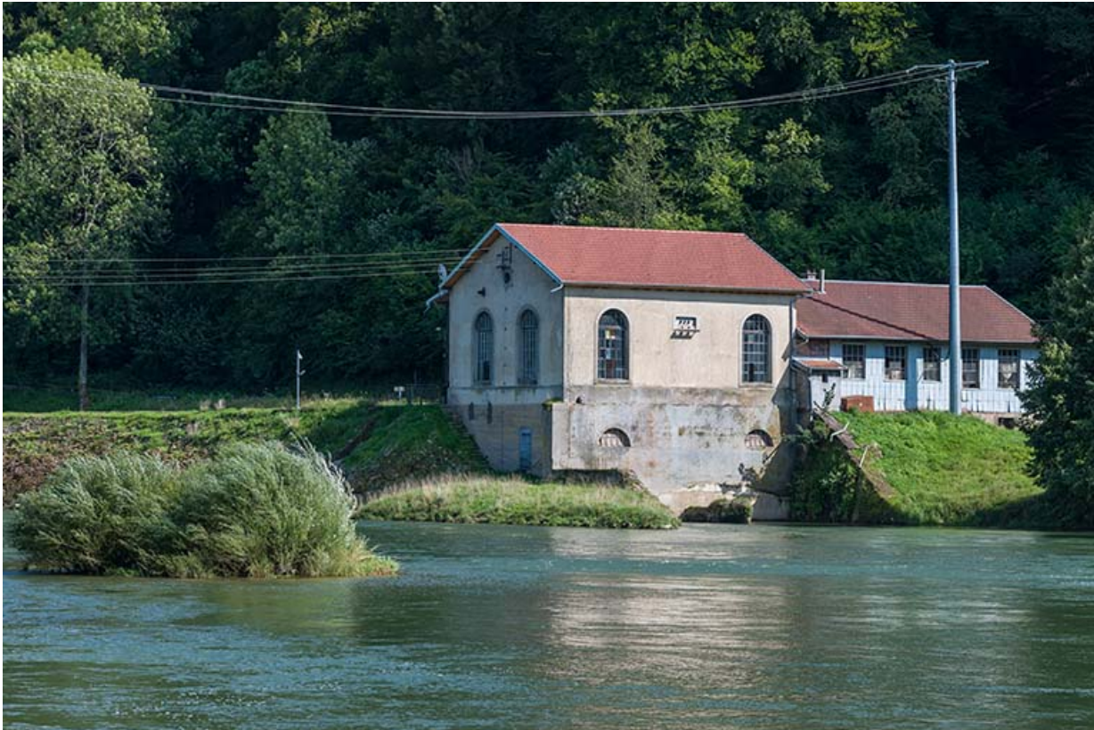
Vue de trois quarts depuis l'aval.