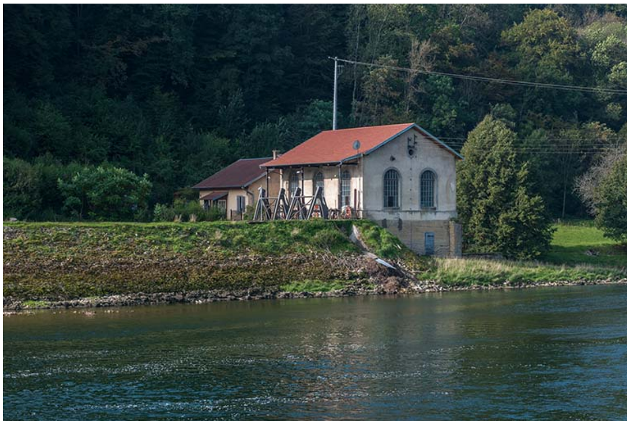
Vue de trois quarts depuis la rive droite.