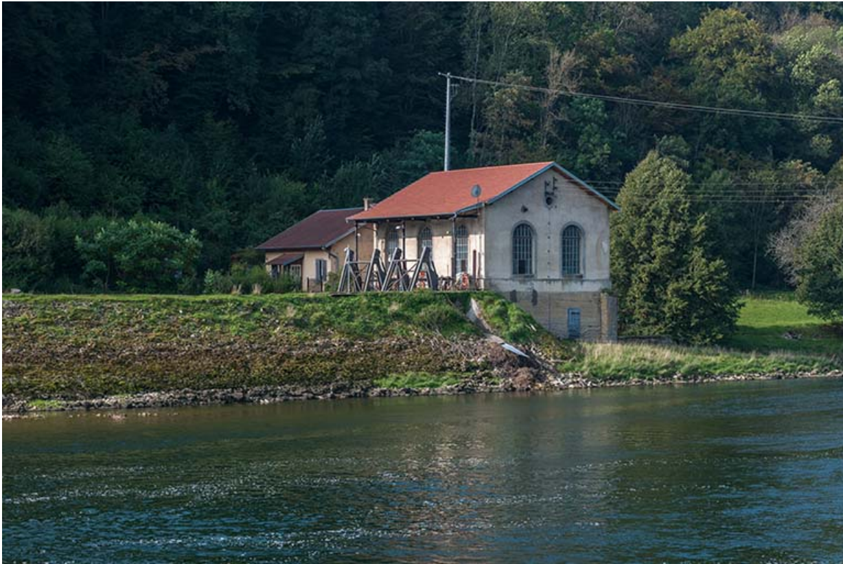
Vue de trois quarts depuis la rive droite.