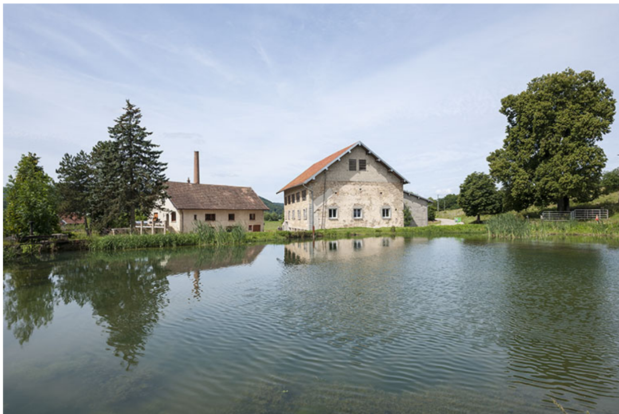
Vue d'ensemble depuis l'étang de retenue.