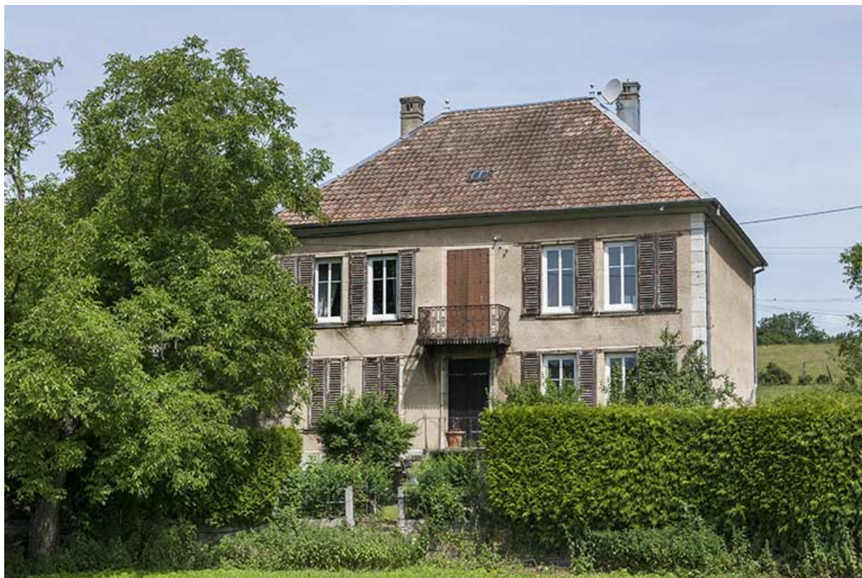
Façade sud du logement.