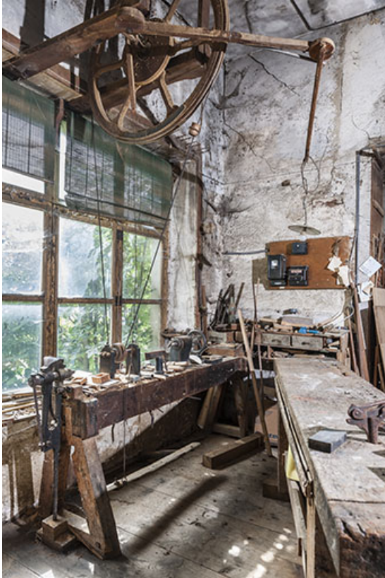
Détail du tour à pédalier.