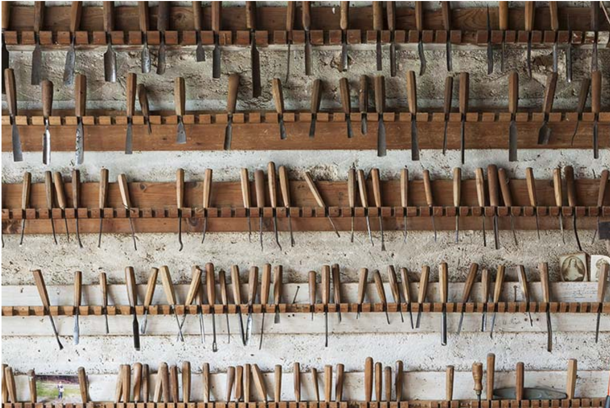
Détail du râtelier des gouges et ciseaux à bois.

25, Sancey-le-Long, 8 rue de Lattre de Tassigny