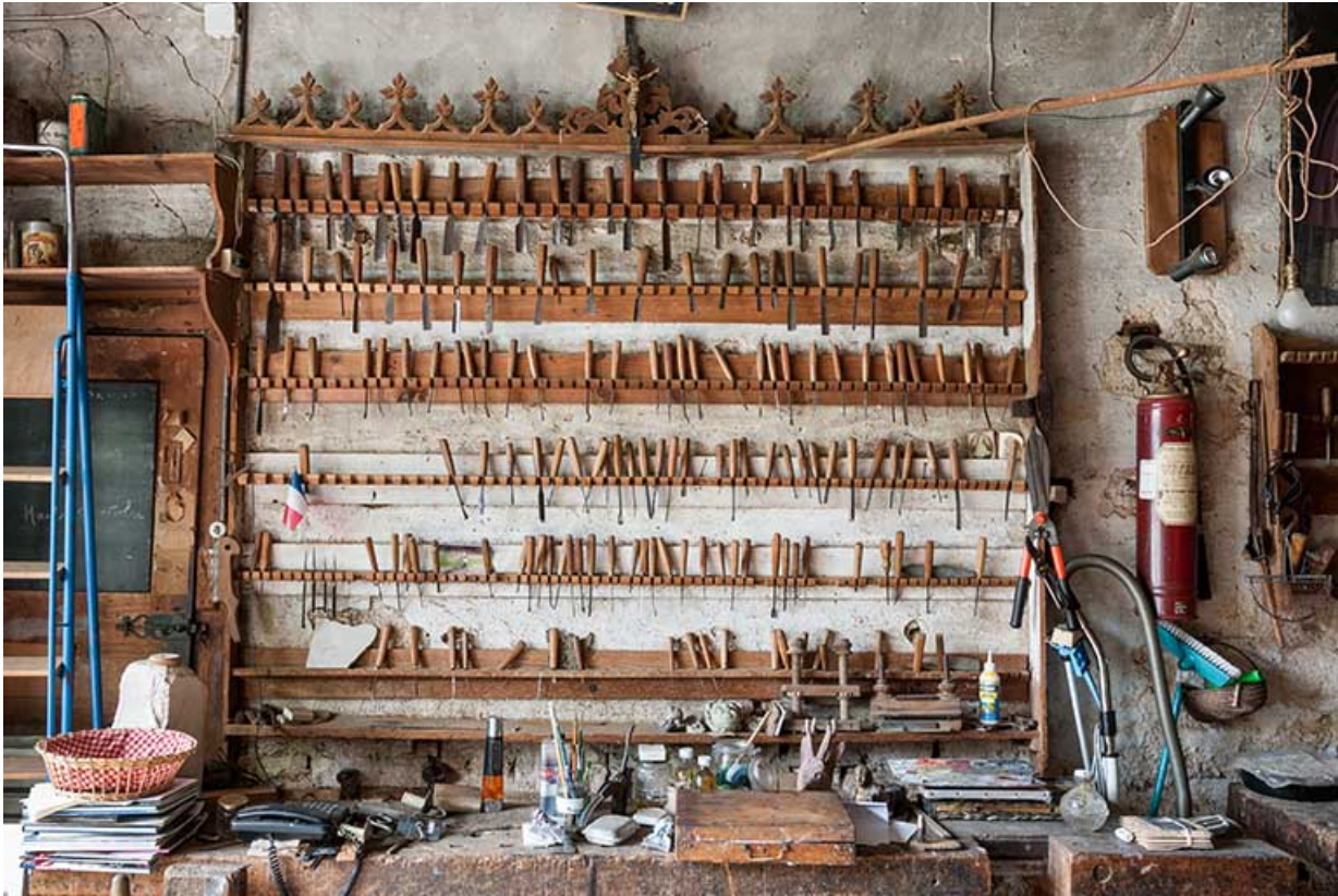
Râtelier et établi contre le mur sud.

25, Sancey-le-Long, 8 rue de Lattre de Tassigny