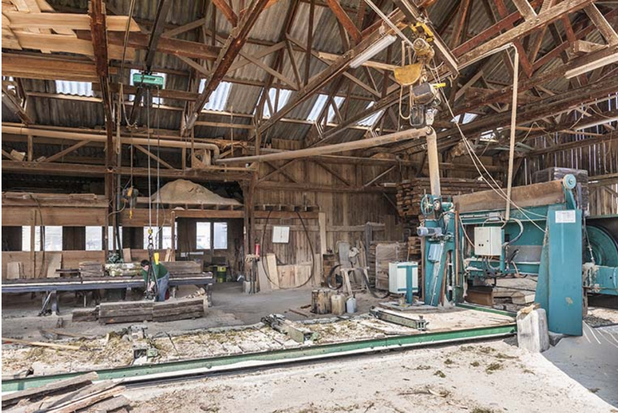
Intérieur de l'atelier de sciage.