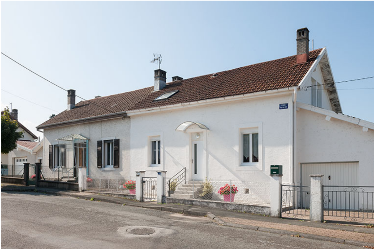
Maison jumelée vue de trois quarts droite. 25, L'Isle-sur-le-Doubs rue Voulot