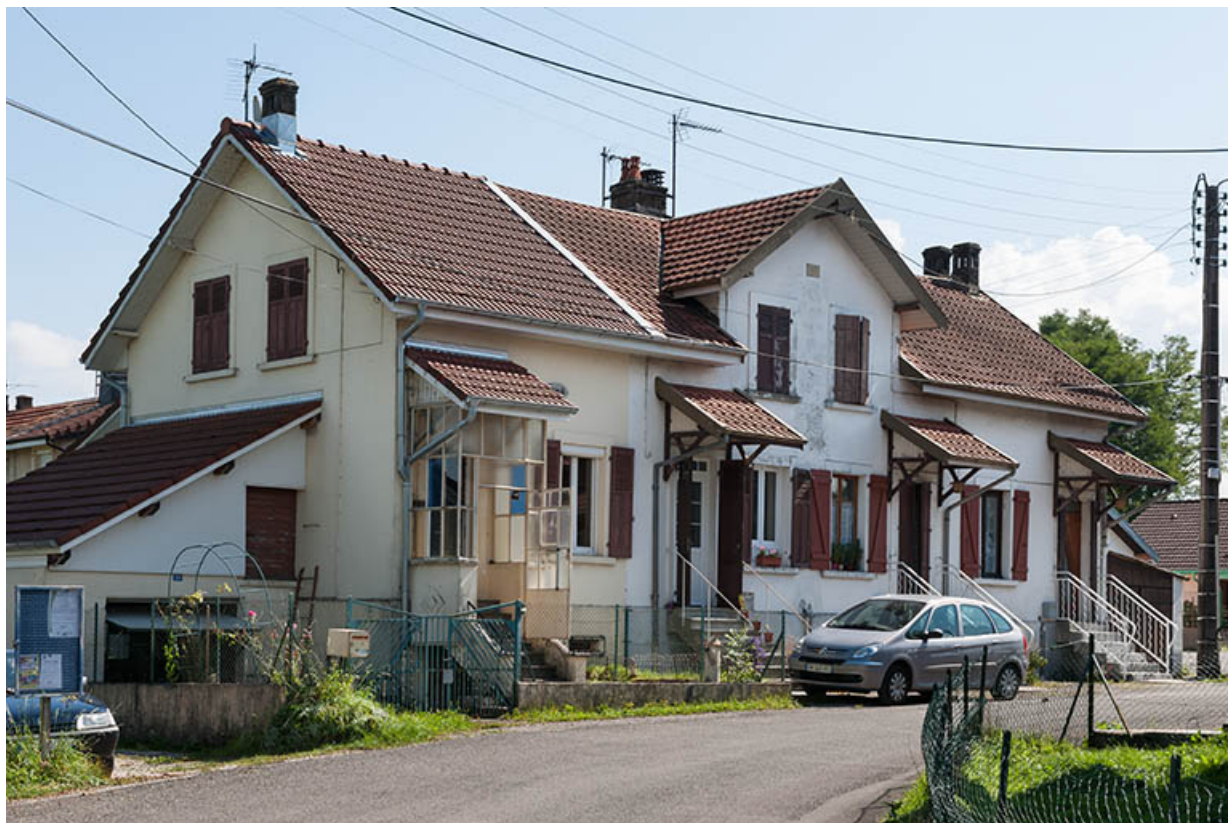
Habitation à 4 logements vue de trois quarts gauche.

25, L'Isle-sur-le-Doubs, 34 à 77 rue de la Balistrerie