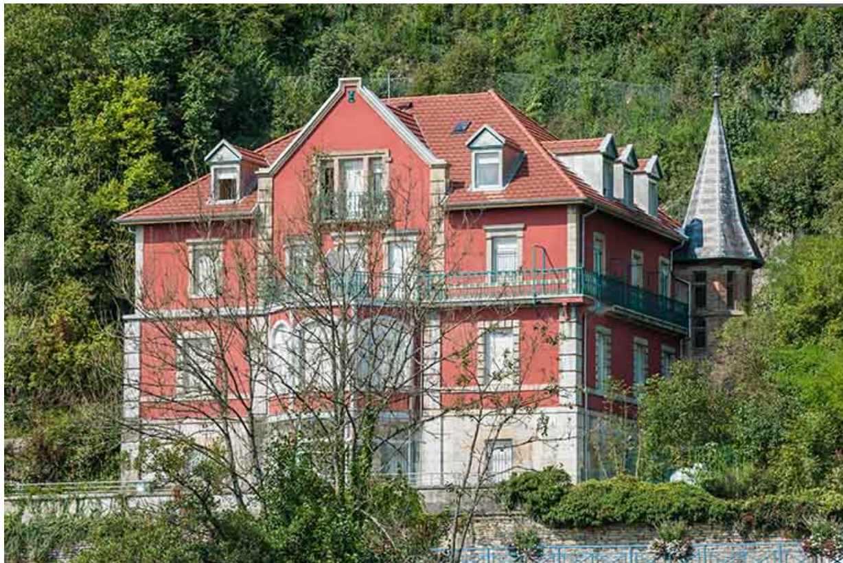
La demeure vue de trois quarts droite.