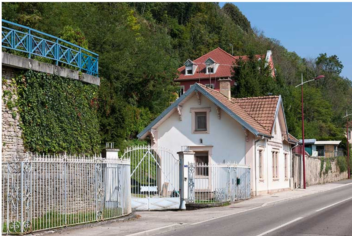
La conciergerie et la demeure depuis la route nationale.