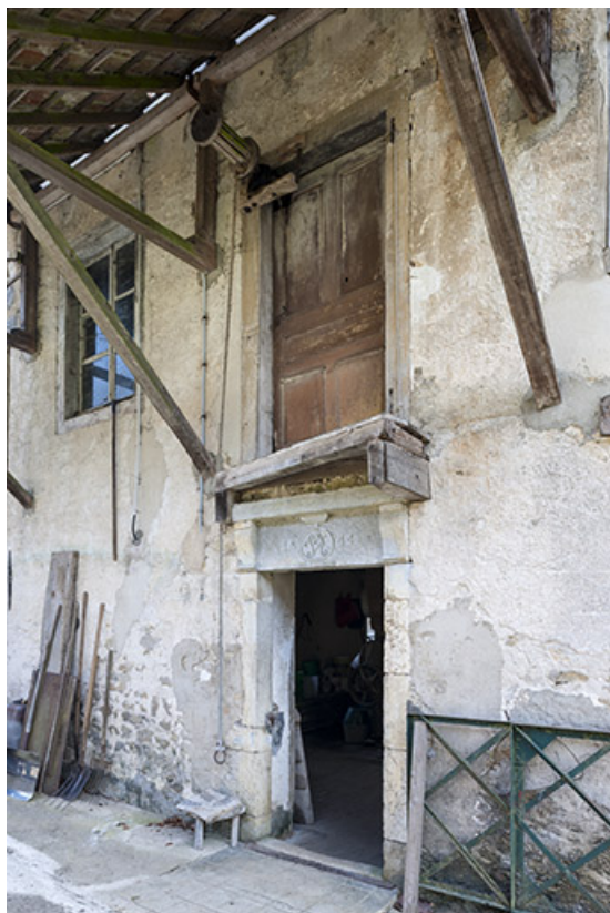
Mur-pignon ouest vu de trois quarts.

25, Villars-sous-Dampjoux, lieudit : Les Grandes Planches