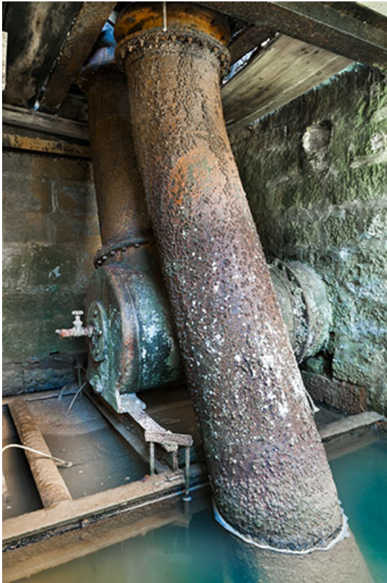
Turbine hydraulique (partie inférieure).

25, Feule, lieudit : le moulin de chez la Dinette