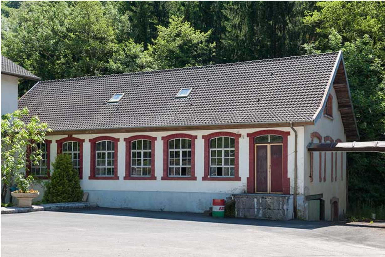
Atelier de quincaillerie vu de trois quarts.

25, Feule, lieudit : le moulin de chez la Dinette