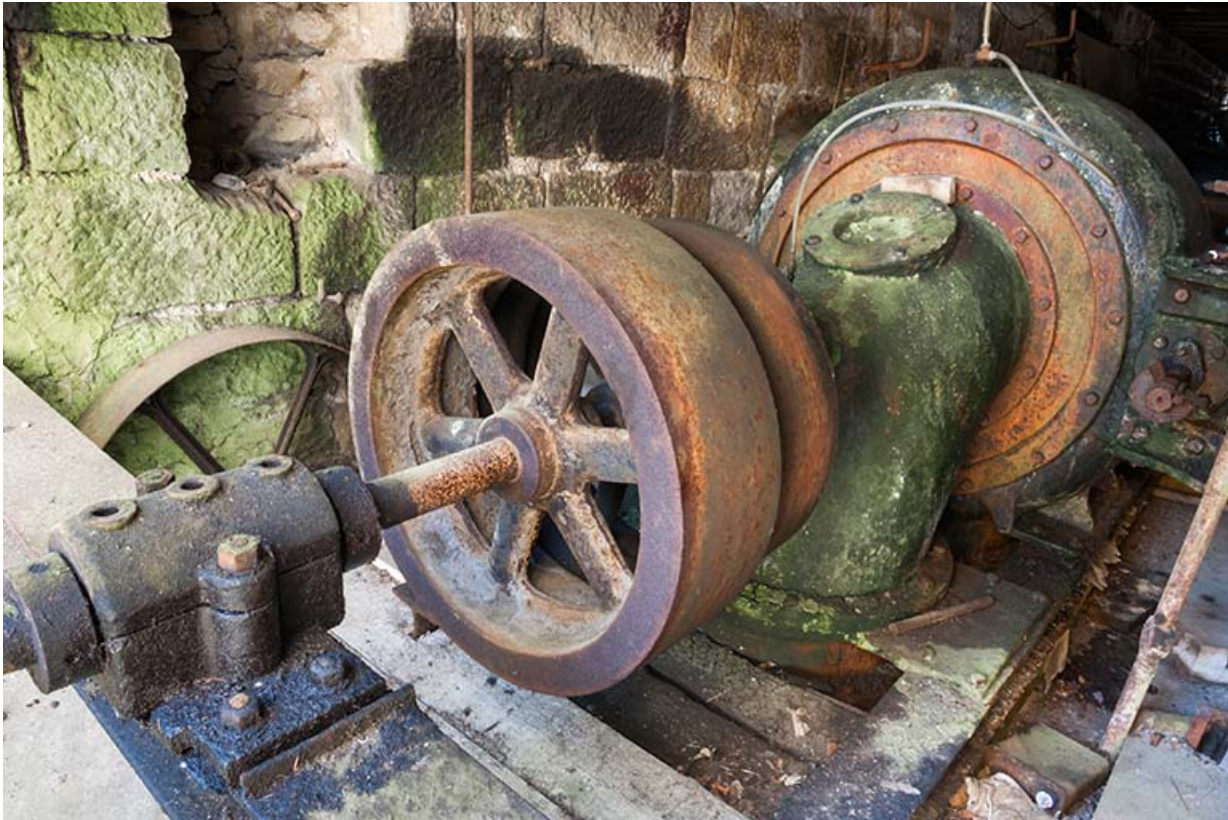
Turbine hydraulique (partie supérieure).

25, Feule, lieudit : le moulin de chez la Dinette