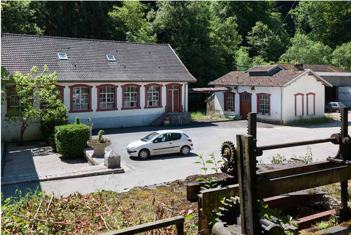
Atelier de quincaillerie et forge depuis le nord.

25, Feule, lieudit : le moulin de chez la Dinette