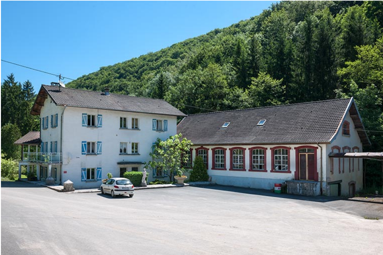
Logement et atelier de quincaillerie depuis l'ouest.

25, Feule, lieudit : le moulin de chez la Dinette