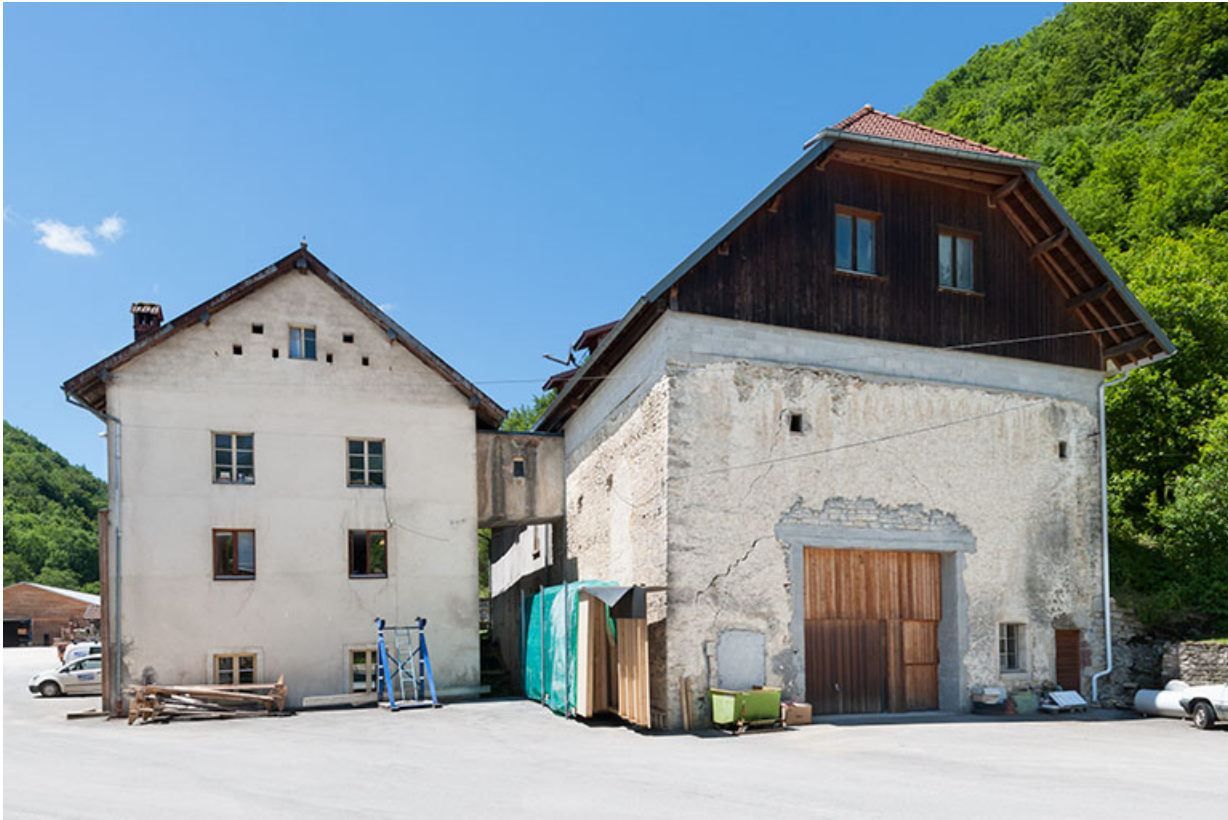
Pignons est du moulin et du logement.