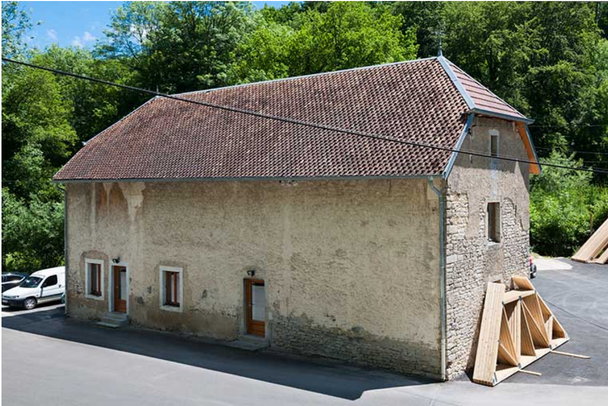
Bâtiment agricole vu de trois quarts.