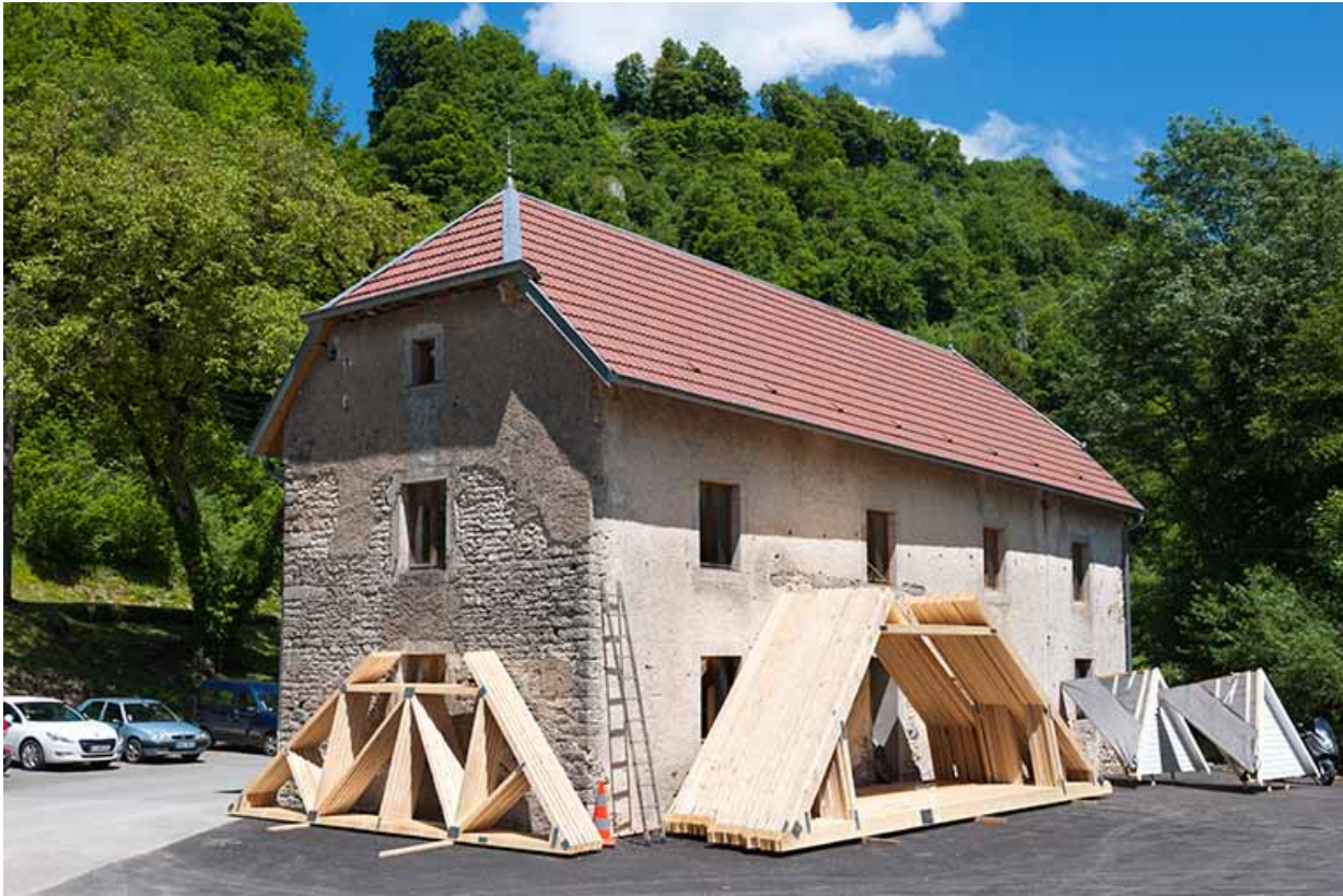
Bâtiment agricole depuis le sud-ouest.