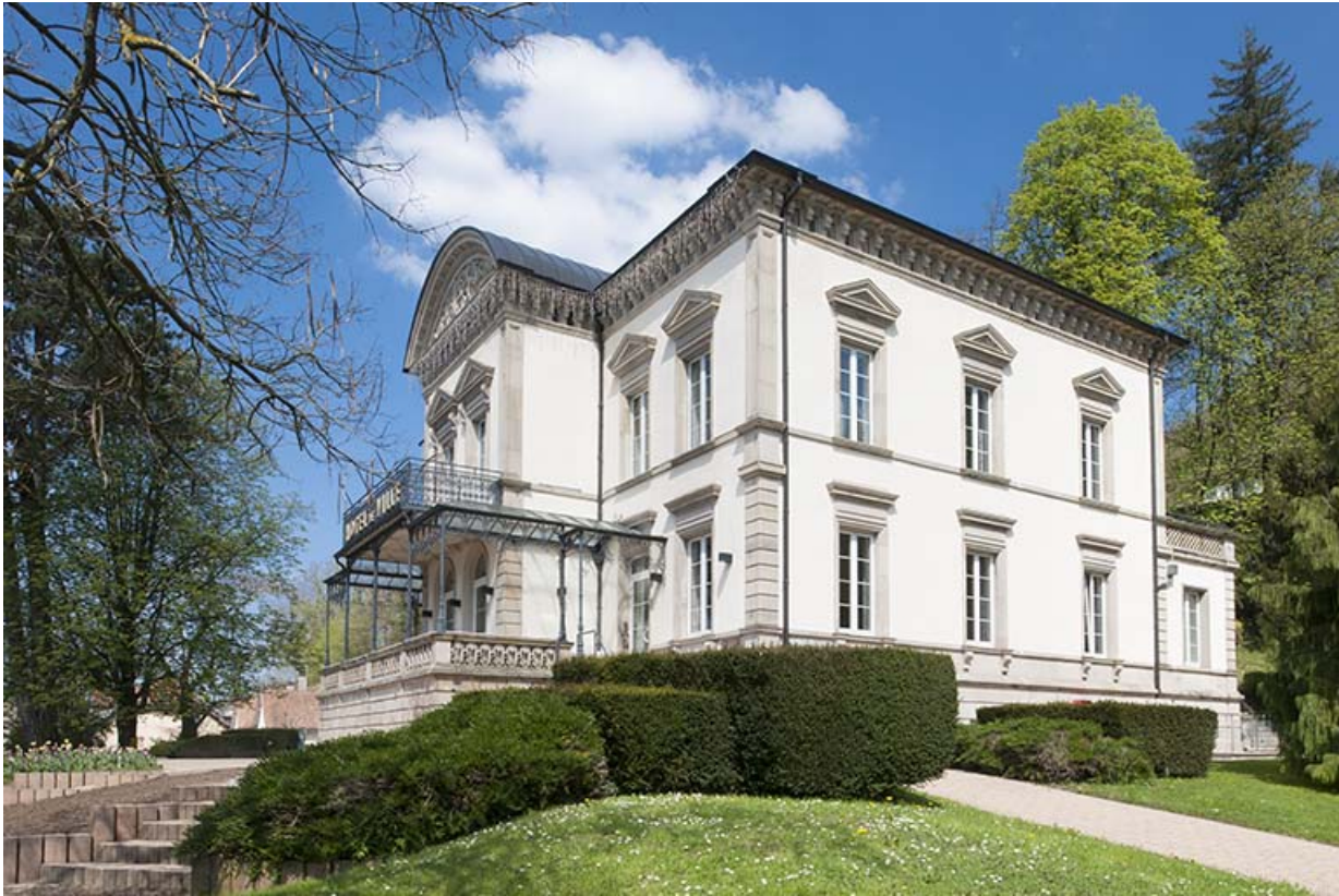
Vue de trois quarts, depuis le parc.

25, Pont-de-Roide, 1 rue du général Herr