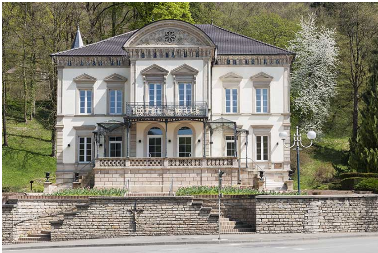
Façade antérieure vue de face.

25, Pont-de-Roide, 1 rue du général Herr