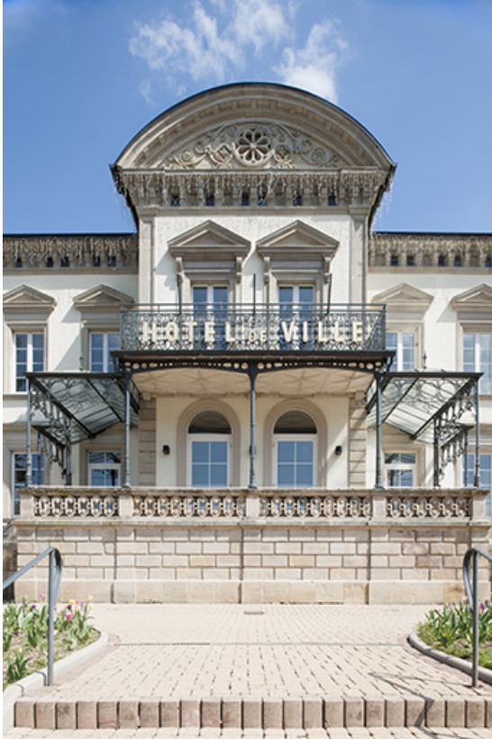
Façade antérieure. Détail de l'avant-corps central.

25, Pont-de-Roide, 1 rue du général Herr