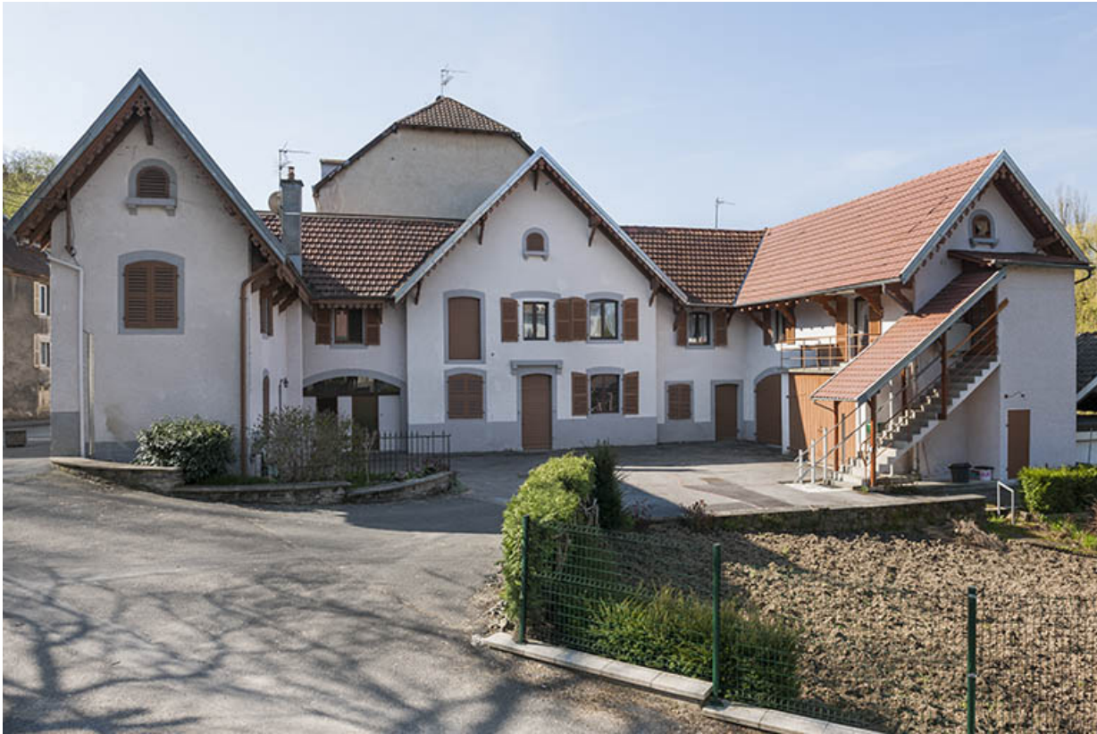
Dépendances (logement, remises et écuries).