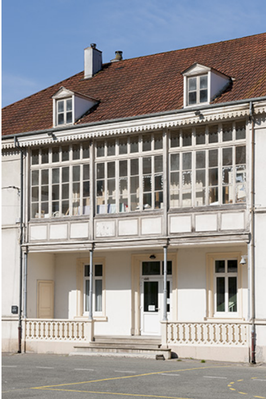
Détail de la loggia de la façade est.

25, Pont-de-Roide, 14 rue du général Herr