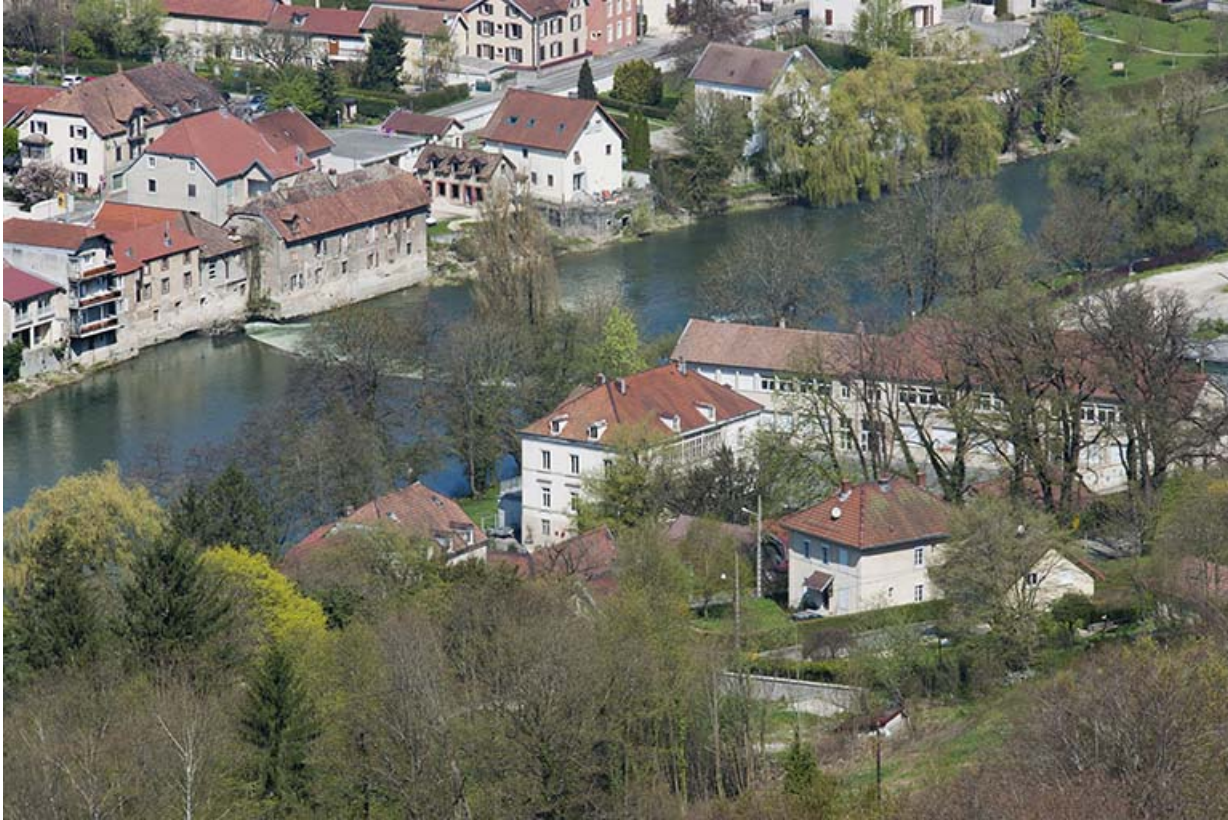
Vue d'ensemble plongeante depuis le sud-est.

25, Pont-de-Roide, 14 rue du général Herr