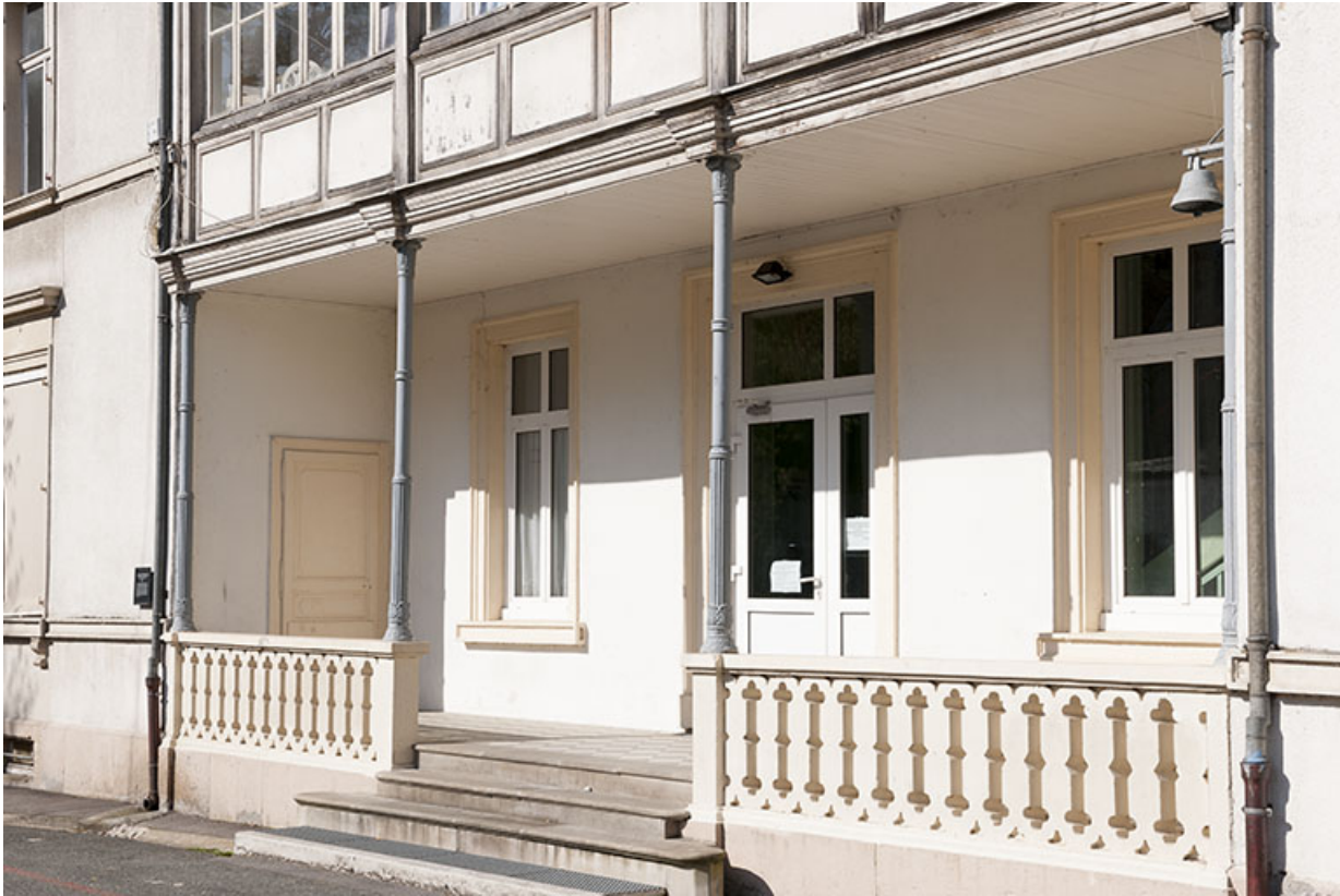
Accès au rez-de-chaussée de la façade est..

25, Pont-de-Roide, 14 rue du général Herr