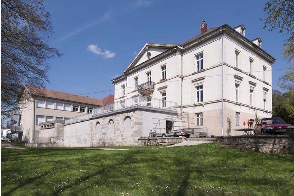
Façade ouest et sa terrasse. Vue de trois quarts.

25, Pont-de-Roide, 14 rue du général Herr