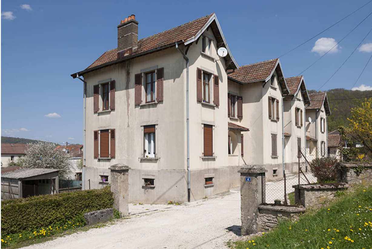
Maison de cadres (6 logements). Vue de trois quarts gauche.