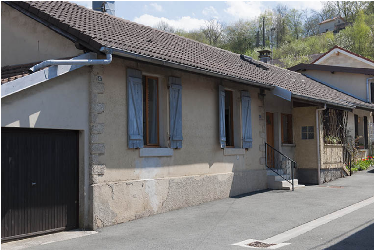
Maison individuelle vue de trois quarts.