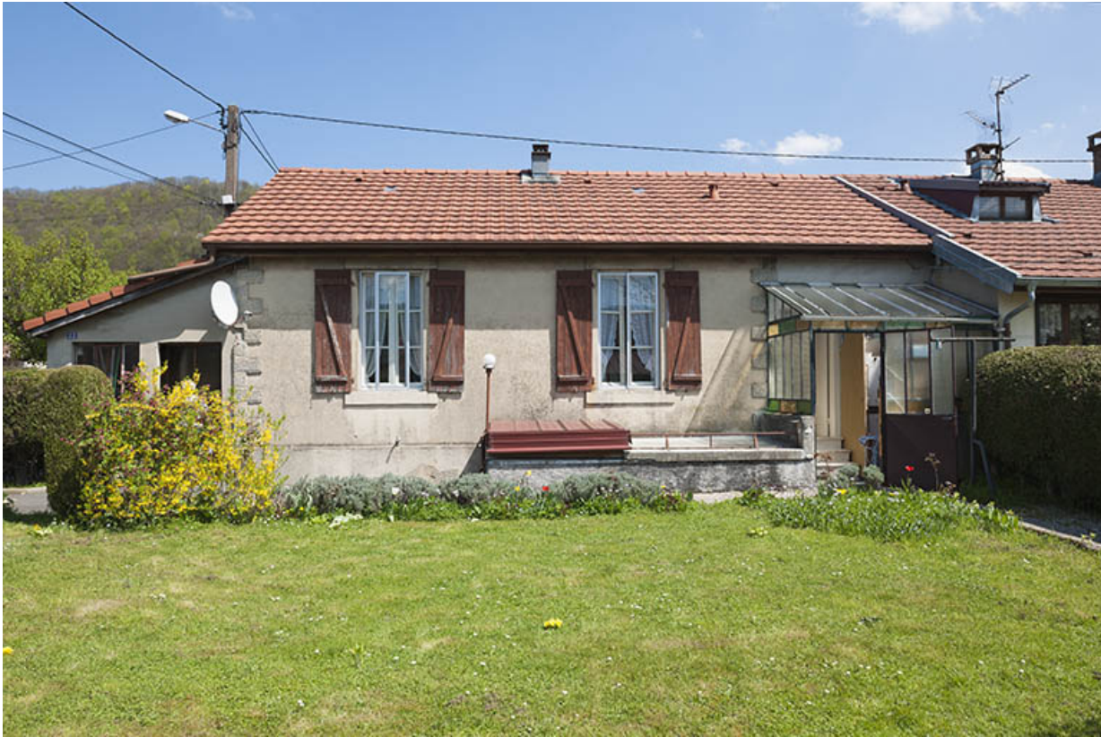
Façade postérieure d'une maison individuelle.