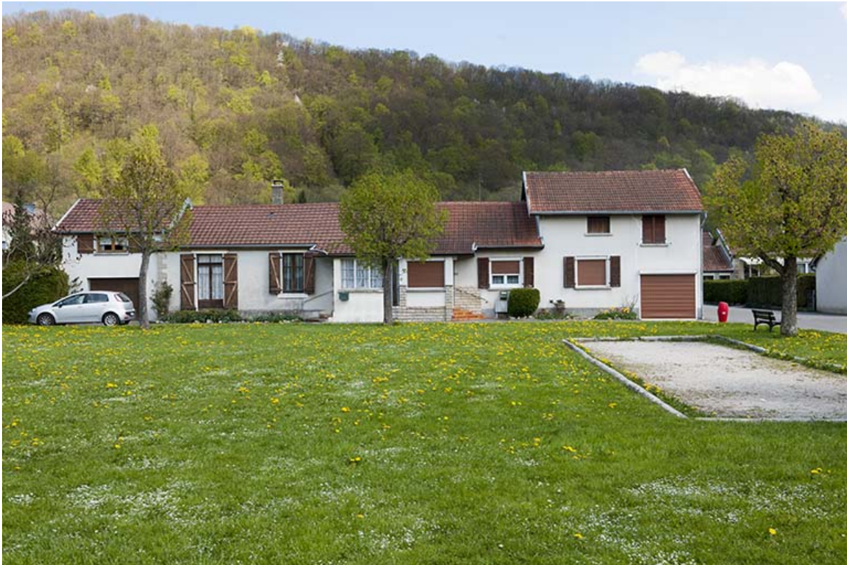
Maisons ouvrières donnant sur la place.