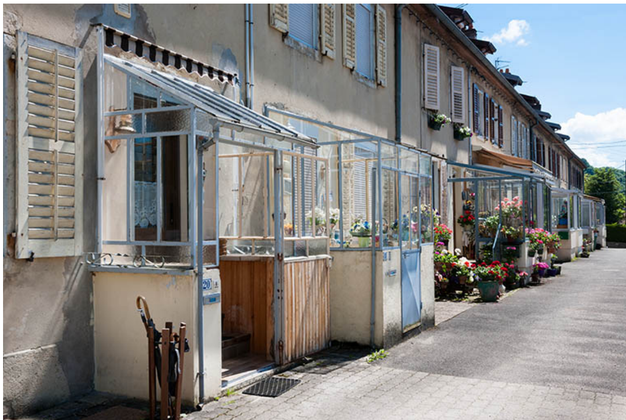
Façade antérieure vue de trois quarts.

25, Pont-de-Roide, 19A rue du général Herr