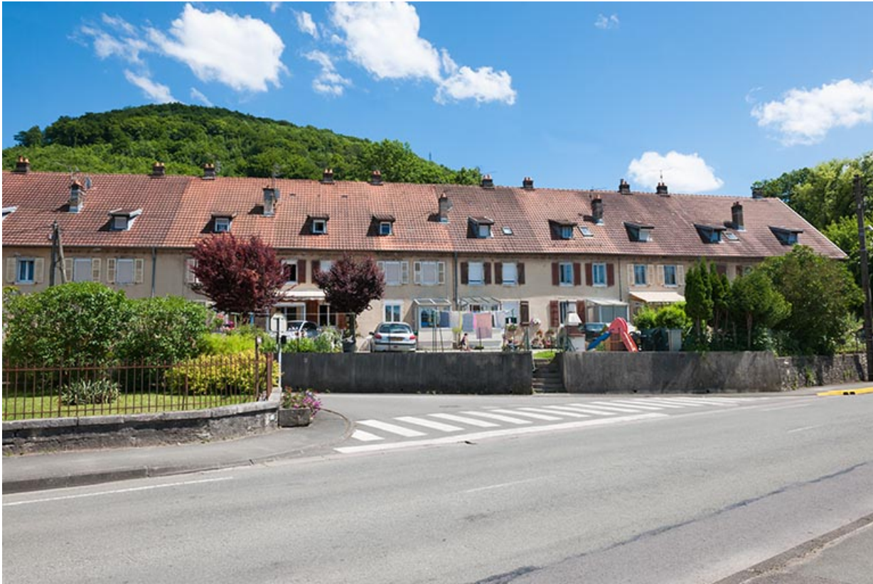
Vue d'ensemble depuis l'ouest.

25, Pont-de-Roide, 19A rue du général Herr