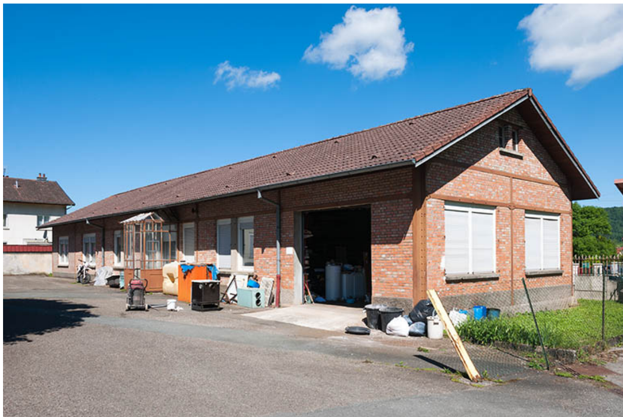
Logements et bureau vus de trois quarts.