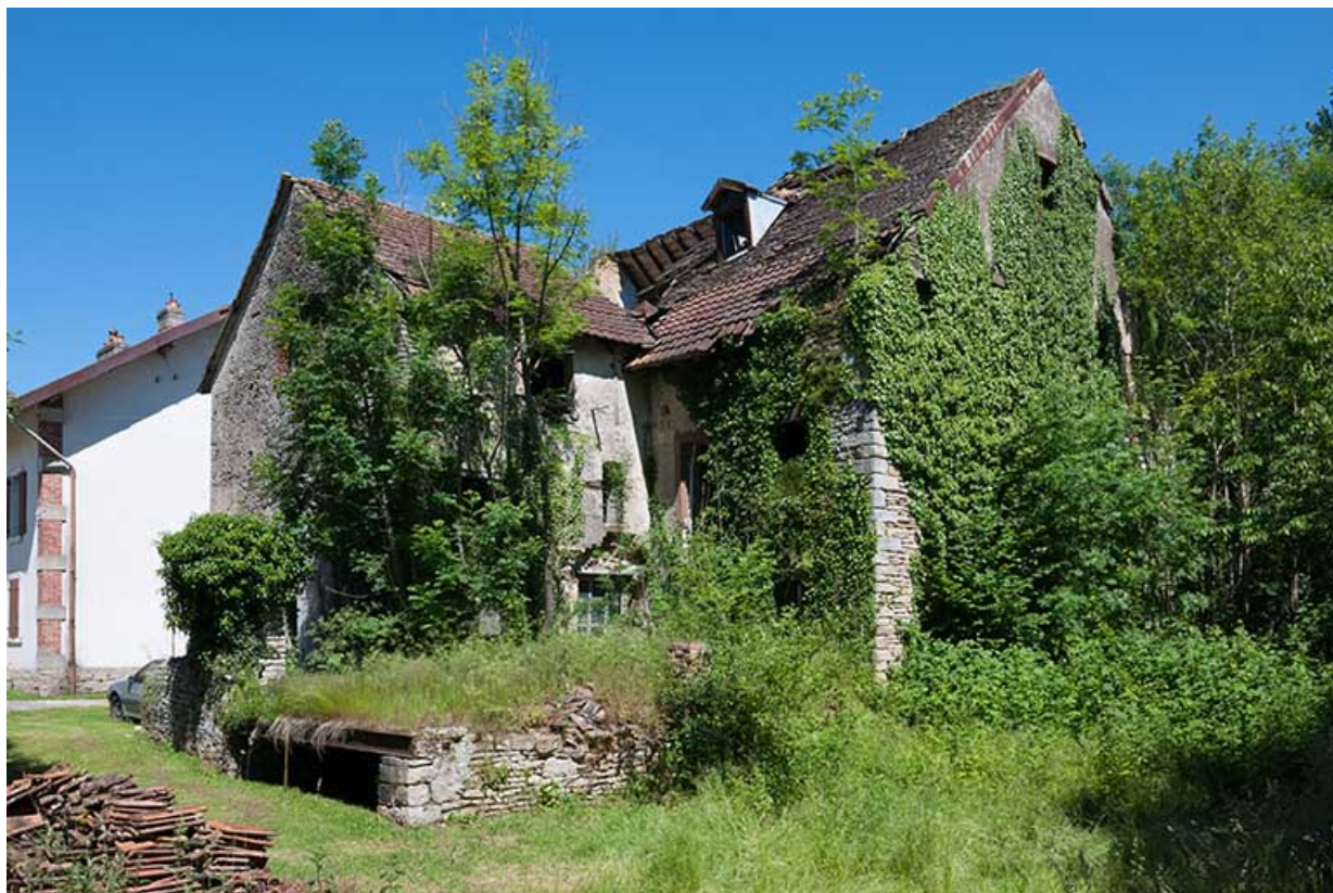
Vestiges du moulin depuis l'île.

25, Dampierre-sur-le-Doubs rue du Moulin