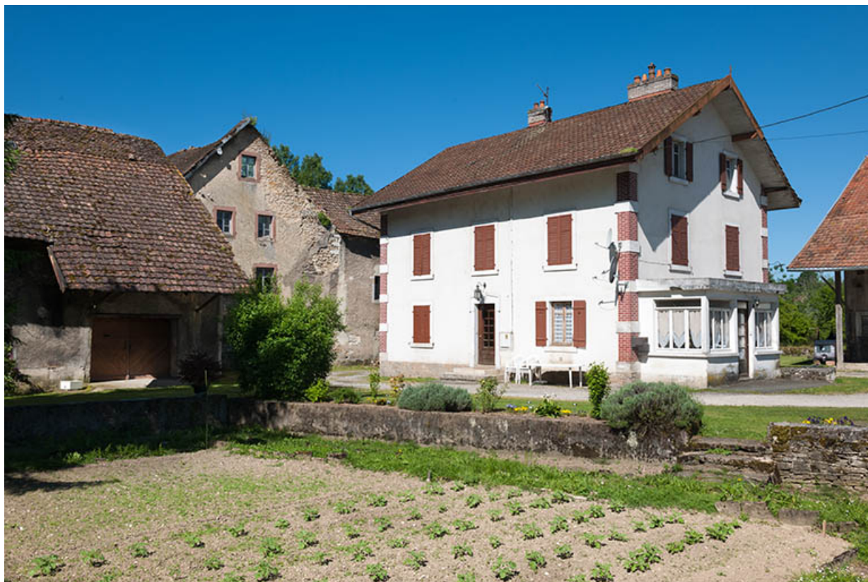
Moulin et logement vus depuis l'est.

25, Dampierre-sur-le-Doubs rue du Moulin