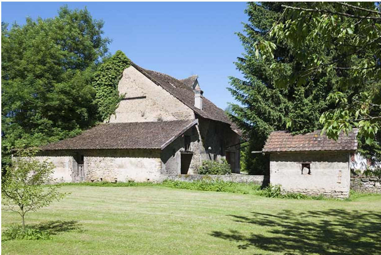
Dépendance vue depuis l'est.

25, Dampierre-sur-le-Doubs rue du Moulin