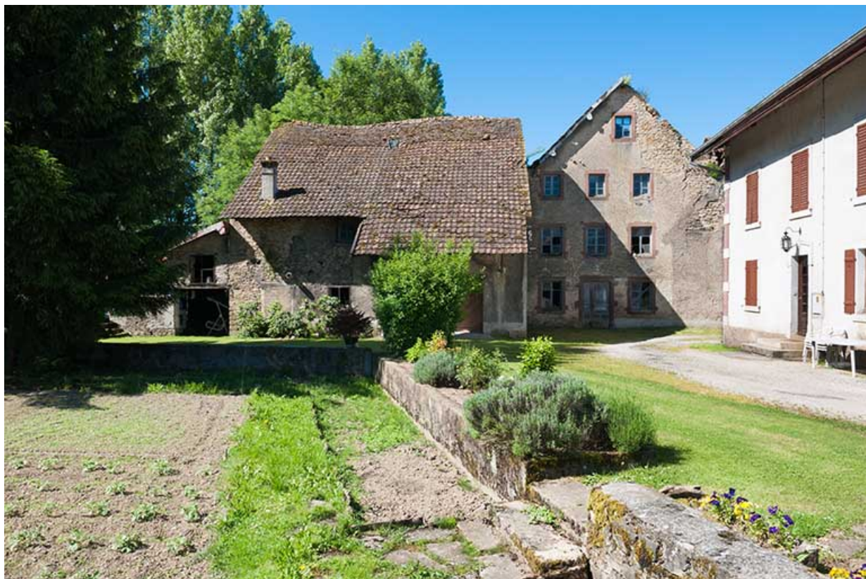
Dépendance et pignon du moulin.

25, Dampierre-sur-le-Doubs rue du Moulin