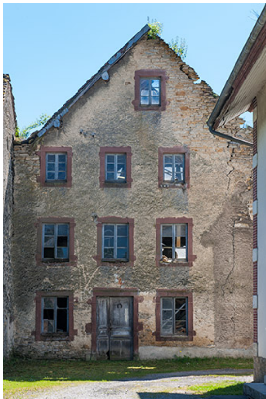
Pignon nord du moulin.

25, Dampierre-sur-le-Doubs rue du Moulin