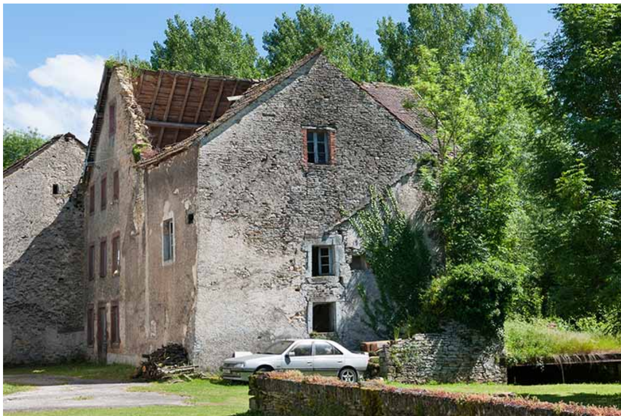
Le moulin depuis le nord-ouest.

25, Dampierre-sur-le-Doubs rue du Moulin