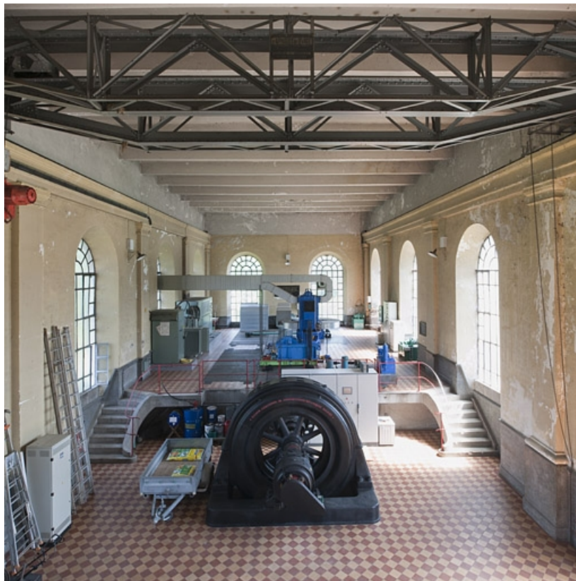
Vue intérieure, depuis le nord-ouest.