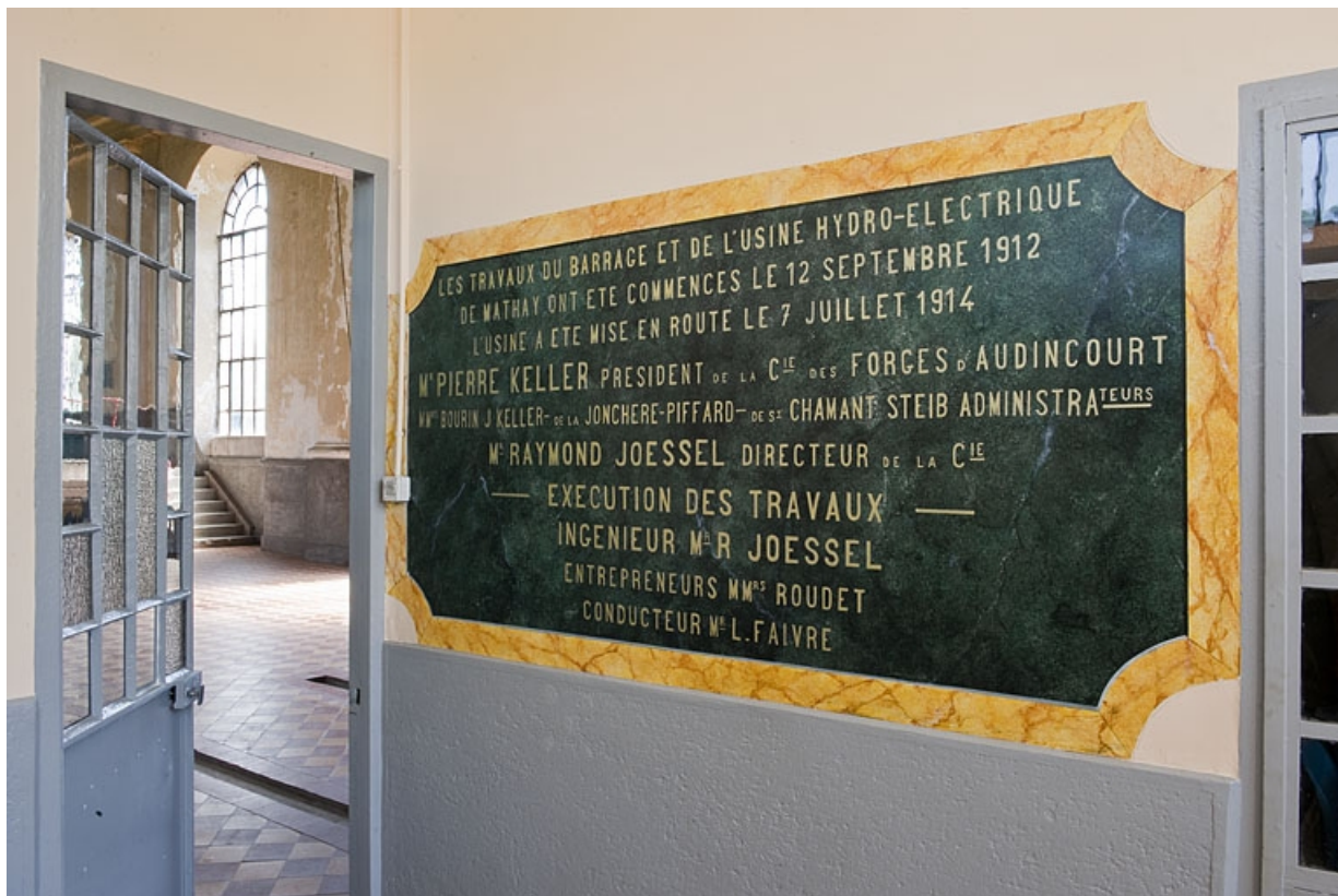
Cartouche-dédicace peint, à l'intérieur du bureau.